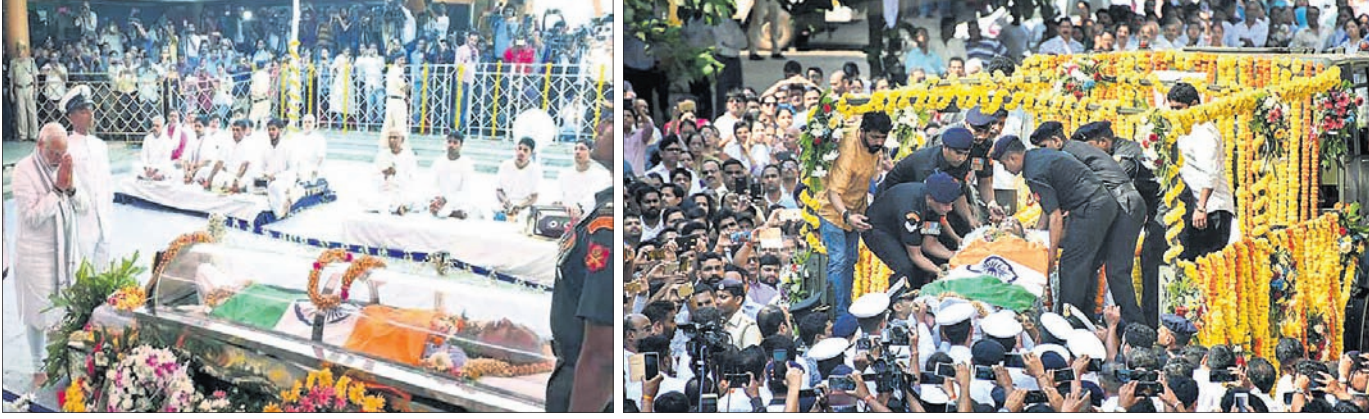
ମନୋହର ପାରିକରଙ୍କୁ ପ୍ରଧାନମନ୍ତ୍ରୀ ନରେନ୍ଦ୍ର ମୋଦି ଶେଷ ସମ୍ମାନ ଜଣାଇଛନ୍ତି । ଅଭିନ ଯାତ୍ରାରେ ପାରିକର ।

କଙ୍ଗୋରେ ଟ୍ରେନ୍ ଲାଇନରୁମ୍ପତ: ୨୪ ମୃତ କିଙ୍ଗସାୟା, ୧୮୩୩(ଏସଏସ୍)-ତେମେଗ୍ରାଟିକ୍ ରିପବ୍ଲିକ୍ ଅଫ୍ କଙ୍ଗୋରେ ଏକ ଟ୍ରେନ୍ ଲାଇନରୁମ୍ପତ ହେବା ଯୋଗୁ ୨୪ଜଣଙ୍କ ମୃତ୍ୟୁ ଘଟିଥିବାବେଳେ ୩୧ଜଣ ଆହତ ହୋଇଛନ୍ତି । ମୃତକଙ୍କ ମଧ୍ୟରେ ଅଧିକାଂଶ ଶିଶୁଥିବା ଯୋଗୁ ଓ ତାଙ୍କୁ ଯେବା ପକ୍ଷରୁ ସୂଚନା ମିଳିଛି । ଟ୍ରେନ୍ଟି ଲୁଚସେ ନଦୀ ସେତୁରେ ଗତି କରୁଥିବାବେଳେ ଅନେକ ଖୁସି ନଦୀକୁ ଖସି ପଡିଥିଲା । ଗୁରୁତର ଆହତଙ୍କୁ ନିକଟସ୍ଥ କାକେଶେ ହସ୍ପିଟାଲକୁ ନିଆଯାଇଛି ।