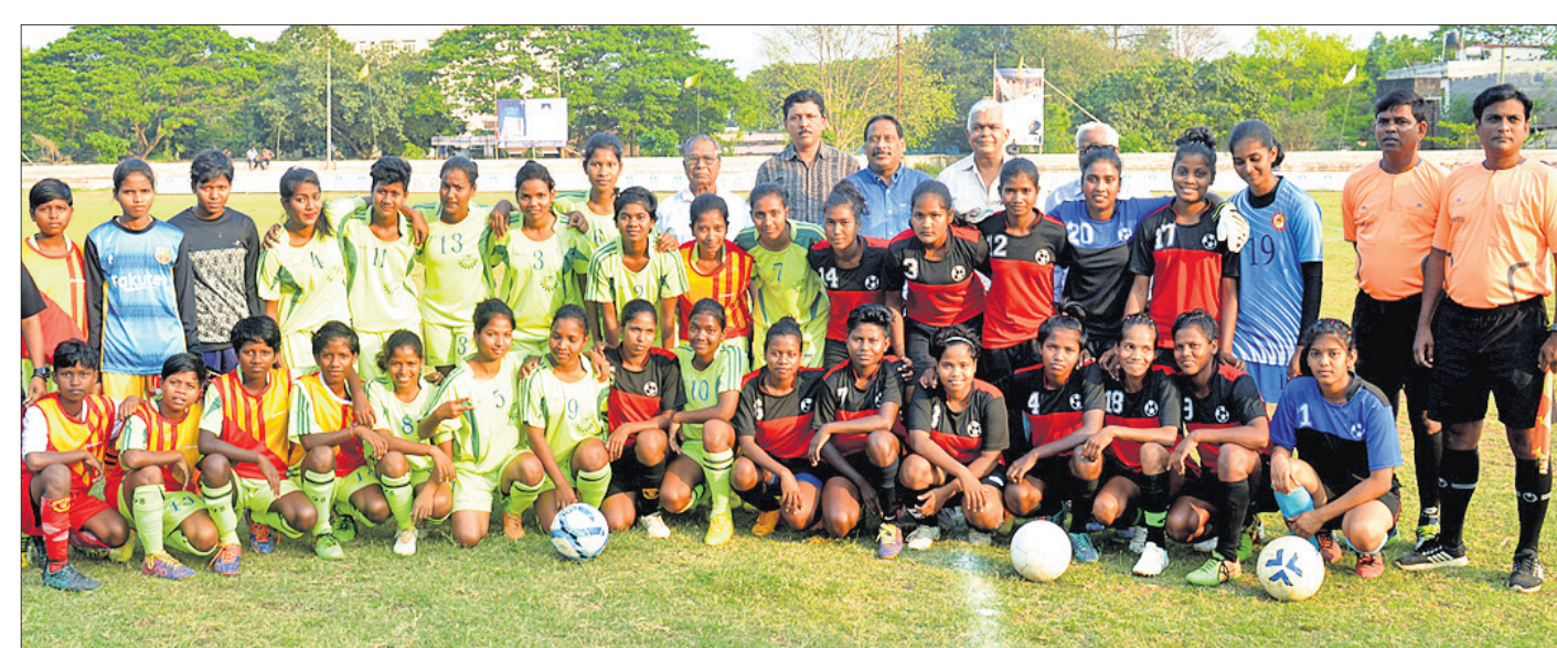
ଅତିଥିକ ଗହଣରେ କିମ୍ ମହିଳା ପୁରୀ ଓ ନୀତା ଅମ୍ଭାନୀ ଟିମ୍‌ର ଖେଳାଳିମାନେ ।