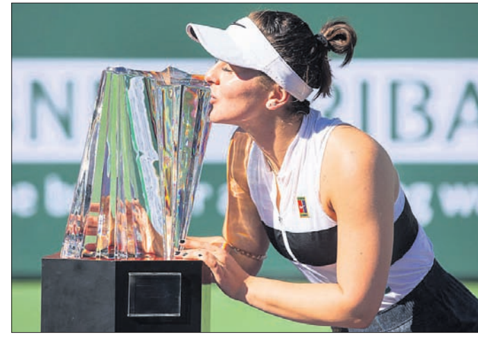
ତ୍ରୁପି ସହ ବାଏଙ୍କା ଆଣ୍ଡ୍ରେୟୁ