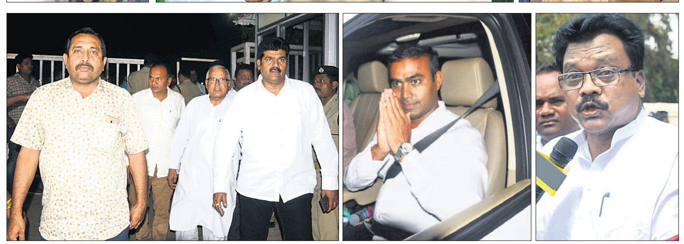
ବିଜେଡି ପକ୍ଷରୁ ପ୍ରାର୍ଥୀ ଚୟନ ପ୍ରକ୍ରିୟା ଜାରି ରହିଥିବା ବେଳେ ସୋମବାର ନବୀନ ନିବାସରେ ଆଶାୟୀ ଓ ନେତାମାନଙ୍କ ଭିଡ଼।