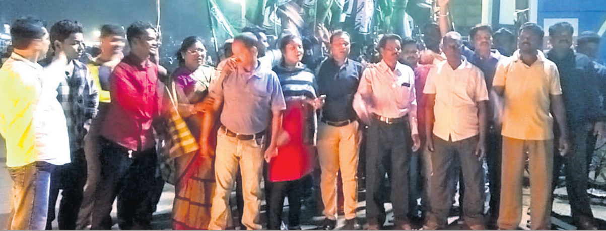
ବିଜେଡି କର୍ମୀମାନେ ପ୍ରତିବାଦ କରୁଛନ୍ତି।