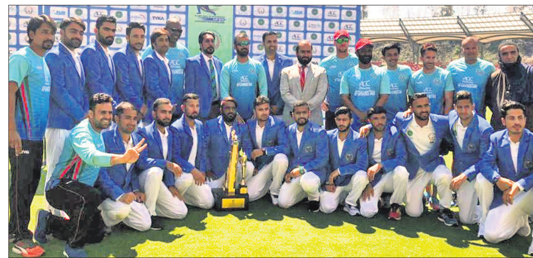
ଚେଷ୍ଟା ସିରିଜ୍ ବିଜୟ ପରେ ଆଫଗାନିସ୍ତାନ କ୍ରିକେଟ ଟିମ୍।

ଚେନ୍ନାଇ, ୧୮ମାର୍ଚ୍ଚ: ଚେଷ୍ଟା କ୍ରିକେଟରେ ନୂଆ କରି ସାମିଲ ହୋଇଥିବା ଆଫଗାନିସ୍ତାନ ଟୀମ୍ ପ୍ରଥମ ବିଜୟ ହାସଲ କରିବା ସହ ଇତିହାସ ସୃଷ୍ଟି କରିଛି।