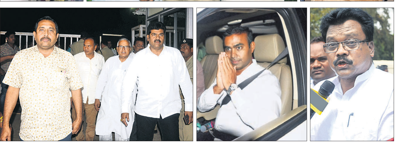
ବିଜେଡି ପକ୍ଷରୁ ପ୍ରାର୍ଥୀ ଚୟନ ପ୍ରକ୍ରିୟା ଜାରି ରହିଥିବା ବେଳେ ସୋମବାର ନବୀନ ନିବାସରେ ଆଶାୟୀ ଓ ନେତାମାନଙ୍କ ଭିଡ଼।