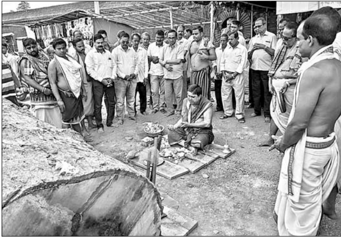
ଭୁବନେଶ୍ୱର ପାଇଁ ଗୋଟା ଅନୁକୂଳ ପୂଜା କରାଯାଇଛି।