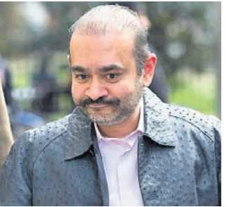
ଲଣ୍ଡନ କୋର୍ଟ ଜାରି କଲେ ଡ୍ୱାରେଝ୍