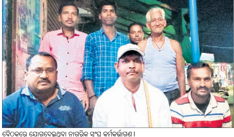
ବୈଠକରେ ଯୋଗଦେଇଥିବା ନାଗରିକ ସଂଘ କର୍ମକର୍ତ୍ତାଗଣ ।

କରିବାକୁ ପରାମର୍ଶ ଦେଇଥିଲେ । କୌଣସି ଦଳର ନେତା ଭୋଟରଙ୍କୁ ପ୍ରଲୋଭିତ କରିଲେ ସେହି ଦଳକୁ ଭୋଟ ନ ଦେବାକୁ କୁହାଯାଇଛି । ଏହି ନିଷ୍ପତ୍ତିକୁ ଶତାଧିକ ଲୋକ ସମର୍ଥନ ଜଣାଇଛନ୍ତି ।