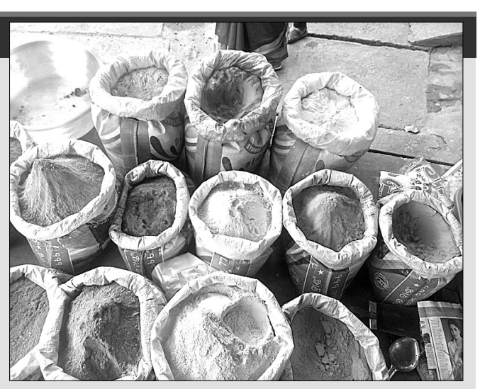
ବଜାରରେ ବିକ୍ରି ହେଉଥିବା ବିଭିନ୍ନ ରଙ୍ଗ।

ଆଉ ଦିନ କେଜା ପରେ ରଙ୍ଗର ପର୍ବ ହୋଇଛି। ଅଭିର ଓ ରଙ୍ଗରେ ଜଣେ ଜଣକୁ ରଙ୍ଗ ଲଗାଇ ମହାଆଡ଼ମ୍ଭରରେ ହୋଲି ପାଳନ କରିବେ। ଏହାକୁ ପାଳନ କରିବା ପାଇଁ ଭାଇଭାଉସୀ ସହର କଟକର ରଜନିକାନ୍ତଠାରୁ ଆରମ୍ଭ କରି ସହରର ଚୌଧୁରୀ ବଜାର, ପିଠାପୁର, ନନ୍ଦି ସାହି, ଦୋଳପୁର, ରାଣାହାଟ ଆଦି ସ୍ଥାନରେ ବିଭିନ୍ନ କିସମର ରଙ୍ଗ ବିକ୍ରି ହେଉଥିବା ଦେଖିବାକୁ ମିଳିଛି। ଏଥର ବଜାରକୁ ଛୋଟ ପିଲାଠାରୁ ଆରମ୍ଭ କରି ବଡ଼ ଲୋକଙ୍କ ପାଇଁ ବିଭିନ୍ନ ପ୍ରକାର ରଙ୍ଗ, କ୍ୟାପ, ପିଟକାରା ବଜାରରେ ମିଳୁଥିବା ବ୍ୟବସାୟୀ କହିଛନ୍ତି। ବିଶେଷ କରି ହର୍ବାଲ ରଙ୍ଗ ସାମ୍ବ୍ୟ ନିମନ୍ତେ ହିତକର ହୋଇଥିବାରୁ ଲୋକେ ଏହାକୁ ବହୁତ କିଣୁଥିବା ବ୍ୟବସାୟୀ କହିଛନ୍ତି। ତେବେ ସେକ୍ସେଟ ରଙ୍ଗର ଚାହିଦା ବହୁତ ରହିଛି। ଲାଲ, ସବୁଜ, ହଳଦିଆ, ଗୋଲାପି ରଙ୍ଗ ଇତ୍ୟାଦି ବିକ୍ରି ହେଉଥିବା