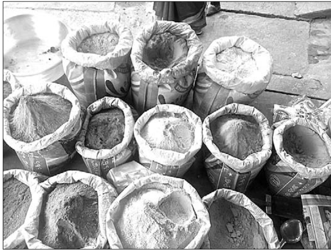
କଟକରେ ବିକ୍ରି ହେଉଥିବା ବିଭିନ୍ନ କିନ୍ଦର ରଙ୍ଗ।

ଅଭିଯାନ ପରେ ରଙ୍ଗର ପର୍ବ ହୋଇଛି। ଅଭିଯାନ ଉପରେ ପାଣିକୁ ଚିକିତ୍ସା କରାଯାଇଛି।