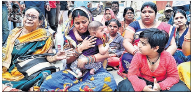
ଚନ୍ଦନଙ୍କ ପରିବାର ସଦସ୍ୟ ଓ ଅନ୍ୟମାନେ ଧାରଣାରେ ବସିଛନ୍ତି।