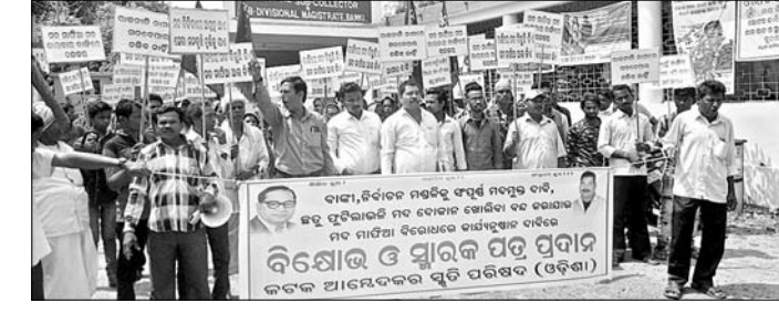
ଉପଜିଲ୍ଲାପାଳଙ୍କ କାର୍ଯ୍ୟାଳୟ ଆଗରେ ଆନ୍ଦୋଳନ ସ୍ମୃତି ପରିଷଦ ସଦସ୍ୟ ବିକ୍ଷୋଭ କରୁଛନ୍ତି।