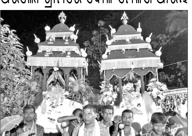
ସୁସଜ୍ଜିତ ବିନାମରେ ଠାକୁର ମେଳଣ ପଡ଼ିଆକୁ ନିଆଯାଇଛି।

ଅଭିଲୋ ଗ୍ରାମରେ ଦୋଳ ମେଳଣ ଆରମ୍ଭ ହେବାରୁ ସେ ଗତ ୧୫ତାରିଖରେ ଏନେଇ ଚାଉଳିଆଗଞ୍ଜ ଥାନାରେ ଅଭିଯୋଗ କରିଥିଲେ।