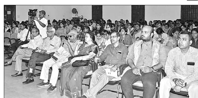
ଆଲୋଚନାଚକ୍ରରେ ଉପସ୍ଥିତ ଅଧ୍ୟାପିକା, ଅଧ୍ୟାପକ ଓ ଛାତ୍ରାଛାତ୍ରୀ।