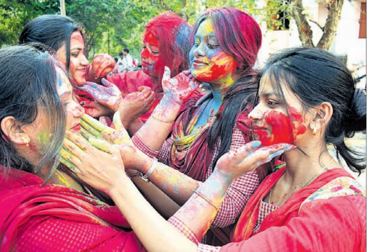
ଭୁବନେଶ୍ୱର ବିକେଟ କଲେଜ ପରିସରରେ ମଙ୍ଗଳବାର ଛାତ୍ରୀମାନେ ସରଳ ଯିବା ପୂର୍ବରୁ ଅଭିରରେ ହୋଇ ଖେଳୁଛନ୍ତି।