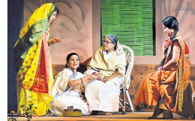
ମିର ଅନୁଷ୍ଠାନ ପକ୍ଷରୁ ଭୁବନେଶ୍ୱର ଭଜନକଳା ମଣ୍ଡପରେ ମଙ୍ଗଳବାର ପରିବେଷିତ ନାଟକ 'କାନ୍ଦମାଷ୍ଟ୍ରେ'ର ଏକ ଦୃଶ୍ୟ।