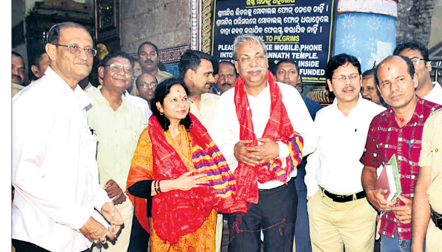
ଓଡ଼ିଶାର ଲୋକାୟୁର୍ବ ଅଧ୍ୟକ୍ଷ ଅତିବିମ୍ବ ମଙ୍ଗଳବାର ଶ୍ରୀଜୀଉଙ୍କୁ ଦର୍ଶନ ସାରି ଶ୍ରୀମନ୍ଦିରକୁ ବାହାରୁଛନ୍ତି।