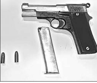
ଅନୁଯାୟୀ, ମଙ୍ଗଳବାର ସନ୍ଧ୍ୟା ପ୍ରାୟ ୭ଟାରେ ଉକ୍ତ ଥାନା ଅନ୍ତର୍ଗତ ଏକ ଘରୋଇ ଜନଞ୍ଜିନିୟର କଲେଜ ପାଖରେ ଜଣେ ମୁଦକ ବନ୍ଧୁକ ରଖିଥିବା ବେଳେ ପୋଲିସ୍ ସୂଚନା ପାଇଥିଲା।

ବେଆଇନ ବନ୍ଧୁକ ରଖିବା ଅଭିଯୋଗରେ ମନୁଷ୍ୟର ଗଣତନ୍ତ୍ର ପୋଲିସ୍ ମଙ୍ଗଳବାର ଜଣେ ଗିରଫ କରି କୋର୍ଟ ଚାଲାଣ କରିଛି।