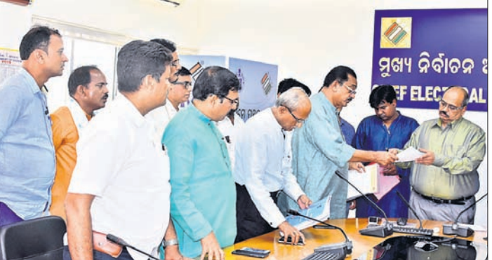
ବିଜେଡି ପକ୍ଷରୁ ନିର୍ବାଚନ କମିଶନଙ୍କୁ ଦାବିପତ୍ର ପ୍ରଦାନ କରାଯାଇଥିବା ବେଳେ ଅନୁପ୍ରଭାବେ ଭାଜପା ପକ୍ଷରୁ ମଧ୍ୟ ଦାବିପତ୍ର ପ୍ରଦାନ କରାଯାଇଛି ।