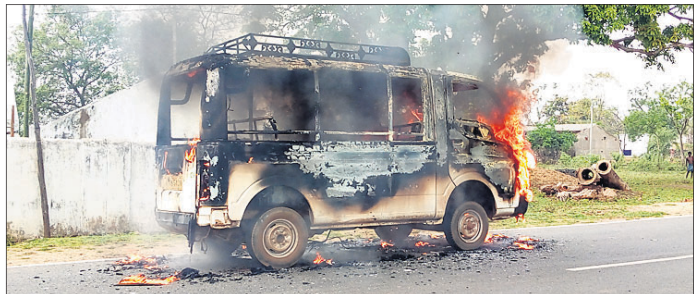
ଜାତୀୟ ରାଜପଥରେ ଜଳୁଥିବା ସ୍କୁଲ ଭ୍ୟାନ ।

ପାଟଣା, ୧୯୩୩(ସି.ପି.) କେନ୍ଦ୍ରରେ ଜିଲା ପାଟଣା ନିକଟସ୍ଥ ୨୨୦ନଂ ଜାତୀୟ ରାଜପଥର ଧାନବେଣୀ ନିକଟରେ ମଙ୍ଗଳବାର ୧୧ ଛାତ୍ରୀଛାତ୍ରଙ୍କୁ ନେଇ ଯାଉଥିବା ଏକ ଘରୋଇ ଟାଟା ମ୍ୟାଜିକରେ ଦିନ ସାଢ଼େ ୧୨ଟାରେ ଅତ୍ୟନ୍ତ ଦ୍ରୁତ ଗତିରେ ଚଳୁଥିବା ସ୍କୁଲ ଭ୍ୟାନଟି ଚଳିଯାଇଛି । ତେବେ