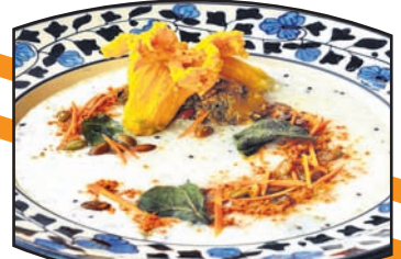
ସମ୍ବିତା ପାଳକରାୟ ଭୁବନେଶ୍ୱର, ୧୯୩୩(ବୁଧବୋ)

ଗାଁଠୁ ସହର ପର୍ଯ୍ୟନ୍ତ, ଝୁମୁଡ଼ିବୁ ତାରକା ହୋଟେଲ ଯାଏ। 'ପଖାଳ' କେବଳ ଏକ ନିଦିନିଆ ଖାଦ୍ୟ ନୁହେଁ, ବରଂ ଓଡ଼ିଆଙ୍କ ମନ ଓ ହୃଦୟ ସହ ଜଡ଼ିତ ଏକ ଭାବପ୍ରବଣତା। ପ୍ରତି ପରିବାରକୁ ଓ ପ୍ରତି ମନକୁ ଯୌଥ ସୂତ୍ରରେ ଯୋଡ଼ି ଧରିବାର ଏକ ମାଧ୍ୟମ। ଓଡ଼ିଆ ଜନଜୀବନ