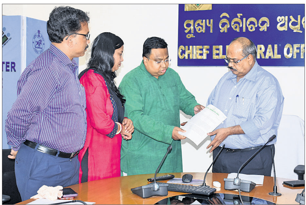
କେନ୍ଦ୍ର ସରକାରଙ୍କ ହୋର୍ଟିଂ ହଟାଯାଇ ପାଇଁ ବିଜେଡି କର୍ମକର୍ତ୍ତାମାନେ ନିର୍ବାଚନ କମିଶନଙ୍କୁ ଦାବିପତ୍ର ପ୍ରଦାନ କରୁଛନ୍ତି।

ନିର୍ବାଚନ ଯେତିକି ପାଖେଇ ଆସୁଛି ରାଜନୈତିକ ଦଳଗୁଡ଼ିକ ମଧ୍ୟରେ ଆରୋପ ପ୍ରତ୍ୟାରୋପ ସେତିକି ଜୋର ଧରୁଛି। ରାଜ୍ୟରେ ନିର୍ବାଚନ ଆଦର୍ଶ ଆଚରଣବିଧି ଲାଗୁ ହେବା ପରଠାରୁ ବିଜେଡି, ଭାଜପା ଓ କଂଗ୍ରେସ ପରସ୍ପର ବିରୋଧରେ ରାଜ୍ୟ ମୁଖ୍ୟ ନିର୍ବାଚନ ଅଧିକାରୀଙ୍କ ନିକଟରେ ଫେରାଦ ହେଉଛନ୍ତି। ପ୍ରତ୍ୟେକ ଦିନ ଆଦର୍ଶ ଅଚରଣ ବିଧି ଉଲ୍ଲଙ୍ଘନ ଭଳି ଆରୋପ ପ୍ରତ୍ୟାରୋପ ଗାରି ରହିଛି। ଏଥିରେ ବିଜେଡି ଓ ଭାଜପା ଆଗରେ ରହିଥିବା ବେଳେ କଂଗ୍ରେସ ବିଜେ ପଛରେ ପଡ଼ିଛି। ରୁଧିର ମଧ୍ୟ ଉଭୟ ବିଜେଡି ଓ ଭାଜପା ପରସ୍ପର ବିରୋଧରେ ସକ୍ରିୟ ଅଭିଯୋଗ ଆଣିଛନ୍ତି। ଏ ନେଇ ରାଜ୍ୟ ନିର୍ବାଚନ ଅଧିକାରୀଙ୍କୁ ଭେଟି ଦୃଢ଼ ପଦକ୍ଷେପ ଦାବି କରିଛନ୍ତି।