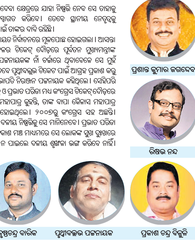
ପ୍ରଶାନ୍ତ କୁମାର ଜଗଦେବ ବିଷୟ ନୟ ବିକଳ ନୟ ପ୍ରକାଶ ଚନ୍ଦ୍ର ବିକ୍ଳି