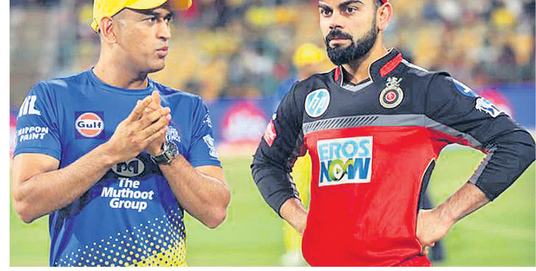
ମହେନ୍ଦ୍ର ସିଂ ଯୋନୀ ଓ ବିରାଟ କୋହଲି।