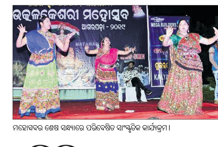
ମହୋତ୍ସବର ଶେଷ ସନ୍ଧ୍ୟାରେ ପରିବେଷିତ ସାଂସ୍କୃତିକ କାର୍ଯ୍ୟକ୍ରମ।

ଭଦ୍ରକ ଜିଲ୍ଲା ଆଗରପଡ଼ା ହେମପଦ୍ମ ଗାଳ୍ପିକ ପରିସରରେ ୯ଦିନ ଧରି ଚାଲିଥିବା ୪ର୍ଥ ବାର୍ଷିକ ଉତ୍ତମକେଶରୀ ଆଗରପଡ଼ା ମହୋତ୍ସବ ଉତ୍ସାହିତ ହୋଇଯାଇଛି। ଉତ୍ସାହୀନ ସମ୍ପାଦକ ପରିବେଷିତ ରାଜସ୍ଥାନୀ ଫକ୍ ଦୀପ୍ତ କେନ୍ଦ୍ରରେ ପହଞ୍ଚି ଭୋଟ ଦେଇପାରି ପୁରୁଷ୍କୃତରେ ଘରକୁ ଫେରିବେ ସେନେଇ ପ୍ରଶାସନ ପକ୍ଷରୁ ମାଷ୍ଟରପ୍ଲାନ ପ୍ରସ୍ତୁତ ହୋଇସାରିଛି। ଦିବ୍ୟାଙ୍ଗ ଭୋଟରଙ୍କୁ ଭୋଟଗ୍ରହଣ କେନ୍ଦ୍ରରେ ଏନ୍‌ସିସି କ୍ୟାଡେଟ ସହଯୋଗ କରିବେ ବୋଲି ସ୍ଥିର ହୋଇଛି।