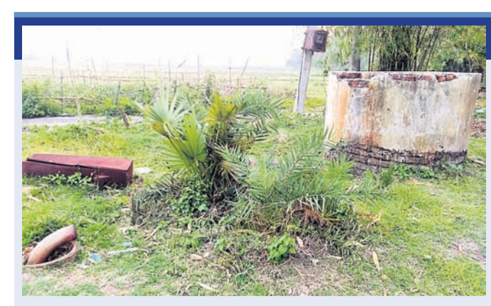
ବାସୁଦେବପୁରର ଏକ ଅଚଳ ଜଳସେଚନ ପ୍ରକଳ୍ପ।

ପଢ଼ୁଛି। ବାସୁଦେବପୁର ବ୍ଲକରେ ଲକ୍ଷ୍ମକୋଷ୍ଠ କେନାଲ ପୁଲ୍‌ସ୍ ଗେଟ୍ ହୋଇପାରେ ନ ଥିବାରୁ ମଧୁର ଜଳ ସଂରକ୍ଷଣ କରାଯାଇ ଜଳସେଚନ କରାଯାଇପାରେ ନାହିଁ। ସେହିଭଳି ତିହିଡ଼ି ବ୍ଲକରେ ଜଳସେଚନ ସମସ୍ୟା ଗଢ଼ାଏ ପରିସ୍ଥିତି ସୃଷ୍ଟି କରିଛି। ବ୍ଲକରେ ମୋଟ ୨୨.୬୮୩ ହେକ୍ଟର ଜମିରୁ ଜଳସେଚନ ବ୍ୟବସ୍ଥା ସାମିତି ରହିଛି। ଏହି ଯୋଜନା ଜିଲ୍ଲାରେ କାର୍ଯ୍ୟକାରୀ ହୋଇପାରେ ନାହିଁ। ପାରମ୍ପରିକ ଜଳସେଚନ ଉପରେ ନିର୍ଭର କରି ଗାଷୀ ହ୍ରାସପାଇଁ ହେଉଛନ୍ତି। ଜିଲ୍ଲାର ପ୍ରମୁଖ ଜଳସେଚନ ଉପରେ କୁହାଯାଉଥିବା ସାକନ୍ଦୀ ପ୍ରକଳ୍ପ ୧୦ ବର୍ଷ ଧରି ମରାମତି ଚାଲିଥିବାରୁ ରବି ବିଭିନ୍ନ ଗ୍ଲାମରେ ଜଳସେଚନ ପ୍ରକଳ୍ପ ଦୀର୍ଘବର୍ଷ ଧରି ଅଚଳ ହୋଇ ପଡ଼ିରହିଥିଲେ ମଧ୍ୟ ମରାମତି କରାଯାଇ ନ ଥିବା ଅଭିଯୋଗ ହେଉଛି। କେବଳ ଖରାଦିନ ଆସିଲେ କାରଗଜକଲମରେ ପ୍ରକଳ୍ପରୁ ଜଳ ମରାମତି ହେଉଥିବା ଦର୍ଶାଇ ଲକ୍ଷ୍ୟାଧାରୀ ଗାଷୀର ବିଭିନ୍ନ ସ୍ତରକୁ ହୋଇପାରେ ନାହିଁ। ରବି ଗାଷୀର ବିଭିନ୍ନ ସ୍ତରକୁ ହୋଇପାରେ ନାହିଁ।