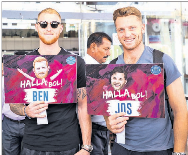
କୋଲକାତା ନାଇଟ ରାଇଡର୍ସର ଆନ୍ଦ୍ରେ ରସେଲ ଓ ସୁନୀଲ ନାରିନଙ୍କ ଅଭ୍ୟାସ। ଏକ କାର୍ଯ୍ୟକ୍ରମ ଅବସରରେ ଚେନ୍ନାଇ ସୁପରକିଙ୍ଗ୍ ଖେଳାଳି କେଦାର ଯାଦବ ଓ ମୁଖ୍ୟ କୋଚ୍ ସ୍ଟିଫେନ୍ ଫ୍ଲୋର୍। ରାଜସ୍ଥାନ ରୟାଲ୍ସ ଦଳରେ ଯୋଗ ଦେବାପାଇଁ ପହଞ୍ଚିଛନ୍ତି ବେନ୍ ଷ୍ଟୋକ୍ସ ଓ କୋର୍ସ୍ ବଟଲର।