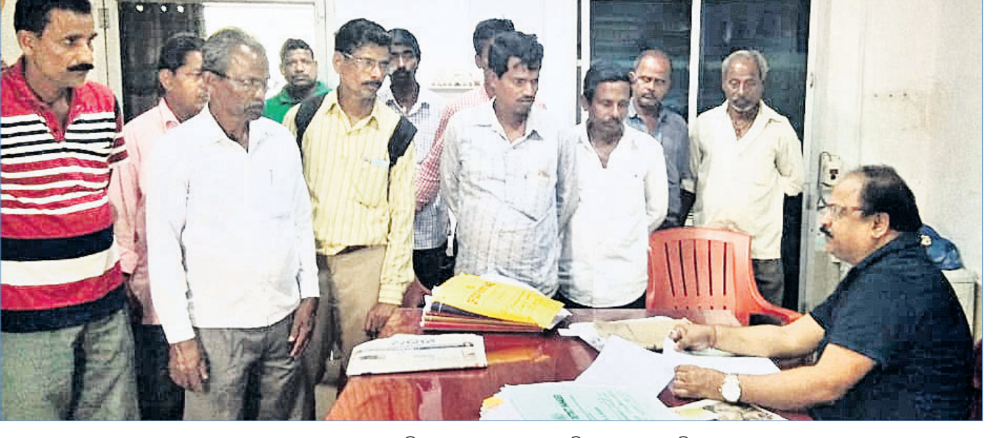
ରୁଧିବାର ଗଠନାମାରେ ଜିଲ୍ଲା ଯୋଗାଣ ଅଧିକାରୀଙ୍କୁ ଦାବିପତ୍ର ପ୍ରଦାନ କରୁଛନ୍ତି।

କର୍ମଚାରୀଙ୍କ ମଧ୍ୟରୁ ୫୧ କର୍ମଚାରୀ ଥିବାରୁ ଜିଲ୍ଲାରେ ବୃଦ୍ଧି ପାଇଥିବା ଚୋରା ମଦ କାରବାରକୁ ରୋକିବା ସମ୍ଭବ ହୋଇ ପାରୁ ନ ଥିବା ବିଭାଗ ପକ୍ଷରୁ କୁହାଯାଇଛି। ଉଲ୍ଲେଖନୀୟ ଯେ, ଜିଲ୍ଲାରେ ସରକାରୀ ମଞ୍ଜୁରୀପ୍ରାପ୍ତ ୫୦ ଠିକ୍ ବନ୍ଦ ବିଦେଶୀ ମଦବୋକାନ, ୧୬ ଠିକ୍ ଖୋଲା ବିଦେଶୀ ମଦବୋକାନ ଏବଂ ୨୪ ଦେଶୀ ଆସିଥିବା ମଦ ବୋକାନ ରହିଛି। ସ୍ୱୀକୃତିପ୍ରାପ୍ତ ମଦ ବୋକାନ ବ୍ୟତୀତ ଜିଲ୍ଲାରେ ଏକ ହଜାରରୁ ବହୁ ଉର୍ଦ୍ଧ୍ୱ ସ୍ଥାନରେ ଚୋରା ବିଦେଶୀ ମଦବୋକାନ ଚାଲୁଥିବା ବେସରକାରୀ