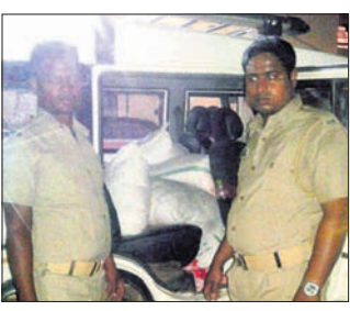
ଭଦ୍ରକ ଅଫିସ, ୨୦୧୩: ଭଦ୍ରକ ପୁରୁଣାବଜାର ଥାନା ପୋଲିସ ମଙ୍ଗଳବାର ଦିନସିତ ରାତିରେ ମିଳିଥିବା ଛକରୁ ୧ ହଜାର ଲିଟର ବେଣା ମଦ ବୋହେଇ ଏକ ବୋଲେରୋ ଜବତ କରିଛି। ଘଟଣାସ୍ଥଳକୁ ଡ୍ରାଇଭର ଫେରାର ହୋଇଯାଇଥିବା ସୂଚନା ଦେଇଛି। ଏହି ମଦ ପୁରୁଣା ବାଲେଶ୍ୱର ଅଞ୍ଚଳରୁ ଭଦ୍ରକକୁ ବାଲେଶ୍ୱର ହେଉଥିବା ଖବର ପାଇ ପୋଲିସ ଚଢ଼ାଉ କରିଥିଲା। ଏ ନେଇ ଥାନାରେ ଗାଡ଼ି ମାଲିକଙ୍କ ବିଚାରାଳୟ ଏକ ମାମଲା (ନଂ.୫୬/୧୯) ରୁଜୁ କରାଯାଇଛି।