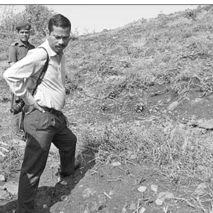
ଲଣ୍ଡା ପାହାଡ଼ରେ ବୃକ୍ଷ ଚାଙ୍ଗରା ରୋପଣ ଅନୁଧ୍ୟାନ କରୁଛନ୍ତି ଡିଏସ୍ ଓ।