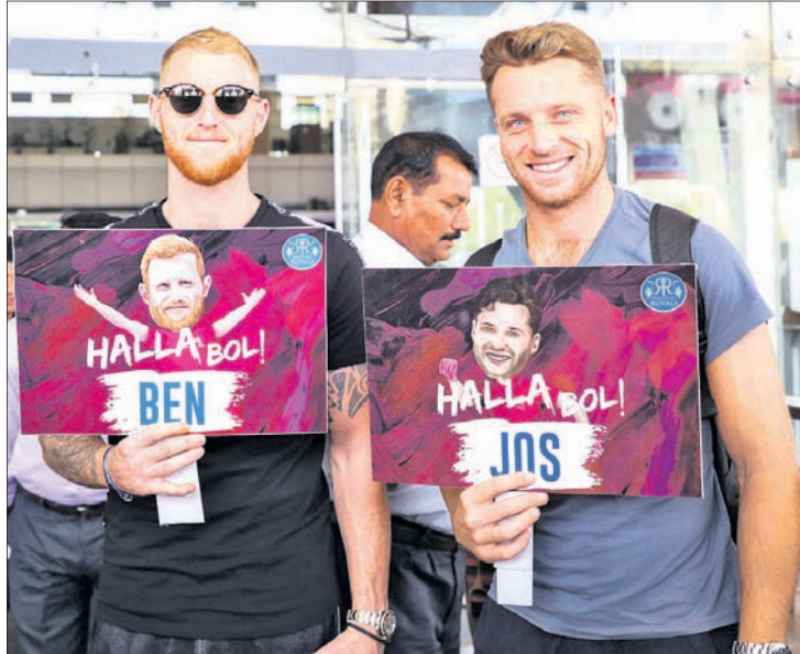
କୋଲକାତା ନାଇଟ ରାଇଡର୍ସର ଆନ୍ଦ୍ରେ ରସେଲ ଓ ସୁନାଲ ନାରିନଙ୍କ ଅଭ୍ୟାସ। ଏକ କାର୍ଯ୍ୟକ୍ରମ ଅବସରରେ ଚେନ୍ନାଇ ସୁପରକିଙ୍ଗ୍ ଖେଳାଳି କେଦାର ଯାଦବ ଓ ମୁଖ୍ୟ କୋଚ୍ ସ୍ଟିଫେନ୍ ଫ୍ଲେମିଂ। ରାଜସ୍ଥାନ ରୟାଲ୍ସ ଦଳରେ ଯୋଗ ଦେବାପାଇଁ ପହଞ୍ଚିଛନ୍ତି ବେନ୍ ଷ୍ଟୋକ୍ସ ଓ କୋର୍ସ୍ ବଟଲର।