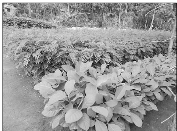
କେନ୍ଦ୍ରୀୟ ନର୍ସରିରେ ପ୍ରସ୍ତୁତ ଚାଙ୍ଗରା।

ସରକାରୀ ନୟପତ୍ରରେ ଦିଗପହଣ୍ଡି ବନାଞ୍ଚଳ ପରିମାଣ ଯାହା ଦଶାଧାରୁ, ପ୍ରକୃତରେ କିନ୍ତୁ ସେହି ଆକାରରେ ଜଙ୍ଗଲ ନାହିଁ। ଚାଙ୍ଗରା ଭୂଇଁରେ ସରକାରୀ ଜଙ୍ଗଲ ଫଳକ ଖୁଲୁଛି। କେଉଁଠି ଜଙ୍ଗଲ ଜମିରେ ଥିବା ପାହାଡ଼ ପର୍ବତରେ ବେଆଇନ ପଥରକାଠି କରାଯାଇଛି ତ, କେଉଁଠି ଜଙ୍ଗଲ ସଫା ହୋଇ ସେଠାରେ ଜଗତାଟି ଓ କୁସର ଗଢ଼ି ଉଠିଛି। ଜଙ୍ଗଲ ଜମି ଜବରଦଖାଲ କରି ବେଆଇନ ଫାର୍ମ ହାଉସ କରାଯାଇଥିବା ବେଳେ ଅନ୍ୟ କେଉଁଠି ଅତୀତକାଳୀନ ଗଢ଼ି ଉଠିଛି। ଏଭଳି ସ୍ଥିତିରେ ଦିଗପହଣ୍ଡି ବନାଞ୍ଚଳ ଅଧୀନ ଗାଳୁଡ଼ିଦେଲ, ଗାଲଡ଼ା, କୋରାଣିମାଳ, ଧାନ୍ୟାଗାଁଆ, ରତନେଲ, ପୁଟଖାଲ, ରତନେଲ-ପାଟପୁର ଓ ରତନେଲ-ଗାଳୁଡ଼ିଦେଲ ରେଖାଙ୍କିତ ସଂରକ୍ଷିତ ଜଙ୍ଗଲକୁ ସୁରକ୍ଷା ଦେବା ଏବେ ଏକ ଆହ୍ୱାନ ପାଲଟିଛି। ୨୦୦୩ ଅକ୍ଟୋବର ୧ରେ ୨,୨,୯୩୯.୦ ହେକ୍ଟର ଜଙ୍ଗଲ ଅଞ୍ଚଳକୁ ନେଇ ଦିଗପହଣ୍ଡି ବନାଞ୍ଚଳ ଘୋଷଣା କରାଯାଇଥିଲା। ଗାଲଡ଼ା ଜଙ୍ଗଲର ୮ ହକ୍ଟର ହେକ୍ଟର, କୋରାଣିମାଳର ୫୯୬୫ ହେକ୍ଟର, ଧାନ୍ୟାଗାଁଆର ୧୧୮୫ ହେକ୍ଟର, ଗାଳୁଡ଼ିଦେଲ ୯୮୫ ହେକ୍ଟର, ରତନେଲ ପାଟପୁରର ୩୫୯୫ ହେକ୍ଟର, ପୁଟଖାଲର ୯୦୫ ହେକ୍ଟର ଓ ରତନେଲ-ଗାଳୁଡ଼ିଦେଲ ସଂରକ୍ଷିତ ଜଙ୍ଗଲର ୨୩୧୯.୦୨ ହେକ୍ଟର ଜମି ରହିଛି। ବନ୍ୟପ୍ରାଣୀଙ୍କ ସୁରକ୍ଷା ନିମନ୍ତେ ୪ ଫରସ୍ତ ସେକ୍ସ ଅଧୀନରେ ୧୬ ଫରସ୍ତ ବିନ୍ଦୁ ପ୍ରତିଷ୍ଠା କରାଯାଇଛି। ଦିଗପହଣ୍ଡି ସେକ୍ସ ଅଧୀନରେ କଲ୍ୟାଣପୁର, ଘୋଡ଼ାହାଡ଼,