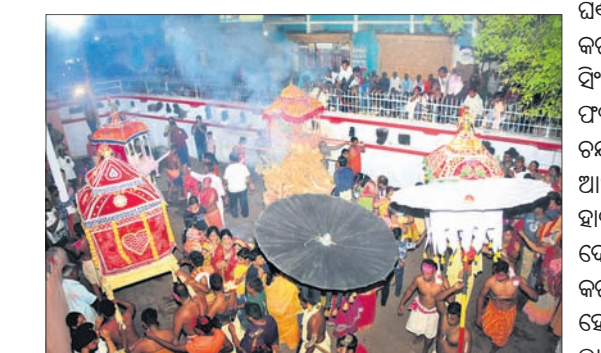
ଅଗ୍ନିଘର ଚତୁର୍ଦ୍ଦିଗରେ ଠାକୁର ପ୍ରଦକ୍ଷିଣ କରୁଛନ୍ତି। ବିରାଜିତ ଚତୁର୍ଦ୍ଦିଗ୍ରହଙ୍କ ସୁନାବେଶ ଅନୁଷ୍ଠିତ ହେବ। ବୁଧବାର ଶ୍ରୀମନ୍ଦିରରେ ବିପ୍ରହର ଧୂପ ସରିବା ପରେ ତିନି ବାତରେ ମଇଳମ ହୋଇଥିଲା। ପାଳିଆ ମେଳାପ ଉତ୍ସାହରୁ ଚନ୍ଦନ ବିକେ କରାଇବା ପରେ ପୁଷ୍ପାଳକ ସେବକ ସର୍ବାଙ୍ଗ ଲାଗି କରାଇଥିଲେ। ଏହାପରେ ଚାଟେରୀ ବେଶ ନିମନ୍ତେ ଶ୍ରୀଦେବୀ, ଭୃଦେବୀ ଦକ୍ଷିଣା

ଫାଲ୍‌ଗୁନ ଶୁକ୍ଳ ଚତୁର୍ଦ୍ଦଶୀ ତିଥିରେ ବୁଧବାର ମହାପ୍ରଭୁଙ୍କ ଅଗ୍ନି ଉତ୍ସବ ନାତି ସମ୍ପର୍କ ହୋଇଛି। ଏହି ଉତ୍ସବକୁ ମେଣ୍ଟାପୋଡ଼ି ନାତି କୁହାଯାଏ। ଏହି ଅବସରରେ ଠାକୁରଙ୍କ ଦର୍ଶନ ଲାଗି ବୋଳବେଦିରେ ଶ୍ରଦ୍ଧାଳୁଙ୍କ ପ୍ରବଳ ସମାଗମ ହୋଇଥିଲା। ଗୁରୁବାର ପବିତ୍ର ବୋଳପୂର୍ଣ୍ଣିମା। ଶ୍ରୀମନ୍ଦିରରେ ରତ୍ନସିଂହାସନରେ ପୂଜା ପଡ଼ିଥିବା ଖଟଗଣେୟ ଉପରକୁ ବିକେ କରିଥିଲେ। ତିନି ବାତରେ ଚାଟେରୀ ବେଶ ଦର୍ଶି ମାଳପୁଲ ଏବଂ କର୍ପୂର ଲାଗି ହୋଇଥିଲା। ଚାଟେରୀ ଭୋଗ ଉଠିଲା ପରେ ଦକ୍ଷିଣାଘର ଭୋଗ ସରି ଦୋଳଗୋବିନ୍ଦ, ଶ୍ରୀଦେବୀ, ଭୃଦେବୀ ଭିତରକୁ ବିକେ କରିଥିଲେ। ଏହାପରେ ପୁଦିରସ୍ତ୍ର ଶ୍ରୀଅଙ୍ଗରେ ପ୍ରସାଦ ଲାଗି କରିଥିଲେ। ପଞ୍ଚା, ପତି, ମୁଦିରସ୍ତ୍ର ଘଣ୍ଟୁଆରି ଘରଠାକୁ ଘଣ୍ଟ, ଛତା, କାହାଳି ସହ ଚନ୍ଦନ, ଫଗୁ ବିକେ କରାଇ ଆଣି ଶ୍ରୀଅଙ୍ଗ ଲାଗି କରାଗଲା। ସିଂହାସନ ତଳେ ପୁଦିରସ୍ତ୍ର ତିନିବାତରେ ଝିମିରି ଫଗୁ ଅଞ୍ଚଳ କରିଥିଲେ। ମୁଦିରସ୍ତ୍ର ଶ୍ରୀଅଙ୍ଗରେ ଚନ୍ଦନ ଫଗୁମାଣି ଲାଗି କରିଥିଲେ। ପଞ୍ଚା ଆଜ୍ଞାନାଳ ଦେଲା ପରେ ମହାଜନେ ଠାକୁରଙ୍କୁ ହାତରେ ଜୟବିଜୟ ଦ୍ଵାର, ମୁଦ୍ରିମଣ୍ଡପ ଦେଇ ଲକ୍ଷ୍ମୀ ମନ୍ଦିରଠାରେ ପଲଙ୍କରେ ବିକେ କରାଇଥିଲେ। ଏହାପରେ ଲକ୍ଷ୍ମୀ ନାରାୟଣଙ୍କ ହୋରି ଫଗୁଖେଳ ହୋଇଥିଲା। ପ୍ରସାଦ ଲାଗି ହୋଇ ବନ୍ଦାପନା ପରେ ମହାଜନେ ଦୋଳଗୋବିନ୍ଦ, ଭୃଦେବୀ, ଶ୍ରୀଦେବୀଙ୍କୁ ପଲଙ୍କରୁ ଆଣି ବିମାନରେ ବିକେ କରାଇଥିଲେ। ବିମାନରେ ଠାକୁର ସିଂହସ୍ଵାର, ଲକ୍ଷ୍ମୀ ମଠ ଦେଇ ବୋଳବେଦିସ୍ଥିତ ଅଗ୍ନି ଉତ୍ସବକୁ ବିକେ କରିଥିଲେ। ଏହାପରେ ଅଗ୍ନିଘରେ ନିଆଁ ଲଗା ଯାଇଥିଲା। ଅଗ୍ନିଘର ଚତୁର୍ଦ୍ଦିଗରେ ଠାକୁର ବିମାନରେ ୭ଥର ପ୍ରଦକ୍ଷିଣ କରି ଶ୍ରୀମନ୍ଦିରକୁ ବାହୁଡ଼ା ବିକେ କରିଥିଲେ।