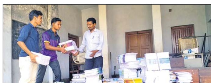
ବିଭିନ୍ନ ଅର୍ଥସବୁ ବିଦ୍ୟାଳୟକୁ ପୁସ୍ତକ ପଠାଇବା ବ୍ୟବସ୍ଥା କରାଯାଇଛି ।

ରାଜ୍ୟ ସରକାର ପ୍ରଥମରୁ ଅଷ୍ଟମ ଶ୍ରେଣୀ ମଧ୍ୟରେ ସରକାରୀ ବିଦ୍ୟାଳୟ ଛାତ୍ରାଛାତ୍ରଙ୍କୁ ମାଗଣା ପୁସ୍ତକ ଯୋଗାଇ ଦେଇଛନ୍ତି । କିନ୍ତୁ ବିଗତ ବର୍ଷମାନଙ୍କରେ ପାଠ୍ୟ ପୁସ୍ତକ ଯୋଗାଣରେ ଅବ୍ୟବସ୍ଥା ଯୋଗୁ ଶତପ୍ରତିଶତ ଛାତ୍ରାଛାତ୍ରଙ୍କ ପାଖରେ ମାଗଣା ପୁସ୍ତକ ପହଞ୍ଚି ପାରି ନ ଥିଲା । ଯାହାକୁ ନେଇ ଅଭିଭାବକ ଓ ଛାତ୍ରାଛାତ୍ରଙ୍କ ମଧ୍ୟରେ ଅସନ୍ତୋଷ ପ୍ରକାଶ ପାଇଥିଲା । ଏଥୁପରେ ଶିକ୍ଷୟିତ୍ରୀ ଶିକ୍ଷକମାନେ ନାନା ପ୍ରସ୍ତାବ ସମ୍ମୁଖୀନ ହୋଇଥିଲେ । ତେଣୁ ଚଳିତବର୍ଷ ସମସ୍ତ ଛାତ୍ରାଛାତ୍ରଙ୍କ ପାଖରେ କିଛି ପୁସ୍ତକ ପହଞ୍ଚିପାରିବ ସେଥିପାଇଁ