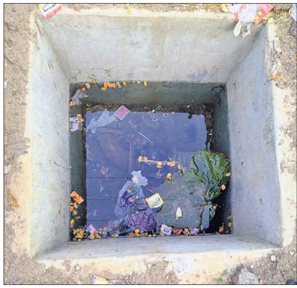
ଘୋଡ଼ଶି ନଥିବା ପାଇପ ଜଳସମନ