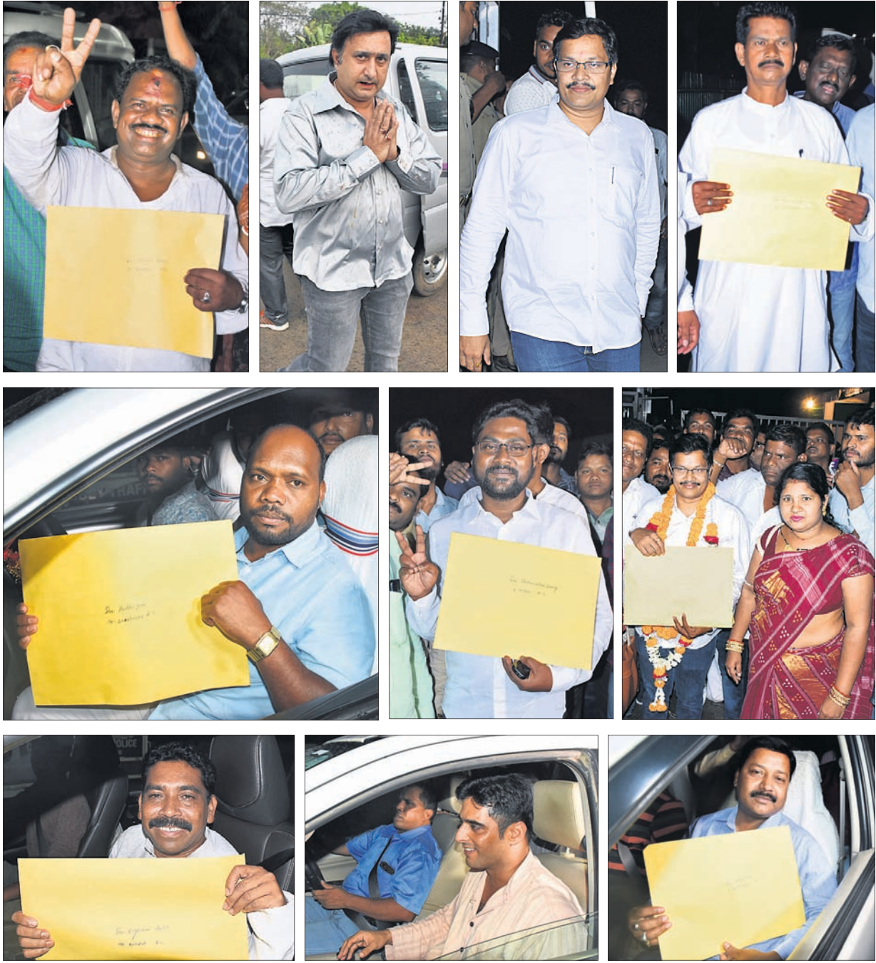
ଭୁବନାର ନବୀନ ନିବାସରେ ଆଶାୟୀ, ଟିକେଟ ପାଇଥିବା ପ୍ରାର୍ଥୀ ଓ ନେତାଙ୍କ ଭିଡ଼।