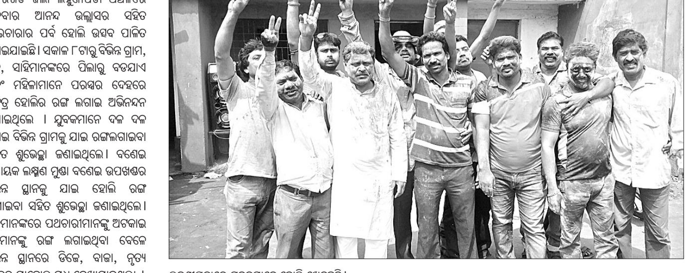
ଲକ୍ଷ୍ମଣାପତାରେ ସୁନ୍ଦରଗଡ଼ ହୋଲି ଉତ୍ସବ ପାଳିତ ହୋଇଛି।

ଲକ୍ଷ୍ମଣାପତା, ୨୩।୩ (ଡି.ଏନ୍.ଏ) ସୁନ୍ଦରଗଡ଼ ଜିଲ୍ଲା ଲକ୍ଷ୍ମଣାପତା ଅଞ୍ଚଳରେ ଶୁକ୍ରବାର ଆନନ୍ଦ ଭଲ୍ଲାସର ସହିତ ଭାଇଭାଉସି ପର୍ବ ହୋଲି ଉତ୍ସବ ପାଳିତ ହୋଇଯାଇଛି।