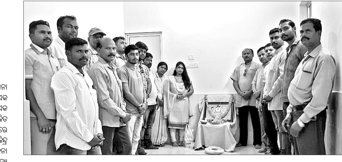
ଶହୀଦ ଦିବସ ଅବସରରେ ଶହୀଦଙ୍କୁ ଶ୍ରଦ୍ଧାଞ୍ଜଳି ଅର୍ପଣ କରାଯାଇଛି।

ସୁନ୍ଦରଗଡ଼ ଜିଲ୍ଲା କୋଇତା ଥାନା ଅନ୍ତର୍ଗତ ଗରୁଆ ଗ୍ରାମରେ ଘରୋଇ କଳିକୁ କେନ୍ଦ୍ରକରି ବଡ଼ବାପାଙ୍କୁ ପୁଅକୁ ବାଡିରେ ପିଟି ହତ୍ୟା କରାଯାଇଥିବା ଅଭିଯୋଗ ହୋଇଛି।