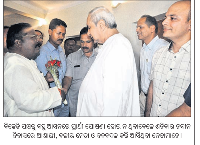
ବିଜେଡି ପକ୍ଷରୁ ବହୁ ଆସନରେ ପ୍ରାର୍ଥୀ ଘୋଷଣା ହୋଇ ନ ଥିବାବେଳେ ଶନିବାର ନବୀନ ନିବାସରେ ଆଶାୟୀ, ଦଳୀୟ ନେତା ଓ ଦଳବଦଳ କରି ଆସିଥିବା ନେତାମାନେ ।