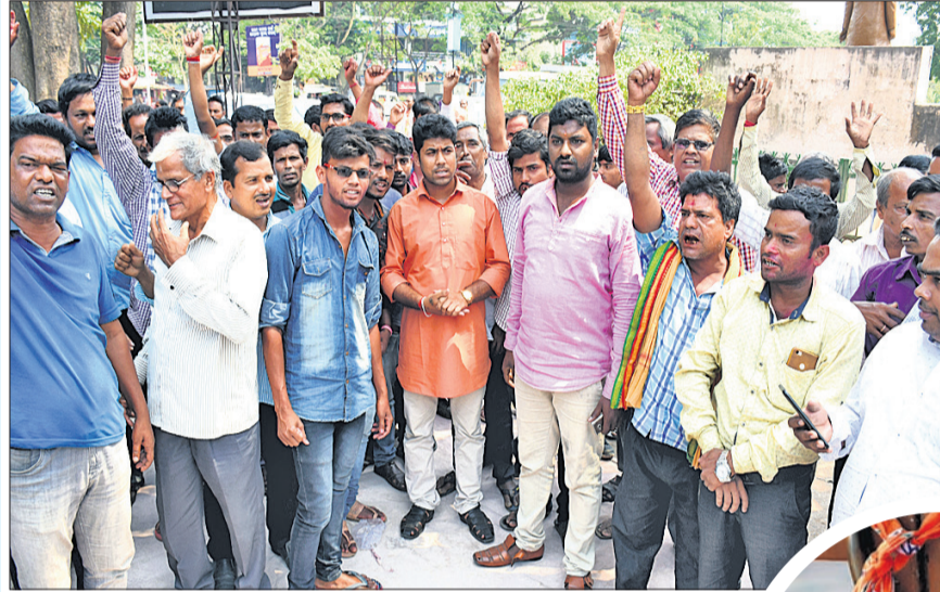
ମିଳନ ସେଠୁଙ୍କୁ ବରଗଡ଼ ଜିଲା ଅତାବିରା ବିଧାନସଭା ନିର୍ବାଚନମଣ୍ଡଳୀର ଭାଜପା ପ୍ରାର୍ଥୀ କରାଯିବା ପ୍ରତିବାଦରେ ରାଜ୍ୟ କାର୍ଯ୍ୟାଳୟ ସମ୍ମୁଖରେ ବିରୋଧ ପ୍ରଦର୍ଶନ ।