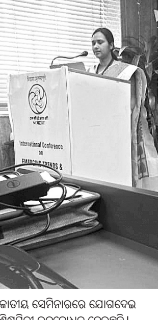
ଜାତୀୟ ସେମିନାରରେ ଯୋଗଦେଇ ଶିକ୍ଷାସମିତ୍ରୀ ଉଦ୍ଘାଟନ ଦେଇଛନ୍ତି।

ଲକ୍ଷ୍ମଣାପତା, ୨୩।୩ (ଡି.ଏନ୍.ଏ) ସୁନ୍ଦରଗଡ଼ ଜିଲ୍ଲା ଲକ୍ଷ୍ମଣାପତା ଅଞ୍ଚଳରେ ଶୁକ୍ରବାର ଆନନ୍ଦ ଭଲ୍ଲାସର ସହିତ ଭାଇଭାଉସି ପର୍ବ ହୋଲି ଉତ୍ସବ ପାଳିତ ହୋଇଯାଇଛି।