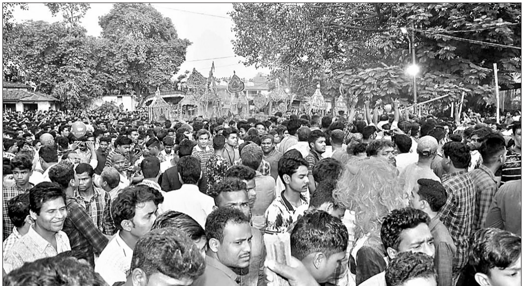
ବାରମହାରାଜପୁର ମେଳଣ ପଡିଆରେ ହରିହର ଭେଟ।

ସୁବର୍ଣ୍ଣପୁର ଜିଲ୍ଲା ବାରମହାରାଜପୁରର ଐତିହାସିକ ସମ୍ପନ୍ନ ଦୋଳଯାତ୍ରା ଶୁକ୍ରବାର ସମ୍ପନ୍ନ ହୋଇଛି। ପ୍ରବଳ ଜନସମାଗମ ମଧ୍ୟରେ ତିନିଦିନ ଧରି ଏହି ମହାପର୍ବ ଅନୁଷ୍ଠିତ ହୋଇଥିଲା। ପର୍ବର ଅନ୍ତିମ ପର୍ଯ୍ୟାୟରେ ଆୟୋଜିତ ହରିହର ଭେଟ ଦେଖିବା ପାଇଁ ଏଥର ମେଳଣ ପଡିଆରେ ପୂର୍ବକର୍ମମାନଙ୍କ ଅପେକ୍ଷା ଅଧିକ ଲୋକଙ୍କ ଭିଡ ଅନୁଭୂତ ହୋଇଥିଲା। ଏଥର ଯାତ୍ରା ପଡିଆରେ ଶହଶହ ସଂଖ୍ୟାରେ ଦୋଳୀନା ପସରା ମେଳାଇଥିଲେ। ସଂସ୍କୃତି ଓ ପରମ୍ପରାର ଏକ ନିଆରା ନିଦର୍ଶନ ଭାବେ ଏଠାରେ ହରିହର ଭେଟ ଉତ୍ସବ କାର୍ଯ୍ୟକ୍ରମ ପୂର୍ବରୁ ପାଳିତ ହୋଇ ଆସୁଛି। ଫାଳଗୁଣ ପୂର୍ଣ୍ଣିମାର ସକାଳେ ଏଥର ସମ୍ପନ୍ନ ହୋଇଥିଲା ଦେବ ମିଳନ। ଏହି ମହାପର୍ବ ମେଳଣରେ ହଜାରହଜାର ଶ୍ରଦ୍ଧାଳୁ ସାମିଲ ହେବା ସହିତ ଫାଗୁ ଓ ଅବିବାହର ରଙ୍ଗେଇ ହୋଇଥିଲେ।