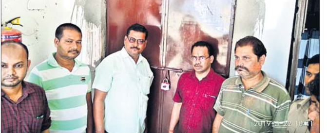
ଇଭିଏମ ଓ ଭିଭିପିଏଟି ରଖାଯାଇ ସିଲ୍ କରାଯାଇଛି।