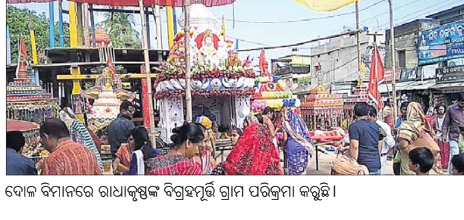
ଦୋଳ ବିନାମରେ ରାଧାକୃଷ୍ଣଙ୍କ ବିଗ୍ରହପୂର୍ଣ୍ଣ ଗ୍ରାମ ପରିକ୍ରମା କରୁଛି।

ବାଦିଗୋସେଇଁ ରାଧାମୋହନ ଜାଉ, ଲକ୍ଷ୍ମୀନାରାୟଣ ଶାସନ, ଲକ୍ଷ୍ମୀନାରାୟଣ ଜାଉଙ୍କ ବିନାମ ପ୍ରକୃତି ବଡ଼ବାଞ୍ଚଠାରେ ରଖାଯାଇଥିଲା। ସେହିଭଳି ଫକୀରପୁର ସ୍ତ୍ରୀ ବଜାରରେ ରାଧାକୃଷ୍ଣଙ୍କ ବିନା ଶୋଭାଯାତ୍ରା ମାଧ୍ୟମରେ ଆଶାଯାଇ ପ୍ରତ୍ୟୁଷକୁ ପୂଜାର୍ଚ୍ଚନା କାର୍ଯ୍ୟ କରାଯାଇଥିଲା। ମେଳଣ ପର୍ବରେ ବିଭିନ୍ନ ଦୋକାନ ବଜାର ଓ ମାନା ବଜାରର ଆସର ଜମିବା ସହିତ ଶ୍ରଦ୍ଧାଳୁମାନଙ୍କର ଭିତ ଲାଗି ରହିଥିଲା।