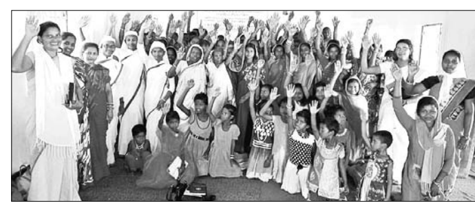
ସାକ୍ଷ୍ୟ ସଚେତନତା କାର୍ଯ୍ୟକ୍ରମରେ ଅତିଥି ଓ ମହିଳା।

ତାରିକ୍ କରୁଥିଲେ। ତେବେ ଏହିସମ୍ବନ୍ଧରେ ଅନୁସନ୍ଧାନ କରାଯାଇ ପାରୁଥିବା କାର୍ଯ୍ୟକ୍ରମରେ ଅତିଥି ଓ ମହିଳା।