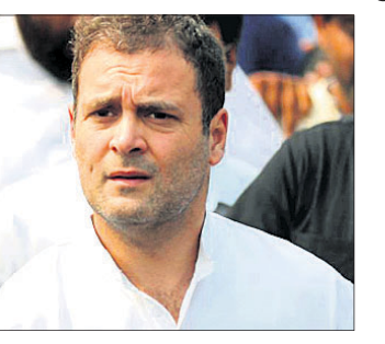
ଦିଲ୍ଲୀରେ ୪.୬୯ ଏକର ଜମିରେ ଫାର୍ମ ହାଉସ ଅଛି, ଯାହାକୁ ଫାଇନାନ୍ସିଆଲ ଟେକନୋଲୋଜି (ଇଫିଆ) ଲିମିଟେଡ୍‌କୁ ଦାଖଲ କରିଥିବା ସତ୍ୟପାଠ ଅନୁଯାୟୀ ୨୦୦୪ରୁ ୨୦୧୪ ମଧ୍ୟରେ ତାଙ୍କ ଆୟ ୫୫ ଲକ୍ଷରୁ ୯ କୋଟି ଟଙ୍କାକୁ ବୃଦ୍ଧି ପାଇଛି। କଂଗ୍ରେସ ଅଧ୍ୟକ୍ଷ ଓ ତାଙ୍କ ଭଉଣୀ ନାମରେ