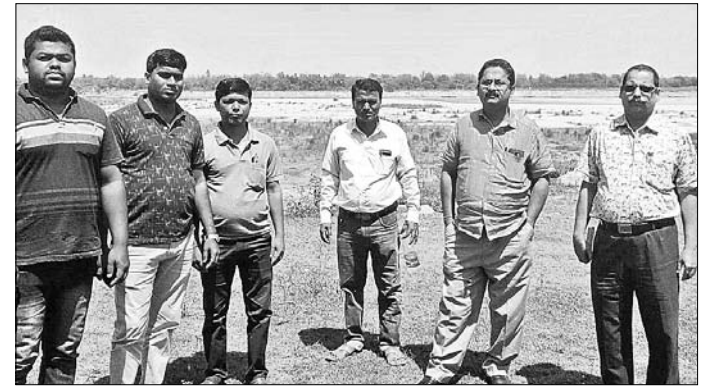
ଅତିରିକ୍ତ ଜିଲ୍ଲାପାଳଙ୍କ ସହ ଅନ୍ୟ ଅଧିକାରୀମାନେ ବାଲି ସେରାଟ ପରିଦର୍ଶନ କରୁଛନ୍ତି।

ବାଗ୍ୟାଚାରୀ ଚାରିଦିନ ସତ୍ତ୍ୱେ ବାଲେଶ୍ୱର ଜିଲ୍ଲା କଲେକ୍ଟର ଅଫିସର ବିଜିନ ବାଲି ଯୋଗାଣରେ ବେଆଇନ ଭାବେ ଉତ୍ତୋଳନ କରାଯାଇ ପାରୁଥିବା ଚାଲିଛି।