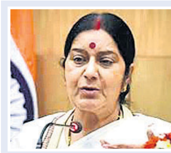
ତଦନ୍ତ ନିର୍ଦ୍ଦେଶ ଦେଇଛନ୍ତି। ସେମାନଙ୍କୁ ଉଚ୍ଚାଦିକ୍ଷ୍ଟ କବାଦ ଦେଇ ତୈଧିରା କହିଛନ୍ତି, ଏହା ପାକିସ୍ତାନର ଆଭ୍ୟନ୍ତରୀଣ ପ୍ରସଙ୍ଗ, ନିଆଯାଉଥିବା ପାକ୍ ସୂଚନା ମତ୍ତା ଫାଉଁଦ ଚୈଧିରା କହିଛନ୍ତି। ଅପହରଣ ଖବରକୁ ନେଇ ପୁଷ୍ପା ସ୍ୱରାଜ ଏବଂ ଫାଉଁଦଙ୍କ ମଧ୍ୟରେ ବାକ୍ସ୍ତକ୍ ହୋଇଛି। ପୁଷ୍ପାଙ୍କ

ହୋଲି ଅପହରଣରେ ପାକିସ୍ତାନର ସିନ୍ଧ ପ୍ରଦେଶ ଅନ୍ତର୍ଗତ ଗୋଟିକ ଜିଲ୍ଲାରେ ହିନ୍ଦୁ ସମ୍ପ୍ରଦାୟର ୨ ଜଣ ନାବାଳିକାଙ୍କୁ ଅପହରଣ କରିନେଇ ଗୋରକବରସିଂହ ଧର୍ମ ପରିବର୍ତ୍ତନ କରିଦିଆଯାଇଥିବା ଖବର ଗଣମାଧ୍ୟମରେ ପ୍ରକାଶ ପାଇଛି। ଏହାକୁ ନେଇ ବହିଷ୍କାର ପତ୍ରା ପୁଷ୍ପା ସ୍ୱରାଜ ଲସ୍କରୀମାବାଦର ଥିବା ଭାରତୀୟ ଉଚ୍ଚାଦିକ୍ଷ୍ଟଙ୍କୁ ସବିଶେଷ ନିପୋର୍ ମାଗିଛନ୍ତି। ଅନ୍ୟ ପକ୍ଷରେ ୨ ହିନ୍ଦୁ ନାବାଳିକା ଅପହରଣ, ଧର୍ମପରିବର୍ତ୍ତନ ଓ କମ୍ ବୟସରେ ଜବରଦସ୍ତ ବିବାହ ଖବର ଉପରେ ପାକ୍ ପ୍ରଧାନମନ୍ତ୍ରୀ ଲମ୍ହାନ ଖାନ୍