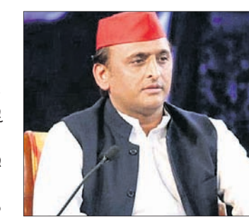
ବରିଷ୍ଠ ନେତା ମହମ୍ମଦ ଆକମ ଖାନ ରାମପୁରରୁ ଲଢ଼ିବେ। ଏଏପି ବର୍ତ୍ତମାନ ସୁଦ୍ଧା ଉତ୍ତରପ୍ରଦେଶ ପାଇଁ ୧୯ ଜଣ ଏବଂ ମଧ୍ୟପ୍ରଦେଶ ଲାଗି ଜଣେ ପ୍ରାର୍ଥୀଙ୍କ ନାମ ଘୋଷଣା କରିଛି। ଅନ୍ୟ ପ୍ରମୁଖ ପ୍ରାର୍ଥୀ ହେଲେ ଅଖିଲେଶଙ୍କ ସମ୍ପର୍କୀୟ ଭାଇ ଧର୍ମେନ୍ଦ୍ର ଏବଂ ଅକ୍ଷୟ ଯାଦବ। ଧର୍ମେନ୍ଦ୍ର ବର୍ତ୍ତମାନ ଏଏପି ଅକ୍ଷୟ ଫିରୋଜାବାଦ ଆସନରୁ ଲଢ଼ିବେ। ସେହିପରି ଡିମ୍ପଲଙ୍କୁ ଓ ଅନ୍ୟମାନେ ରହିଛନ୍ତି। ଏଏପିର

ସମାଜବାଦୀ ପାର୍ଟି (ଏଏପି) ଅଧ୍ୟକ୍ଷ ଅଖିଲେଶ ଯାଦବ ଉତ୍ତରପ୍ରଦେଶର ଆଜମଗଡ଼ ଲୋକ ସଭା ଆସନରୁ ଲଢ଼ିବେ। ଏହି ଆସନରୁ ତାଙ୍କ ବାପା ପୁଲ୍ଲାଇମ ସିଂ ଯାଦବ ପ୍ରତିନିଧିତ୍ୱ କରି ଆସୁଥିଲେ। ୨୦୧୪ରେ ପୁଲ୍ଲାଇମ ଆଜମଗଡ଼ ଓ ମୈନପୁରରୁ ନିର୍ବାଚନ ଲଢ଼ି ଉଭୟ ଆସନରୁ ଜିତିଥିଲେ। ଏଥର ତାଙ୍କୁ ମୈନପୁରରୁ ପ୍ରାର୍ଥୀ କରାଯାଇଛି। ଦଳ ପକ୍ଷରୁ ପ୍ରକାଶିତ ୪୦ ଜଣିଆ ସ୍ୱାର୍ ପ୍ରଚାରକ ତାଲିକାରେ ପୁଲ୍ଲାଇମଙ୍କ ନାଁ ନ ଥିଲା। ଏହାକୁ ନେଇ ସମାଲୋଚନା ପରେ ଉଚ୍ଚ ତାଲିକାରେ ତାଙ୍କ ନାଁ ଯୋଡ଼ା ଯାଇଥିବା ଜଣାପଡ଼ିଛି। ଏଥିରେ ଅଖିଲେଶ, ଆକମ ଖାନ୍, ଡିମ୍ପଲ ଯାଦବ, ରାମଗୋପାଳ ଯାଦବ, ଜୟା ବଚନ ଆସନରୁ ଲଢ଼ିବେ। ସେହିପରି ଡିମ୍ପଲଙ୍କୁ ଓ ଅନ୍ୟମାନେ ରହିଛନ୍ତି। ଏଏପିର