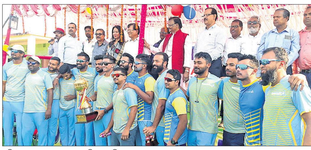
ଚାମ୍ପିୟନ କାନାରା ବ୍ୟାଙ୍କ ଦଳର ଖେଳାଳିମାନେ ଅତିଥିଙ୍କ ଗହଣେ ।

ବନ୍ଦ, ୨୪।୩।(ପି.ଟି.-ଏ.ସ୍.ପ୍ର.) ଉତ୍ତର ଓଡ଼ିଶା ବନ୍ଦ ଚଳିତ ଉତ୍ତର ଓଡ଼ିଶା ଆସୋସିଏସନ ଆନୁକୁଲ୍ୟରେ ଭୁବନେଶ୍ୱର ଠାରେ ଆରମ୍ଭ ହୋଇଥିବା ସର୍ବଭାରତୀୟ ୨୬ତମ ପ୍ରଦୀପ ମେମୋରିଆଲ କ୍ରିକେଟ ଚୁନିତ ମେଣ୍ଟର ରବିବାର ଫାଇନାଲରେ ସେରସା ଆଡ୍ରାକ୍ଟ ହରାଇ କାନାରା ବ୍ୟାଙ୍କ, ବାଙ୍ଗାଲୋର ଚାମ୍ପିୟନ ହୋଇଛି ।