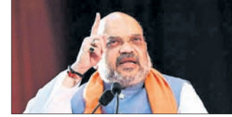
ହେଉଛନ୍ତି, ଜଗନ୍ନାଥନାଥ ରେଖା। ଏହା ପୂର୍ବରୁ ତତ୍ତ୍ୱାବାହୁ ଜଗନ୍ନାଥନାଥଙ୍କୁ ଦେଇଥିବା କଡ଼ାପା ଜିଲ୍ଲା ଏକ ତୁଳସୀ ବଣ ଭଳି। ଏହି ତୁଳସୀ ବଗିଚାରେ ଏକ ଗଞ୍ଜେଇ ଗଛ ମଧ୍ୟ ଉଠିଛି। ସେ

ଦେଶକୁ କେବଳ ପ୍ରଧାନମନ୍ତ୍ରୀ ନରେନ୍ଦ୍ର ମୋଦି ସୁରକ୍ଷା ଦେଇପାରିବେ ବୋଲି ଉତ୍ତରପ୍ରଦେଶର ଆଗ୍ରାରେ ରବିବାର ଭାଜପା ରାଷ୍ଟ୍ରୀୟ ଅଧ୍ୟକ୍ଷ ଅମିତ ଶାହ କହିଛନ୍ତି। ବିଜୟ ସଂକଳ୍ପ ସମାବେଶକୁ ସମ୍ବୋଧିତ କରି ଶାହ କହିଛନ୍ତି, କଂଗ୍ରେସ ଭୋଟବ୍ୟାଙ୍କ ରାଜନୀତି ପାଇଁ ବାଲାକୋଟ ଆକ୍ରମଣକୁ ନେଇ ୬-୬ ଲକ୍ଷ ନିବେଶ କଲେ ଦୁଇ ଡିନି ବର୍ଷରେ ୭୦୦-୮୦୦ କୋଟି ଟଙ୍କା ହୋଇପାରୁଥିଲା। ଏବେ ରାହୁଲ ଗାନ୍ଧୀଙ୍କ ବିକାଶ ମତେଲ ସମ୍ପର୍କରେ ଜଣାପଡ଼ିଲା ବୋଲି ପ୍ରସାଦ କହିଛନ୍ତି। ୨୯ କୋଟି ଟଙ୍କା ଦୁର୍ନୀତିରେ ସମ୍ପୃକ୍ତ ୟୁନିଟେଡ଼ଠାକୁ ରାହୁଲ ଦୁଇଟି ସମ୍ପତ୍ତି ୧.୪୪ କୋଟି ଓ ୫.୩୬ କୋଟି ଟଙ୍କାରେ କିଣିବା ଉପରେ ଭାଜପା ନେତା ପ୍ରଶ୍ନ ଉଠାଇଛନ୍ତି।