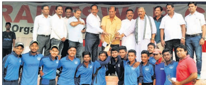
ଚାମ୍ପିୟନ ଭୁବନେଶ୍ୱର ଦଳର ଖେଳାଳିମାନେ ଅତିଥିଙ୍କଠାରୁ ଟ୍ରଫି ଗ୍ରହଣ କରୁଛନ୍ତି