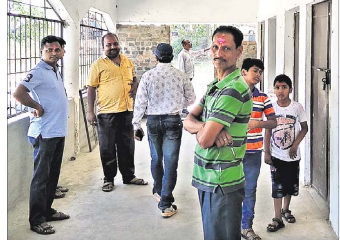
କେନ୍ଦୁଝର କେନ୍ଦ୍ରୀୟ ବିଦ୍ୟାଳୟ ଅଧ୍ୟକ୍ଷ ଗ୍ଳାନୀୟ ଲୋକଙ୍କ ସହିତ ଆଲୋଚନା କରୁଛନ୍ତି।

ଆନନ୍ଦପୁରରେ କେନ୍ଦ୍ରୀୟ ବିଦ୍ୟାଳୟ ଖୋଲାଯିବା ନେଇ ମାର୍ଚ୍ଚ ୩ ତାରିଖରେ କେନ୍ଦ୍ର କ୍ୟାବିନେଟରେ ପୁନର୍ବାର ପ୍ରସ୍ତାବ ରଖାଯାଇଥିଲା। ପୂର୍ବରୁ ୨୦୧୭ ମାର୍ଚ୍ଚ ମାସରେ ପ୍ରଥମ ଥର ପାଇଁ ମଧ୍ୟ ଏହି ପ୍ରସ୍ତାବ ରଖାଯାଇଥିଲା। ସେହି ସମୟରେ କେନ୍ଦ୍ରୀୟ ବିଦ୍ୟାଳୟ ସଙ୍ଗଠନ ଏବଂ ଗ୍ଳାନୀୟ ପ୍ରଶ୍ନାସନର ଉପସ୍ଥିତରେ ଏହିପରିକି ପାଠ ଶିକ୍ଷାଦାନୀୟ ଗ୍ରାମ ଏକର ବିଶିଷ୍ଟ ଜାଗା ଚିହ୍ନଟ କରାଯାଇଥିଲା ଏବଂ ଗ୍ଳାନୀୟ ବ୍ରଜବନ୍ଧୁ ବିଦ୍ୟାପାଠର ଏକ ଦୁଇ ମହଲା ବିଶିଷ୍ଟ ଘରକୁ ୧୦ ଲକ୍ଷ ଟଙ୍କା ବ୍ୟୟ କରାଯାଇ ଆଗାଧ୍ୟାୟ ଭାବେ ଚାଳୁ କରିବା ପାଇଁ ସମସ୍ତ ପ୍ରକ୍ରିୟା ଶେଷ ହୋଇଥିଲା। ଏପରିକି ସମ୍ପୂର୍ଣ୍ଣ ଜାଗା ପଞ୍ଜା ପାଇଁ ମଧ୍ୟ ତହସିଲରେ ଆବେଦନ କରାଯାଇଥିଲା। ହେଲେ ପଞ୍ଜା ମିଳିବାରେ ବିଳମ୍ବ ଘଟିବାରୁ ସମସ୍ୟା ସୃଷ୍ଟି ହୋଇଥିଲା। କୌଣସି କାରଣକୁ ନେଇ କେନ୍ଦ୍ରୀୟ ବିଦ୍ୟାଳୟ ଅନ୍ୟତ୍ର ଗ୍ଳାନୀକର ହୋଇଥିଲା। ପରବର୍ତ୍ତୀ ସମୟରେ ପୁନର୍ବାର କେନ୍ଦ୍ରୀୟ ବିଦ୍ୟାଳୟ ଆନନ୍ଦପୁରରେ କାର୍ଯ୍ୟକାରୀ କରାଯିବା ପାଇଁ କ୍ୟାବିନେଟ୍ ମଞ୍ଜୁରୀ ମିଳିବା ପରେ ଗତ ୨୧ତାରିଖରେ