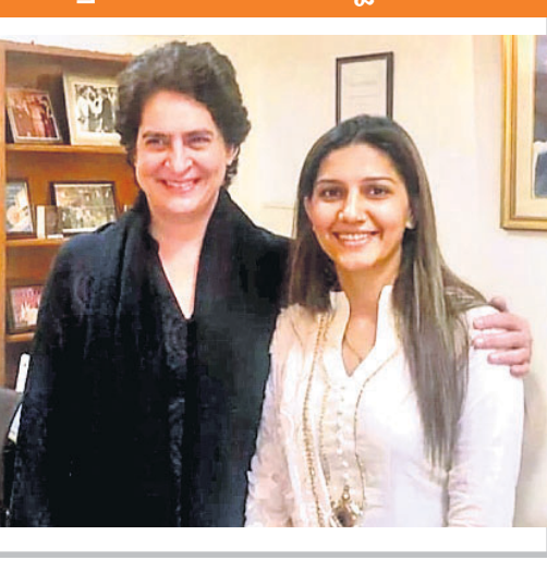
କଂଗ୍ରେସରେ ମିଶିବା ଖବରକୁ ଖଣ୍ଡନ କଲେ