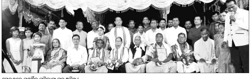
ନେତୃତ୍ୱରେ ସମ୍ପର୍କିତ ପ୍ରତିଭାଙ୍କ ସହ ଅତିଥି।

ନାଟକଟି, ୨୪ ମାର୍ଚ୍ଚ (ଡି.ଏନ.ଏ.): ବାଲେଶ୍ୱର ଜିଲ୍ଲା ନାଟକଟି କୁଳ ଚଣ୍ଡିକା ଗାଁର ବନିଷ୍ଠ ସାରସ୍ୱତ ସାହିତ୍ୟ ସାଧକ ଦେବୀମାନଙ୍କୁ ୮୦୦୦ ଟଙ୍କା ପର୍ଯ୍ୟନ୍ତ ପାଳନ ଅବସରରେ ସାରସ୍ୱତ ବହିଷ୍କୃତ ନାଟକ ଉତ୍ସବ ରବିବାର ଭାରତ ପାଣିଗ୍ରାହୀଙ୍କ ସଭାପତିତ୍ୱରେ କବିକ ନିବାସ ପରିସରରେ ଅନୁଷ୍ଠିତ ହୋଇଯାଇଛି।