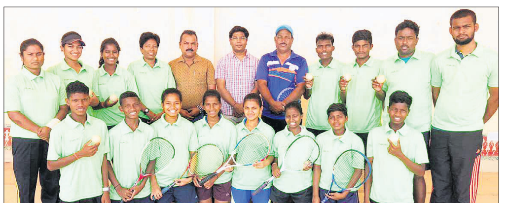
ଜାତୀୟ ସଫ୍ଟ ଚୈତ୍ୟ ପାଇଁ ମନୋନୀତ ଓଡ଼ିଶା ଦଳ ।

ଭୁବନେଶ୍ୱର, ୨୪।୩।(ସୋର୍ଟ୍ ବ୍ୟୁରୋ): ଉତ୍ତରପ୍ରଦେଶର ପ୍ରଧାନମନ୍ତ୍ରୀ ଠାରେ ଆସନ୍ତା ୨୭ରୁ ୨୯ ତାରିଖ ମଧ୍ୟରେ ୩ ଦିନ ଧରି ୨୯ତମ ଚୈତ୍ୟ ବଲ୍ କ୍ରିକେଟ ଚାମ୍ପିୟନଶିପ୍ ଆୟୋଜନ ହେବାକୁ ଯାଉଛି ।