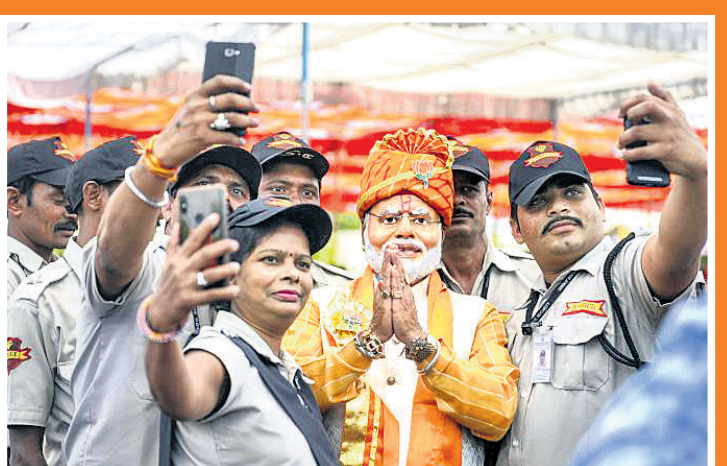
ମଧ୍ୟପ୍ରଦେଶର ଭୈରୋ: ଭାଜପା ପକ୍ଷରୁ ଆୟୋଜିତ ଏକ କାର୍ଯ୍ୟକ୍ରମରେ ପ୍ରଧାନମନ୍ତ୍ରୀ ନରେନ୍ଦ୍ର ମୋଦିଙ୍କ ଭଳି ବେଶଭୂଷା ଆରମ୍ଭ କରିଥିବା ଜଣେ ବ୍ୟକ୍ତିଙ୍କ ସହ ସେଲଫି ନେଉଛନ୍ତି ସୁରକ୍ଷା କର୍ମୀ ।