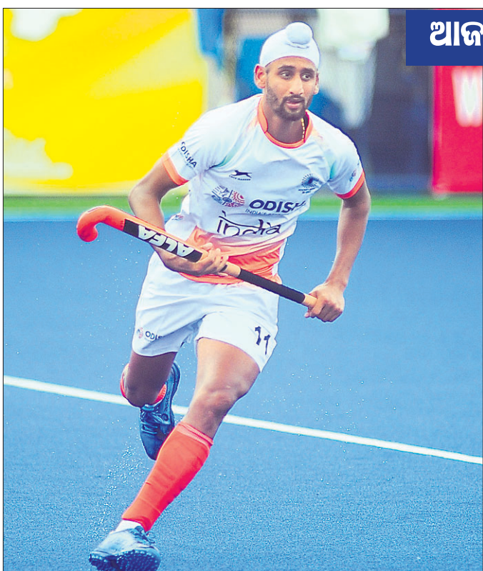
ଆଜଲାନ ଶାହ୍ କପ୍ ହକି

ଇସୋ(ମାଲେସିଆ), ୨୪।୩। (ପି.ଟି.) ଭାରତୀୟ ହକି ଦଳର ପୁରୁଣା ତଥା ଚିରାଚରିତ ସମସ୍ୟାର ପୁନରାବୃତ୍ତି ହୋଇଛି ।