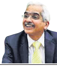
ଶକ୍ତିକାନ୍ତ ଦାସ, ଆରବିଆଲ ଗଭର୍ନର

ଫିନଟେକ ବ୍ୟବସାୟରେ ନୂତନତାକୁ ପ୍ରୋତ୍ସାହିତ କରିବା ଲାଗି ଶୀଘ୍ର ନୂଆ ନିୟମ ଆଣିବେ।