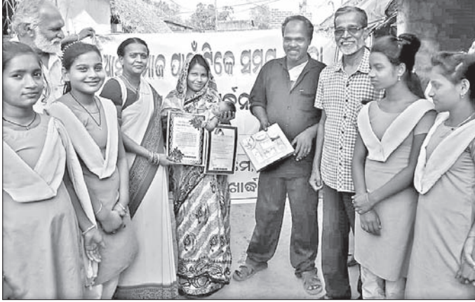
ବିଦ୍ୟାଳୟରେ ଜଣେ ମହିଳାଙ୍କୁ ଅତିଥିମାନେ ମାନପତ୍ର ଦେଇ ସମ୍ବର୍ଦ୍ଧିତ କରୁଛନ୍ତି ।