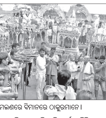
ସିକୋ ମେଳଣରେ ବିନାକରେ ଠାକୁରମାନେ ।

ପ୍ରତିବର୍ଷ ପଞ୍ଚୁଦୋଳ ଯାତ୍ରା ଆସିଲେ ଗାଁଗଣର ପୁରପଲ୍ଲୀ ଅବିରାମ ହୋଇଯାଏ । ତାହା ସାଙ୍ଗକୁ ଦୋଳ ଯାତ୍ରାର ମହତ୍ତ୍ୱ ଶ୍ରାବ୍ଧୀୟ ବେତାର କରି ପକାଇଥାଏ । ତେବେ ଖୋର୍ଦ୍ଧା ଜିଲା ବେଗୁନିଆ ବ୍ଲକ୍ ଅଞ୍ଚଳରେ ବହୁ ସ୍ଥାନରେ କେନ୍ଦ୍ର