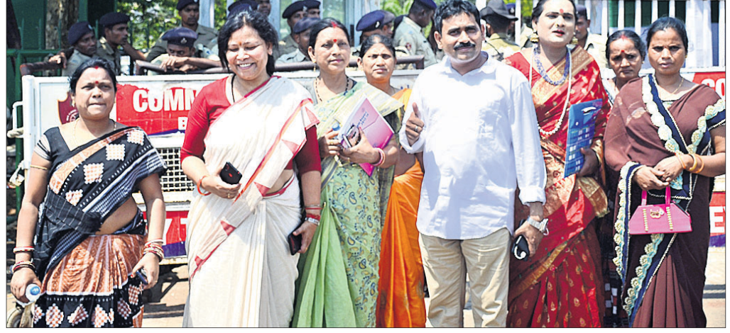
ନବୀନ ନିବାସ ସମ୍ମୁଖରେ ମଙ୍ଗଳବାର ବିକେଟ୍ ଆଶାୟୀ ଓ ଅସନ୍ତୁଷ୍ଟ ନେତାମାନଙ୍କ ଭିଡ଼ ।