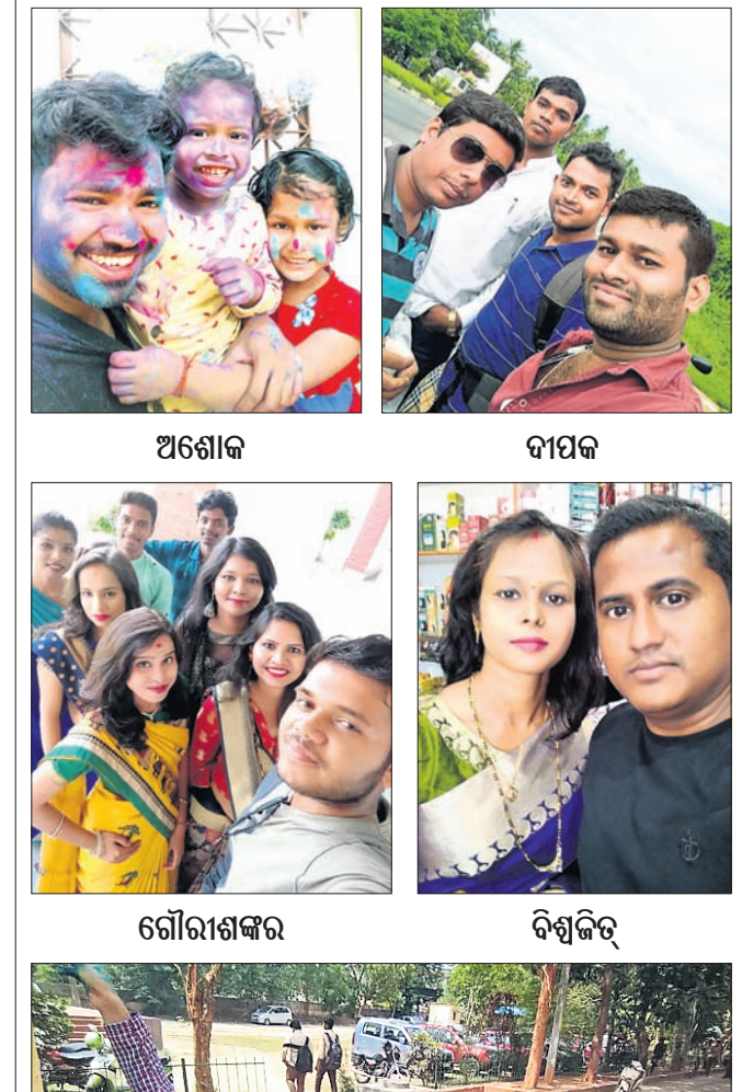
ଅଶୋକ ଦୀପକ ଗୌରାଶଙ୍କର ବିଶ୍ୱଜିତ ଶ୍ରୀମା ଦେବୀପ୍ରସାଦ ଦେବ୍ ସାଫ୍ଟିକା ସାଥୀକ ସଭିଜିତ ଅଭିଜିତ ଅମିୟ