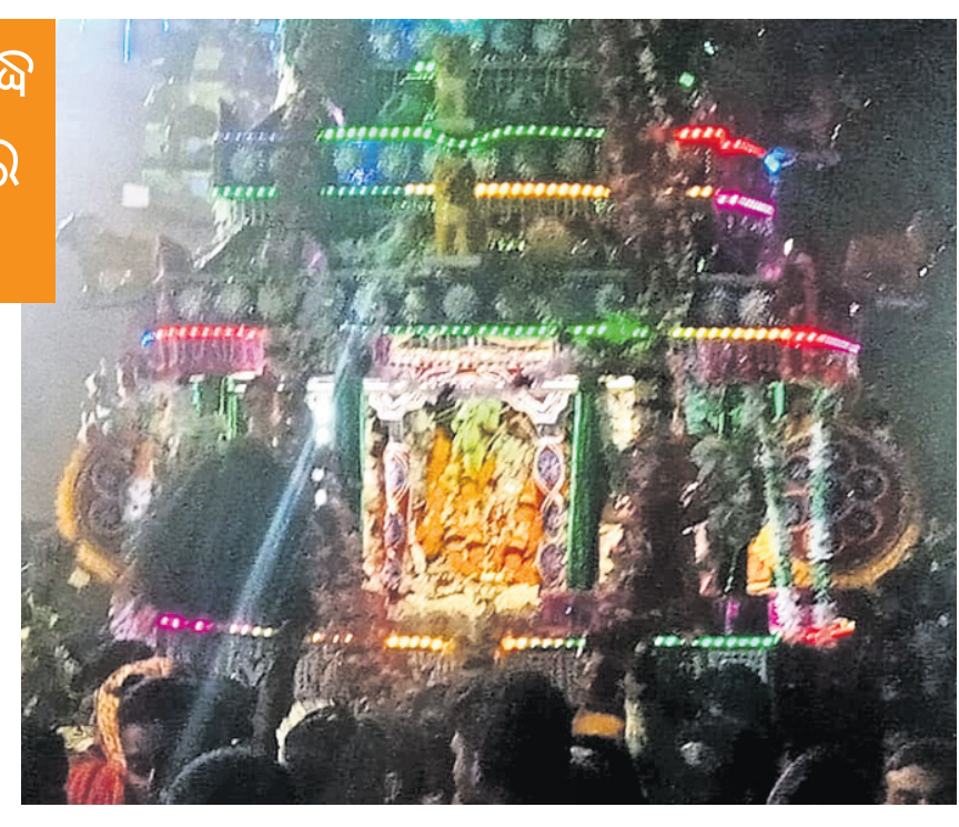
ଓଡ଼ିଶା ପ୍ରସିଦ୍ଧ ହରିରାଜପୁର ମେଳଣ

ପଞ୍ଚୋତ୍ସବ, ରାଜା ରାଣୀ ଆଦି ନୃତ୍ୟରେ ଚତୁର୍ଥପର୍ବ ପ୍ରକଳ୍ପିତ ହୋଇଉଠିଥିଲା। ଏଥିସହ ଆଧ୍ୟାତ୍ମିକ ପରିବେଶ ସୃଷ୍ଟି କରି ଥିଲା।