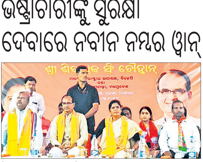
ବିଜୟ ସଂକଳ୍ପ ସମାବେଶରେ ଉପସ୍ଥିତ ଭାଜପା ନେତାମାନେ।