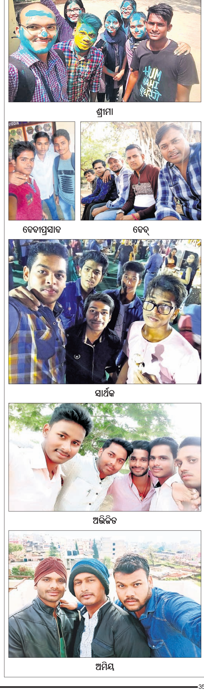
ଗୋରାଶଙ୍କର ବିଶ୍ୱଜିତ ଶ୍ରୀମା ଦେବୀପ୍ରସାଦ ଦେବ୍ ସାଫ୍ଟିକା ସାଥୀକ ସଭିଜିତ ଅଭିଜିତ ଅମିୟ