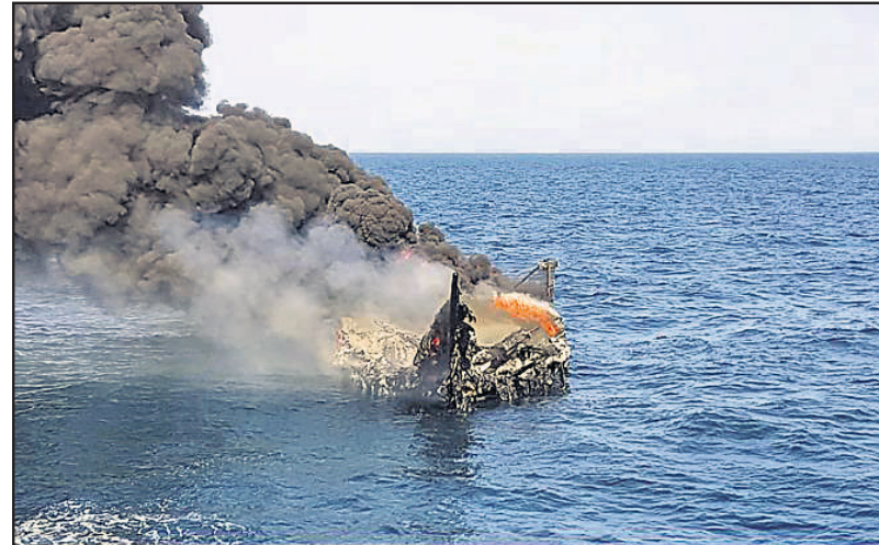
ପାକିସ୍ତାନରୁ ୫୦୦ କୋଟି ଟଙ୍କାର ତ୍ରୁଷ୍ଟ ନେଇ ପୋରବନ୍ଦର ଆସୁଥିବା ଏ ଇରାନୀ ଚାଲାଣକାରୀ ଧରାପଡିବା ପରେ ବୋର୍ରେ ନିଆଁ ଲଗାଇଦେଇଛନ୍ତି।