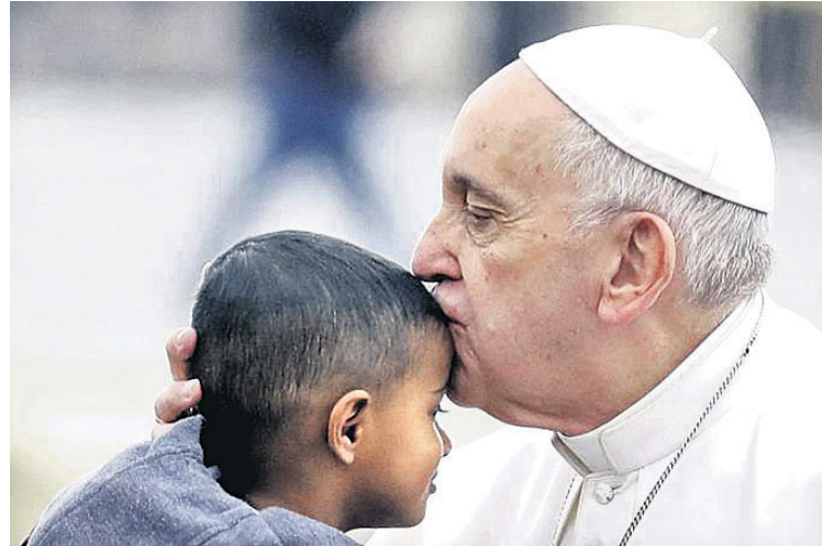
ପୋପ ଫ୍ରାନ୍ସିସ୍ ରୁଧିର ଭାଟିକାନ ସିଟିର ସେଣ୍ଟ ପିଟର୍ ସ୍କୋୟାରରେ ଜଣେ ଶିଶୁକୁ ଚୁମ୍ବନ ଦେଉଛନ୍ତି।