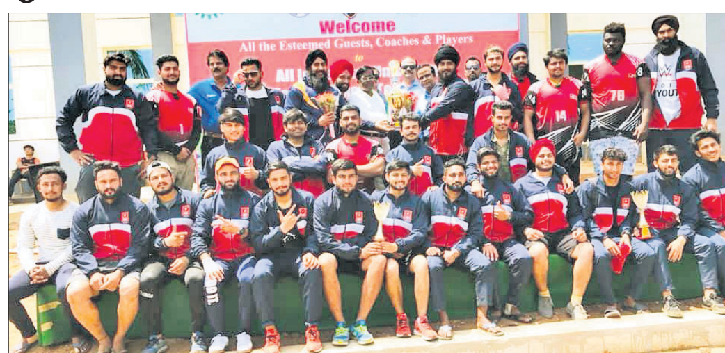
ଅତିଥିଙ୍କ ଗହଣରେ ଚାମ୍ପିୟନ ଚକ୍ଷିଗତ ଦଳର ଖେଳାଳିମାନେ ।

ଆୟୋସିଏଶନ ଅଫ୍ ଇଣ୍ଡିଆନ ୟୁନିଭର୍ସିଟିଜ୍ (ଏଆଇୟୁ) ସହଯୋଗରେ କିର୍ ବିଶ୍ୱବିଦ୍ୟାଳୟ ଆନୁକୂଲ୍ୟରେ ଅନୁଷ୍ଠିତ ସର୍ବଭାରତୀୟ ଆନ୍ତର୍ ବିଶ୍ୱବିଦ୍ୟାଳୟ ଆମେରିକୀୟ ଫୁଟବଲ (ଫୁଲ୍) ଟୁର୍ନାମେଣ୍ଟରୁ ରୁଧିରୀ ଅନୁଷ୍ଠିତ ହୋଇଛି । ପ୍ରତିଯୋଗିତା ୨ଟି ଟ୍ୟାକ୍ଲ ଓ ଫ୍ଲ୍ ବିଭାଗରେ ଅନୁଷ୍ଠିତ ହୋଇଥିଲା । ଟ୍ୟାକ୍ଲ ଫୁଟବଲର ଫାଇନାଲରେ ଚକ୍ଷିଗତ ବିଶ୍ୱବିଦ୍ୟାଳୟ ଚାମ୍ପିୟନ ଓ ପଞ୍ଜାବର ଲଭ୍ଲି ପ୍ରଦେଶନାଲ ବିଶ୍ୱବିଦ୍ୟାଳୟ ରାଜସ୍ଥାନ ହୋଇଛି । କଲିକତାର ଯଦବପୁର ବିଶ୍ୱବିଦ୍ୟାଳୟ ତୃତୀୟ ସ୍ଥାନ ଅଧିକାର କରିଛି । ସେହିପରି ଫ୍ଲ୍ ଫୁଟବଲରେ ଜୟପୁର ପୂର୍ଣ୍ଣିମା ବିଶ୍ୱବିଦ୍ୟାଳୟ ଚାମ୍ପିୟନ ହୋଇଛି । ମଣିପାଲ ବିଶ୍ୱବିଦ୍ୟାଳୟ ରାଜସ୍ଥାନ ଓ ଜୟପୁର ଜାତୀୟ ବିଶ୍ୱବିଦ୍ୟାଳୟ