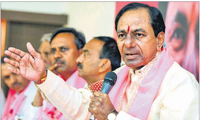
ତେଲେଙ୍ଗାନା ମୁଖ୍ୟମନ୍ତ୍ରୀ ତଥା ଟିଆର୍ଏସ୍ ଅଧକ୍ଷ କେ. ଚନ୍ଦ୍ରଶେଖର ରାଓ।

ତେଲେଙ୍ଗାନାରେ ନିଜଗରେ ଅନୁଷ୍ଠିତ ବିଧାନସଭା ନିର୍ବାଚନରେ ବିପୁଳ ବିଜୟ ପରେ ଶାସକ ତେଲେଙ୍ଗାନା ରାଷ୍ଟ୍ର ସମିତି (ଟିଆର୍ଏସ୍) ସାଧାରଣ ନିର୍ବାଚନର ମଇଦାନକୁ ଓହ୍ଲାଇଛି। ବିରୋଧୀ ଦଳଗୁଡ଼ିକ ମଧ୍ୟରେ ନୈରାଶ୍ୟ ଭରିରହିଥିବାବେଳେ ୧୬ରୁ ୧୬ ଲୋକ ସଭା ଆସନ ଦଖଲ ଲକ୍ଷ୍ୟରେ ରହିଛି ମୁଖ୍ୟମନ୍ତ୍ରୀ କେ. ଚନ୍ଦ୍ରଶେଖର ରାଓ (କେସିଆର୍)ଙ୍କ ନେତୃତ୍ୱାଧୀନ ଟିଆର୍ଏସ୍। ତେବେ ଭାଜପା ଓ କଂଗ୍ରେସ ଏଥର ଭିନ୍ନ ରଣନୀତି ଆପଣାଇଥିବାରୁ ତ୍ରିମୁଖୀ ଲଢ଼େଇ ହେବ ବୋଲି ରାଜନୈତିକ ବିଶ୍ଳେଷକମାନେ ମତବ୍ୟକ୍ତ କରିଛନ୍ତି। ଏପ୍ରିଲ ୧୧ରେ ପ୍ରଥମ ପର୍ଯ୍ୟାୟ ନିର୍ବାଚନ ହେବ। ଏହିଦିନ ସର୍ବନୂତନ ରାଜ୍ୟ ତେଲେଙ୍ଗାନାର ଆଦିଲାବାଦ, ପେନ୍ଥାପଲ୍ଲୀ, କରମନଗର, ନିଜାମାବାଦ, ଛାନ୍ଦିରାବାଦ, ମେଡକ, ମାଲକାଜଗିରି, ସିକନ୍ଦରାବାଦ, ହାଇଦ୍ରାବାଦ, ତେଲେଙ୍ଗା, ମେହସୁଲ୍‌ନଗର, ନଗରକୁର୍ନୁଲ, ନାଲଗୋଣ୍ଡା, ଭୋଜିର, ଖୁରଜଲ, ମେହସୁଲ୍‌ବାଦ ଓ ଖମ୍ମାମରେ ଭୋଟଗ୍ରହଣ କରାଯିବ। ଟିଆର୍ଏସ୍ ମିଶନ ୧୬ ପାଇଁ ଅଣ୍ଟା ଭିଡ଼ିଥିବାବେଳେ ଏହାର ସହଯୋଗୀ ତଥା ଅସାଧୁଦିନ ଓଝାଲସିକ୍ ଅଲ୍ ଇଣ୍ଡିଆ ମନ୍‌ଲିସ୍-ଇ-ଇଭେନ୍‌ହୁଲ୍ ମୁସଲିମିନ୍ (ଏଆଇଏଏମଆଇଏମ୍) ହାଇଦ୍ରାବାଦ ଆସନ ବଞ୍ଚାଇବା ଲାଗି ଉଦ୍ୟମ କରୁଛି।