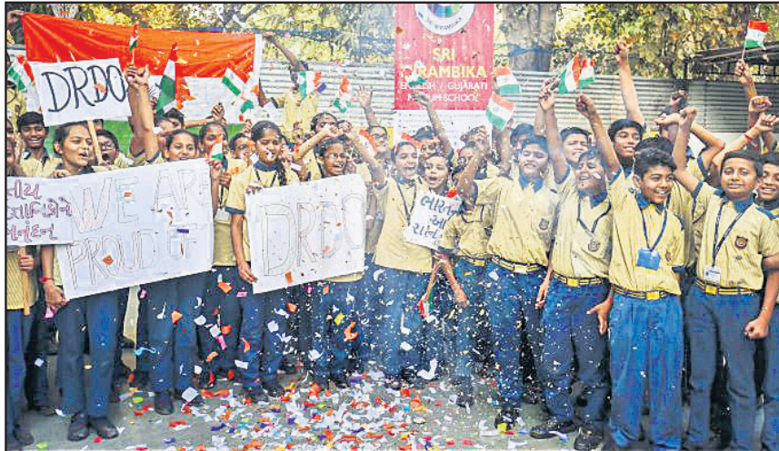
ଡିଆରଡିଓର ମିଶନ ଶକ୍ତି ସଫଳ ହେବା ପରେ ଅହମଦାବାଦର ସ୍କୁଲ ଛାତ୍ରାଛାତ୍ରୀ ଜାତୀୟ ପତାକା ଓ ପ୍ଲାକାର୍ଡ ଧରି ଉତ୍ସବ ମନାଉଛନ୍ତି।