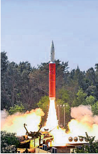
ନିଉଦିଲ୍ଲୀ, ୨୦୦୭ ଜାନୁଆରୀରେ ଚୀନର ଏବଂ ୨୦୧୫ରେ ରୁଷିଆ ସାଟେଲାଇଟ୍ ଧ୍ୱଂସ କରିବାରେ ସଫଳ ହୋଇଥିଲେ।

ନିଶ୍ଚଳ ଶକ୍ତିର ଏହି ସଫଳତା ଫଳରେ ଆମେରିକା, ଚୀନ ଓ ରୁଷିଆ ପରେ ଭାରତ ମହାକାଶ ପ୍ରସାରପାଠ୍ୟ ଏଲିଟ୍ କ୍ଲବ୍‌ରେ ସାମିଲ ହୋଇପାରିଛି।