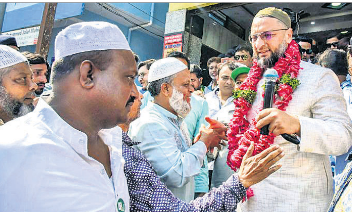
ହାଇଦ୍ରାବାଦ ଏମ୍ପି ଅସାଧୁଦିନ୍ ଓଝାଲସି ଘର ଘର ବୁଲି ପ୍ରଚାର କରୁଛନ୍ତି।

ଜାତୀୟ ରାଜନୀତିରେ ଗୁରୁତ୍ୱପୂର୍ଣ୍ଣ ଭୂମିକା ନେବାକୁ ପ୍ରୟାସରତ କେସିଆର୍ ଏବଂ ତାଙ୍କ ପୁଅ ତଥା ଟିଆର୍ଏସ୍ କାର୍ଯ୍ୟକାରୀ ଅଧକ୍ଷ କେ.ଟି. ରାମାରାଓ (କେଟିଆର୍) ଦକ୍ଷିଣ ପ୍ରଚାରକୁ କୋରୋନା କରିଛନ୍ତି। କେନ୍ଦ୍ରରେ ଅଣଭାଜପା ଏବଂ ଅଣକଂଗ୍ରେସ ସରକାର ଗଠନ ପାଇଁ ଟିଆର୍ଏସ୍ ତଥା ଏହାର ସହଯୋଗୀ ଦଳକୁ ଭୋଟ ଦେବା ପାଇଁ ମତଦାତାକୁ କେସିଆର୍ ଅନୁରୋଧ କରିଛନ୍ତି। କେଟିଆର୍ କହିଛନ୍ତି, ୨୦୧୮ ଡିସେମ୍ବର ୭ରେ ଅନୁଷ୍ଠିତ ବିଧାନସଭା ନିର୍ବାଚନରେ ଟିଆର୍ଏସ୍ ୪୭% ଭୋଟ ପାଇ ୭୫% ଆସନ ଦଖଲ କରିଥିଲା। ଚଳିତ ନିର୍ବାଚନରେ ଲୋକେ କଂଗ୍ରେସ ଓ ଭାଜପାକୁ ନେଇ ବ୍ରହ୍ମରେ ଅଛନ୍ତି। ତେଣୁ ଏଥର ମଧ୍ୟ ଆମେ ଚିତ୍ତକୁ ପ୍ରକାଶ ଯେ, ୧୧୯ ସଦସ୍ୟରା ବିଶିଷ୍ଟ ବିଧାନସଭା ନିର୍ବାଚନରେ ଟିଆର୍ଏସ୍ ୮୮ ଆସନରେ ସଫଳତା ପାଇଥିଲା। କଂଗ୍ରେସ ୧୯, ଏଆଇଏଏମଆଇଏମ୍ ୭, ତେଲୁଗୁ ଦେଶମ୍ ପାର୍ଟି (ଡିଡିପି) ୨ ଆସନ ଚିତ୍ତୁଡ଼ିବାବେଳେ ଭାଜପା ଏବଂ ଅଲ୍ ଇଣ୍ଡିଆ ଫରୱାର୍ଡ ବ୍ଲକ୍ କେବଳ ଖାତା ଖୋଲି ପାରିଥିଲେ। ୨ ସ୍ୱାଧୀନ ଏବଂ ଜଣେ ଚିଡିପି ବିଧାୟକ ଟିଆର୍ଏସ୍‌ରେ ସାମିଲ ହୋଇଛନ୍ତି। ନିଜଗରେ ୯ କଂଗ୍ରେସ ବିଧାୟକ ଟିଆର୍ଏସ୍‌ରେ ଯୋଗଦେବା ପରେ ଶାସକ ଦଳର ବିଧାୟକ ସଂଖ୍ୟା ୧୦୦ ହୁଏ। ୨୦୧୪ ଲୋକ ସଭା ନିର୍ବାଚନରେ ଟିଆର୍ଏସ୍ ୧୧ ଓ କଂଗ୍ରେସ ୨ ଆସନ ଦଖଲ କରିଥିଲେ। ସେହିପରି ଚିଡିପି, ଓଝାଲସିଆର୍ କଂଗ୍ରେସ ପାର୍ଟି, ଭାଜପା ଏବଂ ଏଆଇଏଏମଆଇଏମ୍ ଗୋଟିଏ ଲେଖାଏ ଆସନରେ ସବୁଷ୍ଟ ହେବାକୁ ପଡ଼ିଥିଲା। କଂଗ୍ରେସରେ କୌଣସି