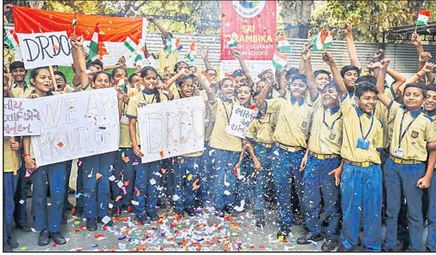
ଡିଆରଡିଓର ମିଶନ ଶକ୍ତି ସଫଳ ହେବା ପରେ ଅହମଦାବାଦର ସ୍କୁଲ ଛାତ୍ରୀଛାତ୍ର ଜାତୀୟ ପତାକା ଓ ପ୍ଲାକାର୍ଡ ଧରି ଉତ୍ସବ ମନାଉଛନ୍ତି।