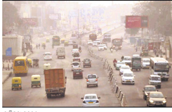
ବାଲିଗୁଡ଼ା ସହର ।

ବାଲିଗୁଡ଼ା ତଥା ଏହାର ଆଖପାଖ ଅଞ୍ଚଳରେ ଦିନକୁ ଦିନ ଯାନବାହନ ସଂଖ୍ୟା ବହୁଥିବାରୁ ପ୍ରଦୂଷଣର ମାତ୍ରା ବୃଦ୍ଧି ପାଇବାରେ ଲାଗିଛି। ସହରରେ ଯାତାୟାତ କରୁଥିବା ବିଭିନ୍ନ ଯାନବାହନରୁ ଉତ୍ପନ୍ନ ଅଙ୍ଗାରକାମୁ ଗ୍ୟାସ ବାୟୁ ପ୍ରଦୂଷଣର କାରଣ ପାଲଟିଛି।