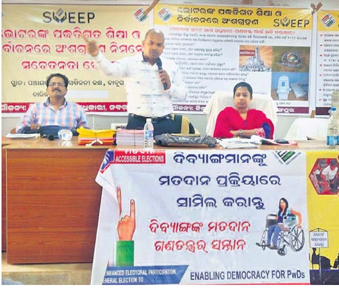
କାର୍ଯ୍ୟକ୍ରମରେ ଉପସ୍ଥିତ ଅତିଥିମାନେ ।

ବୁରୁଡ଼ା, ୨୭ମା(ଡି.ଏନ.ଏ.): ବୁରୁଡ଼ା ବ୍ଲକ୍ ବିରାଞ୍ଚପୁର ପଞ୍ଚାୟତ ରାମଚନ୍ଦ୍ରପୁର ଠାରେ ବୁଧବାର ମା' କାଆଁଶେର ଠାକୁରାଣୀଙ୍କ ମନ୍ଦିର ପ୍ରତିଷ୍ଠା ସହ ଅଷ୍ଟପ୍ରହର ନାମ ସଂକୀର୍ତ୍ତନ ଯଜ୍ଞ ସାଜକୁ ନୁହେଁ ଓ ଅନୁଯଜ୍ଞ ମଧ୍ୟ ଅନୁଷ୍ଠିତ ହୋଇଯାଇଛି।