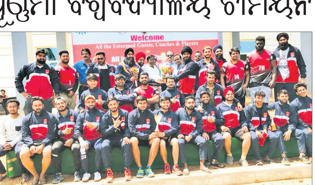
ଅତିଥିକ୍ରମରେ ଚାମ୍ପିୟନ ଚଣ୍ଡିଗଡ଼ ଦଳର ଖେଳାଳିମାନେ

ଭୁବନେଶ୍ୱର, ୨୭ ମାର୍ଚ୍ଚ (କ୍ରୀଡ଼ା ପ୍ରତିନିଧି) ଆସୋସିଏସନ ଅଫ୍ ଲକ୍ଷିଆନ ଯୁନିଭର୍ସିଟି (ଏଆଇୟୁ) ସହଯୋଗରେ କିର୍ ବିଶ୍ୱବିଦ୍ୟାଳୟ ଆନୁକୂଲ୍ୟରେ ଅନୁଷ୍ଠିତ ସର୍ବଭାରତୀୟ ଆକ୍ରମ ବିଶ୍ୱବିଦ୍ୟାଳୟ ଆମେରିକୀୟ ଫୁଟବଲ୍ (ପୁରୁଷ) ଟୁର୍ଣ୍ଣାମେଣ୍ଟରୁ ଚତୁର୍ଥାଦିନ ହୋଇଛି। ପ୍ରତିଯୋଗିତା ୨ଟି ଟ୍ୟାଲ୍ ଓ ଫ୍ଲୋ ବିଭାଗରେ ଅନୁଷ୍ଠିତ ହୋଇଥିଲା। ଚାମ୍ପିୟନ ଫୁଟବଲର ଫାଇନାଲରେ ଚଣ୍ଡିଗଡ଼ ବିଶ୍ୱବିଦ୍ୟାଳୟ ଚାମ୍ପିୟନ ଓ ପଞ୍ଜାବର ଲକ୍ଷି ରାମେଶ୍ୱରୀ ବିଶ୍ୱବିଦ୍ୟାଳୟ ରନର୍ସଅପ୍ ହୋଇଛି। କଲିକତାର ଯାଦବପୁର ବିଶ୍ୱବିଦ୍ୟାଳୟ ତୃତୀୟ ସ୍ଥାନ ଅଧିକାର କରିଛି। ସେହିପରି ଫ୍ଲୋ ଫୁଟବଲରେ ଜୟପୁରର ପୂର୍ଣ୍ଣିମା ବିଶ୍ୱବିଦ୍ୟାଳୟ ଚାମ୍ପିୟନ ହୋଇଛି। ମଣିପାଳ ବିଶ୍ୱବିଦ୍ୟାଳୟ ରନର୍ସଅପ୍ ଓ ଜୟପୁର ଗାଡ଼ାୟ ବିଶ୍ୱବିଦ୍ୟାଳୟ