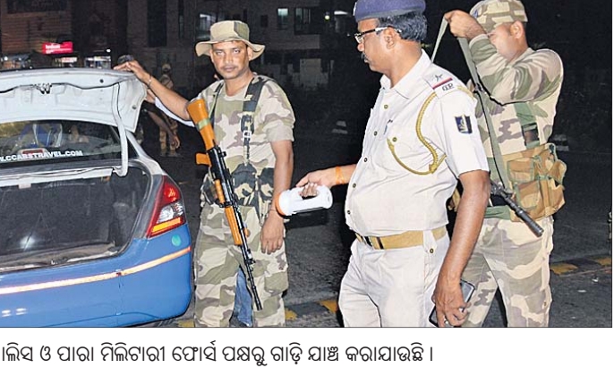
ଲାଞ୍ଜିପଲ୍ଲୀ ଓଭରବ୍ରିଜ୍ କାଟାୟ ରାକପଥରେ ପୋଲିସ୍ ଓ ପାରା ମିଳିତାଗା ଯୋର୍ସ ପକ୍ଷରୁ ଗାଡ଼ି ଯାଞ୍ଚ କରାଯାଇଛି ।