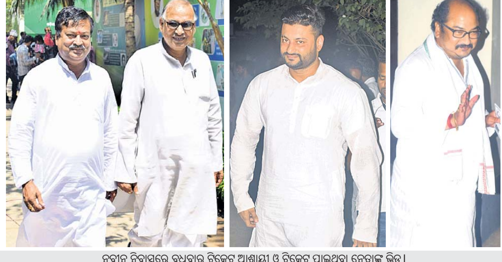
ନବୀନ ନିବାସରେ ବୁଧବାର ଟିକେଟ ଆଶାୟୀ ଓ ଟିକେଟ ପାଇଥିବା ନେତାଙ୍କ ଭିଡ଼ ।