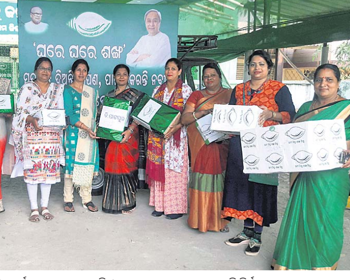
ଗଞ୍ଜାମ ଜିଲ୍ଲା ମହିଳା ବିଜେଡି ପକ୍ଷରୁ ଘରେ ଶଶି କାର୍ଯ୍ୟକ୍ରମ ଶେଷ ହୋଇଛି । ଲୋକଙ୍କ ମତାମତ ସଂଗ୍ରହ କରି ନିର୍ବାଚନ ଇସ୍ତହାରରେ ଯୋଡ଼ିବା ପାଇଁ ରାଜ୍ୟ ବିଜେଡି କାର୍ଯ୍ୟକ୍ରମକୁ ପଠାଯାଇଛି ।

ଧରାକୋଟ, ୨୭ମା(ଡି.ଏନ.ଏ.): ପ୍ରଥମରାଉନ୍ଡ୍ ଅନନ୍ତ ନାରାୟଣ ବିଦ୍ୟାପାଠରେ ମଙ୍ଗଳବାର କୁଷ୍ମର ପ୍ରଭାସ କ୍ରୀଡ଼ା ପ୍ରତିଭା ଚୟନ କାର୍ଯ୍ୟକ୍ରମ ଅନୁଷ୍ଠିତ ହୋଇଯାଇଛି।