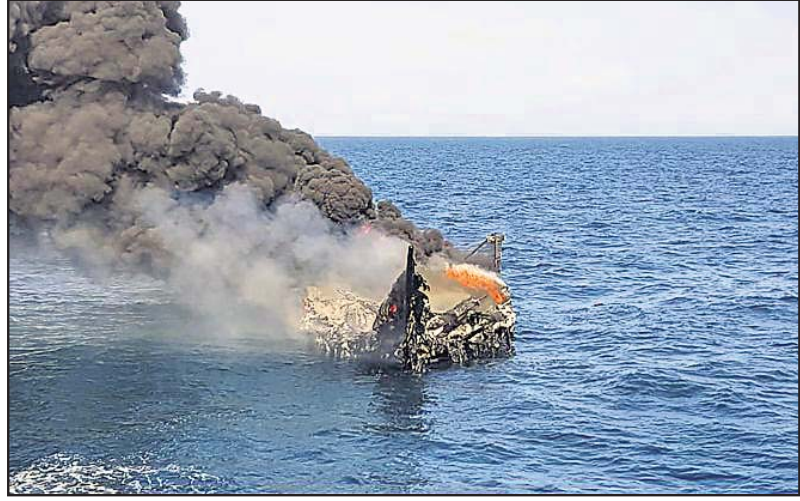
ପାକିସ୍ତାନରୁ ୫୦୦ କୋଟି ଟଙ୍କାର ତ୍ରୁଷ୍ଟ ନେଇ ପୋରବନ୍ଦର ଆସୁଥିବା ଏ ଇରାନୀ ଚାଲାଣକାରୀ ଧରାପଡ଼ିବା ପରେ ବୋର୍ଡରେ ନିଆଁ ଲଗାଇଦେଇଛନ୍ତି।