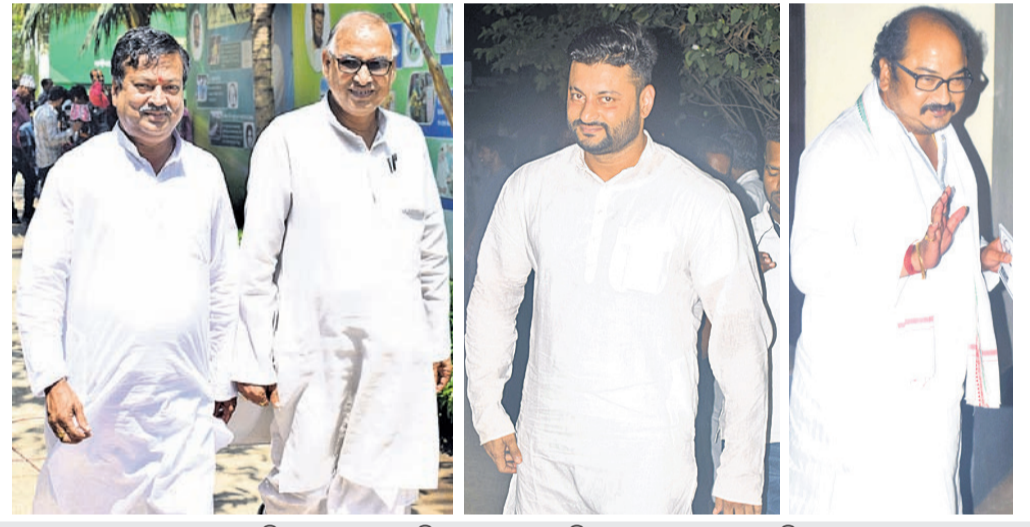
ନବୀନ ନିବାସରେ ବୁଧବାର ଚିକେଟ୍ ଆଣାୟା ଓ ଚିକେଟ୍ ପାଇଥିବା ନେତାଙ୍କ ଭିଡ଼।