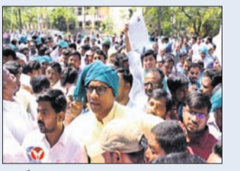
ପ୍ରାର୍ଥା ହୋଇଛନ୍ତି। ତେବେ ଏହି ଆସନ ପାଇଁ ୨୦୦ରୁ ଉର୍ଦ୍ଧ୍ୱ କୃଷକ