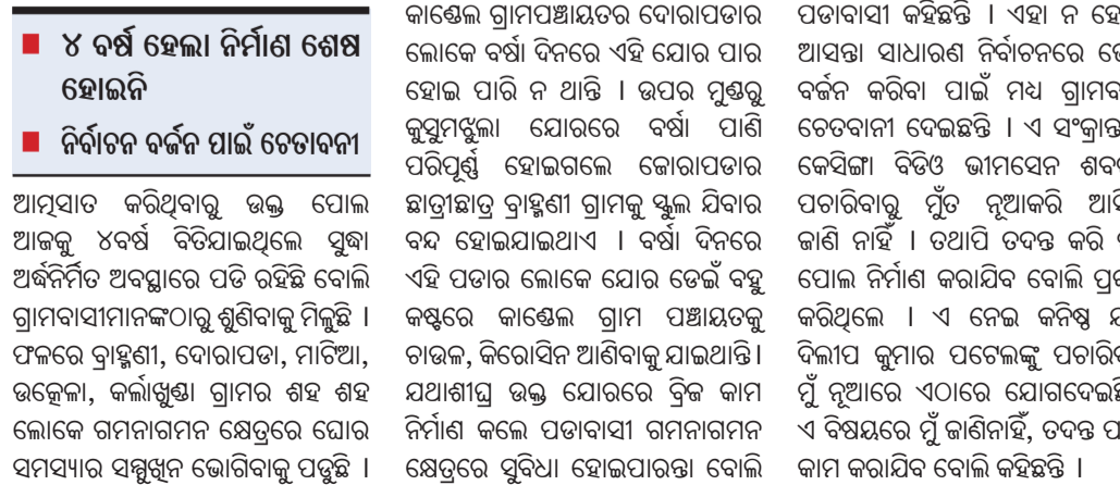
ଅର୍ଦ୍ଧ ନିର୍ମିତ ଅବସ୍ଥାରେ ପତିରହିଥିବା କୁସୁମଝୁଲା ପୋଲ।

କଳାହାଣ୍ଡି ଜିଲ୍ଲା କେପିଜି ବ୍ଲକ୍ ଅନ୍ତର୍ଗତ କାଣ୍ଡୋଳା ଗ୍ରାମପଞ୍ଚାୟତର ସୋଲାର ପ୍ଲାଣ୍ଟ ନିକଟରେ ଥିବା କୁସୁମଝୁଲା ପୋଲ ୪ ବର୍ଷ ହେଲା ଅର୍ଦ୍ଧନିର୍ମିତ ଅବସ୍ଥାରେ ପତି ରହିଛି।