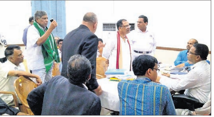
ରିଟର୍ନ ଅଫିସରଙ୍କ ନିକଟରେ ଅଭିଯୋଗ କରାଯାଉଛି ।

■ ହିଞ୍ଜିଳି ବିଧାନସଭା ଆସନ ନବୀନଙ୍କ ନାମାଙ୍କନରେ ଭୁଟି ରହିଛି: ପୀତାମ୍ବର