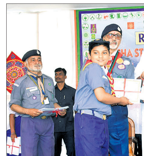
ଉତ୍ସବରେ ରାଜ୍ୟପାଳ ପ୍ରଫେସର ଗଣେଶ ଲାଲ ପୁରସ୍କାର ପ୍ରଦାନ କରୁଛନ୍ତି।

କଳାହାଣ୍ଡି ଜିଲ୍ଲା ନର୍ମା ଥାନା ଅନ୍ତର୍ଗତ ଲମସିଂହା ଗାଁର ଏକ ଯୌତୁକ ନିର୍ମାଣ ପ୍ରକଳ୍ପର ଚାଳନା କରାଯାଇଛି।