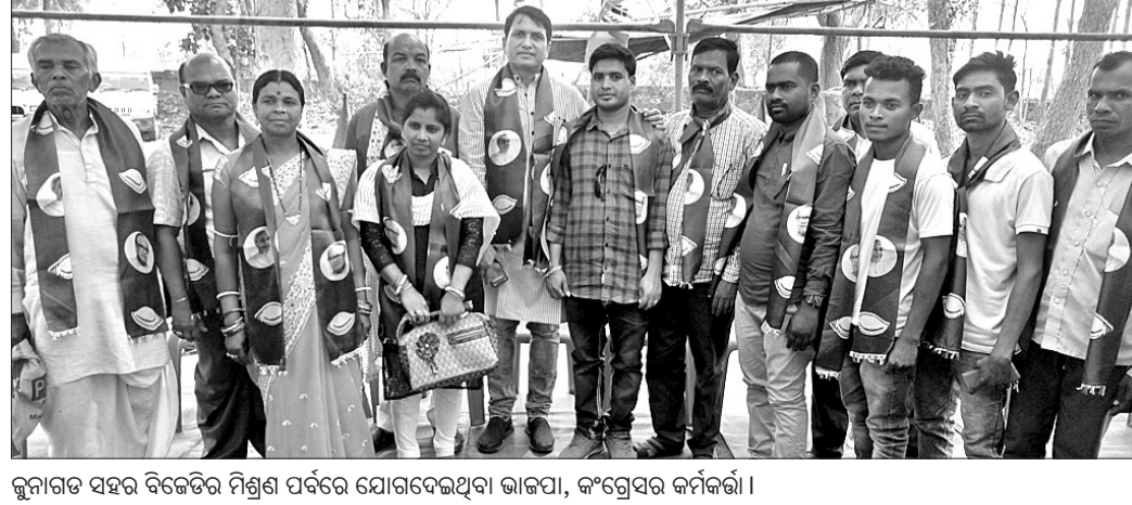
ଜୁନାଗଡ଼ ସହର ବିଜେଡିର ମିଶ୍ରଣ ପର୍ବରେ ଯୋଗଦେଇଥିବା ଭାଜପା, କଂଗ୍ରେସର କର୍ମକର୍ତ୍ତା।