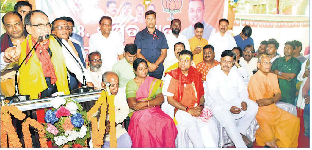
ପୁରୀ ଲୋକ ସଭା ଭାଙ୍ଗପା ପ୍ରାର୍ଥୀ ସମିତ ପାତ୍ରଙ୍କ କାର୍ଯ୍ୟାଳୟ ଉଦ୍‌ଦାନ ଉତ୍ସବରେ ଶିବରାଜ ସିଂ ରୌହାନ ଉଦ୍‌ଦାନକ୍ରମେ ବେଲିଛନ୍ତି।

ଓଡ଼ିଶାରେ ୧୯ ବର୍ଷ ଧରି ଶାସନ କ୍ଷମତାରେ ରହିଥିବା ବିଚେତ୍ର ସରକାର ଦୁର୍ନୀତି, ଭ୍ରଷ୍ଟାଚାରରେ ବୁଡ଼ିରହିଛି। ଏଠାରେ ମହିଳା, ଯୁବକା ସୁରକ୍ଷିତ ନୁହେଁ। ଭ୍ରଷ୍ଟାଚାରକୁ ସୁରକ୍ଷା ଯୋଗାଇ ଦିଆଯାଉଛି। କିନ୍ତୁ ଦିନକୁ ଦିନ ନା, ଭରଣାଳ ଉପରେ ନିର୍ଭରତା, ହିଂସା ବଢ଼ିଛି ବୋଲି କହିଛନ୍ତି ଭାଙ୍ଗପା ରାହୁଲ ଉପସଭାପତି ତଥା ମଧ୍ୟପ୍ରଦେଶର ପୂର୍ବତନ ମୁଖ୍ୟମନ୍ତ୍ରୀ ଶିବରାଜ ସିଂ ରୌହାନ। ବୁଧବାର ପୁରୀ ଲୋକ ସଭା ଭାଙ୍ଗପା ପ୍ରାର୍ଥୀ ସମିତ ପାତ୍ରଙ୍କ କାର୍ଯ୍ୟାଳୟକୁ ଉଦ୍‌ଦାନ କରି ରୌହାନ ଓଡ଼ିଶାର ମୁଖ୍ୟମନ୍ତ୍ରୀ ନବୀନ ପଟ୍ଟନାୟକ ଏବଂ କଂଗ୍ରେସ ଅଧ୍ୟକ୍ଷ ରାହୁଲ ଗାନ୍ଧୀଙ୍କୁ ଚାର୍ଗେଟ କରିଥିଲେ। ରୌହାନ କହିଥିଲେ, ଓଡ଼ିଶା ସରକାରଙ୍କ ବାସ୍ତବରେ ଗଣାଙ୍କ ପ୍ରତି ବରଦ ନାହିଁ। ଯଦି କୃଷକଙ୍କ ପ୍ରତି ସାମାଜ୍ୟତମ ସହାୟତା ଦେବାକୁ ଚେତେ କାଳିଆ ଯୋଜନା ଏବେ କାର୍ଯ୍ୟକ, ବହୁ ପୂର୍ବରୁ ଯୋଜନା କରିପାରିଥାନ୍ତେ। ନିର୍ବାଚନ ପୂର୍ବରୁ କୃଷି, କୃଷକଙ୍କ କଥା ସମ୍ବନ୍ଧରେ ଆଇନକାଳ କେତେ ଚାହା ଓଡ଼ିଶାବାସୀ ନିଶ୍ଚିତ ବୁଝିପାରୁଥିବେ। ଏତେବର୍ଷ ଶାସନରେ ରହିବା ପରେ ବି କୋପ ମୁଖ୍ୟମନ୍ତ୍ରୀ ଓଡ଼ିଆ କହି ନ ପାରିବା ମୁଁ ବୁଝିପାରୁ ନାହିଁ ବୋଲି କହି ନବୀନଙ୍କୁ ଚାର୍ଗେଟ କରିଥିଲେ ରୌହାନ। ପୁଲଖୀମା ଆଟକବାଦୀ ଆକ୍ରମଣ ଘଟଣାରେ