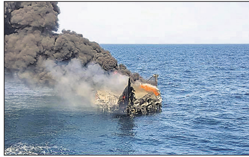
ପାକିସ୍ତାନରୁ ୫୦୦ କୋଟି ଟଙ୍କାର ଭୁଗ୍ଗ ନେଇ ପୋରତ୍ତର ଆସୁଥିବା ୯ ଲାଜାଣୀ ଚାଳାଣକାରୀ ଧରାପଡ଼ିବା ପରେ ବୋଟରେ ନିଆଁ ଲାଗାଇଦେଇଛି।