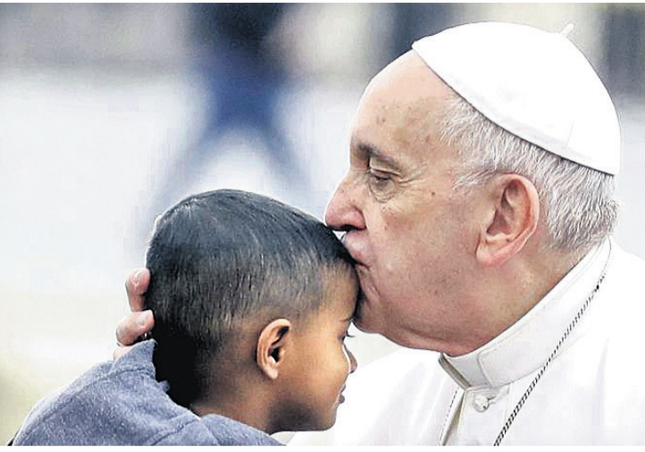
ପୋପ୍ ଫ୍ରାନ୍ସିସ୍ ରୂଧିର ଭାଟିକାନ ସିଟିର ସେକ୍ସ ପିଟର୍ସ ଷୋୟାରରେ ଜଣେ ଶିଶୁଙ୍କୁ ଚୁମ୍ବନ ଦେଉଛନ୍ତି।