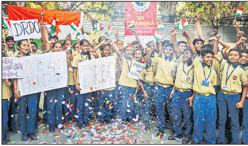
ଡିଆରଡିଓର ମିଶନ ଶକ୍ତି ସଫଳ ହେବା ପରେ ଅହମଦାବାଦର ସ୍କୁଲ ଛାତ୍ରୀଛାତ୍ର ଜାତୀୟ ପତାକା ଓ ପ୍ଲାକାର୍ଡ ଧରି ଉତ୍ସବ ମନାଉଛନ୍ତି।