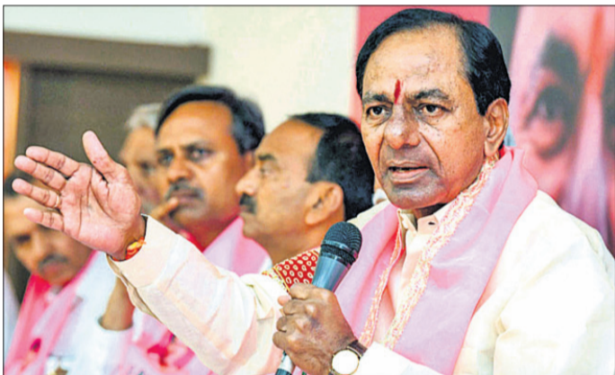
ତେଲେଙ୍ଗାଣା ମୁଖ୍ୟମନ୍ତ୍ରୀ ତଥା ତିଆରୁବନ୍ଦ ଅଧ୍ୟକ୍ଷ କେ. ଚନ୍ଦ୍ରଶେଖର ରାଓ।

ତେଲେଙ୍ଗାଣାରେ ନିକଟରେ ଅନୁଷ୍ଠିତ ବିଧାନସଭା ନିର୍ବାଚନରେ ବିପ୍ଲବ ବିକ୍ରମ ପରେ ଶାସକ ତେଲେଙ୍ଗାଣା ରାଷ୍ଟ୍ର ସମିତି (ତିଆରୁବନ୍ଦ) ସାଧାରଣ ନିର୍ବାଚନର ମଇଲିସାମାନ୍ୟ ଉଦ୍ଦିଷ୍ଟ। ବିରୋଧୀ ଦଳଗୁଡ଼ିକ ମଧ୍ୟରେ ବୈରାଗ୍ୟ ଭରିରହିଥିବାବେଳେ ୧୭ରୁ ୧୬ ଲୋକ ସଭା ଆସନ ଦଖଲ ନିଶ୍ଚୟ ହେବ ବୋଲି ମୁଖ୍ୟମନ୍ତ୍ରୀ କେ. ଚନ୍ଦ୍ରଶେଖର ରାଓ (କେଏଆର୍)ଙ୍କ ନେତୃତ୍ୱାଧୀନ ତିଆରୁବନ୍ଦା ଡେମୋକ୍ରାଟିକ ଆଲିୟାନ୍ସ ଓ କଂଗ୍ରେସ ଏଥର ଭିନ୍ନ ରଣନୀତି ଆପଣାଇଥିବାରୁ ତ୍ରିମୁଖୀ ଲଢ଼େଇ ହେବ ବୋଲି ରାଜନୈତିକ ବିଶ୍ଳେଷକମାନେ ମତବ୍ୟକ୍ତ କରିଛନ୍ତି।