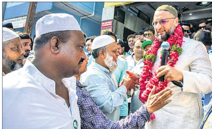
ହାଇଦ୍ରାବାଦ ଏମ୍ପିଏ ଅସାଦୁଦ୍ଦିନ ଓଖାଇସି ଘର ଘର ଭୁଲି ପ୍ରଚାର କରୁଛନ୍ତି।