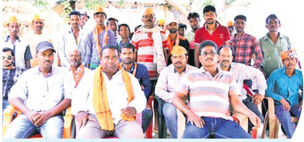
ଭାଜପାରେ ସାମିଲ ଅନ୍ୟ ଦଳର କର୍ମୀ।