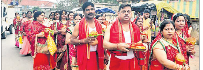
ମହିଳାପୁଞ୍ଜଙ୍କ କଳସ ଶୋଭାଯାତ୍ରା।

ବ୍ୟାଙ୍କ ସମ୍ମୁଖରେ ପଞ୍ଚୁ ଜଳ ନେଇ ପୂଜା ଆରମ୍ଭ କରିଛନ୍ତି। ସମ୍ପାରେ ଆରତି ପରେ ଭଜନ ସମାବେଶ କାର୍ଯ୍ୟକ୍ରମ ମାରାତ୍ମିତ ରାମଭବନଠାରେ ଅନୁଷ୍ଠିତ ହୋଇଛି। ୨୯ରେ ମା'ଙ୍କ ପୂଜାସେବ ଶାସ୍ତ୍ରମତେ କରାଯାଇ ହୋମପୂଜା, ସମ୍ପା ଆରତୀ ଏବଂ ସାଂସ୍କୃତିକ କାର୍ଯ୍ୟକ୍ରମ ରହିଛି। ୩୦ରେ ଆରତି ଏବଂ ପ୍ରସାଦ ସେବନର ବ୍ୟବସ୍ଥା ରହିଛି। ୩୧ତାରିଖରେ ବିଶେଷ ପୂଜାର୍ଚ୍ଚନା, ବିସର୍ଜନ ପୂଜା ଏବଂ ପ୍ରସାଦ ସେବନର ବ୍ୟବସ୍ଥା ରହିଥିବା ବେଳେ ଏହି ଦିନ ଜିଲ୍ଲାର ବିଭିନ୍ନ ପ୍ରାନ୍ତରୁ ଶ୍ରଦ୍ଧାଳୁଙ୍କ ଭିଡ ହୋଇଥାଏ। ସୂଚନାଯୋଗ୍ୟ ଯେ, ପ୍ରତ୍ୟେକ ବର୍ଷ ମାହୁରା ସମାଜ ପକ୍ଷରୁ ପଞ୍ଚୁ ମାସ ହୋଇ ପରେ ମା' ମଥୁରାସିନୀଙ୍କ ପୂଜା ରୀତିନୀତି ସହ ଅନୁଷ୍ଠିତ ହୋଇଥାଏ।