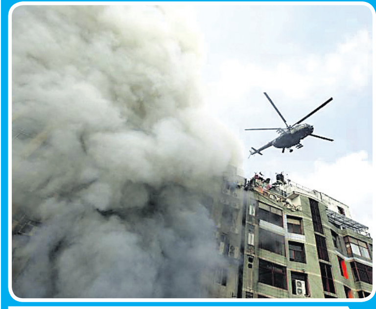
ବାଂଲାଦେଶ ରାଜଧାନୀ ଡାକାର ବନାନୀ କମିଟିଆଲ୍ ଡିଷ୍ଟ୍ରିକ୍ଟର ଏମ୍.ଆର୍. ଗାଁଘାରେ ଗୁରୁବାର ଅପରାହ୍ନରେ ଅଗ୍ନିକାଣ୍ଡ ଘଟି ୭ ଜୀବନ ବ୍ୟତୀ ହୋଇଛନ୍ତି । ଫସିରହିଥିବା ଲୋକଙ୍କୁ ହେଲିକପ୍ଟର ଯୋଗେ ଉଦ୍ଧାର କରାଯାଇଛି ।

୨୦୧୪ ମାର୍ଚ୍ଚ ୨୯ରେ ଲାଙ୍ଗ୍ ଓ ଫ୍ରେଲ୍ସରେ ପ୍ରଥମକରି ସମଲିଙ୍ଗ ବିବାହ ଅନୁଷ୍ଠିତ ହୋଇଥିଲା । ବ୍ରିଟେନର ବିଭିନ୍ନ ଭାଗରେ ସମଲିଙ୍ଗ ବିବାହ ମାନ୍ୟତା ଭିନ୍ନ ଭିନ୍ନ । ଲାଙ୍ଗ୍, ସ୍କଟ୍ଲାଣ୍ଡ ଏବଂ ଫ୍ରେଲ୍ସରେ ସମଲିଙ୍ଗ ବିବାହ କରାଯାଇଥିବା ବେଳେ ନର୍ଦ୍ଦର୍ ଆୟର୍ଲାଣ୍ଡରେ ଏହା କରାଯାଏ ନାହିଁ ।