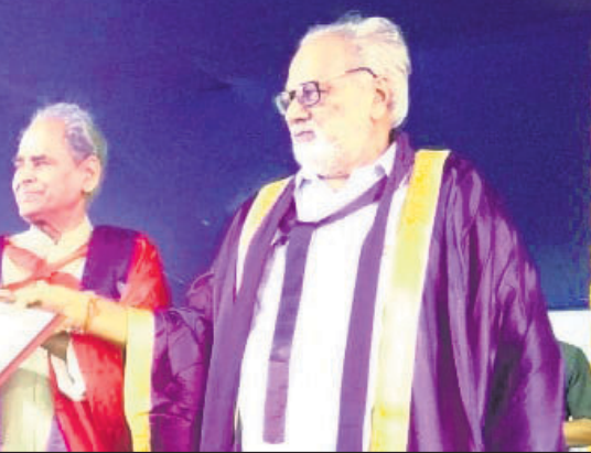
ଜଣେ ଛାତ୍ରୀଙ୍କୁ ସମ୍ମାନିତ କରାଯାଇଛି।