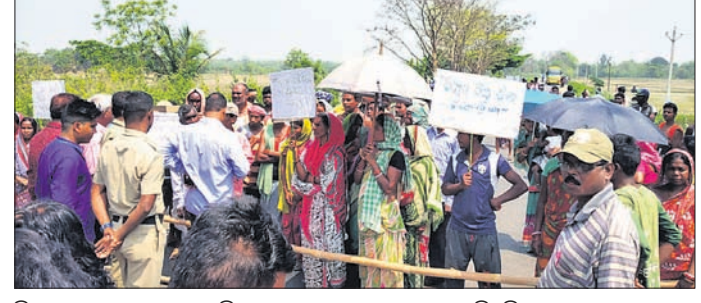
ବିଦ୍ୟୁତ୍ ସଂଯୋଗ ବେକାଳାରି ଗ୍ରାମବାସୀ ରାସ୍ତା ଅବରୋଧ କରିଛନ୍ତି।

ମୟୂରଭଞ୍ଜ ଜିଲ୍ଲା ଖୁଣ୍ଟା ଥାନା ଅଧୀନ ବାରିପଦା ରାଜ୍ୟ ରାଜପଥର ବସିପିଠାଠାରେ ବିଦ୍ୟୁତ୍ ସଂଯୋଗ କାଟିବା ନେଇ ରାସ୍ତା ଅବରୋଧ ହୋଇଥିବା ଜଣାପଡ଼ିଛି। ପ୍ରାୟ ୧ ଘଣ୍ଟା ଧରି ରାସ୍ତା ଅବରୋଧ ଫଳରେ ସାଧାରଣ ଜୀବନ ଯାତ୍ରା ବ୍ୟାହତ ହୋଇଥିଲା।