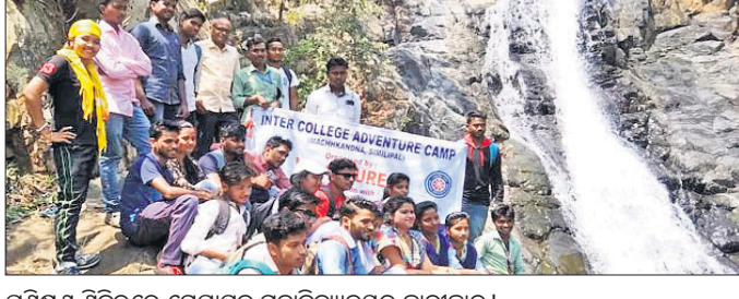
ପ୍ରଶିକ୍ଷଣ ଶିବିରରେ ମେଘାସନ ମହାବିଦ୍ୟାଳୟର ଛାତ୍ରାଛାତ୍ରୀ।

ତଥା ଉତ୍ତମାପିତ କାର୍ଯ୍ୟ ସମ୍ପର୍କରେ ଶିକ୍ଷା ପ୍ରଦାନ କରାଯାଇଥିଲା। ଉଦ୍ଘାଟନା ଦିବସରେ ସ୍ୱେଚ୍ଛାସେବୀମାନେ ନିକଟବର୍ତ୍ତୀ ମନକଣ୍ଡା ଗ୍ରାମରେ ଭୋଗ ସଚେତନତା କାର୍ଯ୍ୟକ୍ରମରେ ଆୟୋଜନ କରି ଘରକୁ ଘର ବୁଲି ଭୋଗଦାନ ଅଧିକାର ସମ୍ପର୍କରେ ଶିବିର ଉଦ୍ଘାଟିତ ହୋଇଯାଇଛି।