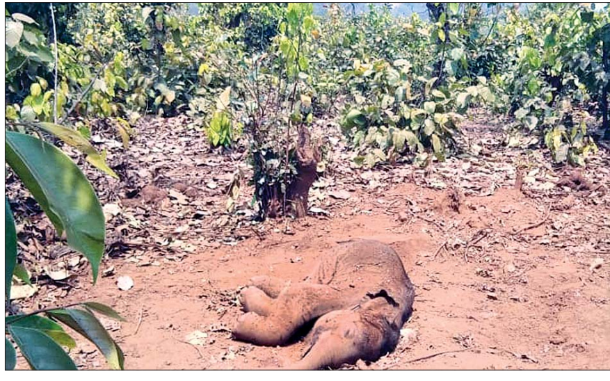
ମୃତ ହାତୀ ଶାବକ।

ଯୋଡ଼ା/ଚମ୍ପୁଆ/ଝୁମୁରା, ୨୮୩(ଡି.ଏନ.ଏ.) ଚମ୍ପୁଆ ରେଞ୍ଜ ବାମେବାରୀ ବନାଞ୍ଚଳ ଅନ୍ତର୍ଗତ ହାତୀମରା ଛକ ନିକଟ ମହାପର୍ବତ ପାଦଦେଶରେ ଥିବା ଜଙ୍ଗଲରେ ଗୁରୁବାର ଏକ ହାତୀ ଶାବକର ମୃତଦେହ ଠାବ ହୋଇଛି। ହାତୀମରା ଛକ ପାର୍ଶ୍ଵ ଗ୍ରାମବାସୀ ଏ ନେଇ ବାମେବାରୀ ଫରେଷ୍ଟ କାର୍ଯ୍ୟାଳୟକୁ ସୂଚନା ଦେବା ପରେ ଏହି ଘଟଣା ପଦାକୁ ଆସିଥିଲା।