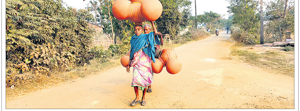
ଖରାଦିନେ ମାଟି ପାତ୍ରର ଚାହିଦା ଅଧିକ: ସିପୁଲିଆ ରୁକ୍ ମାକୋଣା ଗାଁ ରାସ୍ତାରେ ଦୁଇ ବିକାଳି ମାଟି ହାଣ୍ଡି ନେଇ ଯାଉଛନ୍ତି।