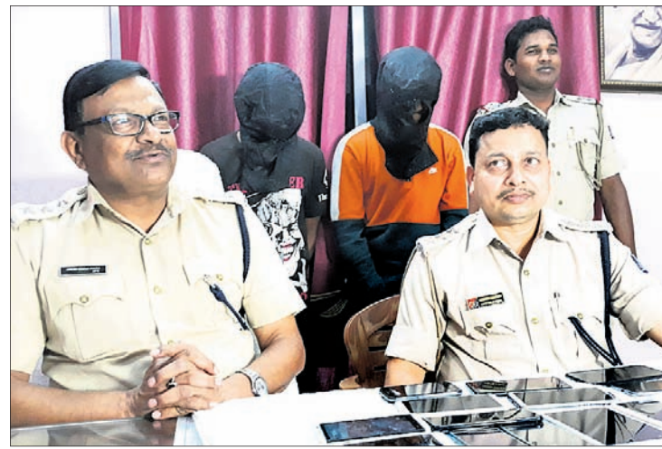
ସହଦେବଖୁଣ୍ଟା ଥାନାରେ ଗିରଫ ୨ ମୋବାଇଲ ଚୋର।

ଅଭିଯୋଗ କରିବା ପରେ ଏକ ମାମଲା (ନଂ.୧୮୦/୧୮) ରୁଜୁ କରାଯାଇଥିଲା। ସେହିଦିନଠାରୁ ପୋଲିସ୍ ମୋବାଇଲକୁ ଟ୍ରାକ୍ କରିଆରେ ନଜର ରଖିଥିଲା।