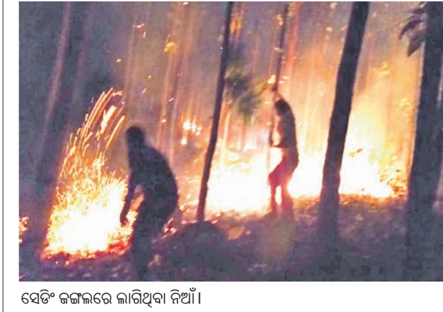
ସେତିଂ ଜଙ୍ଗଲରେ ଲାଗିଥିବା ନିଆଁ।

ଭୟଙ୍କର ରୂପ ନେଇ ସାରିଥିଲା। ଦୂରରୁ ନିଆଁ ଦେଖି ବିକାଶ କୁମାର ଓ କର୍ମଚାରୀଙ୍କ ସହ ଯୋଗାଯୋଗ କରିଥିଲେ। କୌଣସି ସୂଚନା ମିଳି ନ ଥିଲା। ନିଆଁ ବଡ଼ ଚାଲିଥିଲା। ପରେ କୌଣସି ଉପାୟ ନ ପାଇ ବିକାଶ ଦୂରତ ଅଗ୍ନିଶମ କର୍ମଚାରୀଙ୍କ ସହାୟତା ନେଇଥିଲେ। ଦୀର୍ଘ ସଞ୍ଚ ପରେ ନିଆଁ ଲିଭା ଯାଇଥିଲା।