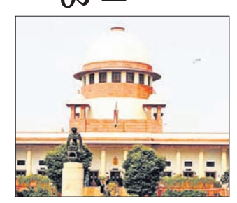
ଆବେଦନକାରୀ ଅନୁଭବ କରିଥିଲେ ।

ନୂଆଦିଲ୍ଲୀ: 'ରାମ କା ଜନ୍ମଭୂମି' ରିଲିଜ୍ ହେବାଦ୍ୱାରା ଅଯୋଧ୍ୟା ବିବାଦର ସମାଧାନ ପାଇଁ ବର୍ତ୍ତମାନ ମଧ୍ୟସ୍ଥତା ପଛଟିକୁ କୌଣସି ପ୍ରକାରେ ପ୍ରଭାବିତ କରିବ ନାହିଁ ବୋଲି ସୁପ୍ରିମକୋର୍ଟ ଗୁରୁବାର ସଂସ୍କ କରିଛନ୍ତି । ବିଚାରପତି ଏସ୍.ଏ. ବୋବ୍‌ଡେ ଏବଂ ବିଚାରପତି ଏସ୍. ଅଭୂଲ୍ ନରକଙ୍କୁ ନେଇ ଗଠିତ ଖଣ୍ଡପୀଠ ସମ୍ମୁଖରେ ଉକ୍ତ ପିଲ୍‌ଲ ରିଲିଜ୍ ଉପରେ ସ୍ଥିତିବାଦେଶ ପାଇଁ କରାଯାଇଥିବା ଆବେଦନର କରୁଣା ଶୁଣାଣିକୁ ଅଗ୍ରାହ୍ୟ କରିଦିଆଯାଇଛି । ଏହା ରିଲିଜ୍ ହେଲେ ସାମ୍ପ୍ରଦାୟିକ ଉତ୍ତେଜନା ସୃଷ୍ଟିହେବା ସହିତ ବର୍ତ୍ତମାନ ଅଯୋଧ୍ୟା ବିବାଦ ମଧ୍ୟସ୍ଥତା ପ୍ରଭାବିତ ହୋଇପାରେ ବୋଲି