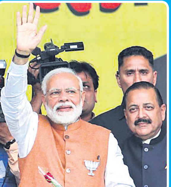
ଜଣ୍ଟ ନିକଟସ୍ଥ ଭୂମି ଗ୍ରାମରେ ଭାଜପାର ଏକ ନିର୍ବାଚନୀ ସଭାରେ ପ୍ରଧାନମନ୍ତ୍ରୀ ନରେନ୍ଦ୍ର ମୋଦି ।