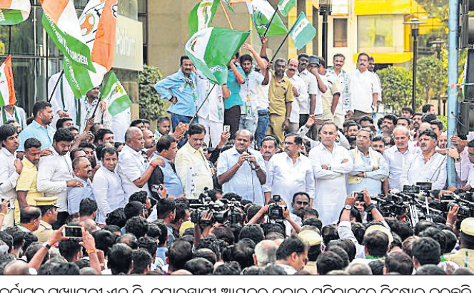
କର୍ମାଚକ ମୁଖ୍ୟମନ୍ତ୍ରୀ ଏଚ୍.ଡି. କୁମାରସାମୀ ଆଇକର ଚଢ଼ାଉ ପ୍ରତିବାଦରେ ବିରୋଧ କରୁଛନ୍ତି ।