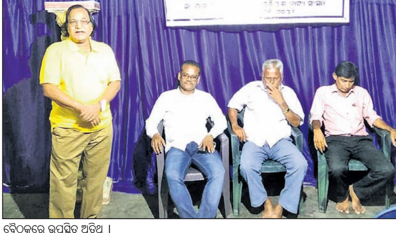
ବୈଠକରେ ଉପସ୍ଥିତ ଅତିଥି।