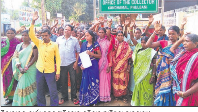
ଜିଲ୍ଲାପାଳଙ୍କ କାର୍ଯ୍ୟାଳୟକୁ ଅଭିଯୋଗ କରିବାକୁ ଆସିଥିବା ଗ୍ରାମବାସୀ।

ଖଜୁରିପଡ଼ା, ୨୮।୩।(ଡି.ଏନ୍.ଏ.) କନ୍ଧମାଳ ଜିଲ୍ଲା ଖଜୁରିପଡ଼ା ବ୍ଲକ୍ରେ ବିଳାସାଧି ପଞ୍ଚାୟତସଭା ବିଚଳି ସମସ୍ୟା ମଧ୍ୟରେ ଅଛନ୍ତି। ଏହାର ସମାଧାନ ନେଇ ମଙ୍ଗଳବାର ଗ୍ରାମବାସୀ ଜିଲ୍ଲାପାଳଙ୍କ କାର୍ଯ୍ୟାଳୟ ଆସି ଅଭିଯୋଗ ପତ୍ର ପ୍ରଦାନ କରିଛନ୍ତି। ବ୍ଲକ୍ରେ ୧୪ ପଞ୍ଚାୟତରୁ ବିଳାସାଧି ଗ୍ରାମପଞ୍ଚାୟତ ଅନ୍ୟତମ। ୨୫ ଶହରୁ ଊର୍ଦ୍ଧ୍ୱ ଜନସଂଖ୍ୟା ବିଶିଷ୍ଟ ଏହି ପଞ୍ଚାୟତରେ ୧୯ଶହରୁ ଅଧିକ ମତଦାତା ରହିଛନ୍ତି। ଫୁଲବାଣୀରୁ ବୌଦ୍ଧ ଜିଲ୍ଲା ସଂଯୋଗ କରୁଥିବା ୧୫୬ ନଂ. ଜାତୀୟ ରାଜପଥର ପାଖରେ ଓଲଟି ପଡ଼ିଥିବା ପଞ୍ଚାୟତ କାର୍ଯ୍ୟାଳୟ ଯିବାକୁ ହେଲେ ୧୧ କି.ମି ଦୂର ପଡ଼ିଥାଏ। ୪ରୁ ୫ ବର୍ଷ ହେଲା ପଞ୍ଚାୟତ କାର୍ଯ୍ୟାଳୟ ଯିବାପାଇଁ ରାସ୍ତା ନିର୍ମାଣ କାର୍ଯ୍ୟ ଆରମ୍ଭ ହୋଇଥିଲା। କିନ୍ତୁ ତାହା