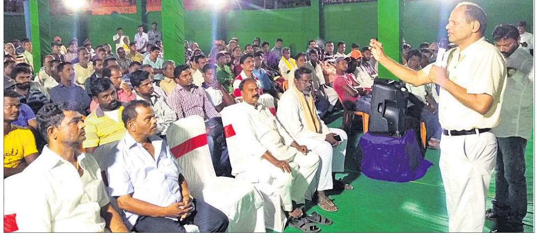
କର୍ମୀ ସମାବେଶରେ ଜିଲା ସଭାପତିଙ୍କ ଉଦ୍‌ବୋଧନ ।

ଗୋପାଳପୁର ନିର୍ବାଚନ ମଣ୍ଡଳୀସ୍ତରୀୟ ବିଜେଡି କର୍ମୀ ସମ୍ମିଳନୀ ଗୁରୁବାର ବ୍ରହ୍ମପୁରରେ ଅନୁଷ୍ଠିତ ହୋଇଯାଇଛି । ରଙ୍ଗେଇକୁଣ୍ଡା ବ୍ଲକର ୩୨ ଏବଂ କୁକୁଡ଼ାଖଣ୍ଡି ବ୍ଲକର ୫ ପଞ୍ଚାୟତ ଓ ଗୋପାଳପୁର ଏନ୍‌ଏସ୍‌ସିର ଦଳୀୟ କର୍ମୀ, ବ୍ଲକ କର୍ମକର୍ତ୍ତା, ଜିଲା ପରିଷଦ ସଦସ୍ୟା, ସଦସ୍ୟ, ସରପଞ୍ଚ ଓ ସମିତିସଭା ସଭ୍ୟ ଏଥିରେ ଯୋଗ ଦେଇଥିଲେ । ବିଧାୟକ