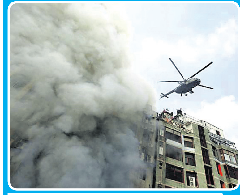
ବାଲାରରେ ରାଜଧାନୀ ଭାବରେ ବନାନୀ କମିଶନାଟି ଡିସ୍ଟିକ୍ଟର ଏମ୍.ଆର୍. ଗଠାଏରେ ଗୁରୁବାର ଅପରାହ୍ଣରେ ଅଭିଯାନ ଘଟି ୭ ଜୀବନ ବନ୍ଧୁ ହୋଇଛନ୍ତି । ଫସିରହିଥିବା ଲୋକଙ୍କୁ ହେଲିକପ୍ଟର ଯୋଗେ ଉଦ୍ଧାର କରାଯାଇଛି ।

୨୦୧୪ ମାର୍ଚ୍ଚ ୨୯ରେ ଲଙ୍କା ଓ ଫ୍ରେଲ୍‌ସରେ ପ୍ରଥମକରି ସମଲିଙ୍ଗ ବିବାହ ଅନୁଷ୍ଠିତ ହୋଇଥିଲା । ବ୍ରିଟେନର ବିଭିନ୍ନ ଭାଗରେ ସମଲିଙ୍ଗ ବିବାହ ମାନ୍ୟତା ଭିନ୍ନ ଭିନ୍ନ । ଲଙ୍କା, ଇଂଲଣ୍ଡ ଏବଂ ଫ୍ରେଲ୍‌ସରେ ସମଲିଙ୍ଗ ବିବାହ କରାଯାଉଥିବା ବେଳେ ନର୍ଦ୍ଦର୍ ଆୟର୍‌ଲାଣ୍ଡରେ ଏହା କରାଯାଏ ନାହିଁ ।