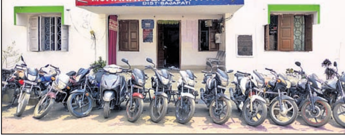
ଜବତ ହୋଇଥିବା ବାଇକ୍।