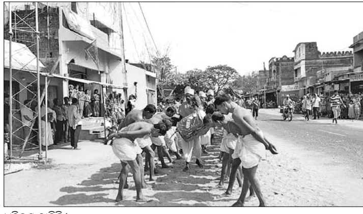
ଧୂଳିଦଣ୍ଡ ଚାଲିଛି। ସ୍ଥାନରେ ଏହାକୁ କେହି ମାନ୍ୟତା ଦେଇ ନାହାନ୍ତି। ଗୋଟିଏ ପଡ଼େ ଦଣ୍ଡନାଟ ଅନ୍ୟପଡ଼େ

ଭଞ୍ଜନଗର, ୨୮ମାର୍ଚ୍ଚ(ଡି.ଏନ.ଏ.): ଗଞ୍ଜାମ ଜିଲାର ପ୍ରସିଦ୍ଧ ଦଣ୍ଡନାଟ କେତେକ ଜାଗାରେ ଆରମ୍ଭ ହୋଇଗଲାଣି। ଆଗକୁ ଆଉ କିଛି ସ୍ଥାନରେ ମଧ୍ୟ ମା' ଦଣ୍ଡକାଳୀଙ୍କୁ ଆବାହନ କରାଯିବ। ମାସକ ମେଢୁ ଓ ସଂକ୍ରାନ୍ତିରେ ଦଣ୍ଡନାଟ ଉଦ୍‌ଘାଟନ ହେବ। ଜିଲ୍ଲା, ଡି.ଏସ୍‌ଡିଓଙ୍କ ଆଦି ଗ୍ରାମରେ ଦଣ୍ଡନାଟ ଆରମ୍ଭ ହୋଇଥିବା ବେଳେ ୧ରେ ଜିଲାର ପ୍ରସିଦ୍ଧ ଗାଲେରି ଦଣ୍ଡ ଉଠିବ। ଏଥିପାଇଁ ଆୟୋଜକଙ୍କ ପକ୍ଷରୁ ପ୍ରସ୍ତୁତି ଚାଲିଛି। ଦଣ୍ଡନାଟ ଅବସରରେ ରାତିରେ ହେଉଥିବା ସାଂସ୍କୃତିକ କାର୍ଯ୍ୟକ୍ରମରେ ଅଶ୍ୱାଳ ନୃତ୍ୟକୁ କଟକଣା ହୋଇଥିଲେ ମଧ୍ୟ କେତେକ