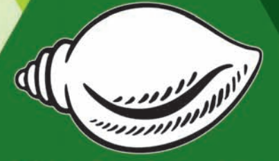
ବିଜୁ ଜନତା ଦଳ

୨୧ ରୁ ୨୧ ରେ 'ଶଙ୍ଖ'କୁ ଜିତାଇବା ଓଡ଼ିଶାର ହକ୍ ପାଇଁ ଲଢ଼ିବା ।