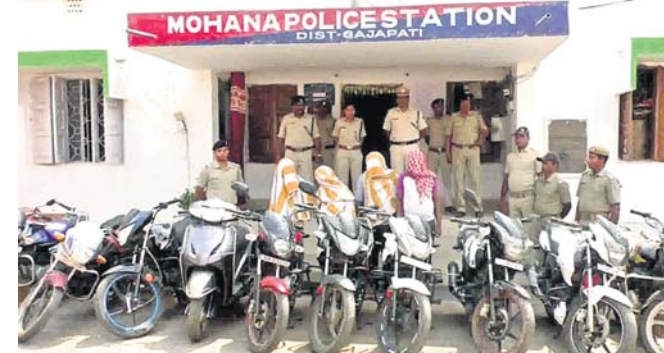
ଗିରଫ ଅଭିଯୁକ୍ତ ସହ ଜବତ ବାଇକ୍।

କରିଛି। ଅଭିଯୁକ୍ତମାନେ ଭୁବନେଶ୍ଵର ଓ ବ୍ରହ୍ମପୁରକୁ ବାଇକ୍ ଚୋରି କରି ଏଠାରେ ଶିଳ୍ପ ଦରରେ ବିକ୍ରି କରୁଥିଲେ। ଏହାଛଡ଼ା ଏହି ଗାନ୍ଧିଗୁଡିକ ଗଞ୍ଜେଇ ବାଲାଣ୍ଟ ସମେତ ବିଭିନ୍ନ ଅସାମାଜିକ କାର୍ଯ୍ୟରେ ଲଗାଯାଇଥିଲା ବୋଲି ପୋଲିସ୍ ସୂଚନା ଦେଇଛି।