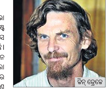
ପରେ ତାଙ୍କୁ ଛାଡ଼ିଦିଆଯାଇଛି। ଡ୍ରେକେ କହିଛନ୍ତି, ଏହା ଏକ ଶାନ୍ତିପୂର୍ଣ୍ଣ ତଥା ଅଶାନ୍ତନୈତିକ ସଭା ଥିଲା। ଗଣତନ୍ତ୍ର ନିପତ୍ତି ସମ୍ବନ୍ଧରେ ହେବାରେ ଲାଗିଛି ଓ ସମସ୍ତ ପ୍ରକାର ସାଧାରଣତା ଛଡ଼ାଇ ଦିଆଯାଇଛି ବୋଲି କାର୍ଯ୍ୟାନୁଷ୍ଠାନକୁ ଦାହା ବୁଝାପଡ଼ୁଛି।

ଝାଡ଼ଖଣ୍ଡରେ ବିନା ଅନୁମତିରେ ସଭା କରୁଥିବା ଅଭିଯୋଗରେ ବିଶିଷ୍ଟ ଅର୍ଥନୀତିଜ୍ଞ ଜିନ୍ ଡ୍ରେକେଙ୍କୁ ପୋଲିସ୍ ଅଟକ ରଖି ପରେ ଛାଡ଼ିଦେଇଛି। ବେଲଜିୟମରେ କର୍ତ୍ତୃତ ତଥା ବର୍ତ୍ତମାନ ଭାରତୀୟ ନାଗରିକ ଡ୍ରେକେ ଗରସ୍ତା ଜିଲ୍ଲା ବିଷୟପୂରା ବକାରରେ ଝାଡ଼ଖଣ୍ଡରେ ଅନାହାର ମୃତ୍ୟୁ ନେଇ ଏକ ସାଧାରଣ ସଭାରେ ଭାଷଣ ଦେଇଥିଲେ। ଏଥିପାଇଁ ଗୁମାସ୍ତା ସ୍ୱାସ୍ଥ୍ୟପୀଡ଼ା ଆବଶ୍ୟକ ଅନୁମତି ଦେ ନେଇ ନ ଥିଲେ। ସାଧାରଣ ନିର୍ବାଚନ ପାଇଁ ଆବଶ୍ୟକ ଆଚରଣ ବିଧି ଜାରି ହୋଇଥିବାରୁ ସେ ଏହାକୁ ଉଲ୍ଲେଖନ କରିଥିବା ଦର୍ଶାଇ ପୋଲିସ୍ ତାଙ୍କ ସହ ୨ ସହଯୋଗୀଙ୍କୁ ଅଟକ ରଖିଥିଲା।