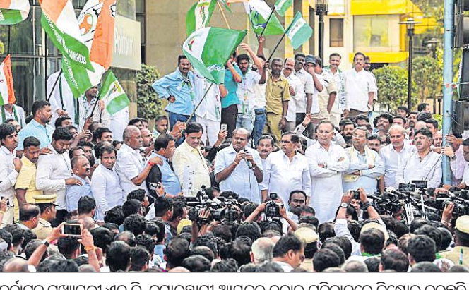
କର୍ମାଚକ ମୁଖ୍ୟମନ୍ତ୍ରୀ ଏଚ୍.ଡି. କୁମାରସାମୀ ଆଇକର ଚଢ଼ାଉ ପ୍ରତିବାଦରେ ବିରୋଧ କରୁଛନ୍ତି।