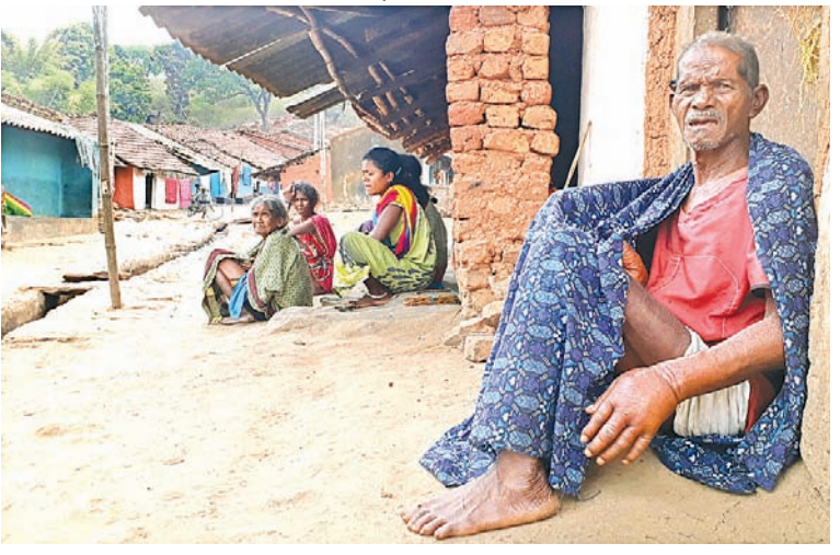
ଅସୁଖ କତାରୁ ଜାନି ।