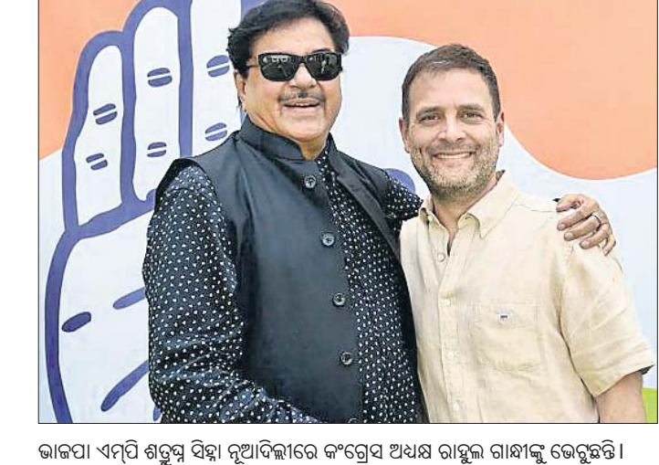
ଭାଜପା ଏମ୍ପି ଶତ୍ରୁତ୍ୱ ସିଦ୍ଧା ନୂଆଦିଲ୍ଲୀରେ କଂଗ୍ରେସ ଅଧ୍ୟକ୍ଷ ରାହୁଲ ଗାନ୍ଧୀଙ୍କୁ ଭେଟୁଛନ୍ତି।