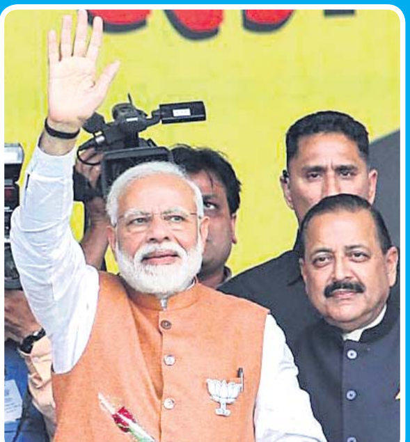
କମ୍ପୁ ନିକଟସ୍ଥ ଭୁମି ଗ୍ରାମରେ ଭାଜପାର ଏକ ନିର୍ବାଚନୀ ସଭାରେ ପ୍ରଧାନମନ୍ତ୍ରୀ ନରେନ୍ଦ୍ର ମୋଦି।