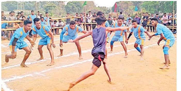
କବାଡ଼ି ପ୍ରତିଯୋଗିତାରେ ଭାଗ ନେଇଥିବା ଖେଳାଳିମାନେ।