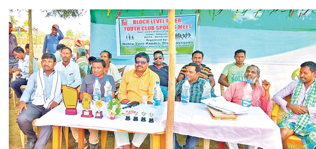
ଚୁନାମଣ୍ଡଳରେ ଯୋଗ ଦେଇଥିବା ଅତିଥିମାନେ।