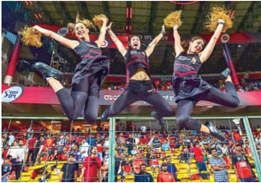
ବାଙ୍ଗାଳୁରୁଠାରେ ଗୁରୁବାର ରୟାଲ ଚ୍ୟାଲେଞ୍ଜର୍ସ ବାଙ୍ଗାଲୋର ବନାମ ମୁମ୍ବାଇ ଇଣ୍ଡିଆନ୍ ଆଇପିଏଲ ମ୍ୟାଚ ବେଳେ ନୃତ୍ୟରତ ଚିତ୍ରରଚିତ୍ର ।