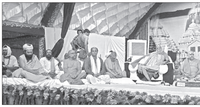
ନାଲକୋନଗରରେ ଅନୁଷ୍ଠିତ ଜଗନ୍ନାଥ ମହୋତ୍ସବରେ ଜଗନ୍ନାଥ ଶଙ୍କରାଚାର୍ଯ୍ୟଙ୍କ ସହ ଅନ୍ୟ ସାଧୁସଙ୍ଗମାନେ ।

ନାଲକୋନଗର ଠାରେ ଚାଲିଥିବା ଜଗନ୍ନାଥ ମହୋତ୍ସବ ଓ ପାଞ୍ଚରାତ୍ର କାର୍ଯ୍ୟକ୍ରମର ଚତୁର୍ଥ ସନ୍ଧ୍ୟାରେ ଜଗନ୍ନାଥ ଶଙ୍କରାଚାର୍ଯ୍ୟ ସ୍ଵାମୀ ନିଶ୍ଚଳାନନ୍ଦ ସରସ୍ଵତୀ ମହାରାଜ ଯୋଗଦେଇ କୋନାମନଙ୍କ ମାର୍ଗଦର୍ଶନ କରିଥିଲେ । ଏହି ଅବସରରେ ଜଗନ୍ନାଥ କହିଥିଲେ ଯେ, ଭଗବାନଙ୍କ ଅନେକ ରୂପ ରହିଛି । ସେ ସବୁଠି ବିଦ୍ୟମାନ । ସୂର୍ଯ୍ୟ ଉପାସକଙ୍କୁ ସୌର, ବିଷ୍ଣୁ ଉପାସକଙ୍କୁ ବିଷ୍ଣୁ, ଶିବ ଉପାସକଙ୍କୁ ଶିବ, ଶକ୍ତି ଉପାସକଙ୍କୁ ଶାକ୍ତ, ଗଣପତି ଉପାସକଙ୍କୁ ଗାଣପତ୍ୟ ବୋଲି ବିବେଚନା କରାଯାଇଥାଏ । ଏହି ପଞ୍ଚଦେବ ବିଗ୍ରହ ରୂପରେ ପୂଜିତ ହୋଇଥାନ୍ତି ।