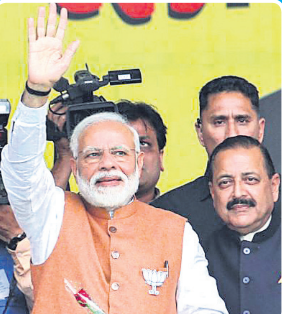
ଜଣ୍ଠ ନିକଟସ୍ଥ ଭୂମି ଗ୍ରାମରେ ଭାଜପାର ଏକ ନିର୍ବାଚନୀ ସଭାରେ ପ୍ରଧାନମନ୍ତ୍ରୀ ନରେନ୍ଦ୍ର ମୋଦି।