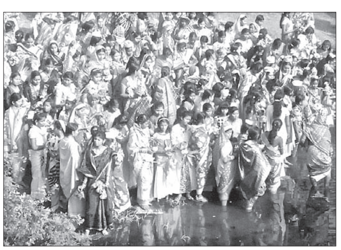
ମହିଳାମାନେ କଳସରେ ପାଣି ନେଉଛନ୍ତି ।