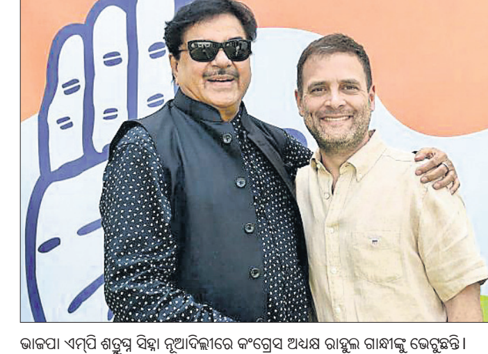
ଭାଜପା ଏମ୍‌ପି ଶତ୍ରୁତ୍ୱ ସିଦ୍ଧା ନୂଆଦିଲ୍ଲୀରେ କଂଗ୍ରେସ ଅଧ୍ୟକ୍ଷ ରାହୁଲ ଗାନ୍ଧୀଙ୍କୁ ଭେଟୁଛନ୍ତି।