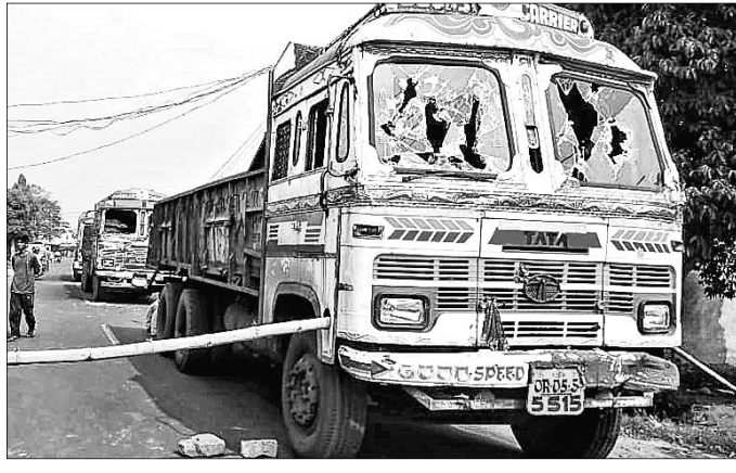
ରାସ୍ତା ଉପରେ ଅଟକି ରହିଥିବା ଟ୍ରକ୍ ଚାଳି ଦିଆଯାଇଛି।