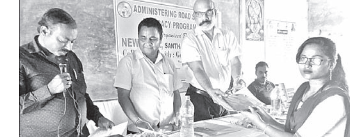
ଜଣେ କୃତୀ ଛାତ୍ରୀଙ୍କୁ ପୁରସ୍କୃତ କରାଯାଇଛି ।