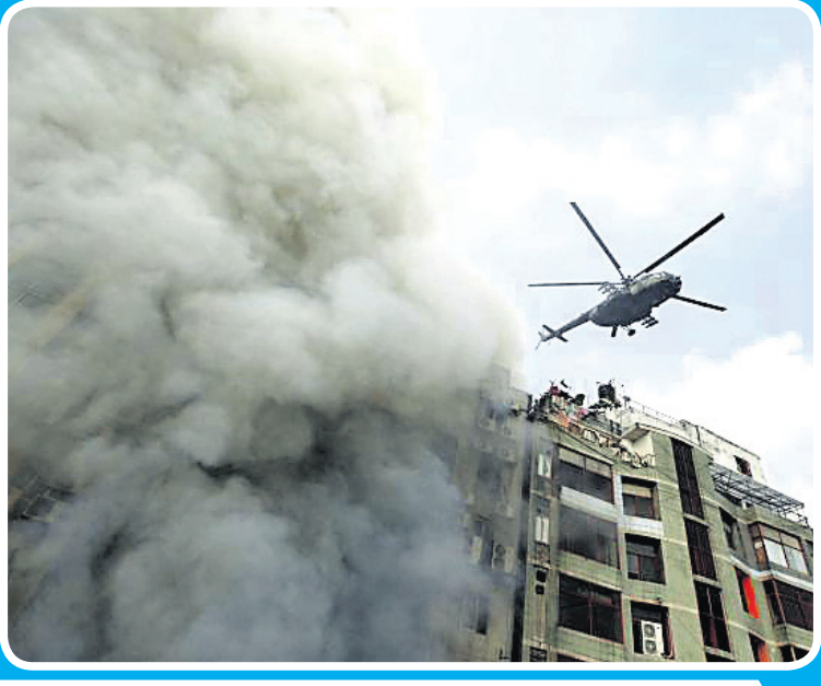
ବାମାନେଶ ରାଜଧାନୀ ଭାବରେ ବନାରୀ କମିଶନାଟ୍ ଡିପ୍ୟୁଟି ଏମ୍‌ଆର୍ ଗାଁପୁରରେ ଗୁରୁବାର ଅପରାହ୍ନରେ ଅଗ୍ନିକାଣ୍ଡ ଘଟି ୭ ଜୀବନ ବ୍ୟୟ ହୋଇଛି। ଫସିରହିଥିବା ଲୋକଙ୍କୁ ହେଲିକପ୍ଟର ଯୋଗେ ଉଦ୍ଧାର କରାଯାଇଛି।

୨୦୧୪ ମାର୍ଚ୍ଚ ୨୯ରେ ଲାଟ୍‌ଭିଆ ଏକ୍ଷେନିଆରେ ପ୍ରଥମବାର ସମଲିଙ୍ଗ ବିବାହ ଅନୁଷ୍ଠିତ ହୋଇଥିଲା। ଟ୍ରିଟିରେ ବିଭିନ୍ନ ଭାଗରେ ସମଲିଙ୍ଗ ବିବାହ ମାନ୍ୟତା ଭିନ୍ନ ଭିନ୍ନ। ଲାଟ୍‌ଭିଆ, ଏସ୍‌ଟୋନିଆ ଏବଂ ସ୍ଲୋଭେନିଆରେ ସମଲିଙ୍ଗ ବିବାହ କରାଯାଉଥିବା ବେଳେ ନର୍ଦ୍ଦର୍ ଆୟର୍‌ଲ୍ୟାଣ୍ଡରେ ଏହା କରାଯାଏ ନାହିଁ।