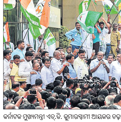
କର୍ମାଚକ ମୁଖ୍ୟମନ୍ତ୍ରୀ ଏଚ୍.ଡି. କୁମାରସାମୀ ଆଇକର ଚଢ଼ାଉ ପ୍ରତିବାଦରେ ବିରୋଧ କରୁଛନ୍ତି।

କର୍ମାଚକ ମୁଖ୍ୟମନ୍ତ୍ରୀ ଏଚ୍.ଡି. କୁମାରସାମୀ ବୃଧାବାର ଯାତ୍ରା ଆଶଙ୍କା କରିଥିଲେ ୨୪ ଘଣ୍ଟା ନୁହେଁ ତାହା ସତ ହେଲା। ସାଧାରଣ ନିର୍ବାଚନ ପାଇଁ ପ୍ରଚାର ଚାଲିଥିବାବେଳେ ରାଜ୍ୟର ଜଣେ ମନ୍ତ୍ରୀଙ୍କ ବାସଭବନରେ ଓ ଅନ୍ୟ ଜଣେ ମନ୍ତ୍ରୀଙ୍କ ସହଯୋଗୀମାନଙ୍କ ଘରେ ଆଇକର (ଆଇଟି) ବିକାର ଚଢ଼ାଉ କରିଛି। କୁମାରସାମୀ ଏହାକୁ ରାଜନୈତିକ ଉଦ୍ଦେଶ୍ୟପ୍ରଣେତା କାର୍ଯ୍ୟାନୁଷ୍ଠାନ ବୋଲି ଅଭିଯୋଗ କରି କେନ୍ଦ୍ର ନରେନ୍ଦ୍ର ମୋଦି ସରକାରଙ୍କ ଉପରେ ବର୍ଷିଲେ।