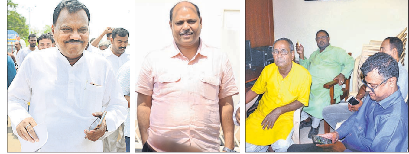
ନବୀନ ନିବାସରେ ଗୁରୁବାର ବିଜେଟ୍ ପାଇଥିବା ଓ ଦଳୀୟ ନେତାଙ୍କ ଭିଡ଼।