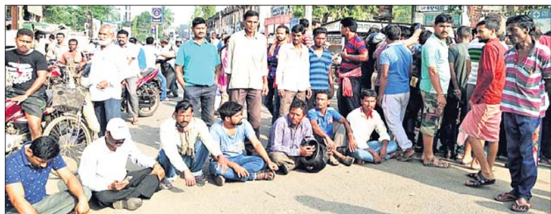
ମୁଖ୍ୟ ଚିକିତ୍ସାକର ରାସ୍ତା ଅବରୋଧ କରାଯାଇଛି ।