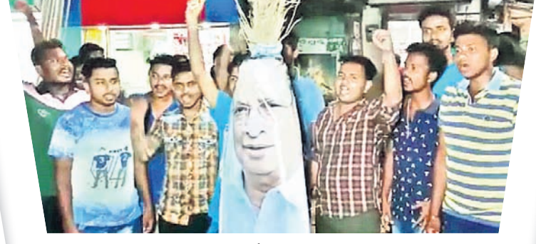
ଗ୍ରାମିକ ଛକରେ ମୁଖ୍ୟମନ୍ତ୍ରୀ କଂଗ୍ରେସ କର୍ମୀ ପିସିସି ସଭାପତି ନିରଞ୍ଜନ ପଟ୍ଟନାୟକଙ୍କ କୁଶ ପୁରୁକିକା ଦାସ କରୁଛନ୍ତି।