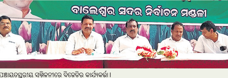
ପଞ୍ଚାୟତସ୍ତରୀୟ ସମ୍ମିଳନୀରେ ବିଜେଡିର କାର୍ଯ୍ୟକର୍ତ୍ତା।

ବାରିପଦା ଅଫିସ୍, ୨୯/୩ କଂଗ୍ରେସର ପ୍ରାର୍ଥୀ ଚୟନକୁ ନେଇ କଂଗ୍ରେସରେ ଅସନ୍ତୋଷ ଘୋଷଣା କରିଛନ୍ତି। କଂଗ୍ରେସର ପ୍ରାର୍ଥୀ ଚୟନକୁ ନେଇ କଂଗ୍ରେସରେ ଅସନ୍ତୋଷ ଘୋଷଣା କରିଛନ୍ତି।