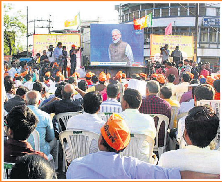
ମଧ୍ୟପ୍ରଦେଶର ଭୋପାଳରେ ପ୍ରଧାନମନ୍ତ୍ରୀ ନରେନ୍ଦ୍ର ମୋଦିଙ୍କ 'ମୈଁ ଭି ଚୌକିଦାର' କାର୍ଯ୍ୟକ୍ରମର ସିଧା ପ୍ରସାରଣ ଦେଖୁଛନ୍ତି ଭାଜପା କର୍ମୀ।