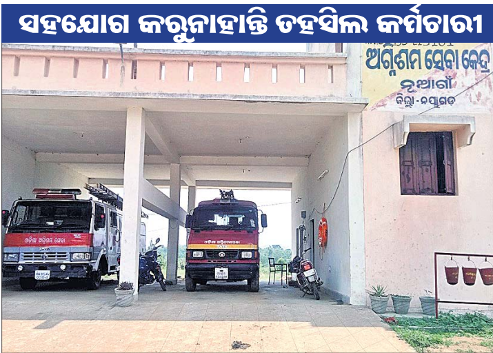
ନୂଆଗାଁ ଅଗ୍ନିଶମ ସେବା କେନ୍ଦ୍ର ଓ ଗ୍ୟାରେଜ ଗୃହରେ ରହୁଥିବା ବେଳେ କିଛି କର୍ମଚାରୀ ବାହାରେ ଘରଭଡ଼ା ନେଇ ରହିବା ପାଇଁ ବାଧ୍ୟ ହେଉଛନ୍ତି। ଏ ନେଇ ଅଧିକାରୀଙ୍କୁ ବାରମ୍ବାର ଅଭିଯୋଗ କରୁଥିଲେ ମଧ୍ୟ କେହି ଶୁଣୁ ନ ଥିବା କୁହନ୍ତି କର୍ମଚାରୀମାନେ। କ୍ୱାର୍ଟର ନିର୍ମାଣ ନ ହେବା ବିଷୟରେ ଅନୁସନ୍ଧାନ କରିବାକୁ ଜଣାପଡ଼ିଲା ଯେ, ଅଗ୍ନିଶମ କେନ୍ଦ୍ରର କ୍ୱାର୍ଟର ପାଇଁ ସଂରକ୍ଷିତ ଜାଗା ଅବ୍ୟାବସ୍ଥିତ ନିଜ ନାମରେ ରେକର୍ଡ ହୋଇନାହିଁ କିମ୍ବା ପଞ୍ଜୀକୃତ ନାହିଁ। ଫଳରେ ଏଠାରେ କ୍ୱାର୍ଟର ନିର୍ମାଣ କରିବା ପାଇଁ ଅର୍ଥ ମଞ୍ଜୁର କରି କାମ କୁହନ୍ତି କର୍ମଚାରୀମାନେ। କ୍ୱାର୍ଟର ନିର୍ମାଣ ନ ହେବା ବିଷୟରେ ଅନୁସନ୍ଧାନ କରିବାକୁ

ନୟାଗଡ଼ ଜିଲ୍ଲା ନୂଆଗାଁ ବ୍ଲକର ଅଗ୍ନିଶମ ସେବା କେନ୍ଦ୍ରରେ ରହୁଥିବା କର୍ମଚାରୀଙ୍କ ରହିବା ପାଇଁ ବାସଗୃହ ବା କ୍ୱାର୍ଟର ନାହିଁ। ଫଳରେ ଏଠାରେ ନିଯୁକ୍ତ ପାଇଥିବା କର୍ମଚାରୀମାନେ ନିଜେ ସମସ୍ୟାର ସମ୍ମୁଖୀନ ହେଉଛନ୍ତି। ତହସିଲ କର୍ମଚାରୀଙ୍କ ଅବହେଳାକୁ ଏହି ସମସ୍ୟା ଉପୁଡ଼ିଥିବା ଜଣାପଡ଼ିଛି।