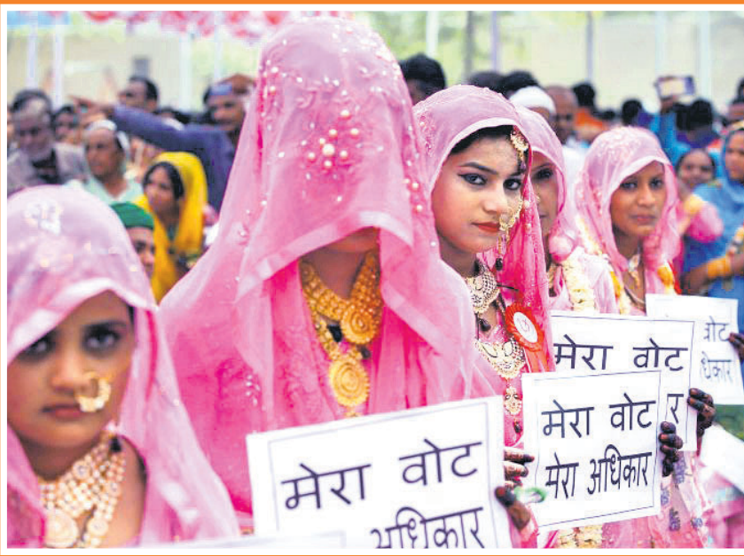
ଗୁଜରାଟର ଅହମ୍ମଦାବାଦସ୍ଥିତ ଏକ ମସଜିଦ୍‌ରେ ଗଣଦିବାସ ଉତ୍ସବ ବେଳେ ମୁସଲମାନ ନବଦୟମାନେ ପ୍ଲାକାର୍ଡ ଦେଖାଇ ମତଦାନ ପାଇଁ ସଚେତନତା ସୃଷ୍ଟି କରୁଛନ୍ତି।