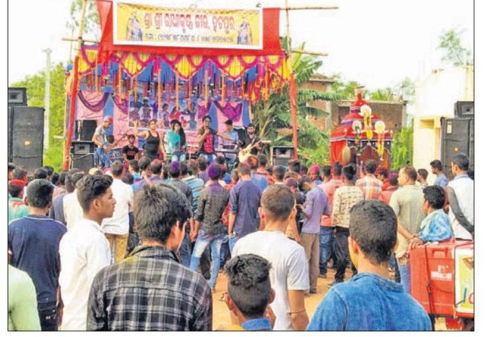
ଦର୍ଶକ ମେଳଣ ଉଦ୍‌ଯାପିତ କରୁଛନ୍ତି।