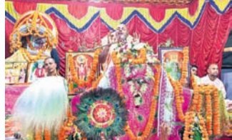
କେନ୍ଦ୍ରାପଡ଼ା ଅଫିସ, ୩୧୩

ସମାଜରେ ଶାନ୍ତି ପ୍ରତିଷ୍ଠା ପାଇଁ ସଂକଳ୍ପ ଆବଶ୍ୟକ