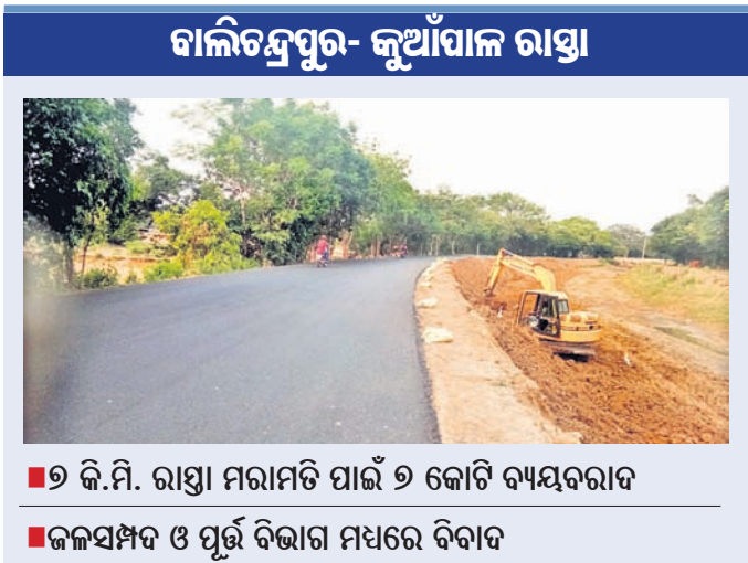
■ ୬ କି.ମି. ରାସ୍ତା ମରାମତି ପାଇଁ ୬ କୋଟି ବ୍ୟୟବ୍ୟୟ ■ ଜଳସମ୍ପଦ ଓ ପୂର୍ବ ବିଭାଗ ମଧ୍ୟରେ ବିବାଦ

ଯାଜପୁର ଜିଲ୍ଲା ବାଲିତନ୍ତପୁରଠାରୁ କଟକ ଜିଲ୍ଲାର କୁଆଁପାଳ ପର୍ଯ୍ୟନ୍ତ ଦୀର୍ଘ ୬ କି.ମି. ରାସ୍ତା କଟକ ପୂର୍ବ ବିଭାଗ ଡିଭିଜନ-୨ ଅଧୀନରେ ରହିଛି। ଏହି ରାସ୍ତାର ପୁନରୁଦ୍ଧାର ପାଇଁ ୬ କୋଟି ଟଙ୍କା ବ୍ୟୟବ୍ୟୟ କରାଯାଇଥିବା ବେଳେ ରାସ୍ତା ନିର୍ମାଣରେ ବ୍ୟାପକ ଅନିୟମିତତା ପରିଲକ୍ଷିତ ହୋଇଛି। ରାସ୍ତାମଝିରେ ଗଛ ଓ କଲଚର୍ଟ ଥିବାବେଳେ ଏହାକୁ ନ ଉଠାଇ ପ୍ରଶାସନିକ କରାଯିବା ଦ୍ୱାରା ଦୁର୍ଘଟଣା ବୃଦ୍ଧି ପାଇଥିଲା। ପଞ୍ଚାୟତ କେନାଲ ପାର୍ଶ୍ୱକୁ ଖୋଳି ଗାଡ଼ିଖାଲ ନିର୍ମାଣ କରିବା ଯୋଗୁ ଜଳସମ୍ପଦ ବିଭାଗ ଓ ପୂର୍ବ ବିଭାଗ ମଧ୍ୟରେ ବିବାଦ ଘନାକୁଡ଼ି ହୋଇଥିଲା। ସେହିପରି ବାଲିତନ୍ତପୁର ଜଳସମ୍ପଦ ବିଭାଗ ବିନା ଅନୁମତିରେ ଏହି ରାସ୍ତାର କୁପୁରୁ-ବାଗସରପୁର ମଧ୍ୟରେ ଠିକାଦାର କେନାଲ ଅଂଶକୁ