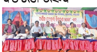
ଡେଭାରିଶ, ୩୧୩ (ସ.ପ୍ର.):

ଡେଭାରିଶ ଶିକ୍ଷା ସର୍କଳ ଅଧୀନ ରତାଡିଆ ଖଣ୍ଡସାହି ସରକାରୀ ହାଇସ୍କୁଲର ବାର୍ଷିକ ପୁରସ୍କାର ବିତରଣ ଉତ୍ସବ ଉଦ୍ଦିଷ୍ଟରେ ଅନୁଷ୍ଠିତ ହୋଇଯାଇଛି।