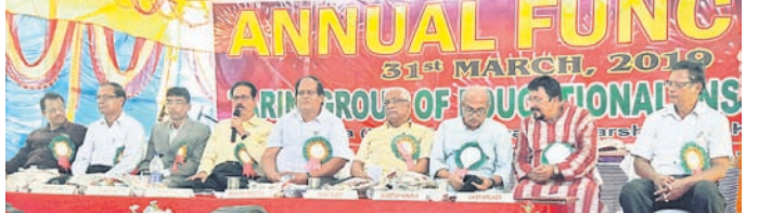
ଉତ୍ସବରେ ଉପସ୍ଥିତ ଅତିଥିମାନେ ।