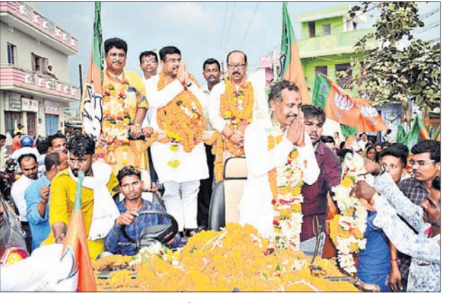
ବ୍ରହ୍ମପୁରରେ ଭାଜପାର ରୋଡ୍ ଶୋ' ।