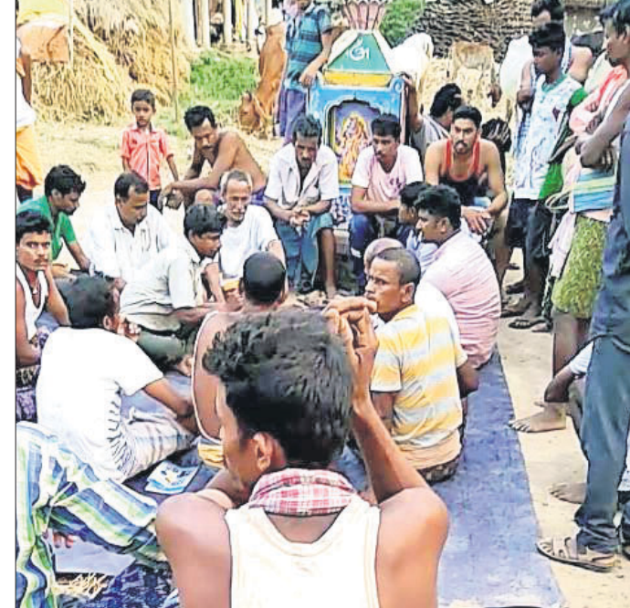
ବୈଠକରେ ଯୋଗଦେଇଥିବା ଗ୍ରାମବାସୀ।

ଦଶରଥପୁର ବ୍ଲକ ନିକାମପୁର ପଞ୍ଚାୟତ ଧାନ କ୍ରୟବେଳେ ପ୍ରତି କୁଳଖିଳ ପିଣ୍ଡା ୧୨୦୦ ୧୫ କିଲୋ ଧାନ ଠକିଥିଲେ। ଏହି ସମୟରେ କେତେଜଣ ଚାଷୀ ଓଜନରେ ଅଞ୍ଚଳତାକୁ ଧାନ ବେପାରୀଙ୍କ ଠାକୁ ଧରି ଦେଇଥିଲେ। ପରେ ଗ୍ରାମବାସୀ ସେକ୍ସ ମୋରାଳଙ୍କ ସହ ତାଙ୍କ ଓଜନରେ ଠକାମି କରିଥିଲେ। ଏ ସମ୍ପର୍କରେ ଗ୍ରାମବାସୀ ଜାଣିବା ପରେ ସମସ୍ତ ବ୍ୟବସାୟୀଙ୍କୁ ଗ୍ରାମରେ ଅଟକାଇଥିଲେ। ପରେ ଗ୍ରାମରେ ଏକ ବୈଠକରେ ସମସ୍ତ ବ୍ୟବସାୟୀଙ୍କଠାରୁ ୨୫ ହଜାର ଟଙ୍କା ଜରିମାନା ଆଦାୟ କରାଯାଇଥିବା ଜଣାପଡ଼ିଛି। ପ୍ରକାଶ ଯେ, ଧାନ କ୍ରୟକ୍ରିୟା କରାଯିବାର ଗ୍ରାମରେ ସେକ୍ସ ମୋରାଲ୍ ଅଲ୍ ଚାଷୀଙ୍କଠାରୁ ଧାନ କ୍ରୟବେଳେ ପ୍ରତି କୁଳଖିଳ ପିଣ୍ଡା ୧୨୦୦ ୧୫ କିଲୋ ଧାନ ଠକିଥିଲେ। ଏହି ସମୟରେ କେତେଜଣ ଚାଷୀ ଓଜନରେ ଅଞ୍ଚଳତାକୁ ଧାନ ବେପାରୀଙ୍କ ଠାକୁ ଧରି ଦେଇଥିଲେ। ପରେ ଗ୍ରାମବାସୀ ସେକ୍ସ ମୋରାଳଙ୍କ ସହ ତାଙ୍କ ଓଜନରେ ଠକାମି କରିଥିଲେ। ଏ ସମ୍ପର୍କରେ ଗ୍ରାମବାସୀ ଜାଣିବା ପରେ ସମସ୍ତ ବ୍ୟବସାୟୀଙ୍କୁ ଗ୍ରାମରେ ଅଟକାଇଥିଲେ। ପରେ ଗ୍ରାମରେ ଏକ ବୈଠକରେ ସମସ୍ତ ବ୍ୟବସାୟୀଙ୍କଠାରୁ ୨୫ ହଜାର ଟଙ୍କା ଜରିମାନା ଆଦାୟ କରାଯାଇଥିବା ଜଣାପଡ଼ିଛି। ପ୍ରକାଶ ଯେ,