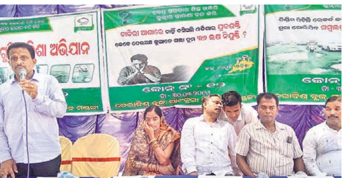
ସଭାରେ ବିଜେଡି ନେତା ଓ କର୍ମୀ

ଡେଭାରିଶ ରୁକ୍ ଅଧୀନ ଚାନ୍ଦୋଳଠାରେ ରବିବାର ବିଜେଡି ପକ୍ଷରୁ ୧୪ ନଂ. ଜୋନ୍‌ସ୍ତରାୟ ହକ୍ ମାଗୁଛି ଓଡ଼ିଶା କାର୍ଯ୍ୟକ୍ରମ ଅନୁଷ୍ଠିତ ହୋଇଯାଇଛି।