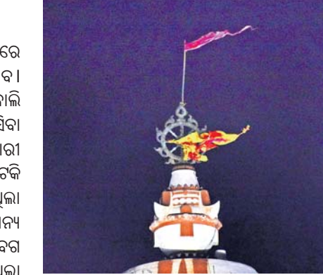
ପତିତପାବନ ବାନାର କିଛି ଅଂଶ ଚିରିଯାଇଛି।

ରବିବାର ଅପରାହ୍ଣ ପ୍ରାୟ ସାଢ଼େ ୪ଟା। ପୁରୀରେ ଦେଖିବାକୁ ମିଳୁଥିଲା କାଳବୈଶାଖୀର ପ୍ରଭାବ। ଖୁବ୍ ଜୋରରେ ବୋହିଥିଲା ପବନ। ଧୂଳି, ବାଲି ଏମିତି ଭଡ଼ିଥିଲା ଯେ ପ୍ରାୟତଃ ସର୍ବତ୍ର ସିଆସିଆସିଆ କରିବା ଅସମ୍ଭବ ହୋଇପଡ଼ିଥିଲା। ପଥଚାରୀ ଏବଂ ବାଇକ୍ ଚାଳକମାନେ କିଛି ସମୟ ଅଟକି ରହିଥିଲେ। ଏହାପରେ ଆରମ୍ଭ ହୋଇଥିଲା ଝିପି ଝିପି ବର୍ଷା। ଧୂଳି, ବାଲି ଉଡ଼ିବା ସାମାନ୍ୟ ବନ୍ଦ ହୋଇଯାଇଥିଲେ ହେଁ ପବନର ବେଗ ବଢ଼ିଥିଲା। ଆଉ ପବନର କୋପ ପଡ଼ିଥିଲା ଶ୍ରୀମନ୍ଦିର ନୀଳଚକ୍ର ଉପରେ। ଏଥିରେ ବନ୍ଧାଯାଇଥିବା ପତିତପାବନ ବାନାର କିଛି ଅଂଶ ଚିରି ଭଡ଼ିଯାଇଥିଲା। ପ୍ରାୟ ଅଧାଘଣ୍ଟା ଧରି କାଳବୈଶାଖୀ ପ୍ରଭାବରେ ପବନ ବୋହିଥିଲା। ଫଳରେ ସହରର ବିଭିନ୍ନ ସ୍ଥାନରେ ଲାଗିଥିବା କେତେକ ହୋଟେଲ୍ ଚିରି ଯାଇଥିଲା। ବିଶେଷକରି