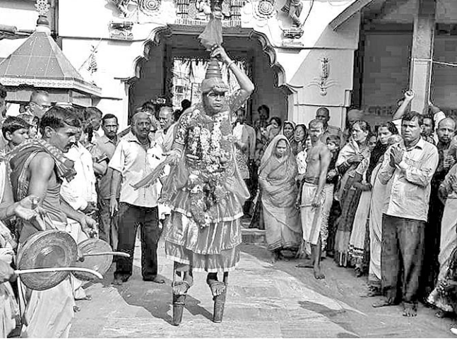
କାକଟପୁର ମା'ମଙ୍ଗଳା ମନ୍ଦିରରେ ଜଣେ ପାରୁଆ ନୃତ୍ୟ କରୁଛନ୍ତି।