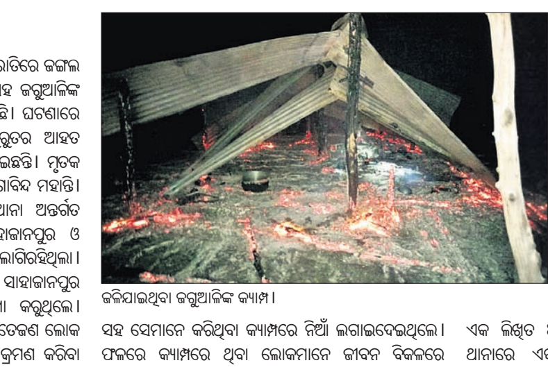
କରିଯାଇଥିବା ଜଗୁଆଳିଙ୍କ କ୍ୟାମ୍ପ।

ସହ ସେମାନେ କରିଥିବା କ୍ୟାମ୍ପରେ ନିଆଁ ଲାଗାଇଦେଇଥିଲେ। ଏକ ଲିଖିତ ଅଭିଯୋଗ କରିଛନ୍ତି। ଏ ସମ୍ପର୍କରେ କ୍ରନ୍ଧଗିରି ଫଳରେ କ୍ୟାମ୍ପରେ ଥିବା ଲୋକମାନେ ଜୀବନ ବିକଳରେ ଥାନାରେ ଏକ ମାମଲା ରୁକୁ ହୋଇଥିବା ଜଣାପଡ଼ିଛି।