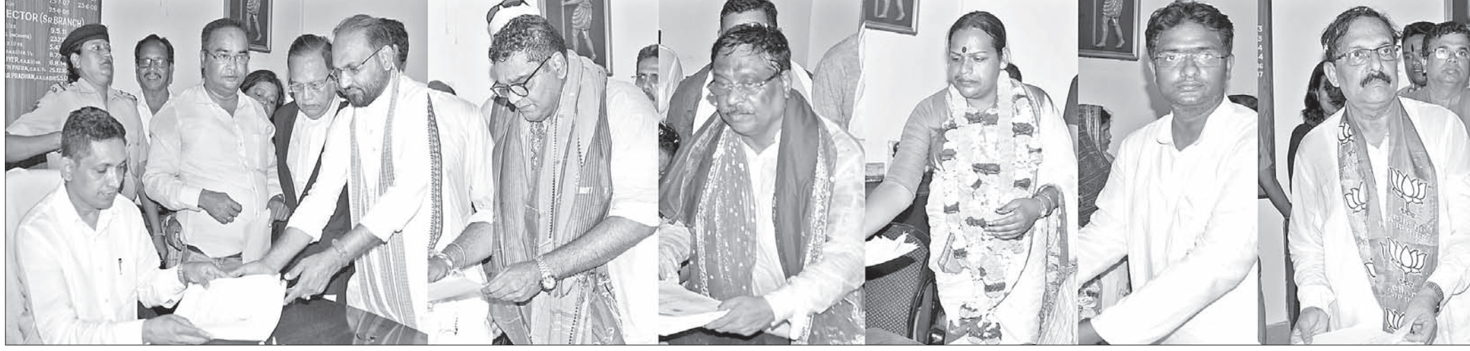
ବିଭିନ୍ନ ଦଳର ପ୍ରାର୍ଥୀ ନାମାଙ୍କନପତ୍ର ଦାଖଲ କରୁଛନ୍ତି।