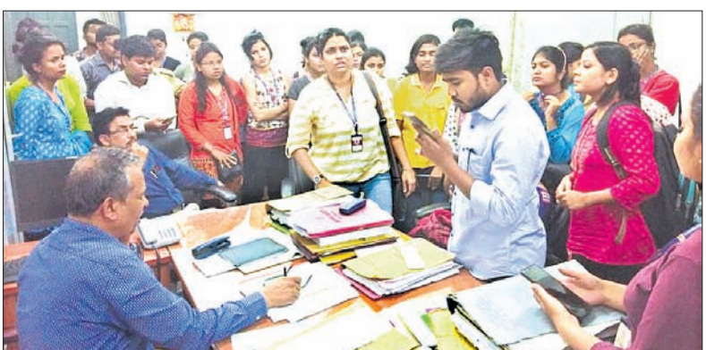
ଛାତ୍ରଛାତ୍ରୀମାନେ ବିଶ୍ୱବିଦ୍ୟାଳୟ କୁଳସଚିବଙ୍କୁ ଯୋଗାଯୋଗ କରି ଅଭିଯୋଗ କରୁଛନ୍ତି।