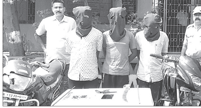
ଗିରଫ ୩ ଅଭିଯୁକ୍ତ। ଚିମ୍ପ ପାଟ୍ରୋଲିଂ କରୁଥିବା ବେଳେ ୫ଜଣ ଯୁବକ ଚୌଦ୍ୱାରର ବସ୍ ପଡିଆର ଏକ ନିକାଟିଆ କାଗାରେ ବସି ଆଲୋଚନା