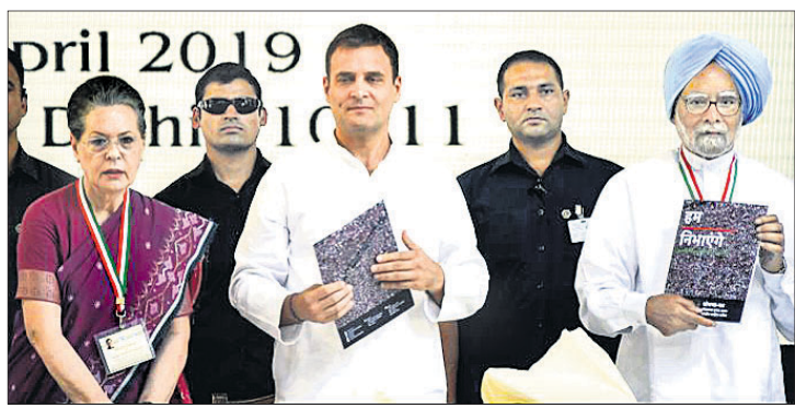
ଉପା ଅଧ୍ୟକ୍ଷା ସୋନିଆ ଗାନ୍ଧୀ, କଂଗ୍ରେସ ଅଧ୍ୟକ୍ଷ ରାହୁଲ ଗାନ୍ଧୀ, ପୂର୍ବତନ ପ୍ରଧାନମନ୍ତ୍ରୀ ମନମୋହନ ସିଂ କଂଗ୍ରେସର ନିର୍ବାଚନୀ ଇସ୍ତାହାରକୁ ପ୍ରଦର୍ଶନ କରୁଛନ୍ତି ।

ପ୍ରଥମ ପର୍ଯ୍ୟାୟ ସାଧାରଣ ନିର୍ବାଚନକୁ ୯ ଦିନ ବାକି ଥିବାବେଳେ କଂଗ୍ରେସ ପକ୍ଷରୁ ମଙ୍ଗଳବାର ଦଳୀୟ ଇସ୍ତାହାର ପ୍ରକାଶ କରାଯାଇଛି । ୫୩ ପୃଷ୍ଠା ସମ୍ବଳିତ ଏହି ଘୋଷଣାପତ୍ରରେ ପୁଣ୍ୟାୟନ, କୃଷିର ଛାଡ଼, ଶିକ୍ଷା, ଗରିବଙ୍କ ପାଇଁ ଗୁଣାତ୍ମକ ସ୍ୱାସ୍ଥ୍ୟସେବା, କର୍ମନିଯୁକ୍ତି, ମହିଳାଙ୍କ ସୁରକ୍ଷା ଓ ସମ୍ମାନର ସହ ଜୀବନଧାରଣ, ଭ୍ରଷ୍ଟାଚାର