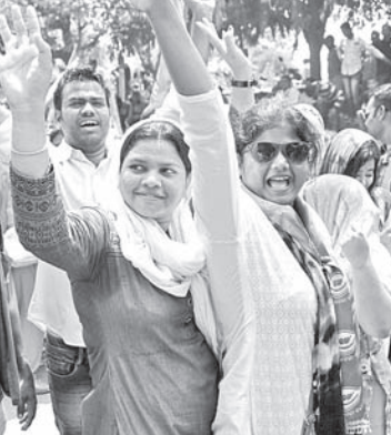
ବିଭେଦ ପ୍ରାର୍ଥୀଙ୍କ ଶୋଭାଯାତ୍ରାରେ ଯୁବତୀମାନେ ନୃତ୍ୟ କରୁଛନ୍ତି।