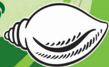
ବିଭୁ ଜନତା ଦଳ

ଢେ଼ିଶାର ହକ୍ ପାଇଁ ଲଢ଼ିବା ୨୧ ରୁ ୨୧ ରେ 'ଶଙ୍ଖ'କୁ ଜିତାଇବା ।