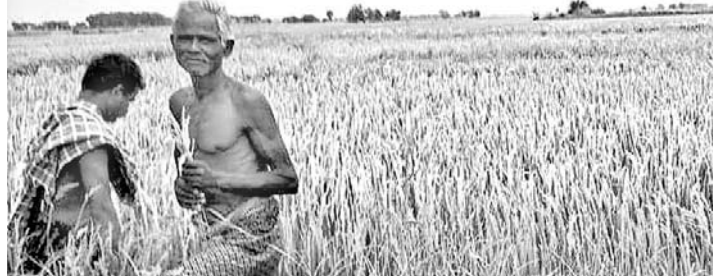
ସତ୍ୟବାଦରେ ଝାଞ୍ଜିମାଡ଼ରେ ଜଳିଯାଇଥିବା ଧାନଫସଲକୁ ଚାଷୀମାନେ ଦେଖାଉଛନ୍ତି।