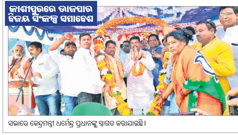
କାଶୀପୁରରେ ଭାଜପାର ବିଜୟ ସଂକଳ୍ପ ସମାବେଶ

କନିଷ୍ଠ ଶୁଭାରମ୍ଭ ହେବ ବିଜେଡିର ନିର୍ବାଚନ ପ୍ରଚାର ମହାନଗରରେ ରୋଡ୍ ଶୋ' ବ୍ରହ୍ମପୁର ଅଫିସ, ୨୪: ବିଜେଡିର ନିର୍ବାଚନ ପ୍ରଚାର ପାଇଁ ସଭାପତି ତଥା ମୁଖ୍ୟମନ୍ତ୍ରୀ ନବୀନ ପଟ୍ଟନାୟକ ରୁଧିରା ଗସ୍ତର ଲିମ୍ବା ଗସ୍ତରେ ଆସିବେ। ପ୍ରଥମେ ଗୋପାଳପୁର ନିର୍ବାଚନ ମଣ୍ଡଳୀର କନିଷ୍ଠରେ ଦଳ ପକ୍ଷରୁ ଆୟୋଜିତ ଦଳ ସମାବେଶକୁ ସମ୍ବୋଧିତ କରିବେ। ସେଥିପାଇଁ ଲିମ୍ବା ବିଜେଡି ପକ୍ଷରୁ ପ୍ରସ୍ତୁତ କୋରଦାର ହୋଇଛି। ଦଳ ପ୍ରାର୍ଥୀ ଘୋଷଣା ହେବା ପରେ କନିଷ୍ଠ ନବୀନ ନିର୍ବାଚନ ପ୍ରଚାରର ଶୁଭାରମ୍ଭ କରିବାର କାର୍ଯ୍ୟକ୍ରମ ରହିଛି। ସୂଚନାମୁତାବେ, ଭୁବନେଶ୍ୱରରୁ ନବୀନ ହେଲିକପ୍ଟରରେ ଆସି କନିଷ୍ଠରେ ଓହ୍ଲାଇବେ ଏବଂ ସଭା ଶେଷରେ ଦେ ବିଜ୍ଞାନ ଅଞ୍ଚଳରେ ରୋଡ୍ ଶୋ' କରିବେ। ରୁଧିରା ଅପରାହ୍ଣ ୪ଟାରେ ନବୀନଙ୍କ ରୋଡ୍ ଶୋ' କନିଷ୍ଠ ଆରମ୍ଭ ହେବ। ସେଠାରୁ ବ୍ରହ୍ମପୁର ଗୁଡ଼ସିନେଟ୍ ରୋଡ୍ ବେଳ ଗୋପାଳପୁର ପାଠାଗାର ଛକ, ନୂଆ ଆମ୍ ମାର୍କେଟ୍ ତଥା ଅଧ୍ୟକ୍ଷରା ରୋଡ୍‌ରେ ପହଞ୍ଚିବେ। ବ୍ରହ୍ମପୁର ମେଣ୍ଟିକ, ବାଲୁକେଶ୍ୱର ମନ୍ଦିର ଛକ, ହରିଡ଼ାଖଣ୍ଡ ଛକ, ତାଳୁକା ରୋଡ୍ ଓ ଶ୍ରୀରାମ ନଗର ଛକକୁ ଆସିବେ। ପରବର୍ତ୍ତୀ ପର୍ଯ୍ୟାୟରେ ଗେଟବଜାର, ବାବାଜୀଗୋଟା, ଖଲିକୋଟ କଲେଜ, ବିଜିପୁର ଛକ, ଟାଟାବେଙ୍ଗ ଛକ, କମାପଲ୍ଲୀ ଓ ରଞ୍ଜିତପୁର ଛକ ଛକ ବେଳ ଖୋଡ଼ାପାଣି ଓ ଆମ୍ଭାପୁରରେ ରୋଡ୍ ଶୋ' କରିବେ। ବ୍ରହ୍ମପୁରରୁ ନବୀନ ଛତ୍ରପୁର ଅଞ୍ଚଳରେ ରୋଡ୍ ଶୋ' କରି ଲିମ୍ବା ସଦର ମହକୁମାକୁ ଯିବେ। ସେଠାରେ ମଧ୍ୟ ଜନସମାବେଶକୁ ସମ୍ବୋଧିତ କରିବା ପରେ ଗସ୍ତର ଉପାଦାନ ଏବଂ ଅଧିକ ଅଞ୍ଚଳରେ ରୋଡ୍ ଶୋ' କରି ଭୁବନେଶ୍ୱର ପ୍ରତ୍ୟାବର୍ତ୍ତନ କରିବାର କାର୍ଯ୍ୟକ୍ରମ ରହିଛି। ମୁଖ୍ୟମନ୍ତ୍ରୀଙ୍କ ଗସ୍ତକୁ ସଫଳ କରିବା ପାଇଁ ଲିମ୍ବା ସ୍ତର ବିଜେଡି, ମହିଳା ବିଜେଡି ଓ ମହାନଗର ବିଜେଡି ପକ୍ଷରୁ ଚର୍ଚ୍ଚନା ପ୍ରକାଶ ପାଇଛି।