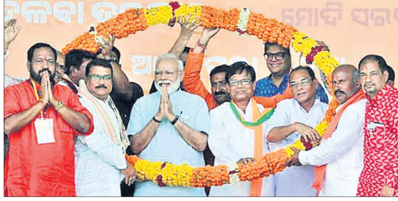
ସମାବେଶରେ ଦଳୀୟ ନେତାଙ୍କ ଗହଣରେ ପ୍ରଧାନମନ୍ତ୍ରୀ ନରେନ୍ଦ୍ର ମୋଦି । ପ୍ରତିକାର କଲେ ନାହିଁ ମୋଦି ରୋଗ ଜାଣେ, ଏଭଳି ଜଙ୍ଗରେ ନିଜ ସରକାରର ସଫଳତାଆ ବ୍ୟାଖିଥିଲେ ପ୍ରଧାନମନ୍ତ୍ରୀ ୧୨ ପୃଷ୍ଠା-୧୨