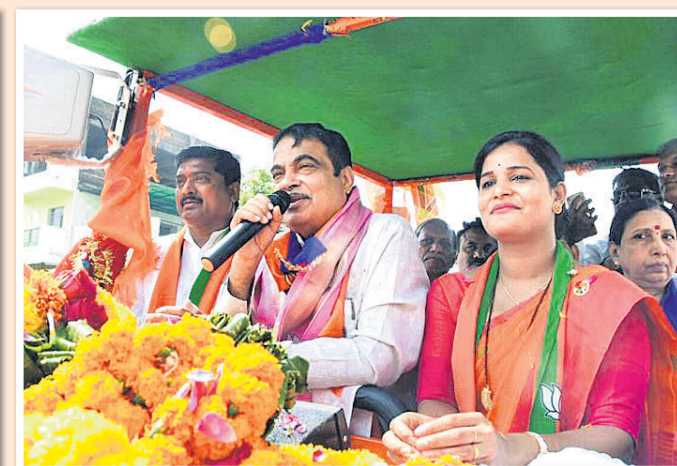
ମହାରାଷ୍ଟ୍ରର ନାଗପୁରରେ ଭାଜପା ପ୍ରାର୍ଥୀ ତଥା କେନ୍ଦ୍ରମନ୍ତ୍ରୀ ନାତନ ଗଡ଼କରୀ ପ୍ରଚାର କରୁଛନ୍ତି।