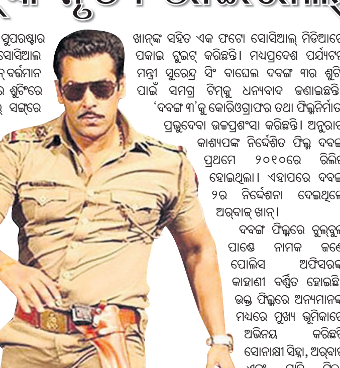
ଦବଙ୍ଗ ଫିଲ୍ମରେ ରୁଲ୍‌ବୁଲ୍ ପାଖେ ନାମକ ଜଣେ ପୋଲିସ ଅଫିସରଙ୍କ କାହାଣୀ ବର୍ଣ୍ଣିତ ହୋଇଛି। ଉକ୍ତ ଫିଲ୍ମରେ ଅନ୍ୟମାନଙ୍କ ମଧ୍ୟରେ ମୁଖ୍ୟ ଭୂମିକାରେ ଅଭିନୟ କରିଛନ୍ତି ସୋନାମିଷ୍ଟା, ଅର୍ବାଦ୍ ଏବଂ ମାହି ରିଲ୍।

ମୁମ୍ବାଇ: 'ଦବଙ୍ଗ' ୩'ର ଶୁଟିଂସେଟ୍‌ରେ ସୁପରଷ୍ଟାର ସଲମାନ୍ ଖାନ୍ ନୃତ୍ୟର ଭିଡିଓ ସୋସିଆଲ ମିଡିଆରେ ଭାଇରାଲ ହୋଇଛି। ସଲମାନ୍ ବର୍ତ୍ତମାନ ମଧ୍ୟପ୍ରଦେଶର ଭୋପାଳରେ ଦବଙ୍ଗ ୩'ର ଶୁଟିଂରେ ବ୍ୟସ୍ତ ଅଛନ୍ତି। ଉକ୍ତ ଫିଲ୍ମର ଗାଇରଲ୍ ସଙ୍ଗରେ ସଲମାନ୍ଙ୍କ ନୃତ୍ୟଭିନୟ ଭାଇରାଲ୍ ହୋଇଥିବା ବେଳେ ପ୍ରଶଂସକମାନେ ସଲମାନ୍ଙ୍କ ନୃତ୍ୟଶୈଳୀ ଉପରେ ମତାମତ ଦେଇଛନ୍ତି। ନର୍ଦୀଦା ନଦୀକୂଳରେ ଉକ୍ତ ଫିଲ୍ମର ଶୁଟିଂ ଚାଲିଛି। ସଲମାନ୍ ନାଟଗାର୍ଟ ଏବଂ ବିଜୁ ପରିଧାନ କରିବା ସହିତ ଏକ ସନ୍ତୋଷ ପିନ୍ ରୁଲ୍‌ବୁଲ୍ ପାଖେ ଅବତାର ନେଇଛନ୍ତି। ଦବଙ୍ଗ ୩'ରୁ ଲାଗି ଇନ୍ଦୋରବାସୀ ଖୁବ୍ ଉତ୍ସାହିତ ହୋଇପଡ଼ିଛନ୍ତି। ଏଥିପାଇଁ ନିଜ ଜନ୍ମସ୍ଥାନକୁ ଫେରିଆସିଥିବାରୁ ସଲମାନ୍ ତାଙ୍କ ଭାଇ ଅର୍ବାଦ୍