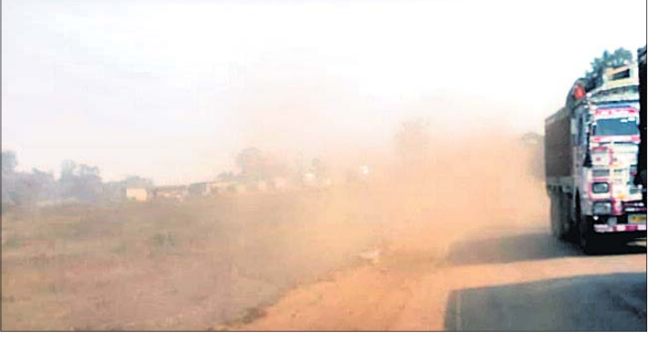
ଧୂଳିଧୂଆଁରେ ପରିପୁର୍ଣ୍ଣ ଯୋଡ଼ା ଅଞ୍ଚଳ।

କେନ୍ଦୁଝର ଜିଲ୍ଲା ଯୋଡ଼ା ଉପତ୍ୟକାବାସୀ ଧୂଳିଧୂଆଁରେ ପେଣି ହେଉଛନ୍ତି। ରାସ୍ତାଘାଟା ଧୂଳିଧୂଆଁରେ ପରିପୁର୍ଣ୍ଣ ହେଉଛି। ଯାତାୟାତରେ ସମସ୍ୟା ହେଉଛି। ଯୋଡ଼ାରୁ ରାଜ୍ୟର ସର୍ବାଧିକ ଖଣି ରାଜସ୍ୱ ଆଦାୟ ହେଉଛି। ଏହି ସହର ମଧ୍ୟ ଦେଇ ଖଣିକ ଟ୍ରକ୍ ଯାତାୟାତ କରୁଛି।