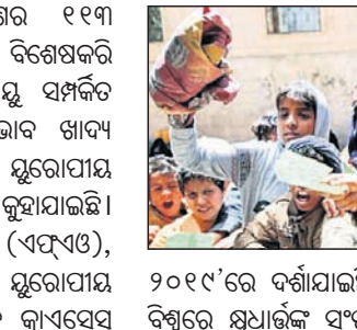
୨୦୧୯ରେ ଦଶାଧିକ ସେ, ଦୀର୍ଘ ୩୫ ମଧ୍ୟରେ ବିଶ୍ଵରେ ଯୁଧାର୍ଥିକ ସଂଖ୍ୟା ଉଲ୍ଲେଖନୀୟ ଭାବେ ବୃଦ୍ଧି

କାଚିସଂଘ: ପୃଥିବୀରେ ୫୩ଟି ଦେଶର ୧୧୩ ନିୟୁତ ଲୋକ ଭୋକରେ ରହିଛନ୍ତି। ବିଶେଷକରି ଏହିସବୁ ଦେଶରେ ଅଭିବ୍ୟକ୍ତ, ଜଳବାୟୁ ସମ୍ପର୍କିତ ପ୍ରାକୃତିକ ବିପର୍ଯ୍ୟୟ ଏବଂ ଆର୍ଥିକ ଅଭାବ ଖାଦ୍ୟ ସଂକଟ ସୃଷ୍ଟି କରୁଛି ବୋଲି କାଚିସଂଘ ଓ ଯୁରୋପୀୟ ଯୁନିୟନ(ଇୟୁ)ର ମିଳିତ ରିପୋର୍ଟରେ କୁହାଯାଇଛି। କାଚିସଂଘର ଖାଦ୍ୟ ଓ କୃଷି ସଂଗଠନ (ଏଏସ୍‌ଓ), ବିଶ୍ଵ ଖାଦ୍ୟ କାର୍ଯ୍ୟକ୍ରମ(ବିସ୍‌ସିଏସ୍‌ସି) ଏବଂ ଯୁରୋପୀୟ ଯୁନିୟନ 'ଗ୍ଲୋବାଲ ରିପୋର୍ଟ ଅଫ୍ ଫୁଡ଼ କ୍ରାଏସିସିସ୍