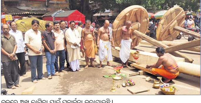
ଚକରେ ଅଘଟଣ ଘଟିବା ପାଇଁ ପୂଜାର୍ଚ୍ଚନା କରାଯାଇଛି।

ପୁରୁଣା ଭୁବନେଶ୍ୱର, ୩୫ (ଡି.ଏନ.ଏ.): ଶ୍ରୀଲିଙ୍ଗରାଜ ମହାପ୍ରଭୁଙ୍କର ପୂଜଣା ରଥ ପାଇଁ ବୁଧବାର ରଥଖଳାରେ ମହାରାଣୀମାନଙ୍କ ଦ୍ୱାରା ତିଆରି ହୋଇଥିବା ନୂଆ ଚକ, ଅଖକୁ ବିଧି ପୂଜାବଦ୍ଧ ପୂଜାର୍ଚ୍ଚନା କରାଯାଇଥିଲା।