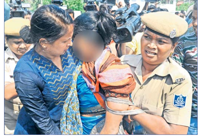
ଆତ୍ମହତ୍ୟା ଉଦ୍ୟମରେ ମହିଳାଙ୍କୁ ସୁରକ୍ଷାକର୍ମୀମାନେ ଉଦ୍ଧାର କରୁଛନ୍ତି।

ବୁଧବାର ଜଣେ ମହିଳା ନବୀନ ନିବାସ ଆଗରେ ଆତ୍ମହତ୍ୟା ଉଦ୍ୟମ କରିଥିଲେ। ସେତେବେଳେ ସେଠାରେ ନେତା ଓ କର୍ମୀଙ୍କ ଭିଡ଼ ଲାଗି ରହିଥିଲା।