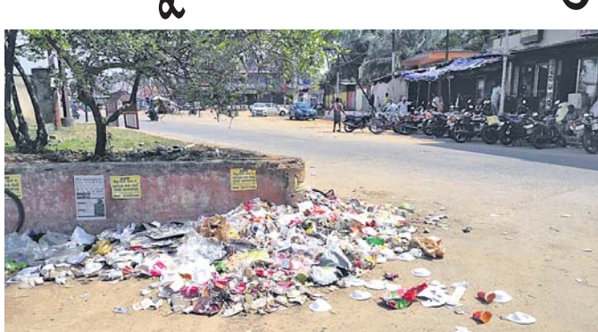
ରଣପୁର ମୁଖ୍ୟ ରାସ୍ତା ପାର୍ଶ୍ୱରେ ଅଳିଆ ଗବା ହୋଇଛି।

ସହରକୁ ସରସ ସୁନ୍ଦର କରିବା ପ୍ରତ୍ୟେକ ବିଜ୍ଞାପିତ ଅଞ୍ଚଳ ପରିଷଦ(ଏନ୍ଏସି) ଓ ମ୍ୟୁନିସିପାଲିଟିର ଦାୟିତ୍ୱ। ଏଥିପାଇଁ ସରକାରଙ୍କ ରାଜକୋଷରୁ ଲକ୍ଷ ଲକ୍ଷ ଟଙ୍କା ଖର୍ଚ୍ଚ ହୋଇଥାଏ।