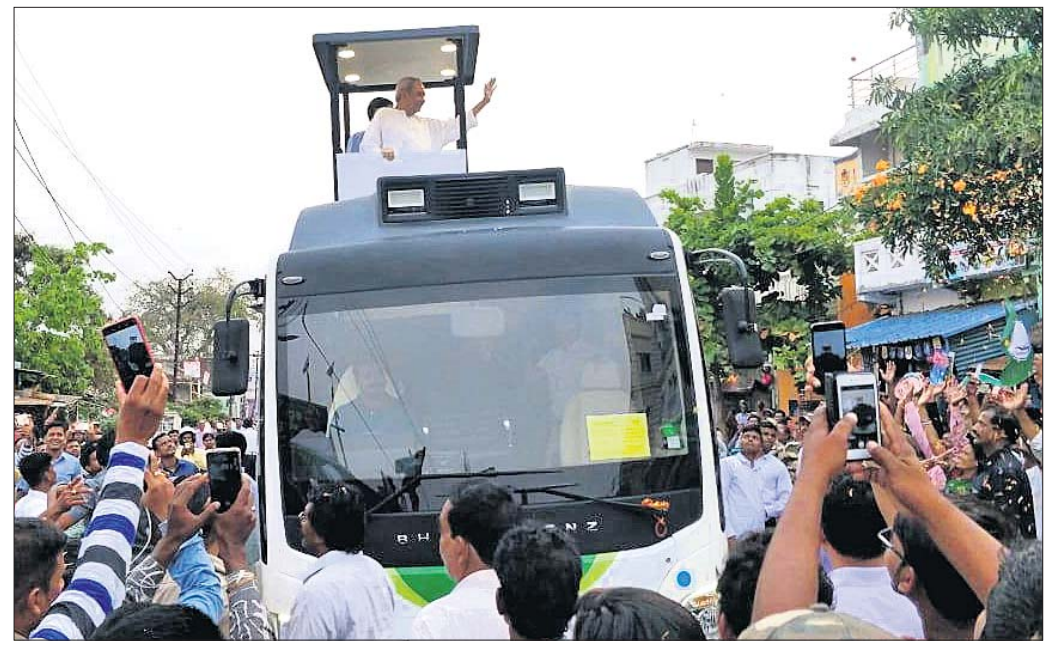
ବ୍ରହ୍ମପୁରରେ ମୁଖ୍ୟମନ୍ତ୍ରୀ ନବୀନ ପଟ୍ଟନାୟକ ରୋଡ ଶୋରେ ଯାଉଛନ୍ତି।

ନିର୍ବାଚନ ଚାରିଖ ଘୋଷଣା ପରଠାରୁ ପ୍ରଧାନମନ୍ତ୍ରୀ ନରେନ୍ଦ୍ର ମୋଦି ଏବଂ ଭାଇପା ଉଡ଼ିଶା ଗସ୍ତରେ ଆସୁଛନ୍ତି। ମୁଖ୍ୟମନ୍ତ୍ରୀ ନବୀନ ପଟ୍ଟନାୟକଙ୍କୁ ବିଭିନ୍ନ ପ୍ରସଙ୍ଗରେ ଆକ୍ରମଣ କରୁଛନ୍ତି। ବୁଧବାର ମୋଦି ଏବଂ ଶାହଙ୍କ ଉପରକୁ ଓଲଟା ଆକ୍ରମଣ କରିଛନ୍ତି ନବୀନ ପଟ୍ଟନାୟକ।