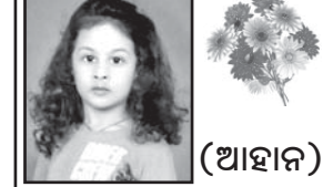
ବାଲ ଅଭିହତ ମୁହିଁ

ତୃତୀୟ କଳ୍ପଦିନ ଅବସରରେ ମାଁ ସମଲେଖଣୀ ଓ ପ୍ରଭୁ ଶ୍ରୀରାମପୁ ଅପାର କରୁଣାକୁ ପାର୍ଶ୍ୱ ନିରାମୟ କରଣପାପ ସହିତ କଳ୍ପଦିନ କଳାପଥ କୁସୁମିତ ଓ ମଙ୍ଗଳମୟ ହେବ ବୋଲି ପ୍ରାର୍ଥନା କରନ୍ତୁ । ଶୁଭେଚ୍ଛା ସଂସ୍କୃତି, ମାମା, ବିଦିତ୍ ମାମା, ବରଣା ମାଉସୀ, ମିନା, ମା, ନାନା, ପଞ୍ଚୁଗାୟା, ବାବା, ମାମା, ରାଜା, ମାମୁ, ମାଉଁ ଓ ମିଷ୍ଟି ବିନା । ୫-୧୧୯୫