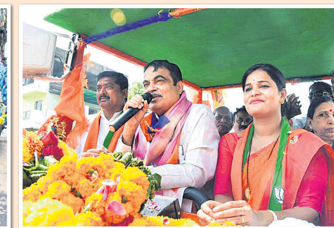
ମହାରାଷ୍ଟ୍ରର ନାଗପୁରରେ ଭାରତୀୟ ପ୍ରାର୍ଥୀ ତଥା କେନ୍ଦ୍ରମନ୍ତ୍ରୀ ନାତନ ଗଡ଼କରୀ ପ୍ରଚାର କରୁଛନ୍ତି।