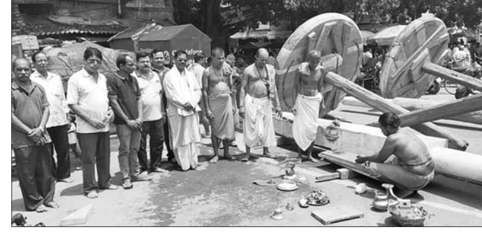
ଚକରେ ଅଫ ଲାଗିବା ପାଇଁ ପୂଜାର୍ଚ୍ଚନା କରାଯାଇଛି।

ପୂଜା ପାଳିଆ ସେବାୟତ ଉପସ୍ଥିତ ଥିଲେ। ବୁଧବାର ରଥଯାତ୍ରାରେ ଏହି ଅକ୍ଷକୁ ପୂଜାର୍ଚ୍ଚନା ପରେ ଲାଗି କରାଯାଇଥିଲା। ସୁନାପାଉଁଶ ଚଳେଇତ ୪୦ ବର୍ଷ ପରେ ୪ଟି ଯାକ ନାହାଳା ପରିବର୍ତ୍ତନ କରାଯାଇ ନୂତନ ଭାବେ ନିର୍ମାଣ କରାଯାଇଛି। ଏକଳ ୧୫ବର୍ଷ ପରେ ତୁଳସୀ ପାଞ୍ଚଦଣ୍ଡା ମହାରଣା ବଚକୃଷ୍ଣ ମହାରଣାଙ୍କ ସମେତ ବିଭିନ୍ନ ମହାରଣା, ବ୍ରହ୍ମ ମହାରଣା କାର୍ଯ୍ୟକାରୀ ଅଫ ପାଇଁ ପୂଜାର୍ଚ୍ଚନା କରାଯାଇଛି।