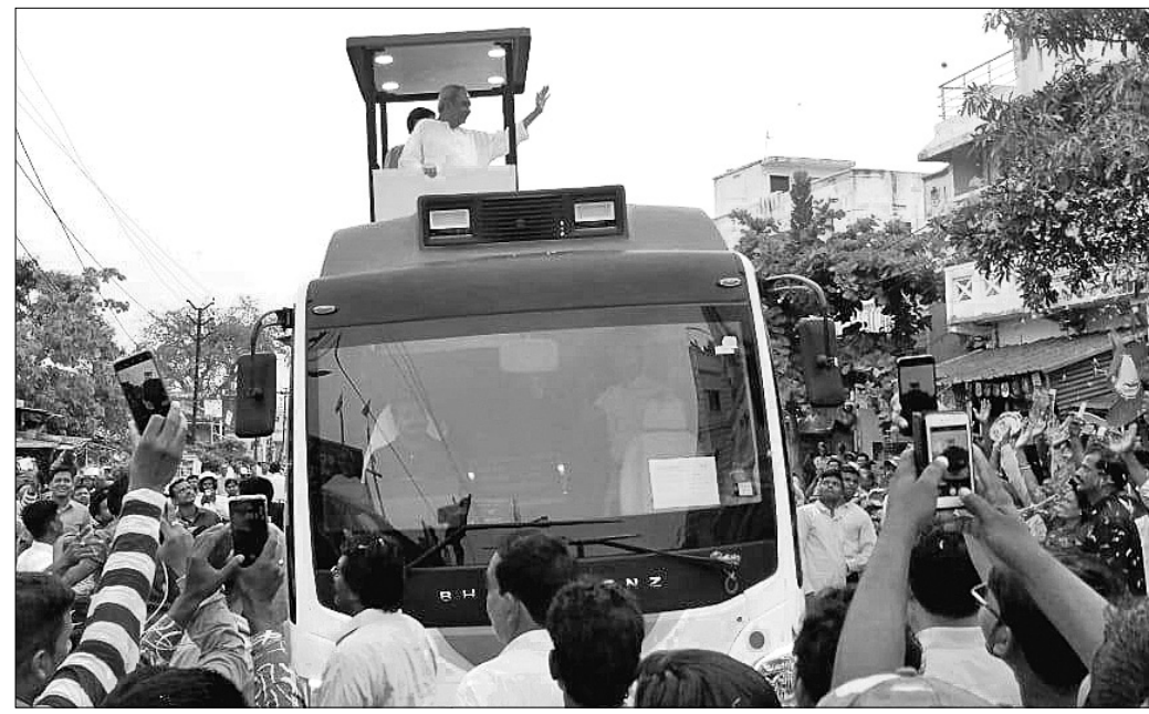
ବ୍ରହ୍ମପୁରରେ ମୁଖ୍ୟମନ୍ତ୍ରୀ ନବୀନ ପଟ୍ଟନାୟକ ଭୋଟ୍ ଶୋରେ ଯାଉଛନ୍ତି।

ନିର୍ବାଚନ ଚାରିଖ ଘୋଷଣା ପରଠୁ ପ୍ରଧାନମନ୍ତ୍ରୀ ନରେନ୍ଦ୍ର ମୋଦି ଏବଂ ଭାଇପା ରାଷ୍ଟ୍ରୀୟ ଅଧ୍ୟକ୍ଷ ଅମିତ୍ ଶାହ ବାରମ୍ବାର ଓଡ଼ିଶା ଗସ୍ତରେ ଆସୁଛନ୍ତି। ମୁଖ୍ୟମନ୍ତ୍ରୀ ନବୀନ ପଟ୍ଟନାୟକଙ୍କୁ ବିଭିନ୍ନ ପ୍ରସଙ୍ଗରେ ଆକ୍ରମଣ କରୁଛନ୍ତି। ବୁଧବାର ମୋଦି ଏବଂ ଶାହଙ୍କ ଉପରକୁ ଓଲଟା ଆକ୍ରମଣ କରିଛନ୍ତି ନବୀନ ପଟ୍ଟନାୟକ। ବ୍ରହ୍ମପୁର ସହର ଉପକଣ୍ଠ ଓଲଟା ଗୋପାଳପୁର ବିଧାନସଭା ନିର୍ବାଚନମଣ୍ଡଳୀ ଅନ୍ତର୍ଗତ କନିଷ୍ଠରେ ଆୟୋଜିତ ଏକ ନିର୍ବାଚନ ସଭାରେ ନବୀନ କହିଛନ୍ତି, ସେମାନେ (ମୋଦି ଏବଂ ଶାହ)ବାଟ୍ୟା କିଆ ମତୁଡ଼ି ଭଳି ପ୍ରାକୃତିକ ବିପର୍ଯ୍ୟୟ ବେଳେ କେବେ ଓଡ଼ିଶା ଆସିନାହାନ୍ତି। ଏବେ ନିର୍ବାଚନ ଚାଲିଥିବା ଯୋଗୁ ଓଡ଼ିଶାବାସୀଙ୍କ ଭୋଟ୍ ପାଇ ଆସୁଛନ୍ତି। ମୁଁ ତୁମ ସାଥରେ ରହିଥିଲି, ରହିଥିବି ବୋଲି ମୁଖ୍ୟମନ୍ତ୍ରୀ ନବୀନ ପଟ୍ଟନାୟକ କହିଛନ୍ତି।