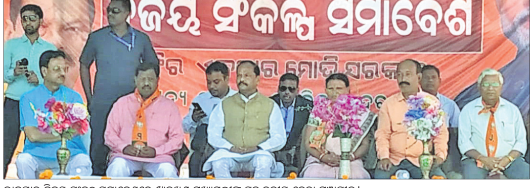
ଭାଜପାର ବିଜୟ ସଂକଳ୍ପ ସମାବେଶରେ ଝାଡ଼ଖଣ୍ଡ ମୁଖ୍ୟମନ୍ତ୍ରୀଙ୍କ ସହ ଦଳୀୟ ନେତା ମହାଧ୍ୟାନ।

ପୁରୀରୁ ଜିଲ୍ଲା କେ.ବଲାଙ୍ଗୀ ଆନ ଅନ୍ତର୍ଗତ ଗୋଡ଼ାପୋଷ ପୁରୀର ପଡ଼ିଆରେ ବୁଧବାର ଭାଜପାର ବିଜୟ ସଂକଳ୍ପ ସମାବେଶ ଅନୁଷ୍ଠିତ ହୋଇଥିଲା। ଏଥିରେ ମୁଖ୍ୟଅତିଥି ଭାବେ ଝାଡ଼ଖଣ୍ଡ ମୁଖ୍ୟମନ୍ତ୍ରୀ ରଘୁବର ଦାସ ଯୋଗଦେଇ ଲୋକେ ମୌଳିକ ସୁବିଧା ପାଇବା ଆବଶ୍ୟକ ବୋଲି କହିଥିଲେ। ଓଡ଼ିଶା ସରକାର ଲୋକଙ୍କର ଆବଶ୍ୟକ ବିକାଶ କରିପାରିନାହାନ୍ତି। ଖଣିଥିବା ଜିଲ୍ଲାରେ ଖଣି ରାଜସ୍ୱର ତିନିଶ ଶତାଂଶ ଖର୍ଚ୍ଚ ହେବା ଆବଶ୍ୟକ। ଏହି ରାଜସ୍ୱରୁ ସେହି ଅଞ୍ଚଳର ପିଇବା ପାଣି, ବିଦ୍ୟୁତ୍ ପ୍ରଭୃତି ମୌଳିକ ସୁବିଧା ଲୋକେ ପାଇବା ଦରକାର। ଯେଉଁ ସରକାର ଏସବୁ ବ୍ୟବସ୍ଥା କରିବା ପାଇଁ ଅକ୍ଷମ ସେ ସରକାର କ୍ଷମତାରେ ରହିବା ଅନୁଚିତ ବୋଲି ସେ କହିଥିଲେ। ତେଣୁ ଆଗାମୀ ନିର୍ବାଚନରେ ଭାଜପା ପ୍ରାର୍ଥୀଙ୍କୁ ଭୋଟ ଦେବା ପାଇଁ ଝାଡ଼ଖଣ୍ଡ ମୁଖ୍ୟମନ୍ତ୍ରୀ ଦାସ ଅନୁରୋଧ