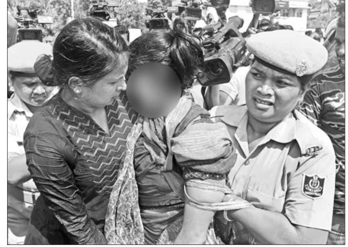
ଆତ୍ମହତ୍ତି ଉଦ୍ୟମରେ ମହିଳାଙ୍କୁ ସୁରକ୍ଷାକର୍ମୀମାନେ ଉଦ୍‌କାର କରୁଛନ୍ତି।