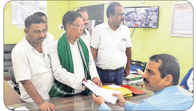
ନାମାଙ୍କନ ଦାଖଲ ଅବସରରେ ମନ୍ତ୍ରୀ ପ୍ରମୁଖ କୁମାର ମଲିକ।