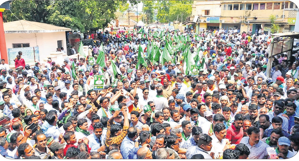
ଭୋଟାଳ ଉପଜିଲ୍ଲାପାଳଙ୍କ କାର୍ଯ୍ୟାଳୟ ବାହାରେ ବିଜେଡି କର୍ମୀଙ୍କ ଭିଡ଼।