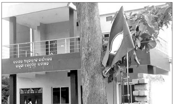
କଲୁଙ୍ଗା କେନ୍ଦ୍ରପତ୍ର ବନାଞ୍ଚଳ କାର୍ଯ୍ୟାଳୟରେ ଲାଗିଥିବା ବିଜେଡି ପତାକା।