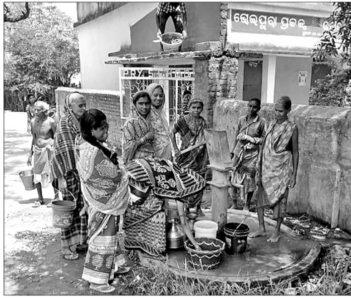
ପାଏନ୍ ଲାଗି ନଲ୍‌ରୁଆଁ ଆସେ ଗାଁର ମହିଳାମାନେ ଭିଡ଼ ଜମେଇଛନ୍ତି । ଦିନ ହେଲା ସେଥିରୁ ୨ଟା ଅଟଳ ହେଇ ପଡ଼ି ରହିଛି । ଗୁଡ଼େ ନଲ୍‌ରୁଆଁରୁ ଲାଲ୍ ପାଏନ୍ ବାହାରୁଥିଲା ବେଳେ ଆରଗୁଡ଼େ ନଲ୍‌ରୁଆଁ ଗାଁରୁ ଥିଲା କି.ପି. ଦୂରରେ ରହିଛି । ହେଲେ ଗାଁବାସୀ ଇ ଗୁଡ଼େ ନଲ୍‌ରୁଆଁ ଉପରେ ଭରସା କରି ଚଳୁଛନ୍ତି । ଅତୀତରା

କାମଗିରୀ, ୪୫ (ଡି.ଏନ.ଏ) ଆଗକ୍ତ ଖରାଦିନ ମାଡ଼ି ଆସୁଥିବା ଭିତର ଭିତର ଜାଗାରେ ଥାନାରେ ପରଶ୍ରାମ ଖରା ଦିନର ମୁକାବିଲା ଲାଗି ତିଆର ହେଉଥିଲା । ଗାଁ ଥାନା ସହରମାନଙ୍କ ଅଟଳ ପିଲଲା ପାଏନ୍ ପ୍ରକଳ୍ପ, ନଲ୍‌ରୁଆଁମାନ ସତର କରାଯାଇଥିଲା । ହେଲେ ବରଗଡ଼ ଜିଲ୍ଲା ଅତୀତରା ଏବଂ ଏହି ଅଧୀନ ଭୋଇପୁରା ଗାଁରେ ଥିବା ୪ଟା ନଲ୍‌ରୁଆଁ ଭିତରୁ ୨ଟା ନଲ୍‌ରୁଆଁ ୧୫ ଦିନ ହେଲା ଅଟଳ ହେଇ ପଡ଼ିଥିଲା । ଇ ବାବଦ ବାରବାର ଏବଂ ବିଦ୍ୟୁତ୍ କର୍ମକ୍ଷେତ୍ର କହିଲେ ବି କିଛି ଲାଭ ନାହିଁ ହେଉଥିବାର ଅଭିଯୋଗ ହେଇଛି । ଖବର ଅନୁଯାୟୀ ଅତୀତରା ଏବଂ ଏହି ୪ ନମ୍ବର ଘାଟି ଭୋଇପୁରାବାସୀ ପିଲଲା ପାଏନ୍ ଲାଗି ଡହକ୍‌ବିକଳ ହେଉଛନ୍ତି । ଗାଁ ଲୋକ ସଂଖ୍ୟା ପାଖାପାଖି ୩ ହଜାର । ଗାଁବାସୀଙ୍କର ବେଭାର ଲାଗି ଗାଁରେ ୪ଟା ନଲ୍‌ରୁଆଁ ରହିଛି, ହେଲେ ୧୫