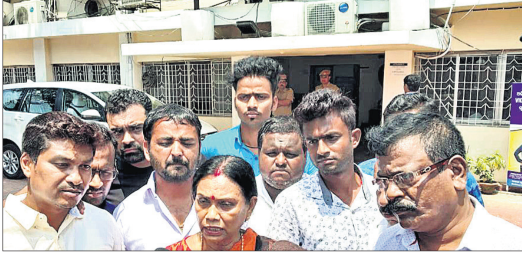
ରାଜ୍ୟ ନିର୍ବାଚନ କମିଶନଙ୍କ କାର୍ଯ୍ୟାଳୟ ସମ୍ମୁଖରେ ରାଜ୍ୟସଭା ସଦସ୍ୟା ସରୋଜିନୀ ହେମ୍ବର ଓ ଅନୁଗମନେ ।