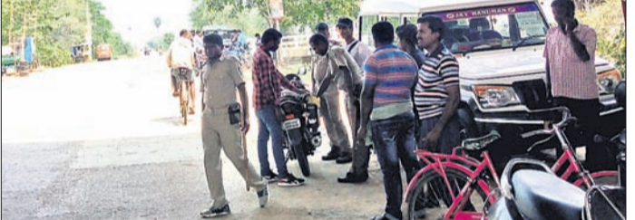
ଘୁଇଁ ଖୁଇଁ ପକ୍ଷରୁ ଯାଅ କରାଯାଇଛି ।

ବସ୍ତା, ୪୫ (ସ.ପ୍ର.) ସାଧାରଣ ନିର୍ବାଚନ ପାଇଁ ବସ୍ତା ନିର୍ବାଚନମଣ୍ଡଳରେ ପ୍ରମୁଖ ବଳକ ପକ୍ଷରୁ ପ୍ରାର୍ଥୀ ତାଲିକା ଘୋଷଣା ହୋଇଛି । ନିର୍ବାଚନକୁ ସ୍ୱଳ୍ପ ଓ ନିରପେକ୍ଷ ଭାବେ ଶେଷ କରିବା ପାଇଁ ନିର୍ବାଚନ ଅଧିକାରୀଙ୍କ ପ୍ରୟାସ ଜାରି ରହିଛି । ନିର୍ବାଚନରେ ଭୋଟରଙ୍କୁ ଆକୃଷ୍ଟ କରିବା ପାଇଁ ଅର୍ଥ କାରବାର ହେବାର ଆଶଙ୍କା କରି ଯାଅ ପ୍ରକ୍ରିୟା ଆରମ୍ଭ ହୋଇଛି । ରୁଧିର ରାତିରୁ ବସ୍ତା ତହସିଲଦାର ବନା ଥିବା ବେଳେ ୨ଟି ମାଲ୍ ହାତୀ ଓ ୨ଟି ସାବତ ଥିବାର ଘୋଷାଯାଇଛି । ତେବେ ଗତ ରୁଧିର ରାତିରେ ଆରପତା ପଞ୍ଚାୟତର ଖୁରିପଦା ଗ୍ରାମକୁ ପଶି କେତେକ ବାଡ଼ିରେ ଘର ପତ୍ର ନଷ୍ଟ କରିଥିବା ବେଳେ ଜଙ୍ଗଲ ମଧ୍ୟ କୁ ପଶିଥିଲେ । ଗୁରୁବାର କୁଆମରା