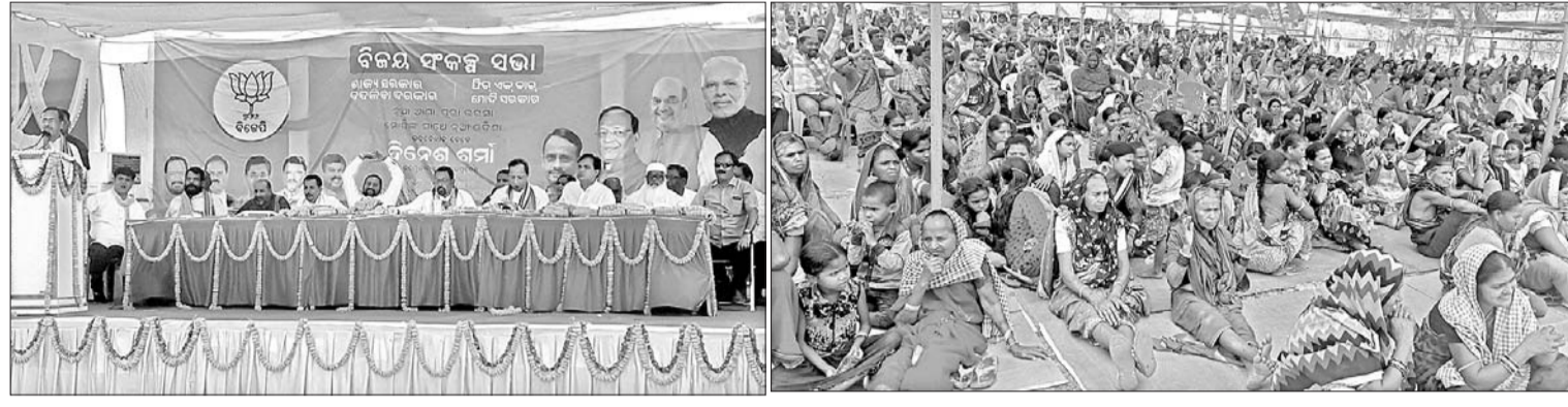
ଭାଜପାର ବିଜୟ ସଙ୍କଳ୍ପ ଯାତ୍ରାରେ ଅତିଥିବୃନ୍ଦ (ବାମ) । ବିଜୟ ସଂକଳ୍ପ ଯାତ୍ରାରେ ଯୋଗଦେଇଥିବା ଜନସାଧାରଣ ।

ନୂଆପଡ଼ା ଅତିଥି, ୪୧୪ ଓଡ଼ିଶା ଗରିବ ରୁହେଁ । ହେଲେ ଏଠିକାର ନେତାଙ୍କ ଗରିବ ମନୋଭାବ ଗରିବ କରିଛି । ଏଠାରେ ପ୍ରକୃତି ବନ୍ଧୁ ସମ୍ପତି ଦେଇଛି । କେନ୍ଦ୍ର ସରକାର ଯୋଜନାସବୁ କାର୍ଯ୍ୟକାରୀ କରିବାକୁ ଚାହୁଁଥିଲେ ମଧ୍ୟ ଏଠିକାର ସରକାର ତାହା କାର୍ଯ୍ୟକାରୀ କରିବାକୁ ଦେଉନାହାନ୍ତି । ତେଣୁ ଉଭୟ ରାଜ୍ୟ ଏବଂ କେନ୍ଦ୍ରରେ ଗୋଟିଏ ଭାଜପା ସରକାର ଆସିବା ଦରକାର । ତତକାଳ ଉତ୍ତମ ଆସିଲେ ଭଲ କାମ ହେବ ବୋଲି ଗୁରୁବାର ମଧ୍ୟାହ୍ନରେ ନୂଆପଡ଼ା ଜିଲ୍ଲା ସଦର ମହକୁମାଠାରୁ