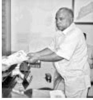
ଦିହାରୀ ବନ୍ଧୁ ପଲେଇ