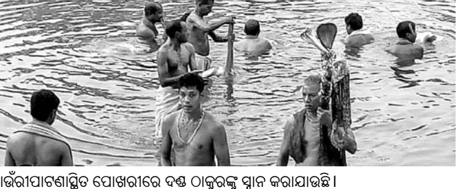
କାଉଁରୀପାଟଣାସ୍ଥିତ ପୋଖରୀରେ ଦଣ୍ଡ ଠାକୁରଙ୍କୁ ସ୍ନାନ କରାଯାଇଛି ।

ବୋଲଗଡ଼, ୪୪ (ଡି.ଏନ.ଏ.) ବୋଲଗଡ଼ ବ୍ଲକର ବିଭିନ୍ନ ସ୍ଥାନରେ ପରମ୍ପରା ଅନୁସାରେ ବୋଲପୁଣିଆଠାରୁ ଦଣ୍ଡ ଉପାସନା ପର୍ବ ଆରମ୍ଭ ହୋଇଯାଇଛି। ଏହା ପଣାସଂସ୍କୃତି ପର୍ଯ୍ୟନ୍ତ ଚାଲିଥାଏ। ୨୧, ୧୭, ୧୩, ୧୧ ଓ ୭ ଦିନ ଧରି ଦଣ୍ଡଆମାନେ ଦଣ୍ଡ ଉପାସନା କରିଥାନ୍ତି। ଗାଁରେ ବିଭିନ୍ନ ଗ୍ରାମରେ ଦଣ୍ଡଯାତ୍ରା ଆୟୋଜିତ ହୋଇଥାଏ। ଦଣ୍ଡଯାତ୍ରା ମାଧ୍ୟମରେ ଦଣ୍ଡ ଠାକୁରଙ୍କ ମହିମା ପ୍ରସାର ହୋଇଥାଏ। ଉଲ୍ଲେଖଯୋଗ୍ୟ, ବ୍ଲକର କାଉଁରୀପାଟଣା, ନୀଳକଣ୍ଠେଶ୍ୱରଦେବ, ସାହୁଗୁଣ୍ଡି, ବାଲୁକେଶ୍ୱରଦେବ, ବାଲକେଶ୍ୱର ଦେବ, ମାଣିବନ୍ଧର ମାଣିକେଶ୍ୱରଦେବ, ମାଲିସାହି, ଗୋବର୍ଦ୍ଧନପୁର, ଗର୍ଭାପାତା, ଠାଣାପଲ୍ଲୀ, ଅଧରଳା, କଅଁରପୁର, ଚମ୍ପାଲୋଇ, ସାନ୍ତପୁର, ଆଜିକାମା, ବୋଲଗଡ଼, ମାଣିକାଗୋଡ଼ା ଆଦି ଗ୍ରାମରେ ଦଣ୍ଡ