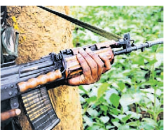
ଯବାନମାନେ ମାଓବାଦୀ ଅଧିକୃତ ମାହାଲା ଜଙ୍ଗଲ ଅଞ୍ଚଳକୁ ନିୟନ୍ତ୍ରଣ ପାଟ୍ରୋଲିଂରେ ଯାଇଥିଲେ । ସେମାନଙ୍କୁ ଦେଖି ମାଓବାଦୀମାନେ ଆଖୁବୁଜା ପୂର୍ଣ୍ଣା-୪

ନିର୍ବାଚନ ପୂର୍ବରୁ ଛତିଶଗଡ଼ର ବସ୍ତ୍ର ଅଞ୍ଚଳରେ ମାଓବାଦୀମାନେ ଗୁରୁବାର ପୁରୁଣା ବକ ଉପରେ ଜୋରଦାର ଆକ୍ରମଣ କରିଛନ୍ତି । ସେମାନଙ୍କ ଅତୀତ ଆକ୍ରମଣରେ ସୀମା ପୁରୁଣା ବକ (ବିଏସ୍‌ଏଫ୍)ର ୪ ଯବାନ ଶହୀଦ ହୋଇଛନ୍ତି । କଙ୍କେର ଜିଲ୍ଲାରେ ହୋଇଥିବା ଏହି ଆକ୍ରମଣରେ ଜଣେ ଆସିଷ୍ଟାଣ୍ଟ ସବ୍‌ଇନ୍‌ସ୍ପେକ୍ଟର ଏବଂ ୩ କନ୍‌ଷ୍ଟେବଲଙ୍କ ଜୀବନ ଯାଇଛି । ବିଏସ୍‌ଏଫ୍