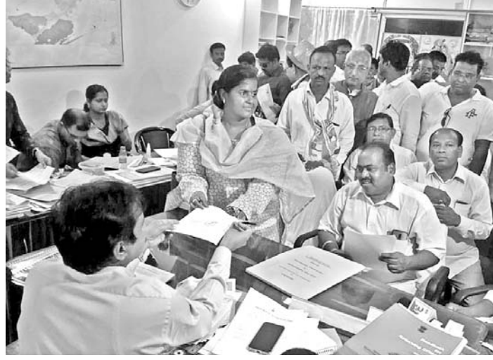
କଂଗ୍ରେସ ପକ୍ଷରୁ ସ୍ୱାଗତକା ପଞ୍ଜନାୟକ ଖୋର୍ଦ୍ଧା ନିର୍ବାଚନମଣ୍ଡଳରୁ ପ୍ରାର୍ଥପତ୍ର ଦାଖଲ କରୁଛନ୍ତି ।