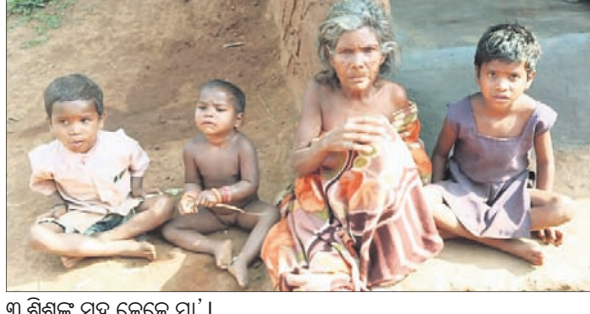
୩ ଶିଶୁଙ୍କ ସହ କେଜେ ମା'।