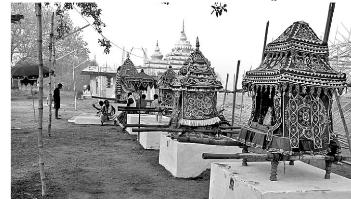
ଦୋଳ ମଣ୍ଡପରେ ବିନା ସବୁ ରଖାଯାଇଛି ।

ବେଗୁନିଆ, ୪୪ (ଡି.ଏନ.ଏ.) ବେଗୁନିଆ ବୁକ କରଡ଼ଗାଡ଼ିଆ ଗ୍ରାମସ୍ଥିତ ଯାତ୍ରା ପଡ଼ିଆରେ ବୁଧବାର ସକାଳୁ ୧୨ ଦୋଳ ଯାତ୍ରା ଆରମ୍ଭ ହୋଇଛି। ତେବେ ଯାତ୍ରା ପଡ଼ିଆରେ ବେଳକୁ ବେଳ ଶ୍ରୀକାଳୀନାମକ ଭିତ ଜମିବାରେ ଲାଗିଛି। ପରମ୍ପରା ଅନୁଯାୟୀ ଅତି ସ୍ଥିତ ହଳଦେଶ୍ୱର ଦେବ ଧାନପତି ଠାକୁର ଭାବେ ପ୍ରଥମେ ନିମନ୍ତ୍ରଣ ହୋଇ କରଡ଼ଗାଡ଼ିଆ ସାହି ଶୋଭାଯାତ୍ରାରେ ବାହାରିଥିଲେ। ଶୋଭାଯାତ୍ରା ଆରମ୍ଭ ଯୋଡ଼ାନାଟ, ବୁଢ଼ାବୁଢ଼ା, କଳାଘୋଡ଼ା, ବାଘବାଘୁଣୀ ଆଦି ବିଭିନ୍ନ ବେଶ ଧାରା ନୃତ୍ୟ ପରିବେଷଣ କରାଯାଇଥିଲା। ବାକା, ବାଣ ଓ ଏଲଇଡି ଲାଇଟ ସହ ପ୍ରକମ୍ପିତ ହୋଇଥିଲା। ସ୍ଥାନୀୟ ଅଞ୍ଚଳର ୧୧ ଗ୍ରାମର ସ୍ୱେଚ୍ଛାସ୍ତ୍ରୀ ଦେବ, ରାଧାକାନ୍ତ