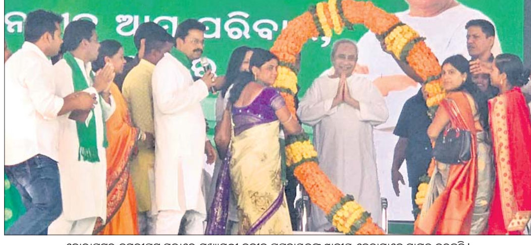
କୋରାପୁଟର ଭୁବାରାପୁଟ ସଭାରେ ମୁଖ୍ୟମନ୍ତ୍ରୀ ନବୀନ ପଟ୍ଟନାୟକଙ୍କୁ ସ୍ଥାନୀୟ ନେତାମାନେ ସ୍ୱାଗତ କରୁଛନ୍ତି।

ବିଜେଡି ସରକାର ଗଢ଼ିଲେ ପ୍ରଥମ ଦିନରେ ହିତାଧିକାରୀଙ୍କୁ କାଳିଆ ଯୋଜନାର ଅର୍ଥ ପ୍ରଦାନ କରିବା ବାକି ଥିବା ୨୫ ଲକ୍ଷ ଟାଙ୍କା କାଳିଆ ଯୋଜନାର ଅର୍ଥ ୨ଟି କିସ୍ତିରେ ପାଇବେ। ଅଭିଭକ୍ତ କୋରାପୁଟ ମାଟିରେ ନିର୍ବାଚନ ପ୍ରଚାର ବେଳେ ଏଭଳି ପ୍ରତିଶ୍ରୁତି ରଖିଛନ୍ତି ମୁଖ୍ୟମନ୍ତ୍ରୀ ନବୀନ ପଟ୍ଟନାୟକ। ଶୁକ୍ରବାର ମୁଖ୍ୟମନ୍ତ୍ରୀ କୋରାପୁଟ ଓ ମାଲକାନଗିରି ଜିଲ୍ଲାରେ ମାରାଥ୍ ପ୍ରଚାର କରିଛନ୍ତି। ଜୟପୁର ମାଟିରୁ ବିଜେଡି ଲଘାହାରର ସାମାନ୍ୟ ପ୍ରାଣ୍ଟ ସୂଚନା ଦେଇ ନବୀନ କହିଛନ୍ତି, ଲଘାହାରରେ କୃଷକ କଲ୍ୟାଣକୁ ଆଣେ ସର୍ବାଗ୍ରେ ରଖୁଛି। କାଳିଆ ଯୋଜନାରେ ୪୦ ଲକ୍ଷ ଟାଙ୍କା ଲାଭ ପାଇଲେଣି। ଆଗକୁ ମଧ୍ୟ ବକଳା ଟାଙ୍କା ଲାଭ ପାଇବେ। କେହି ଜଣେ ମଧ୍ୟ ଏଥିରୁ ବଞ୍ଚିତ ହେବେନାହିଁ ବୋଲି ସେ ଦୃଢ଼ ପ୍ରତିଶ୍ରୁତି ଦେଇଛନ୍ତି। ଏହାସହ କେନ୍ଦ୍ର ସରକାରଙ୍କୁ ବିଜ୍ଞାନ ପ୍ରସଙ୍ଗରେ ଗାର୍ଭେଇ କରିଛନ୍ତି। ଶୁକ୍ରବାର ପୂର୍ବାହ୍ନରେ ପ୍ରଥମେ ମାଲକାନଗିରି ଜିଲ୍ଲାର କାଳିମେଳା ଓ ମାଥୁଲିରେ ନିର୍ବାଚନ ସଭା କରିବା ପରେ