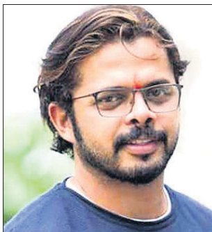
ଦେଶର ସର୍ବୋଚ୍ଚ କୋର୍ଟ ବିସିସିଆଇର ବିସିସିଆଇ କମିଟିକୁ ଶ୍ରୀସନ୍ଧ୍ୟା ଦଣ୍ଡାଦେଶ ଆଜ୍ଞାପନ ବାସ୍ତବ୍ୟରେ ଉପରେ ପୁନଃ ବିଚାର କରିବାକୁ କହିଥିଲେ।