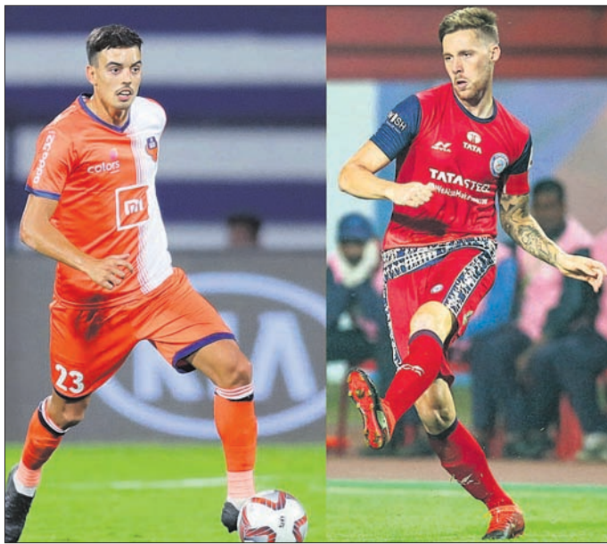
ଭୁବନେଶ୍ୱର, ୫/୪ (କ୍ରୀଡ଼ା ପ୍ରତିନିଧି)

ଯେତେବେଳେ ଏକ ଦଳ କ୍ରୀଡ଼ାଗତ ଭଲ ପ୍ରଦର୍ଶନ କରିଥାଏ ତେବେ ସେହିଦିନ ରାଜ୍ୟଗୋଷ୍ଠୀ କ୍ରୀଡ଼ା ଓ ଏସିଆନ୍ ଗେମ୍ସରେ ସର୍ବ ପଦକ ଜିତିଥିବା ନୀରଜଙ୍କୁ ଶ୍ରେଷ୍ଠ ପୁରୁଷ କ୍ରୀଡ଼ାବିତ ଭାବେ ଲବ୍ଧପଦକ ମିଳିଛି।