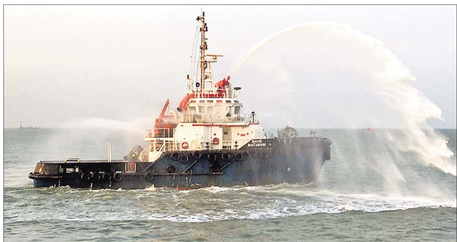
ମେରାଇନ ଶୋ ପ୍ରଦର୍ଶନ କରାଯାଇଛି।