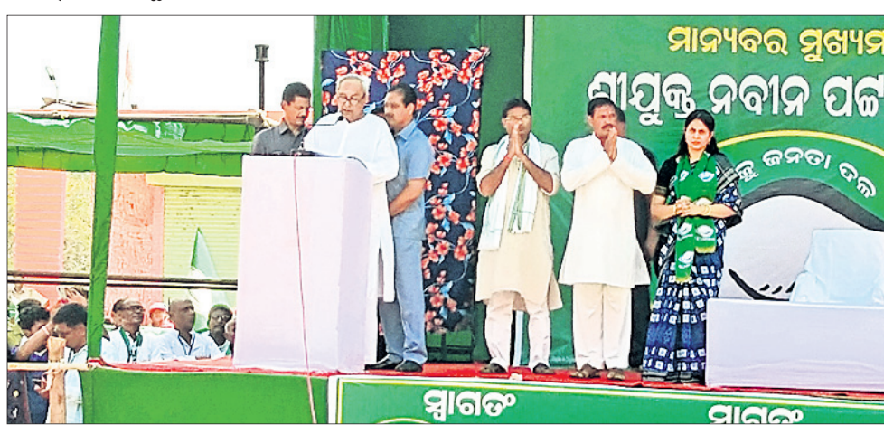
ଲାଞ୍ଜିଗଡ଼ ରୁକ୍ ବିଶ୍ୱନାଥପୁର ନିର୍ବାଚନ ସଭାରେ ମୁଖ୍ୟମନ୍ତ୍ରୀ ନବୀନ ପଟ୍ଟନାୟକ ଉଦ୍‌ବୋଧନ ଦେଉଛନ୍ତି।

ଭବାନୀପାଟଣା/ଲାଞ୍ଜିଗଡ଼, ୯/୪(ଡି.ଏନ.ଏ.) ପ୍ରଥମ ପର୍ଯ୍ୟାୟ ନିର୍ବାଚନରେ କଳାହାଣ୍ଡି ଲୋକ ସଭା ଆସନ ସମେତ କଳାହାଣ୍ଡି ଓ ନୂଆପଡା ଜିଲାର ୬ ବିଧାନସଭା ଆସନ ନିମନ୍ତେ ୧୧ ଚାରିଖରେ ଭୋଟ ଗ୍ରହଣ ହେବ। ଏଥିଲାଗି ୯ ଚାରିଖ (ମଙ୍ଗଳବାର) ସନ୍ଧ୍ୟାରେ ପ୍ରଚାର ଶେଷ ହେଉଥିବା ବେଳେ ମୁଖ୍ୟମନ୍ତ୍ରୀ ନବୀନ ପଟ୍ଟନାୟକ କଳାହାଣ୍ଡି ଉପଖଣ୍ଡରେ ଚାରିଖ ଗ୍ରହଣ କରିବା ସମୟରେ କଳାହାଣ୍ଡିର ବିଭିନ୍ନ ସ୍ଥାନରେ ମୁଖ୍ୟମନ୍ତ୍ରୀଙ୍କ ମାରାଧନ ପ୍ରଚାର କରିବାକୁ ବିନା ସୁଧରେ ରଣ ପ୍ରଦାନ ବ୍ୟବସ୍ଥା କରାଯିବ।