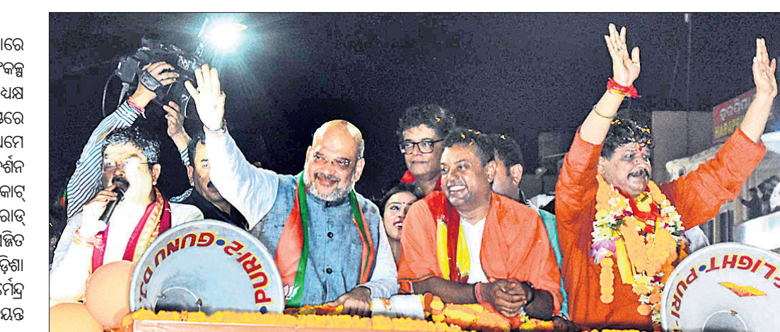
ରୋଡ୍ ଶୋ'ରେ ଭାଜପା ରାଷ୍ଟ୍ରୀୟ ଅଧ୍ୟକ୍ଷ ଅମିତ୍ ଶାହ, ପୁରୀ ଲୋକ ସଭା ପ୍ରାର୍ଥୀ ସମିତ୍ ପାତ୍ର ଓ ଅନ୍ୟ ନେତାମାନେ।