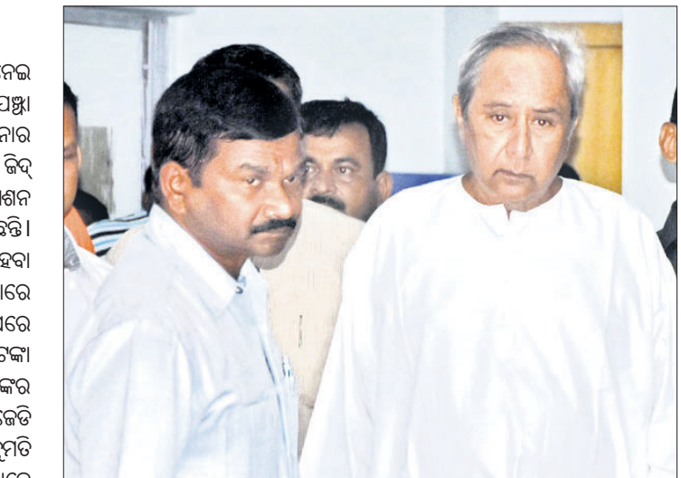
ମୁଖ୍ୟମନ୍ତ୍ରୀ ନବୀନ ପଟ୍ଟନାୟକ ସିଇଓଙ୍କୁ ଭେଟି ଫେରୁଛନ୍ତି। ସାକ୍ଷାତ୍ କରି ସ୍ମାରକପତ୍ର ଦେଇଥିଲେ। ଏହା ପରେ ଖୋର୍ଦ୍ଧା ବିଜେଡି ସଭାପତି ତଥା ମୁଖ୍ୟମନ୍ତ୍ରୀ ନବୀନ ପଟ୍ଟନାୟକ ମଙ୍ଗଳବାର ଅପରାହ୍ଣରେ ସିଇଓଙ୍କୁ ଭେଟି କାଳିଆ ଯୋଜନାକୁ କାର୍ଯ୍ୟକାରୀ କରିବା ପାଇଁ ଆପଣା

କାଳିଆ ଯୋଜନା ଚଳା ଦେବାକୁ ନେଇ ବିଜେଡି ଓ ଭାଜପା ମଧ୍ୟରେ ଛକାପଞ୍ଚା ଲାଗି ରହିଛି। କାଳିଆ ଯୋଜନାର ଦ୍ୱିତୀୟ କିଛି ଅର୍ଥ ଦେବାକୁ ବିଜେଡି ଜିଏ ପରିଥିବାବେଳେ ନିର୍ବାଚନ କମିଶନ ଏହା ଉପରେ କଟକଣା ଲଗାଇଛନ୍ତି। ନିର୍ବାଚନ ଆଚରଣ ବିଧି ଲାଗୁ ହେବା ପରେ କମିଶନ କାଳିଆ ଯୋଜନାରେ ଦିଆଯାଉଥିବା ସହାୟତା ରାଶି ଉପରେ କଟକଣା ଲଗାଇଛନ୍ତି। ଏହାର କିଛି ଚଳା ନ ପାଇବାରୁ କାଳିଆ ଯୋଜନାରେ ଅସହାୟ ବଢ଼ିବ ବୋଲି ବିଜେଡି ଚିନ୍ତାରେ ପଡ଼ିଛି। ତେଣୁ ଏଥିପାଇଁ ଅନୁମତି ଦେବା ସକାଶେ ବିଜେଡି ନେତାମାନେ ନିୟମିତ ରାଜ୍ୟ ମୁଖ୍ୟ ନିର୍ବାଚନ ଅଧିକାରୀ(ସିଇଓ)ଙ୍କୁ ଭେଟୁଥିଲେ ମଧ୍ୟ କୌଣସି ପ୍ରଫୁଲ୍ଲ ମିଳୁ ନାହିଁ। ଏପରି କି ବିଜେଡିର ଏକ ପ୍ରତିନିଧି ଦଳ ନୂଆଦିଲ୍ଲୀ ଗସ୍ତକରି କାଳିଆ ଯୋଜନାକୁ ଅନୁମତି ଦେବାକୁ ଭାରତର ନିର୍ବାଚନ କମିଶନକୁ