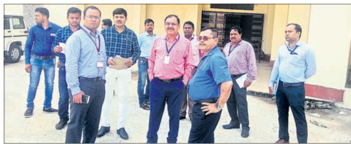
ଜିଲ୍ଲାରେ ପହଞ୍ଚିଥିବା ପର୍ଯ୍ୟବେକ୍ଷକ ।