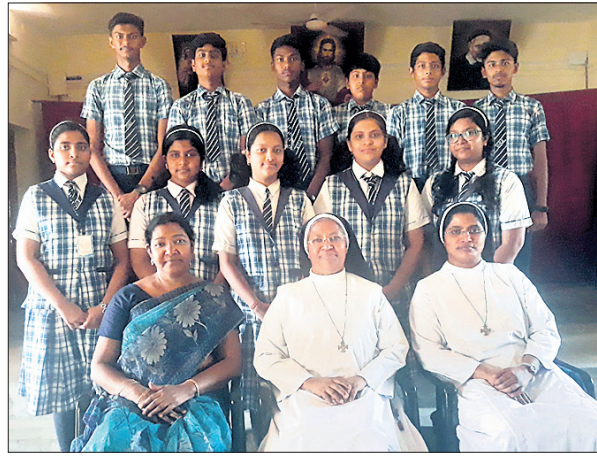
ମହାକାଶ ଗବେଷଣା କେନ୍ଦ୍ରର ସେକ୍ସ ଜିଲ୍ଲାସ୍ତରୀୟ କଳ୍ପନାଶିଳ୍ପ ପ୍ରତିଯୋଗିତାରେ ଭାଗ ନେଉଥିବା ଛାତ୍ରାଛାତ୍ରୀମାନଙ୍କ ସହିତ ମନୋନୀତ ଛାତ୍ରାଛାତ୍ରୀମାନେ।

ଆସନ୍ତା ୧୩, ୧୪ ଓ ୧୫ରେ ଯୁବଯୁବତୀ ଓ ଉଚ୍ଚମାଧ୍ୟମିକ ନ୍ୟାଶନାଲ ଏକାଡେମିକ୍ ଆଣ୍ଡ ଡେଭଲପମେଣ୍ଟ ଆଡମିନିଷ୍ଟ୍ରେସନ(ନାସା) କେନ୍ଦ୍ର ପରିସରରେ ଅନ୍ତର୍ଜାତୀୟ ରଚନା ପ୍ରତିଯୋଗିତା ସାଙ୍ଗକୁ ମହାକାଶ ବିଜ୍ଞାନ ସମ୍ପର୍କିତ ସମ୍ମିଳନୀ ଅନୁଷ୍ଠିତ ହେବ। ଏଥିରେ ବିଭିନ୍ନ ଦେଶର ଡିଭାଇନିକାଲ ସମେତ ବହୁ ମେଧାବୀ ଛାତ୍ରାଛାତ୍ରୀ ଭାଗ ନେବେ। ବାଲେଶ୍ୱର ସେକ୍ସ ଜିଲ୍ଲାସ୍ତରୀୟ କଳ୍ପନାଶିଳ୍ପ ପ୍ରତିଯୋଗିତାରେ ଅଂଶଗ୍ରହଣ କରିବା ଲାଗି ମନୋନୀତ ହୋଇ ଜିଲା ତଥା ରାଜ୍ୟ ପାଇଁ ଚୂନା ହୋଇଥିବା ଛାତ୍ରାଛାତ୍ରୀମାନଙ୍କୁ ନାସା କେନ୍ଦ୍ରରେ ପଢ଼ାଯିବ।