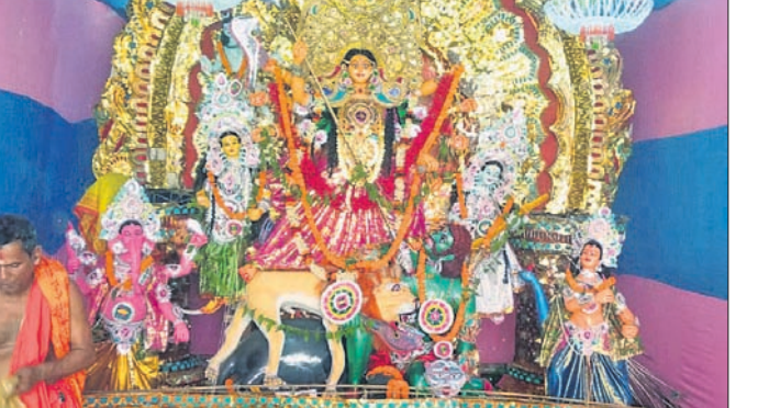
ଆନିକଟ ବାସନ୍ତୀ ଦୁର୍ଗା ।

ଭଣ୍ଡାରିପୋଖରୀ, ୧୨/୪(ଡି.ଏନ.ଏ.): ଭଣ୍ଡାରିପୋଖରୀ ବ୍ଲକର ବିଭିନ୍ନ ସ୍ଥାନରେ ବାସନ୍ତୀ ଦୁର୍ଗାପୂଜା ଧୂମଧାମରେ ପାଳିତ ହେଉଛି । ଭଣ୍ଡାରିପୋଖରୀ ବଜାର, କନ୍ଦରାପୋଖରୀ, ବାରିକପୁର, ମଞ୍ଜୁରି, ଜଗନ୍ନାଥପ୍ରସାଦ, ବାଲିପୋଖରୀ ଠାରେ ମାଙ୍କ ମୂର୍ତ୍ତୀ ସ୍ଥାପନ କରାଯାଇ ପୂଜାର୍ଚ୍ଚନା ହୋଇଛି । ବାରିକପୁର କଲେଜପତିଆଠାରେ ବାସନ୍ତୀ ଦୁର୍ଗା ପୂଜା ପାଳନ କରାଯାଇଛି । ବଜାର ବ୍ୟବସାୟୀ ଓ ଶ୍ରମିକଙ୍କ ସହଯୋଗରେ ଏହି ପୂଜା