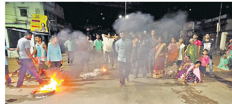
ଉତ୍ତମ ଲୋକେ ଗାୟାର ଜାଲି ରାସ୍ତାରେକୋ କରିଛନ୍ତି।