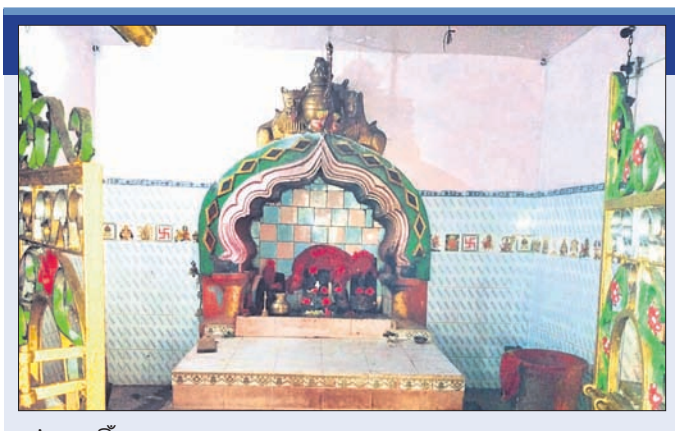
ମା' ସୁନାମୁହିଁ ପୀଠ ।

ଦିବ୍ୟମୁଖ ସୁବର୍ଣ୍ଣ ପରି ଝଲୁଥାଏ । ପଣା ସଂକ୍ରାନ୍ତିରେ ଚଢ଼କିଆର ବେଶରେ ଭକ୍ତଙ୍କୁ ଦର୍ଶନ ଦିଅନ୍ତି ମା' । ନିଶାନ୍ତରେ ମାନସିକଧାରୀମାନେ ଛାଗ ବଳି ପକାଇ ମାଟି ଘୋଡ଼ା ଚଢ଼ାଇଥାନ୍ତି । ସଂକ୍ରାନ୍ତି ପୂର୍ବଦିନ ମାସାନ୍ତରେ ସକାଳୁ ପାଞ୍ଚଘଟ ପୂଜା ଅନୁଷ୍ଠିତ ହୋଇ ଛାଗ ବଳି ପଡ଼ିଥାଏ । ବଳି ପଡ଼ିସାରିବା ପରେ ପୂର୍ବରୁ ଉପାସନାରେ ରହିଥିବା କାଳିଣୀ ମାତୁଣ୍ଡୀ ବେଳେଲକୁ ଲାଗିଥାଏ । କାଳିଣୀ ଘଣ୍ଟ ବାଜାର ସ୍ୱରରେ ନାଚି ନାଚି ଚରକ ଖୁଣ୍ଟ ପାଇଁ ଗଛ ଚଢ଼କ କରିବାକୁ ଯାଇଥାନ୍ତି । କାଳିଣୀ ଗ୍ରାମକୁ ଗ୍ରାମ ଯାଇ ଚରକ ଖୁଣ୍ଟ ପାଇଁ ଚେକ୍ଚୁଲ ଗଛ ଚଢ଼କ କରିଥାଏ । ଗଛ ଚଢ଼କ ପରେ ସେଠାରେ ପୂଜାର୍ଚ୍ଚନା କରାଯାଇଥାଏ । ସଂକ୍ରାନ୍ତି ପରଦିନ ସେହି ଗଛକୁ ରଜକ ଛେଦନ କରି ମା'ଙ୍କଠାରେ ଆଣି ରଖିଥାଏ । ଆସନ୍ତା ୨୧ ତାରିଖ ସକାଳେ ପୂଜା ପାଉଥିବା ଚରକ ଖୁଣ୍ଟ ଉଠିଲେ ଉତ୍ସବ ସମାପନ ହୋଇଥାଏ । ବୈତରଣୀ ନଦୀକୂଳରେ ଥିବା ଏହି ପୀଠ ଆଖପାଖ ଅଞ୍ଚଳବାସୀଙ୍କ ଭକ୍ତି ଓ ଆଧ୍ୟାତ୍ମିକ