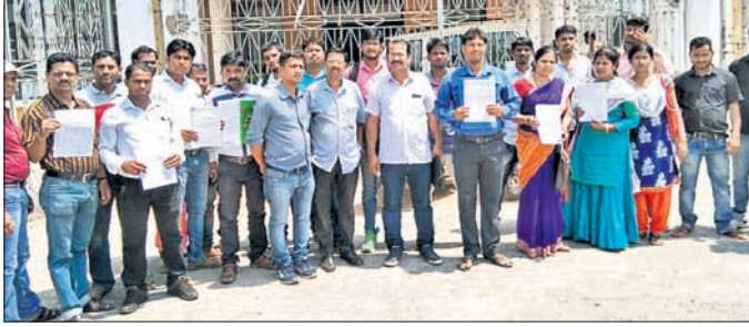
ଜିଲ୍ଲାପାଳଙ୍କ କାର୍ଯ୍ୟକାଳ ସମ୍ବନ୍ଧରେ ସ୍କୁଲ ସଂଯୋଜକ ସଂଘ ।