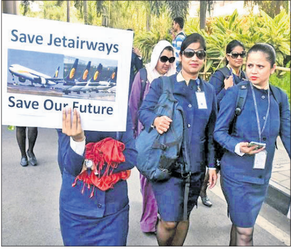
ଜେଟ୍ ଏୟାରୱେଜ୍ କର୍ମଚାରୀମାନେ ପୁଲ୍‌କାର୍ଟ ଧରି ମାର୍ଚ୍ଚ କରୁଛନ୍ତି।

କେନ୍ଦ୍ର ଏୟାରୱେଜ୍ ସଙ୍କଟ ଦିନକୁ ଦିନ ବୃଦ୍ଧି ପାଇଥିବା ବେଳେ କମ୍ପାନୀ ବନ୍ଦ ହେବାର ଭୀତିରେ ଦେଶରେ ଆସି ପହଞ୍ଚିଲେ... କେନ୍ଦ୍ର ଏୟାରୱେଜ୍ କର୍ମଚାରୀମାନେ ପୁଲ୍‌କାର୍ଟ ଧରି ମାର୍ଚ୍ଚ କରୁଛନ୍ତି।