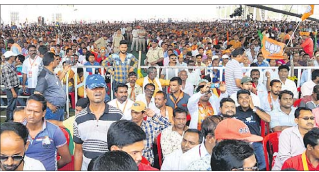
ସଭାରେ ଯୋଗ ଦେଇଥିବା ଭାବପା କର୍ମୀ ।