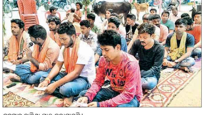
ହନୁମାନ ଚାଳିଶା ପାଠ କରାଯାଇଛି ।