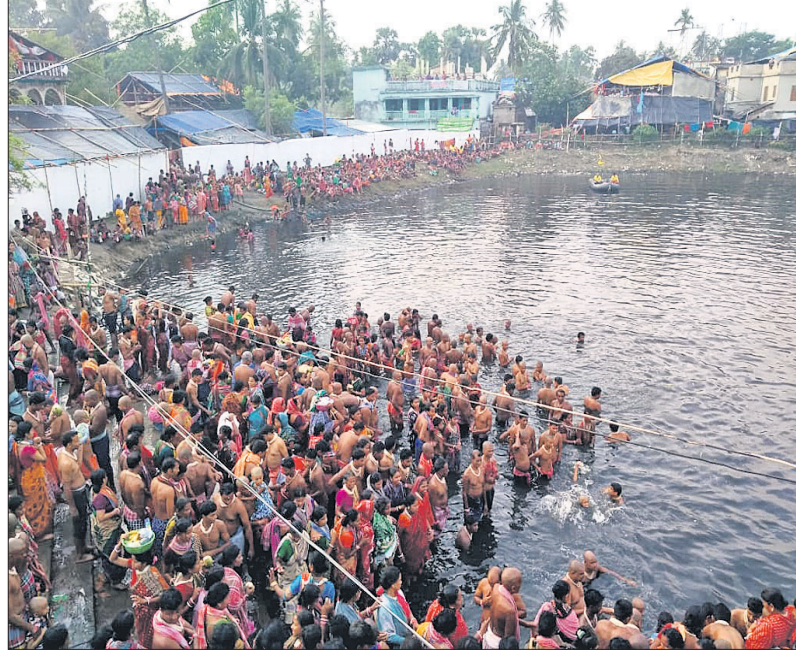
ଶ୍ରଦ୍ଧାଳୁମାନେ ବୁଡ଼ ପକାଇଛନ୍ତି।

ଦୁର୍ଗ ପୂର୍ଣ୍ଣିମା ସହ ପୂର୍ବ ଓ ପଶ୍ଚିମ ମେଦିନୀପୁର ଜିଲାର ଅନେକ ଶିବଭକ୍ତ ବିଭିନ୍ନ ନଦୀରୁ ପାଣି ବାହୁଳ୍ୟରେ କାନ୍ଧେଇ ନେଇ ଜାଉଳା ପର୍ବର ଚର୍ଚ୍ଚାରେ ଜଣାଦେଖି କରୁଥିଲେ। ବହୁମୁଦ୍ରିତ ଶିବଭକ୍ତ ଦେବାଧିଦେବ ମହାଦେବ ଚନ୍ଦନେଶ୍ୱର ଜାଉଳା ପରିସରରେ ଅଧିକାଂଶ ପଡ଼ି ଜାଉଳା ଅପାର କରୁଣା ଲାଭ କରି ପୂଜାର୍ଚ୍ଚନା କରିଛନ୍ତି। ଅପାରମ୍ଭରେ ଜାଉଳା ନାଳ ପୋଖରୀରେ ନାଳ ଉଭୟ ଦର୍ଶନ ଲାଗି ମନ୍ଦିର ହୁଡ଼ାରେ ଯାତ୍ରୀଙ୍କ ଭିଡ଼ ଲାଗିଥିଲା। ଜାଉଳା ଶ୍ରେଷ୍ଠ ଭକ୍ତ ପାଟଭକ୍ତ, ଦେଉଳୀଆ ଓ ଶ୍ରୀବେଳାଦୈବ ନିର୍ଦ୍ଦେଶକ୍ରମେ ଉପବାସୀଙ୍କୁ ଭକ୍ତମାନେ ନାଳ ପୁଷିରିଗାରେ ଥୁଲିକାଠ ଫୁଲ ଜଳଜାତୀ କରି ଉଦ୍‌ଭୋଗ କରି ମନ୍ଦିର ପରିସରରେ ରଖିଥିଲେ। ପରେ ସନ୍ଧ୍ୟାରେ