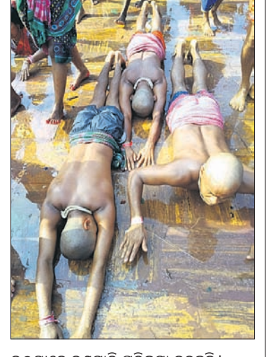
ଭକ୍ତମାନେ ଦଣ୍ଡମାରି ପରିକ୍ରମା କରୁଛନ୍ତି।

କିୟଦନ୍ତୀ ଅନୁଯାୟୀ, ସପ୍ତମ ଛନ୍ଦ ବେଳେ ବାସୁକୀ ନାଗର ବିଷକୁ ନାଳକଣ୍ଠ ପାନ କରିଥିବାରୁ ତାଙ୍କୁ ନାଳକଣ୍ଠ କୁହାଯାଏ। ଏହିଦିନ ନାଳକଣ୍ଠକୁ ଜଳାଭିଷେକ କଲେ ଭକ୍ତଙ୍କୁ ଭଗବାନ ବରଦାନ କରିଥାନ୍ତି। ଅପରପକ୍ଷରେ ଐତିହାସିକ ତଥ୍ୟ ଅନୁଯାୟୀ ବ୍ରହ୍ମଣ୍ୟ ଶ୍ରୀମନ୍ଦିରରେ ଏହି ଅଞ୍ଚଳରେ ନାଳକଣ୍ଠ କୁଷକମାନେ କରିଥିବାରୁ ବ୍ରହ୍ମଣ୍ୟମାନେ କୁଷକଙ୍କ ସ୍ତମ୍ଭରେ ପଞ୍ଚଳକୁ ଲୁଚି ନେଉଥିଲେ। ଏଥିପାଇଁ ଅଞ୍ଚଳର ଲୋକେ ଅତ୍ୟାଚାରୀ ବ୍ରହ୍ମଣ୍ୟ ହଟିଯାଇ ବୋଲି ଚନ୍ଦନେଶ୍ୱର ଜାଉଳା ଆରାଧନା କରିଥିଲେ ବୋଲି ପ୍ରବାବ ରହିଛି।