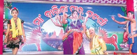
କଳାକାର ନୃତ୍ୟ ପରିବେଷଣ କରୁଛନ୍ତି ।

ଘରଗାଁ ମା' ତାରିଣୀଙ୍କ ୮୩ତମ ଚଉତିପର୍ବ ଶୁକ୍ରବାର ୪ର୍ଥ ଦିବସରେ ବହୁ ଭକ୍ତଙ୍କ ସମାଗମ ହୋଇଥିଲା । ଦିନବେଳା ସଂସ୍କୃତିକ ମଣ୍ଡପଠାରେ ଅପରାହ୍ଣରେ ଚଉତି ଘୋଡ଼ାନାଚ ଅନୁଷ୍ଠିତ ହୋଇଥିଲା ।