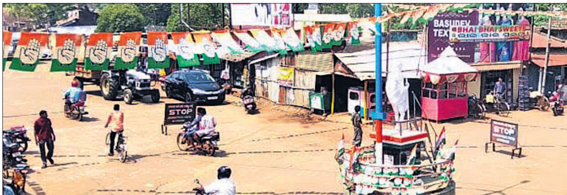
ସାର୍ବଜନୀନ ସ୍ଥାନରେ ଲାଗିଥିବା କଂଗ୍ରେସର ଦଳୀୟ ପତାକା।