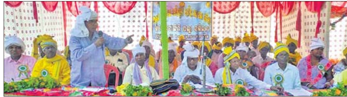
ଉତ୍ସବରେ ଯୋଗ ଦେଇଥିବା ଗୌଡ଼ ସମାଜର କର୍ମକର୍ତ୍ତା ।