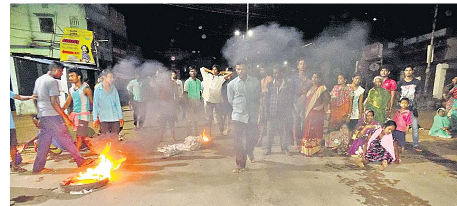
ଉତ୍ସବ ଲୋକେ ଗାୟାର ଜାଳି ରାସ୍ତାରେ ଚାଲି ଯାଉଛନ୍ତି।