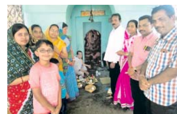
ମା' ବିନାଳକ ମନ୍ଦିରରେ ଅଶୋକାଷ୍ଟମୀ ଉପଲକ୍ଷେ ପୂଜାର୍ଚ୍ଚନା ଚାଲିଛି ।

କୋରାପୁଟ, ୧୨/୪(ସ.ପ୍ର.): କୋରାପୁଟ ଜିଲ୍ଲାର ୭୭.୫୮% ମତଦାନ ହୋଇଛି । କୋରାପୁଟ ଜିଲ୍ଲାର ୭୭.୫୮% ମତଦାନ ହୋଇଛି ।