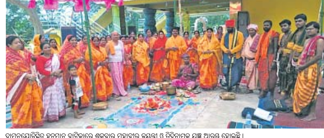
ବାମନଯୋଡ଼ି ହନୁମାନ ବାଟିକାରେ ଶୁକ୍ରବାର ମହାବୀର ଜୟଣ୍ଡା ଓ ତ୍ରିଦିନୀୟକ ଯଜ୍ଞ ଆରମ୍ଭ ହୋଇଛି ।

କୋରାପୁଟ ଜିଲ୍ଲା ସେମିଲିଗୁଡ଼ା ବ୍ଲକ୍ ଗୁଣ୍ଡାପୁଟ ପଞ୍ଚାୟତ କନ୍ଧକଡ଼ି ଗ୍ରାମରେ ଆକାଶ ଖରାକ ଘର । ତାଙ୍କ ଟ୍ୟୁମର ଟ୍ୟୁମର ହୋଇ ନାକ, ଆଖି ଓ ପାଟି ଲୁଟିଯାଇଲାଣି । ଧୀରେଧୀରେ ପାଇଁ ନେତା ଚକା ଉଡ଼ାଉଥିଲେ ମଧ୍ୟ ପ୍ରଥମେ ତାଙ୍କୁ ଲମ୍ବାପୁଟ ଆଶାକିରଣ ହସ୍ପିଟାଲ ନିଆଯାଇଥିଲା ।