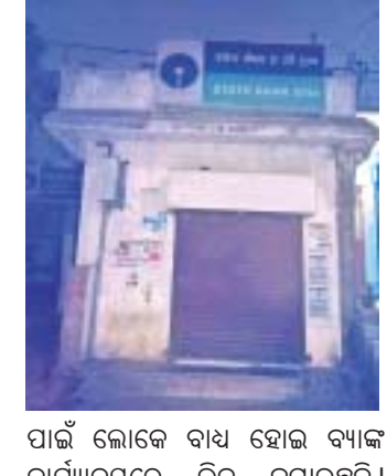
ପାଇଁ ଲୋକେ ବାଧ୍ୟ ହୋଇ ବ୍ୟାଙ୍କ କାର୍ଯ୍ୟକ୍ରମରେ ଭିଡ଼ ଜମାଉଛନ୍ତି ।

ବୈପାରୀଗୁଡ଼ା, ୧୨/୪(ଡି.ଏନ୍.ଏ.): ବୈପାରୀଗୁଡ଼ା ବ୍ଲକ୍ ସରକାରରେ ଏଡିଏମ୍ ଅଟଳ ଓ ଆଇଓବି ଶାଖାର ଏଡିଏମ୍ ରହିଛି । ଏହା ଉପରେ ବ୍ଲକ୍ ସମସ୍ତ ବ୍ୟାଙ୍କ ଉପଭୋକ୍ତା ନିର୍ଭର କରନ୍ତି ।