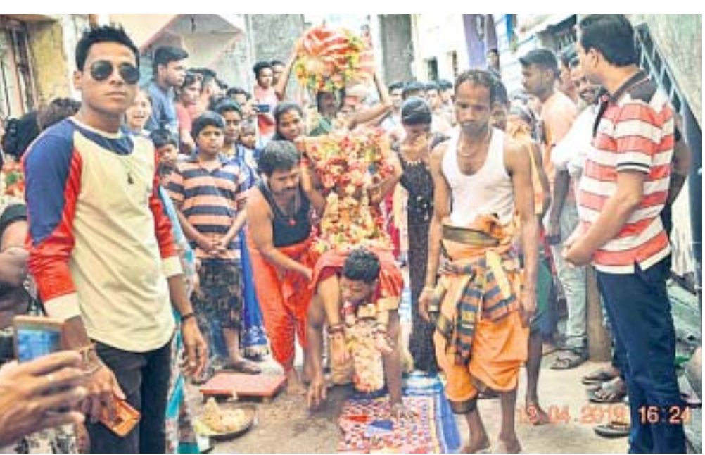
ମା' ଦକ୍ଷିଣକାଳୀଙ୍କ ଘଟଯାତ୍ରା ଆରମ୍ଭ

କୋରାପୁଟ ଜିଲ୍ଲାର ଜୟପୁର ବିଧାନସଭା ନିର୍ବାଚନ ମଣ୍ଡଳୀରେ ୮୧.୦୪ ଏବଂ କୋଟପାଡ଼ ନିର୍ବାଚନ ମଣ୍ଡଳୀରେ ୮୨.୭୪ ପ୍ରତିଶତ ମତଦାନ ହୋଇଛି । ଗୁରୁବାର ମତଦାନ ପରେ ଉଭୟ ନିର୍ବାଚନ ମଣ୍ଡଳୀର ଦୁର୍ଗମ ଅଞ୍ଚଳକୁ ଲକ୍ଷ୍ୟମ୍ ଓ ଲିଜିପିଏଟି ନେଇ ପୋଲିଂ ପାର୍ଟି ବିଜୟ ରାଜି ପୁଣ୍ୟା ଫେରି ନଥିଲେ ।