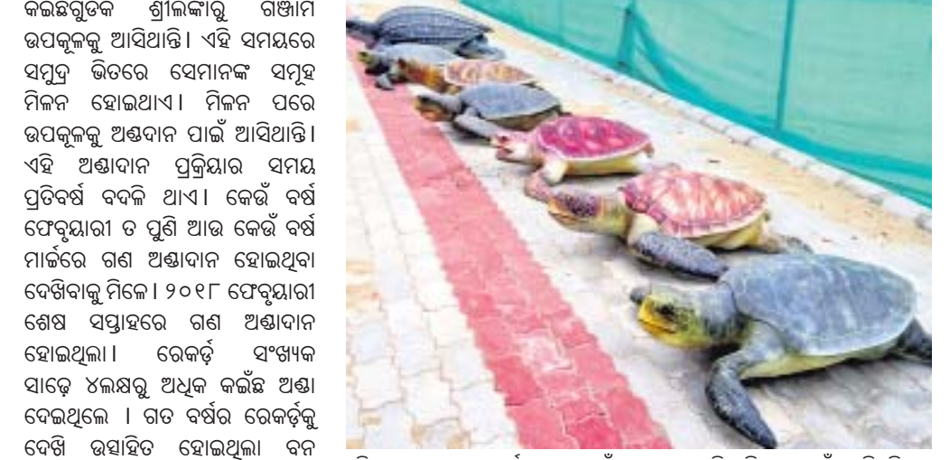
ଗଞ୍ଜାମରୁ ସୁହାଇଲାନ୍ତି ପାଗ, ଆସିଲେନି ଅଲିଭ୍ରିଡ୍ରେଲେ ।

ଚଳିତବର୍ଷ ଗଞ୍ଜାମ ଉପକୂଳକୁ ଅଣ୍ଡାଦେବାକୁ ଆସିଲେନି ଅଲିଭ୍ରିଡ୍ରେଲେ କଇଁଛ । ଫେବୃୟାରୀ ଶେଷ କିମ୍ବା ମାର୍ଚ୍ଚ ପ୍ରଥମ ସପ୍ତାହରେ ଏମାନଙ୍କ ଆଗମନ ହେବ ବୋଲି ଆଶା କରାଯାଇଥିଲା । ଏବେ ଏପ୍ରିଲ ଦ୍ୱିତୀୟ ସପ୍ତାହ ଚାଲିଛି । କିନ୍ତୁ ଏବେ ଯାଏ ଗଞ୍ଜାମର ପାଇଁ ଆସିବାକୁ ଅଲିଭ୍ରିଡ୍ରେଲେ କଇଁଛ ଆସିବାକୁ ନାହିଁ । ଗଞ୍ଜାମ ଉପକୂଳକୁ ପୂର୍ଣ୍ଣ ଫେରାଉ ନେଇ ବିଦେଶୀ ଅତିଥି, ଏହାକୁ ନେଇ ନାନା କଳ୍ପନାକଳ୍ପନା ଚାଲିଛି । କିନ୍ତୁ ପ୍ରତିକୂଳ ପାଗକୁ ଏଥି ପାଇଁ ଦୋଷ ଦିଆଯାଇଛି । ନଭେମ୍ବର ଏବଂ ଡିସେମ୍ବରରେ ଅଲିଭ୍ରିଡ୍ରେଲେ