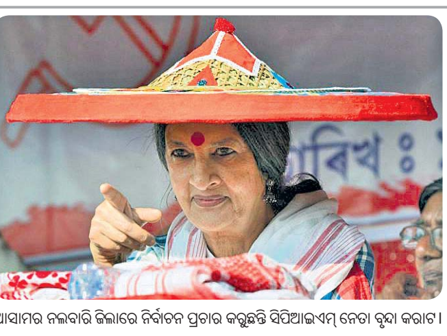
ଆସାମର ନିର୍ବାଚନରେ ନିର୍ବାଚନ ପ୍ରଚାର କରୁଥିବା ସିପିଆଇଏମ୍ ନେତା ବୃନ୍ଦା କରାଟ