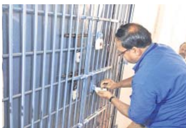
ସୁରକ୍ଷାକ୍ରମକୁ ସିଲ୍ କରାଯାଇଛି ।

ରାଜଗଡ଼ା ଜିଲ୍ଲାରେ ପ୍ରଥମ ପର୍ଯ୍ୟାୟ ନିର୍ବାଚନ ଗତ ଗୁରୁବାର ଅନୁଷ୍ଠିତ ହୋଇଯାଇଛି । ରାଜଗଡ଼ା ନିର୍ବାଚନମଣ୍ଡଳରେ ବ୍ୟବହାର ହୋଇଥିବା ଇଡିଏମ୍ ଓ ଭିଭିପିଏଟିକୁ କଢ଼ା ସୁରକ୍ଷାକ୍ରମରେ ସ୍ଥାନୀୟ ଜିଏସି ଉଚ୍ଚ ବିଦ୍ୟାଳୟରେ ଥିବା ସୁରକ୍ଷାକ୍ରମରେ ସିଲ୍ କରି ରଖାଯାଇଛି । ରାଜଗଡ଼ା ନିର୍ବାଚନ ମଣ୍ଡଳରେ ରାଜଗଡ଼ା ଓ କାଶୀପୁର ବ୍ଲକ୍ରେ ୨୯୮ଟି ବୁଥରେ ମୋଟ ୫୯୬ଟି ଇଡିଏମ୍ ଓ ଭିଭିପିଏଟି ବ୍ୟବହାର ହୋଇଥିଲା । ମତଦାନ