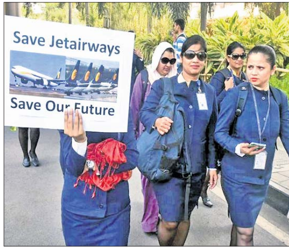
ଜେଟ୍ ଏୟାରୱେଜ୍ କର୍ମଚାରୀମାନେ ପୁଲ୍‌କାର୍ଟ ଧରି ମାର୍ଚ୍ଚ କରୁଛନ୍ତି।