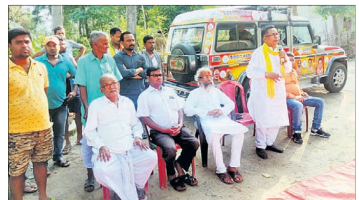
ସକଳଗଡ଼ ଗ୍ରାମପଞ୍ଚାୟତ କୁସୁମିଆ ଗ୍ରାମରେ ଭାଜପା ପ୍ରାର୍ଥୀଙ୍କ ପ୍ରଚାର ।