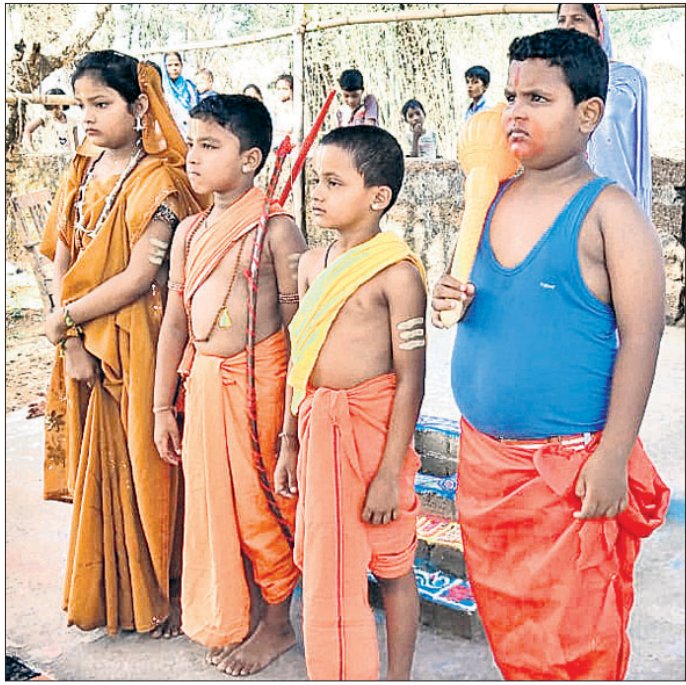
ବିଭିନ୍ନ ବେଶରେ ଛାତ୍ରଛାତ୍ରୀ।