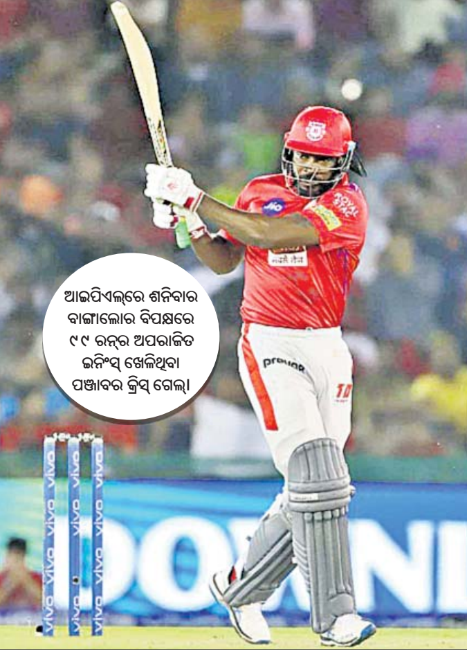
ଆଇପିଏଲରେ ଶନିବାର ବାଙ୍ଗାଲୋର ବିପକ୍ଷରେ ୯୯ ରନ୍ରେ ଅପରାଜିତ ଇନିଂସ୍ ଖେଳିଥିବା ପଞ୍ଜାବର କ୍ରିସ୍ ଗେଲ୍।

କୋଲକାତା, ୧୩୧୪ (ପି.ଟି.): ଅଧିନିଧିତା ସହ ଯୁଦ୍ଧ ପରେ କ୍ୟାପଟେନ କୁଲ ମହେନ୍ଦ୍ର ସିଂ ଧୋନୀଙ୍କୁ ଚାରିଆଡ଼ୁ ସମାଲୋଚନା କରାଯାଉଛି। ହେଲେ ଚେଲାଇ ସୁପର କିଙ୍ଗ୍ସ (ସିଏସକେ) ସାଥୀ ଖେଳାଳି ଇମ୍ରାନ ଚାହିରଙ୍କ ପାଇଁ ଧୋନୀ ଚଳେ ପ୍ରେମଶାଳ ସ୍ତ୍ରୀ। ସେ ଜଣେ ଭଲ ଅଧିନିଧିତା ସାଙ୍ଗକୁ ଜଣେ ଭଲ ମଣିଷ ମଧ୍ୟ। ସଭିଙ୍କ ସାହାଯ୍ୟ ପାଇଁ ପୂର୍ବତନ ଭାରତୀୟ ଅଧିନିଧିତା ସର୍ବଦା ପ୍ରସ୍ତୁତ ରୁହନ୍ତି। ଏହା ମୋତେ ଧୋନୀଙ୍କ ଶ୍ରେୟାଳ କ୍ରିକେଟ୍ ଏକାଡେମୀରେ ଯୋଗଦେବାକୁ ପ୍ରେରିତ କରିଛି। ମୁଁ ଏପର୍ଯ୍ୟନ୍ତ ଧୋନୀଙ୍କ ଏକାଡେମୀ ସହ ବିଦେଶ ଭାବେ କୃତ୍ରିତ ହୋଇଥିବା ଯୋଷଣା କରିନାହିଁ। ମୁଁ ବିଶ୍ୱକପ୍ ପରେ ସମ୍ପୂର୍ଣ୍ଣ ଟ୍ରି ରହିବି। ଏହି ଏକାଡେମୀରେ ଭବିଷ୍ୟତର କ୍ରିକେଟରଙ୍କ ସହାୟତା ପାଇଁ ମୋତେ ଭାଗ୍ୟ କିମ୍ବା ଅନ୍ୟ ଦେଶକୁ ଯିବାକୁ ପଡ଼ିଲେ, ମୁଁ ଯିବା ପାଇଁ ଇଚ୍ଛୁକ ବୋଲି ଚାହିଁ କହିଛନ୍ତି। ଉଲ୍ଲେଖ୍ୟ ଯେ, ଏମ୍‌ସିଏସି ଏକାଡେମୀର ୧୬ଟି ବ୍ରାଉଁସ୍ ରହିଛି। ସିଙ୍ଗାପୁର ଓ ବୁରାରିରେ ବୁରାଟି ମୁଖ୍ୟ ସେଣ୍ଟର ରହିଛି।