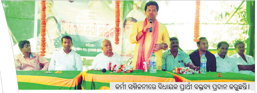
କର୍ମୀ ସମିଳନୀରେ ବିଧାୟକ ପ୍ରାର୍ଥୀ ବକ୍ତବ୍ୟ ପ୍ରଦାନ କରୁଛନ୍ତି ।