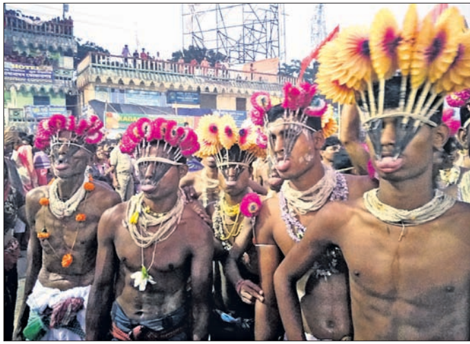
ଭଲକ୍ଷମାନେ ଭକ୍ତେ କଣ୍ଠାପୋଡ଼ି ମାନସିକ ପୂରଣ କରୁଛନ୍ତି।

ପୋଖରୀ ଛତ୍ରାରେ ଭଲକ୍ଷମାନେ ସମ୍ପଦେତ ହୋଇଥିଲେ। ଚନ୍ଦନେଶ୍ୱରଜୀଉଙ୍କ ଶ୍ରେଷ୍ଠ ଭକ୍ତ ପାଟ ଭକ୍ତ, ଦେଉଳିଆ, ଶ୍ରୀ ବେକଡ଼ି, ସେବାୟତମାନେ ସେଠାରେ ପୂଜାର୍ଚ୍ଚନା କରି ଭଲକ୍ଷମାନଙ୍କୁ ଜାତକ ଆଶୀର୍ବାଦ ମିଳୁ ବୋଲି କାମନା କରିଥିଲେ।