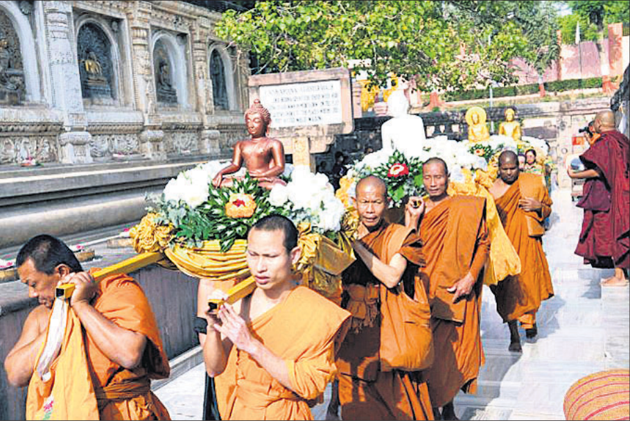
ସଙ୍ଗେନାଥ ଉତ୍ସବ ଅବସରରେ ବିହାରର ବୋଧଗୟାସ୍ଥିତ ମହାବୋଧି ମନ୍ଦିରରେ ବୌଦ୍ଧଭିକ୍ଷୁମାନେ ଗୌତମ ବୁଦ୍ଧଙ୍କ ପ୍ରତିମୂର୍ତ୍ତିକୁ ନେଉଛନ୍ତି ।