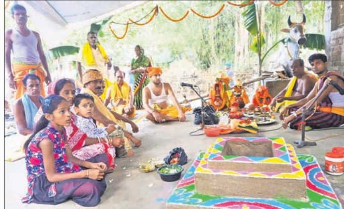
ଶିବ-ପାର୍ବତୀଙ୍କ ବିବାହ ଅନୁଷ୍ଠିତ ହେଉଛି।

ବାଲେଶ୍ୱର ଜିଲ୍ଲା ରୁସ୍ୱା ଥାନା ଗଡ଼ପଦା ପଞ୍ଚାୟତ ଅନ୍ତର୍ଗତ ରୁଧିଖଣ୍ଡି ଗ୍ରାମରେ ରହିଛି ରାମେଶ୍ୱର ଶିବ ମନ୍ଦିର। ଏହି ଶୈବପୀଠରେ ଶହେବର୍ଷରୁ ଉର୍ଦ୍ଧ୍ୱ ହେବ ପାଳିତ ହୋଇଆସୁଛି ଚତୁକ ମେଳା।