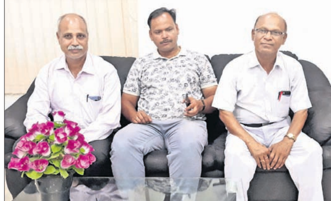
ଖବରବାତୀ ସମ୍ମିଳନୀରେ ରେଳ ଷ୍ଟେଶନ ପ୍ରବନ୍ଧକ ଓ ମୁଖ୍ୟ ପରିଚାଳନା ନିରୀକ୍ଷକ।

ବାଲେଶ୍ୱର ରେଳଷ୍ଟେଶନକୁ ୩ବର୍ଷ ହେଲା ମିଳିଛି ‘ଏ’ ଗ୍ରେଡ୍ ମାନ୍ୟତା। ଯାତ୍ରୀମାନଙ୍କ ସୁରକ୍ଷା ଓ ଏହାର ଉନ୍ନତୀକରଣ ଲାଗି ମନୁଶାଳୟ ତରଫରୁ ବିଭିନ୍ନ ପ୍ରକାର କାର୍ଯ୍ୟକ୍ରମ ଗ୍ରହଣ କରାଯାଉଥିଲେ ମଧ୍ୟ ଉଠାବୋକାଳୀମାନେ ଏଥିରେ ବାଧକ ସାଜିଛନ୍ତି।