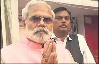
ମୋଦିଙ୍କ ଭଳି ଦେଖାଯାଉଥିବା ପ୍ରାର୍ଥୀ ଲଢ଼ୁଛନ୍ତି ନିର୍ବାଚନ