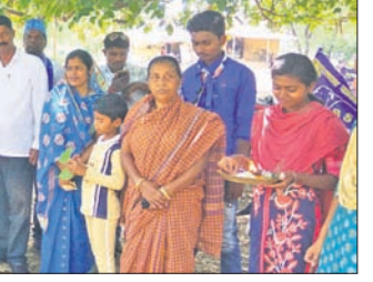
ଏମ୍ପି ଓ ବିଧାୟକ ପ୍ରାର୍ଥୀଙ୍କୁ ଦଳୀୟ କାର୍ଯ୍ୟକ୍ରମକୁ ପାଠ୍ୟ ଦିଆଯାଇଛି।

କରାଯିବା ସହ ସୌଧର୍ଯ୍ୟକରଣ ଲାଗି ୩ଟି ଡ୍ରିଭାଷିକ ଉତ୍ତମ ଷ୍ଟେଶନ ଫଳକ ଲଗାଯାଇଛି। ଅବସ୍ଥାପନ କାର୍ଯ୍ୟରେ ସୁନ୍ଦର ପୁଲବନ୍ଧନା କରିବା ପାଇଁ କାର୍ଯ୍ୟ ଚାଲୁ ରହିଛି।