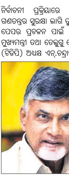
ନିର୍ବାଚନ କମିଶନ (ଇସି)କୁ କହିଛନ୍ତି

ପ୍ରଥମ ପର୍ଯ୍ୟାୟ ନିର୍ବାଚନରେ ବିଭିନ୍ନ ସ୍ଥାନରେ ଲଭିଏମ୍ ଅଟଳ ହେବା ପ୍ରସଙ୍ଗକୁ ନେଇ ଚନ୍ଦ୍ରାବାବୁ ଶନିବାର ସମାଜ ସେବକ ପେପର ପ୍ରଚଳନ ପାଇଁ ଆକ୍ରମଣ ଦେଖି ପ୍ରଧାନମନ୍ତ୍ରୀ ତଥା ଚେନ୍ନାଇ ଦେଶମ୍ ପାର୍ଟି (ଡିଡିପି) ଅଧକ୍ଷ ଏନ୍.ଚନ୍ଦ୍ରାବାବୁ ନାଭୁକ୍ତ ନିର୍ବାଚନ କମିଶନ (ଇସି)କୁ କହିଛନ୍ତି। ପ୍ରଥମ ପର୍ଯ୍ୟାୟ ନିର୍ବାଚନରେ ବିଭିନ୍ନ ସ୍ଥାନରେ ଲଭିଏମ୍ ଅଟଳ ହେବା ପ୍ରସଙ୍ଗକୁ ନେଇ ଚନ୍ଦ୍ରାବାବୁ ଶନିବାର ସମାଜ ସେବକ ପେପର ପ୍ରଚଳନ ପାଇଁ ଆକ୍ରମଣ ଦେଖି ପ୍ରଧାନମନ୍ତ୍ରୀ ତଥା ଚେନ୍ନାଇ ଦେଶମ୍ ପାର୍ଟି (ଡିଡିପି) ଅଧକ୍ଷ ଏନ୍.ଚନ୍ଦ୍ରାବାବୁ ନାଭୁକ୍ତ ନିର୍ବାଚନ କମିଶନ (ଇସି)କୁ କହିଛନ୍ତି। ପ୍ରଥମ ପର୍ଯ୍ୟାୟ ନିର୍ବାଚନରେ ବିଭିନ୍ନ ସ୍ଥାନରେ ଲଭିଏମ୍ ଅଟଳ ହେବା ପ୍ରସଙ୍ଗକୁ ନେଇ ଚନ୍ଦ୍ରାବାବୁ ଶନିବାର ସମାଜ ସେବକ ପେପର ପ୍ରଚଳନ ପାଇଁ ଆକ୍ରମଣ ଦେଖି ପ୍ରଧାନମନ୍ତ୍ରୀ ତଥା ଚେନ୍ନାଇ ଦେଶମ୍ ପାର୍ଟି (ଡିଡିପି) ଅଧକ୍ଷ ଏନ୍.ଚନ୍ଦ୍ରାବାବୁ ନାଭୁକ୍ତ ନିର୍ବାଚନ କମିଶନ (ଇସି)କୁ କହିଛନ୍ତି। ପ୍ରଥମ ପର୍ଯ୍ୟାୟ ନିର୍ବାଚନରେ ବିଭିନ୍ନ ସ୍ଥାନରେ ଲଭିଏମ୍ ଅଟଳ ହେବା ପ୍ରସଙ୍ଗକୁ ନେଇ ଚନ୍ଦ୍ରାବାବୁ ଶନିବାର ସମାଜ ସେବକ ପେପର ପ୍ରଚଳନ ପାଇଁ ଆକ୍ରମଣ ଦେଖି ପ୍ରଧାନମନ୍ତ୍ରୀ ତଥା ଚେନ୍ନାଇ ଦେଶମ୍ ପାର୍ଟି (ଡିଡିପି) ଅଧକ୍ଷ ଏନ୍.ଚନ୍ଦ୍ରାବାବୁ ନାଭୁକ୍ତ ନିର୍ବାଚନ କମିଶନ (ଇସି)କୁ କହିଛନ୍ତି।