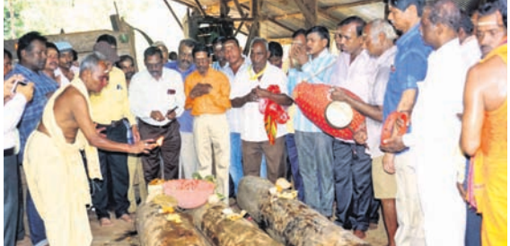
ରଥକାଠ ତିରଟ ଅନୁକୂଳ ପାଇଁ ପୂଜାର୍ଚ୍ଚନା ଚାଲିଛି।

ଆସନ୍ତା କୁଳାଇ ୪ଟାରିଖରେ ମହାପ୍ରଭୁଙ୍କ ରଥଯାତ୍ରା। ଅକ୍ଷୟ ତୃତୀୟା ତିନିରଥ ନିର୍ମାଣ ଆରମ୍ଭ ହେବାକୁ ଥିବାବେଳେ ଶନିବାର ରଥକାଠ ତିରଟ ଅନୁକୂଳ ହୋଇଛି।