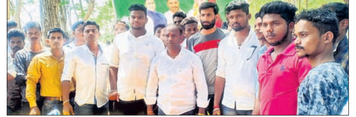
ବିଜୁ ଛାତ୍ର ଜନତା ଦଳର ନିର୍ବାଚନ ସଭା। ପାଟଣା, ୧୩୪ (ସ.ପ୍ର.)