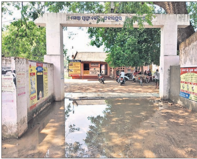
ଗୋଷ୍ଠୀ ସ୍ୱାସ୍ଥ୍ୟ କେନ୍ଦ୍ର ସମ୍ମୁଖରେ ଜମିରହିଛି ବର୍ଷା ପାଣି।

ଆନନ୍ଦପୁର ପୌର ପରିଷଦ ଫକୀରପୁର ଗୋଷ୍ଠୀ ସ୍ୱାସ୍ଥ୍ୟ କେନ୍ଦ୍ର ପିଛା ଛାଡ଼ି ଦିଆଯାଇଛି। କେତେକେକେ ଗୋଷ୍ଠୀ ସେବାକୁ ନେଇ ସମସ୍ୟା ସୃଷ୍ଟି ହୋଇଥିବା ଅବହେଳା ଶିକାର ହୋଇଆସୁଥିବା ଫକୀରପୁର ଗୋଷ୍ଠୀ ସ୍ୱାସ୍ଥ୍ୟ କେନ୍ଦ୍ର ପ୍ରତି ଉଚିତ ଦୃଷ୍ଟି ଦିଆଯାଇ ନ ଥିବା ଯୁବକ ସଂଘ ଦାବି କରିଛନ୍ତି। ଗତ ଶୁକ୍ରବାର ସନ୍ଧ୍ୟା ସମୟରେ ଆନନ୍ଦପୁର ଅଞ୍ଚଳରେ କାଳବୈଶାଖୀ ଯୋଗୁଁ ଘଟପଟି ସହିତ ବର୍ଷା ହୋଇଥିଲା। ଏହି ବର୍ଷାର ମାତ୍ରା ସେତେଗା ଅଧିକ ହୋଇ ନ ଥିଲେ ସୁଦ୍ଧା ବର୍ଷା ଜଳରେ ସ୍ୱାସ୍ଥ୍ୟ କେନ୍ଦ୍ର ଗେଟ୍ ସମ୍ମୁଖରେ ପାଣି ଜମି ରହିଥିଲା। ଡ୍ରେନେଜ ବ୍ୟବସ୍ଥା ଏକପ୍ରକାର ଭୁଲ୍ସ୍ଥିତି ପଡ଼ିଛି। ରାତିରୁ ସକାଳ ପର୍ଯ୍ୟନ୍ତ ଏହି