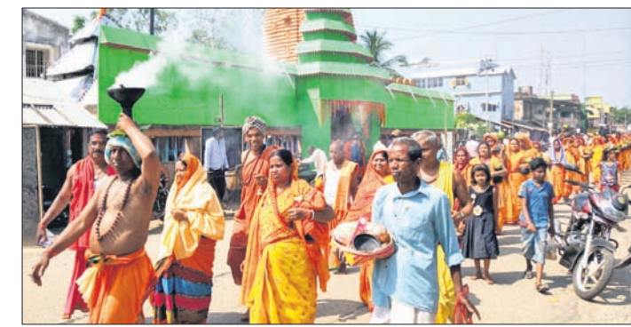
ହନୁମାନ ମନ୍ଦିରର ସପ୍ତମ ପ୍ରତିଷ୍ଠା ଉତ୍ସବ ଅବସରରେ ମହିଳାଙ୍କ କଳସ ଶୋଭାଯାତ୍ରା।

ବାହାରି ଔପଦା ବଜାର ପରିକ୍ରମା କରି ଯଜ୍ଞମଣ୍ଡପଠାରେ ପହଞ୍ଚିଥିଲା। ଶ୍ରୀରାମ, ମାତା ଜାନକୀ, ଲକ୍ଷ୍ମଣ ଓ ହନୁମାନ ବେଶରେ ଶିଶୁମାନେ ସଜ୍ଜିତ ହୋଇ ଶୋଭାଯାତ୍ରା କରିଥିଲେ। ଜୟ ଶ୍ରୀରାମ, ଜୟ ବଜରଙ୍ଗବାଳି ଧ୍ୱନିରେ ପରିବେଶ ପ୍ରକଳ୍ପିତ ହୋଇଉଠିଥିଲା।