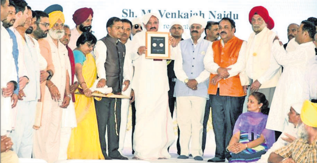
ଜାଲିଆନୱାଲାବାଗ୍ ଶହାଦତ୍ତ ପ୍ରତି ଶ୍ରଦ୍ଧାଞ୍ଜଳି ଅର୍ପଣ କରୁଛନ୍ତି ଉପରାଷ୍ଟ୍ରପତି ଏମ୍ ଭେଙ୍କାୟା ନାଭୁକ୍ତ ସହ ଅନ୍ୟ ନେତୃତ୍ୱ।