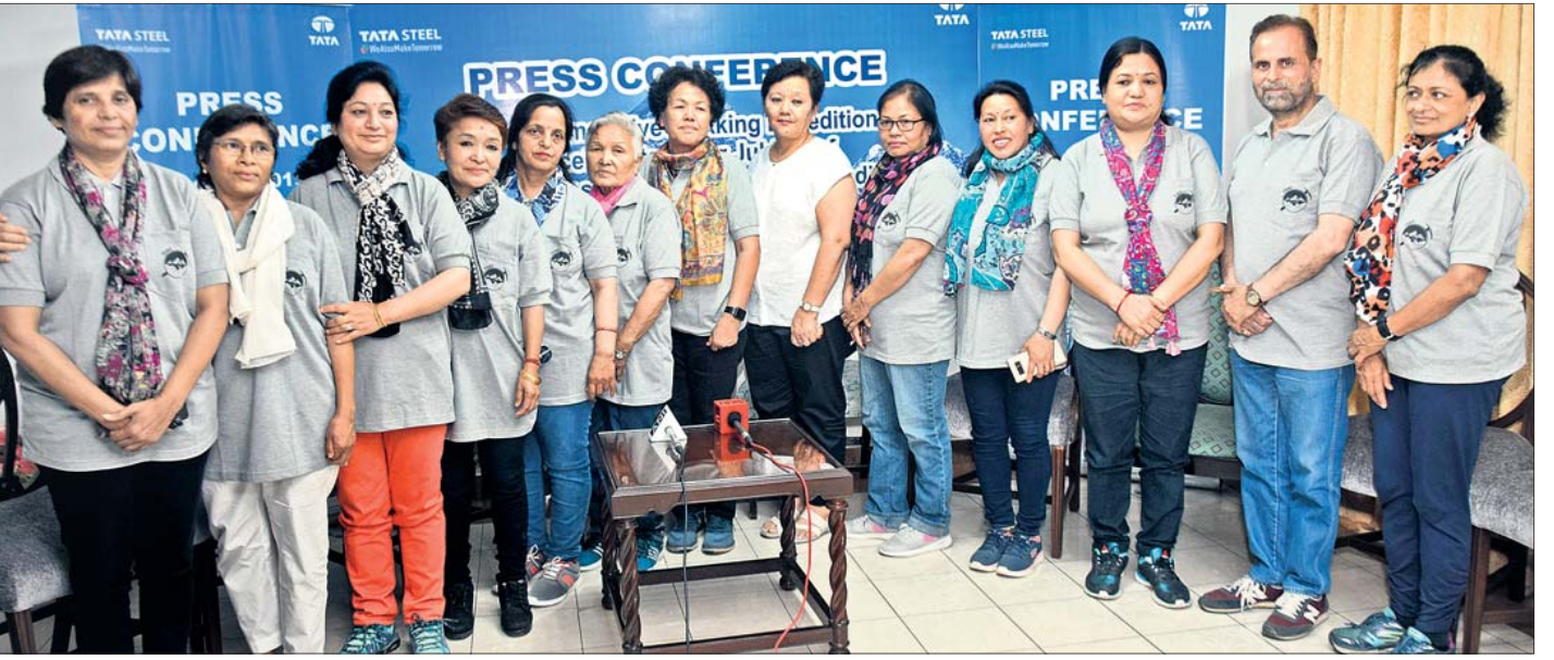
ସାଥୀ ପର୍ବତାରୋହୀଙ୍କ ସହ ବଛେନ୍ଦ୍ରୀ ପାଇଁ (ବାମରୁ ସପ୍ତମ)।