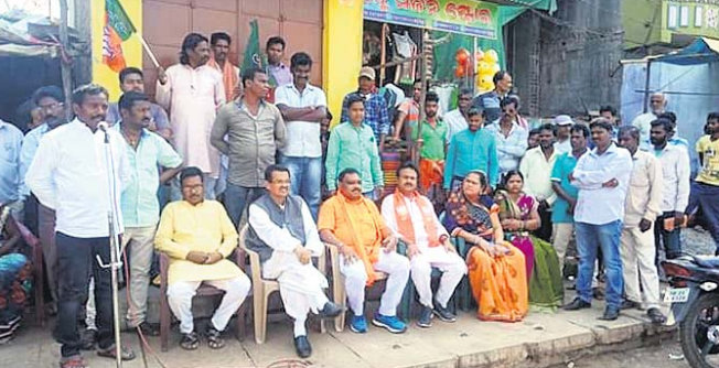
ବାଲିଗୁଡ଼ା, ୧୩୪ (ଡି.ଏନ.ଏ.)