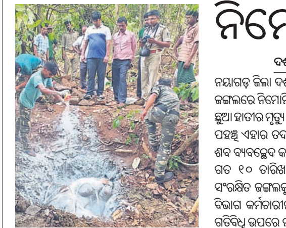
ହାତୀଛୁଆକୁ ପୋତି ଦିଆଯାଉଛି।

ଆସନ୍ତା କୁଳାଇ ୪ଟାରିଖରେ ମହାପ୍ରଭୁଙ୍କ ରଥଯାତ୍ରା। ଅକ୍ଷୟ ତୃତୀୟାକୁ ତିନିରଥ ନିର୍ମାଣ ଆରମ୍ଭ ହେବାକୁ ଥିବାବେଳେ ଶନିବାର ରଥକାଠ ତିରଟ ଅନୁକୂଳ ହୋଇଛି।