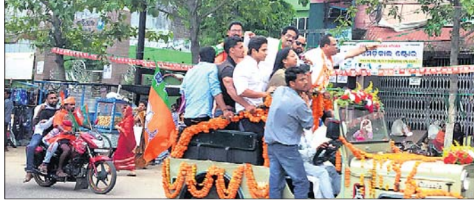
ଭାଜପା ପ୍ରାର୍ଥୀଙ୍କ ସହ ପ୍ରଚାର କରୁଥିବା ବାବୁସାନ୍ ।