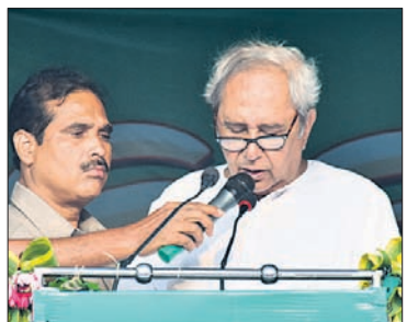
ମୁଖ୍ୟମନ୍ତ୍ରୀ ନବୀନ ପଟ୍ଟନାୟକ ଅଭିଭାଷଣ ରଖୁଛନ୍ତି।