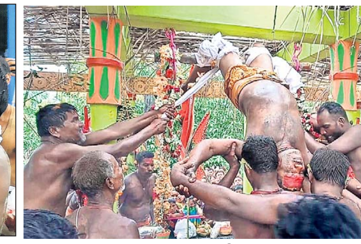
ମେରୁରୁରେ ପାଟଭୁକ୍ତାଙ୍କୁ ଅର୍ପାଯାଇଛି ।

ଧୂବ ବୋଲି ଲୋକଙ୍କ ବିଶ୍ୱାସ ରହିଥିବାରୁ ବହୁ ମାନସିକଧାରୀ ଉପବାସ ବ୍ରତ କରି ଆୟ ପାଇବା ପାଇଁ ଆଶା ରଖିଥାନ୍ତି । ମେରୁରୁରେ ପଞ୍ଚୁଆଙ୍କୁ ଧାରଭୁକ୍ତା ଓହ୍ଲାଇବା ପରେ ମେରୁ ପୂଜା ଶେଷ ହୋଇଥିଲା । ଆସିବା : ଆସିବା ସହର ତଥା ଚତାଯାଇଥିଲା । ପାଟ ଭୁକ୍ତାଙ୍କୁ ଦେଖିବା ଉପଯୋଗରେ ବଡ଼ପୁଞ୍ଜା, ବଡ଼ପାଣ୍ଡ ମଧ୍ୟ ସ୍ଥଳରେ ସାମୁଦ୍ରିକ ଏବଂ ଆତପମଣ୍ଡପରେ ମଝିଆ ପୁଞ୍ଜାର ଦଣ୍ଡ ପ୍ରଦର୍ଶନ ହୋଇଛି ।