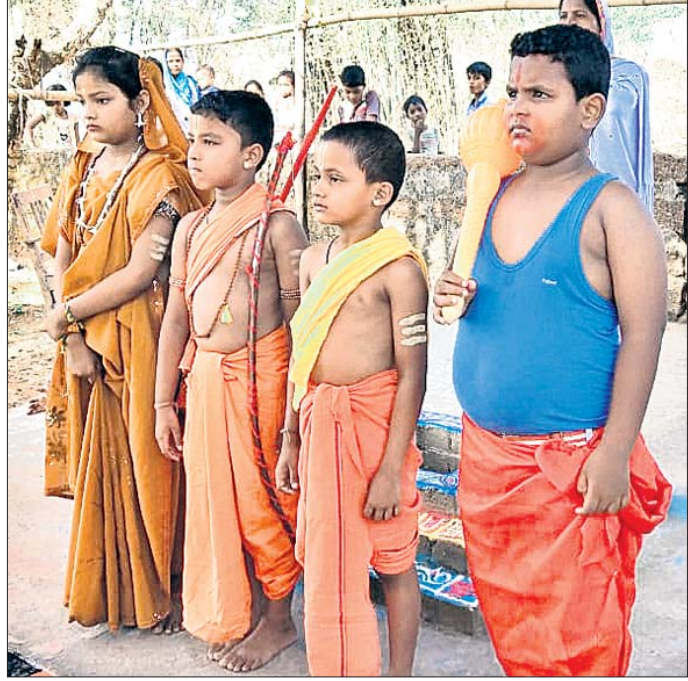
ବିଭିନ୍ନ ବେଶରେ ଛାତ୍ରୀଛାତ୍ରୀ।