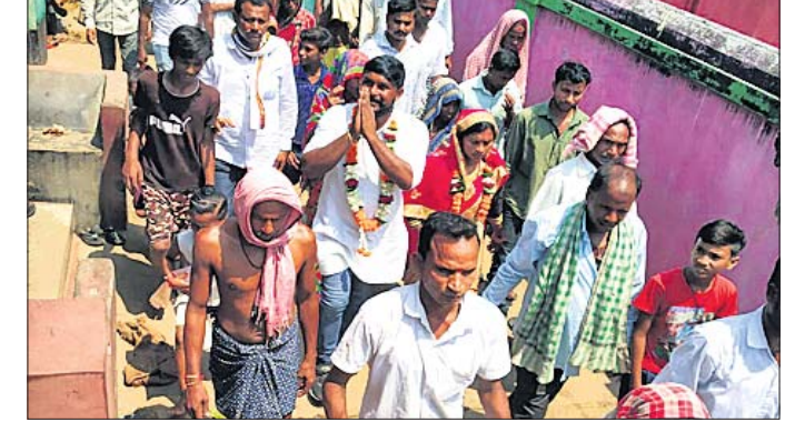
ଆୟାଗରେ କଂଗ୍ରେସ ପ୍ରାର୍ଥୀଙ୍କ ଶୋଭାଯାତ୍ରାରେ ସମସ୍ତ ସାମିଲ ।