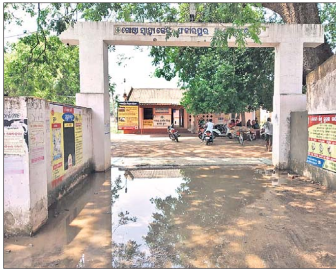
ଗୋଷ୍ଠୀ ସ୍ୱାସ୍ଥ୍ୟ କେନ୍ଦ୍ର ସମ୍ମୁଖରେ ଜମିରହିଛି ବର୍ଷା ପାଣି।