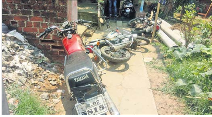
ଭାଙ୍ଗି ପଡ଼ିଥିବା ୪ ବାଇକ୍ ।