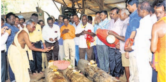
ରଥକାଠ ତିରଟ ଅନୁକୂଳ ପାଇଁ ପୂଜାର୍ଚ୍ଚନା ଚାଲିଛି।

ଆସନ୍ତା କୁଳାଇ ୪ଟାରିଖରେ ମହାପ୍ରଭୁଙ୍କ ରଥଯାତ୍ରା। ଅକ୍ଷୟ ତୃତୀୟାକୁ ତିନିରଥ ନିର୍ମାଣ ଆରମ୍ଭ ହେବାକୁ ଥିବାବେଳେ ଶନିବାର ରଥକାଠ ତିରଟ ଅନୁକୂଳ ହୋଇଛି।