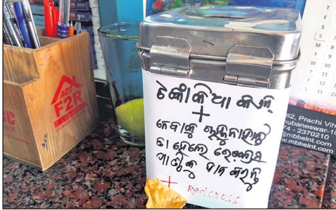
କଂସନ ଦାନ କରିବାକୁ ଦୋକାନରେ ରଖାଯାଇଥିବା ବାବୁ ।

ଦାରିଙ୍ଗପାଡ଼ି ଅଞ୍ଚଳରେ ଖୁବ୍‌ରୁ ବ୍ୟବସାୟୀମାନେ ଏବେ କଂସନକୁ ନେଇ ହଲରାଗ ହେଉଛନ୍ତି । କେଉଁଠି ବ୍ୟବସାୟୀ ମାନେ ଚକ୍କିଆ କଂସନ ସମେତ ଦଶ ଟଙ୍କା କଂସନ ପର୍ଯ୍ୟନ୍ତ ଚଳୁନାହିଁ କହୁଥିବା ବେଳେ, ଆଉ କେଉଁଠି ଗ୍ରାହକମାନେ ମଧ୍ୟ ଏହାକୁ ଗ୍ରହଣ କରୁନାହାନ୍ତି । ଫଳରେ ଖୁବ୍‌ରୁ ଦୋକାନ ରୁଡ଼ିକରେ ଦିନକୁ ଦିନ ବ୍ୟବସାୟୀ ମାୟା ହେଉଛି । କଂସନ ନେବାକୁ ମନା କରିବା ବେଆଇନ ହୋଇଥିଲେ ମଧ୍ୟ ଏନେଇ ପ୍ରଶ୍ନାସନ କିମ୍ବା ବ୍ୟାଙ୍କ ପକ୍ଷରୁ ଲୋକଙ୍କୁ ସତେଜନ କରାଯାଇନାହିଁ । ଏବେ କେତେଜଣ ବ୍ୟବସାୟୀ ଏହାକୁ ନେଇ ଚିନ୍ତା ପ୍ରକଟ କରିବା ସହ ବ୍ୟବସାୟ ବେଳେ କେହି ଯଦି କଂସନ ନେବାକୁ ମନା କରନ୍ତି ତେବେ ସେମାନେ କଂସନରୁ ରେଡ଼କ୍ରସ୍‌ସ୍ ଦାନ କରିବା ପାଇଁ ଦୋକାନରେ ଦାନବାବୁ ରଖିଛନ୍ତି । ଏଥିରେ କେତେଜଣ ଗ୍ରାହକ