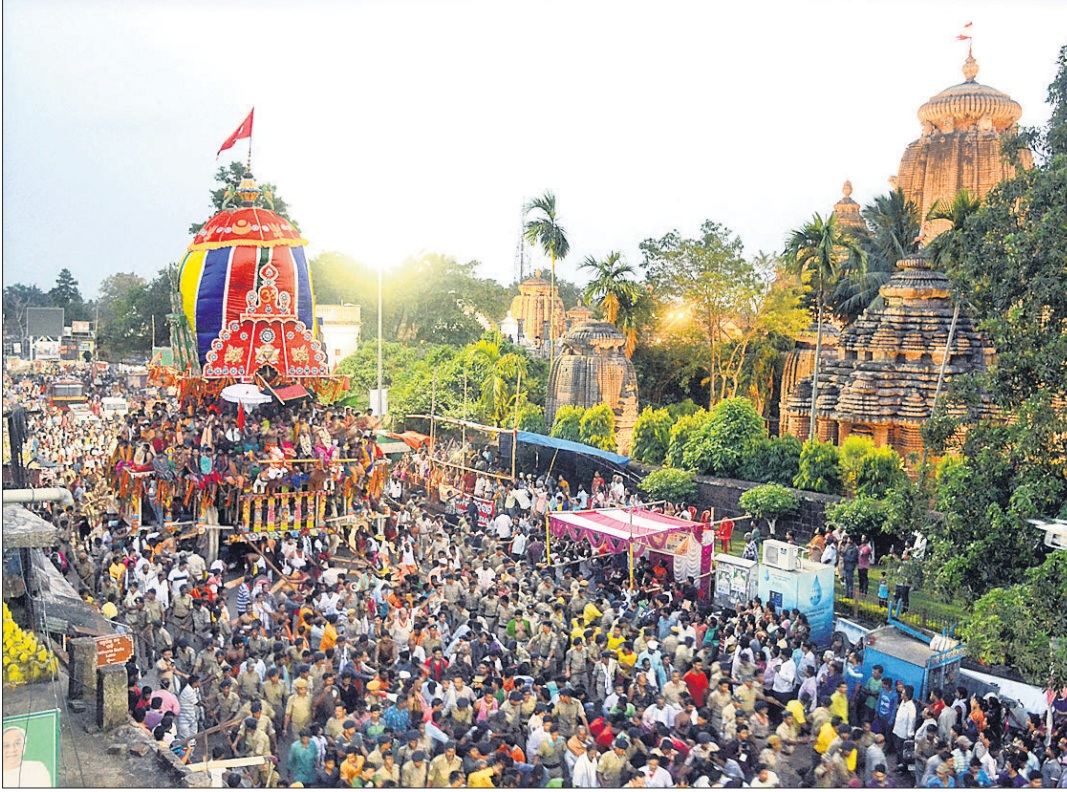
ମହାପ୍ରଭୁ ଶ୍ରୀଲିଙ୍ଗରାଜଙ୍କ ରୁକୁଣା ରଥକୁ ଶ୍ରଦ୍ଧାଳୁମାନେ ଚାଣି ନେଉଛନ୍ତି।

ପକ୍ଷରୁ ପୂର୍ବନିର୍ଦ୍ଧିଷ୍ଟ ସମୟ ଅନୁସାରେ ଅପରାହ୍ଣ ୪ଟାରେ ରଥଟଣା ହେବାକୁ ଥିଲା।