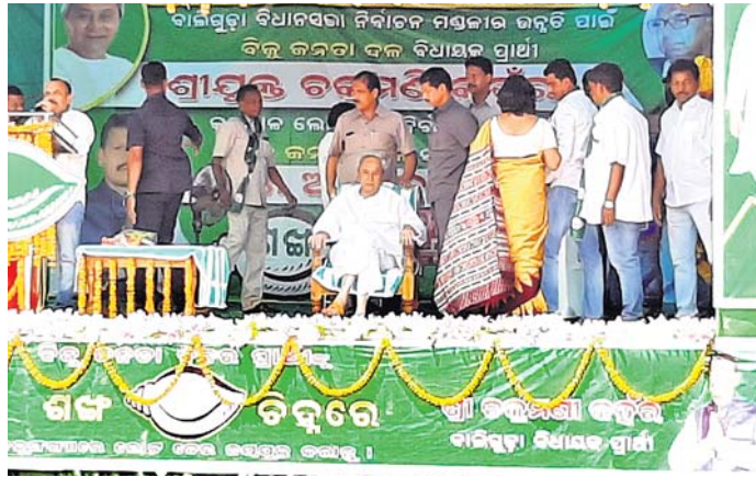
ସମାବେଶରେ ମୁଖ୍ୟମନ୍ତ୍ରୀ ନବୀନ ପଟ୍ଟନାୟକ ଓ ଅନ୍ୟମାନେ ।

କନ୍ୟାମାଳ ଜିଲ୍ଲା ମୁଖ୍ୟମନ୍ତ୍ରୀ ସ୍ୱତନ୍ତ୍ର ଦୃଷ୍ଟି ଦେଉଛନ୍ତି ବୋଲି ଯାହା କହୁଥିଲେ ତାହା ବାସ୍ତବରେ କରି ଦେଖାଇଛନ୍ତି । ଜିଲ୍ଲାର ୩ ବିଧାନସଭା କ୍ଷେତ୍ର ପାଇଁ ପ୍ରଚାର କରିଛନ୍ତି ।