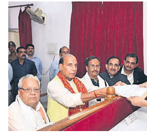
ସ୍ୱରାଷ୍ଟ୍ରମନ୍ତ୍ରୀ ରାଜନାଥ ସିଂ ନାମାଙ୍କନପତ୍ର ଦାଖଲ କରୁଛନ୍ତି।