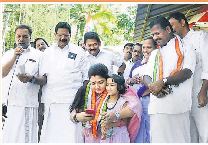
ଅଭିନେତ୍ରୀଙ୍କୁ ରାଜନେତା ପାଲଟିଥିବା ସ୍ୱପ୍ନକୁ ପୂରଣ କରିବା ପାଇଁ ଆସନରେ କଂଗ୍ରେସ ପ୍ରାର୍ଥୀ ରାଜୁଲ୍ଲୀ ଗାନ୍ଧୀଙ୍କ ସପକ୍ଷରେ ପ୍ରଚାର ବେଳେ ଜଣେ କୁନିଝିଅ ସହ କଥା ହେଉଛନ୍ତି।