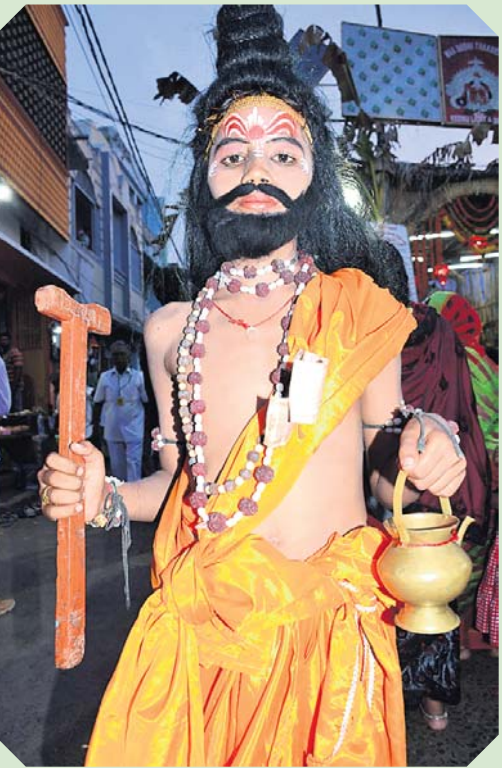
ମାନସିକ ବେଶଧାରୀଙ୍କ ପୁନିରାଶି ବେଶ ।