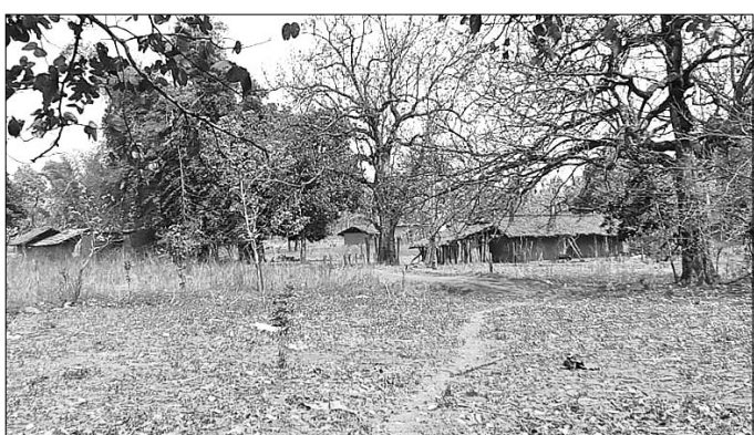
ଆଦିବାସୀ ଅଧିଷ୍ଠିତ ଗାଁ।

କେନ୍ଦୁଝର ସଦର ନିର୍ବାଚନମଣ୍ଡଳ ତଥା ଝୁମୁରା ବ୍ଲକ୍ ଅନ୍ତର୍ଗତ ବିଭୁକ୍ତିପୁର ପଞ୍ଚାୟତର ଆଦିବାସୀ ଅଧିଷ୍ଠିତ ପାହାଡ଼ ଉପରେ ଥିବା ୩ ଗାଁ କନକନା, ହରିଡ଼ାପୋଡ଼ି, ଦେଓଝରକୁ ମୌଳିକ ସୁବିଧା ଅପହଞ୍ଚି ହୋଇଛି। ଏ ନେଇ ଲୋକେ ଚଳିତ ନିର୍ବାଚନରେ ଭୋଟ ବର୍ଜନ ପାଇଁ ନିଷ୍ପତ୍ତି ନେଇଛନ୍ତି। ଭୌଗଳିକ ଦୃଷ୍ଟିକୋଣରୁ ପାହାଡ଼ ଉପରେ ଅବସ୍ଥିତ ଏହି ୩ ଗ୍ରାମର ଦୂରତା ପରସ୍ପରଠାରୁ ୨୭୦ ମି. ମଧ୍ୟରେ। ଚାରିଆଡ଼େ ଜଙ୍ଗଲ। ଏକ ପାର୍ଶ୍ୱର ପାହାଡ଼ ତଳେ ପ୍ରବାହିତ ବୈତରଣୀ। ହାତୀ ସହ ଭାଲୁ, ଅନ୍ୟ ବନ୍ୟପ୍ରାଣୀଙ୍କ ଆବାସ ସ୍ଥାନ ଭାବେ କନକନା ଜଙ୍ଗଲ ପରିଚିତ। କେନ୍ଦୁଝର ସଦର ନିର୍ବାଚନମଣ୍ଡଳର ୧୯ ନଂ ବ୍ଲକ୍ ହେଉଛି କନକନା। ପ୍ରାଥମିକ ବିଦ୍ୟାଳୟରେ ରହିଥିବା ଏହି ବ୍ଲକ୍ ଏଠାରେ ଭୋଟ ଦେଇଥାନ୍ତି କନକନା, ହରିଡ଼ାପୋଡ଼ି ଓ ଦେଓଝର ଗ୍ରାମବାସୀ।