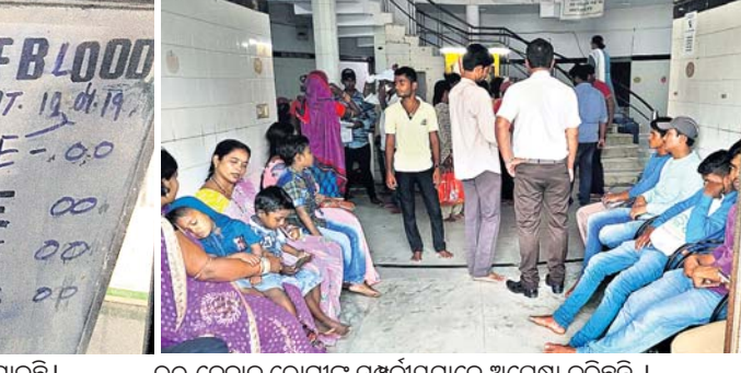
ରକ୍ତ ନେବାକୁ ରୋଗୀଙ୍କ ସମ୍ପର୍କୀୟମାନେ ଅପେକ୍ଷା କରିଛନ୍ତି ।