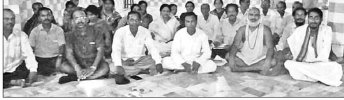
ବୈଠକରେ ଯୋଗ ମହୋତ୍ସବ ସମିତିର କର୍ମକର୍ତ୍ତା।