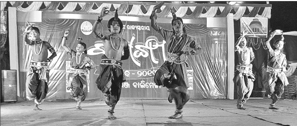
ବଳାଙ୍ଗୀ ମହୋତ୍ସବ ମଞ୍ଚରେ ଶିଳ୍ପୀମାନେ ନୃତ୍ୟ ପରିବେଷଣ କରୁଛନ୍ତି।