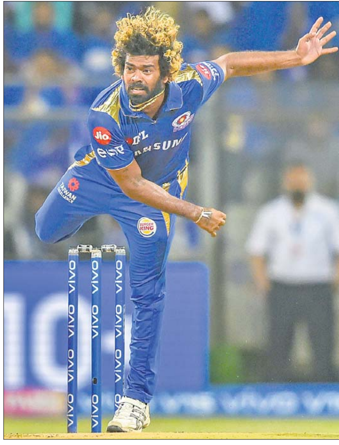
ମ୍ୟାଚ୍ ଅର୍ଥ ଦି ମ୍ୟାଚ୍ ଲସିଥ ମାଲିଙ୍ଗା।

ତେଥି ଓଭର ସେଣ୍ଟାଲିଷ୍ଟ ଲସିଥ ମାଲିଙ୍ଗା ଓ ହାର୍ଡିକ ପାଣ୍ଡ୍ୟାଙ୍କ ପ୍ରଭାବୀ ପ୍ରଦର୍ଶନ ବଳରେ ମୁମ୍ବାଇ ଇଣ୍ଡିଆନ୍ ଇଣ୍ଡିଆନ ପ୍ରିମିୟର ଲିଗର ୩୧ତମ ମ୍ୟାଚ୍ରେ ରୟାଲ ଚ୍ୟାଲେଞ୍ଜର୍ସ ବାଙ୍ଗାଲୋରକୁ ୫ ରନରେ ପରାସ୍ତ କରିଛି। ଯୋମବା ଅନୁଷ୍ଠିତ ମ୍ୟାଚ୍ରେ ଚ୍ୟୁ ହାର୍ଡିକ ପାଣ୍ଡି ଆମନ୍ତ୍ରଣ ପାଇଥିବା ବାଙ୍ଗାଲୋର ୭ ଉଇକେଟ୍ ହରାଇ ୧୭୧ ରନ କରିଥିଲା। ଜବାବରେ ମୁମ୍ବାଇ ୧୯ ଓଭରରେ ୫ ଉଇକେଟ୍ ହରାଇ ୧୭୨ ରନ କରି ବିଜୟ ହୋଇଥିଲା। ମୁମ୍ବାଇ ୮ ମ୍ୟାଚ୍ ଖେଳି ୫ ବିଜୟ ଓ ୩ ପରାଜୟ ସହ ୧୦ ପଏଣ୍ଟ ହାସଲ କରି ଚାଲିକାର ତୃତୀୟ ସ୍ଥାନକୁ ଉନ୍ନତ ହୋଇଛି। ଅନ୍ୟପକ୍ଷରେ ବାଙ୍ଗାଲୋର ୮ ମ୍ୟାଚ୍ରେ ଗୋଟିଏ ବିଜୟ, ୭ଟି ପରାଜୟ ସହ ୨ ପଏଣ୍ଟରେ ସ୍ଥାନ ରହି ଚାଲିକାର ନିମ୍ନରେ ରହିଛି। ୩୧ ରନ ବ୍ୟୟ କରି ମୁଲ୍ୟବାନ ୪ ଉଇକେଟ୍ ଅଭିଆର କରିଥିବା ମୁମ୍ବାଇ ଅଭିଜିତ ଦୁତ ବୋଲର ଲସିଥ ମାଲିଙ୍ଗା ପୁରୁଷ ଅର୍ଥ ଦି ମ୍ୟାଚ୍ ବିଦେଶିତ ହୋଇଛନ୍ତି।