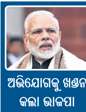
ଅଭିଯୋଗକୁ ଖଣ୍ଡନ କଲା ଭାଜପା

ସାଧାରଣ ନିର୍ବାଚନ ପାଇଁ ଉଭୟ ଶାସକ ଓ ବିରୋଧୀ ପ୍ରସଙ୍ଗ ଖୋଲୁଥିବାବେଳେ କଂଗ୍ରେସକୁ ପ୍ରଧାନମନ୍ତ୍ରୀ ନରେନ୍ଦ୍ର ମୋଦିଙ୍କ ବିରୋଧରେ ମିଳିଯାଇଛି ଏକ 'ବ୍ରହ୍ମାସ୍ତ୍ର'। ମୋଦି ଗୁଜରାଟର ଗାନ୍ଧୀନଗରର ଏକ ପୁରୁକୁ ନେଇ ନିର୍ବାଚନ କମିଶନ (ଇସି)ଙ୍କୁ ଭୁଲ୍ ତଥ୍ୟ ପ୍ରଦାନ କରିଛନ୍ତି ବୋଲି ମଙ୍ଗଳବାର କଂଗ୍ରେସ ପକ୍ଷରୁ ଅଭିଯୋଗ ଅଣାଯାଇ ତାଙ୍କ ବିରୋଧରେ କାର୍ଯ୍ୟାନୁଷ୍ଠାନ ଦାବି କରାଯାଇଛି।