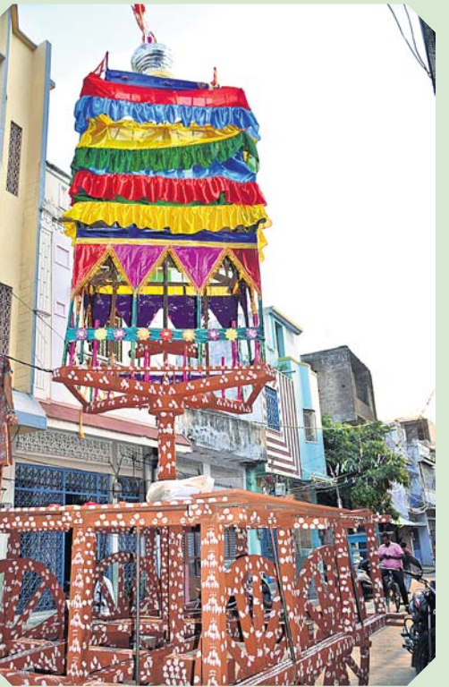
ଭଦ୍ରେଚିତ ହୋଇଥିବା ବିଜ୍ଞାଣା ରଥ ।