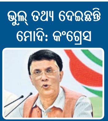
ଭୁଲ୍ ତଥ୍ୟ ଦେଇଛନ୍ତି ମୋଦି: କଂଗ୍ରେସ

ପ୍ରଧାନମନ୍ତ୍ରୀ ନିଜ ନାମରେ ଥିବା ପୁରୁକୁ ବିବରଣୀ ସତ୍ୟପାଠରେ ଉଲ୍ଲେଖ କରୁ ନ ଥିବା ଦର୍ଶାଇ ଦାବୀ ହୋଇଥିବା ଏକ ପିଟିଶନର ଶୁଣାଣି କରି ସୁପ୍ରିମକୋର୍ଟ ଏହାର ଯାଞ୍ଚ ପାଇଁ ସ୍ୱତନ୍ତ୍ର ଡିଭିଜନରା ଚିଠି (ଏସ୍‌ଆଇଟି) ଗଠନ ପାଇଁ ଦାବି କରିଥିଲେ।