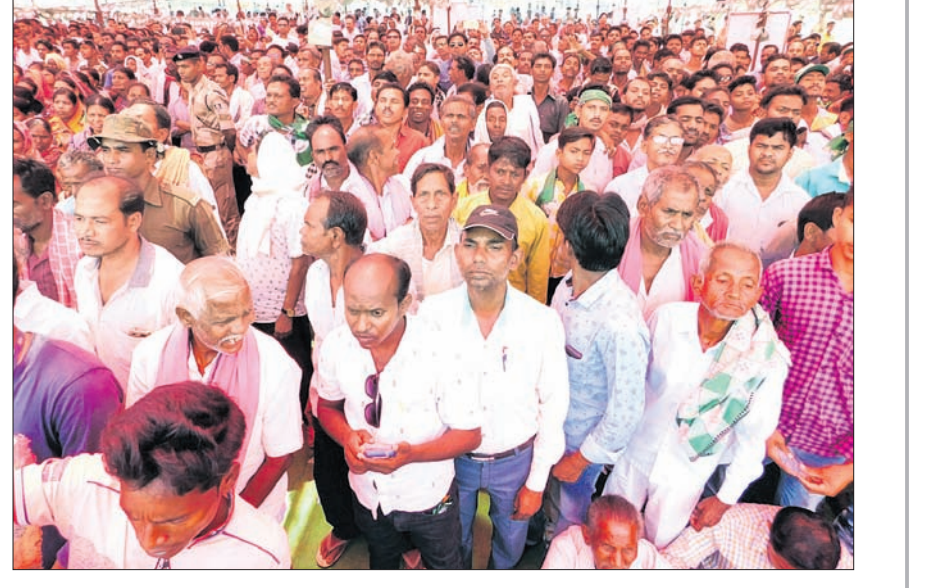
ବିଜେପୁର ନିର୍ବାଚନ ସଭାରେ ଉପସ୍ଥିତ ଜନସାଧାରଣ।