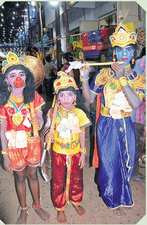
କୃଷ୍ଣ, ବକରାମ, ହନୁମାନ ବେଶରେ ମାନସିକଧାରୀ ।