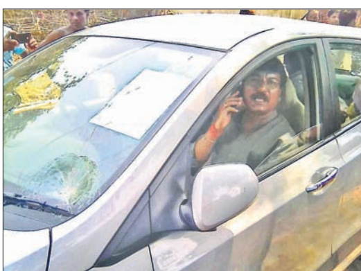
ପଥର ମାଡ କରାଯାଇଥିବା ସମୟରେ ଗିରଫିତ ଗୋଟିଏ କାର୍ ।

ବର୍ତ୍ତମାନରେ ବିଜେପୁର ଥାନା ପୋଲିସ୍ ଅଭିଯୁକ୍ତ ପ୍ରାର୍ଥୀଙ୍କୁ ଗିରଫ କରି କୋର୍ଟାଲାଗ କରିଛି ।