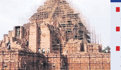
ଆଜି ବିଶ୍ୱ ଐତିହାସିକ ବିଷୟ ■ କୋଣାର୍କର ମୁକ୍ତିପ୍ରାପ୍ତି କୋଣାର୍କ ■ ୫ ହଜାରରୁ ତିଷ୍ଠିରହିଛି ୨ ହଜାର କାର୍ଯ୍ୟାଳୟ ■ ଜନବହୁଳ ଯୋଗୁ ସ୍ଥିତି ହରାଇଛି ପୁରାତନ ମନ୍ଦିର, ପୁଷ୍କରିଣୀ

ଐତିହାସିକ ଗ୍ରନ୍ଥାଳୟ ଓଡ଼ିଶା କୋଣାର୍କର ସୁର୍ଯ୍ୟମନ୍ଦିର ହେଉଛି ରାଜ୍ୟରେ ରହିଥିବା ବହୁ ପୁରାତନ ରାଜପ୍ରାସାଦ, ସବୁଠି ବେଶ୍‌ବାଜୁ ମିଳିଥାଏ ଉତ୍କଳୀୟ ଐତିହାସିକ ଓ ନିର୍ମାଣଶୈଳୀର ପ୍ରତିଛବି ।