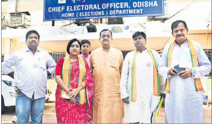
ଭାଜପା ପ୍ରତିନିଧି ଦଳ ସଭାକୁ ଭେଟି ଫେରୁଛନ୍ତି ।

ରାଜ୍ୟରେ ଆଇନଶୁଖିଲା ସମ୍ପୂର୍ଣ୍ଣ ଭାବେ ବିପର୍ଯ୍ୟସ୍ତ ହୋଇପଡିଛି । ଭାଜପା କର୍ମୀମାନଙ୍କ ଉପରେ ଆକ୍ରମଣ କରାଯିବା ସହ ହତ୍ୟା କରାଯାଇଛି । ଶାସକ ବିଜେଡିର ଗୁଣ୍ଡାମାନେ ଅପାରାଧିକାରୀଙ୍କୁ ଯୋଗ୍ୟ କରିବାର ପଦକ୍ଷେପ ଗ୍ରହଣ କରିବାରେ ଅସମର୍ଥ ହେବାରୁ ଗୁଣ୍ଡାମାନେ ଅପାରାଧିକାରୀଙ୍କୁ ପ୍ରତ୍ୟାସିଦ୍ଧ କରୁଛନ୍ତି ।