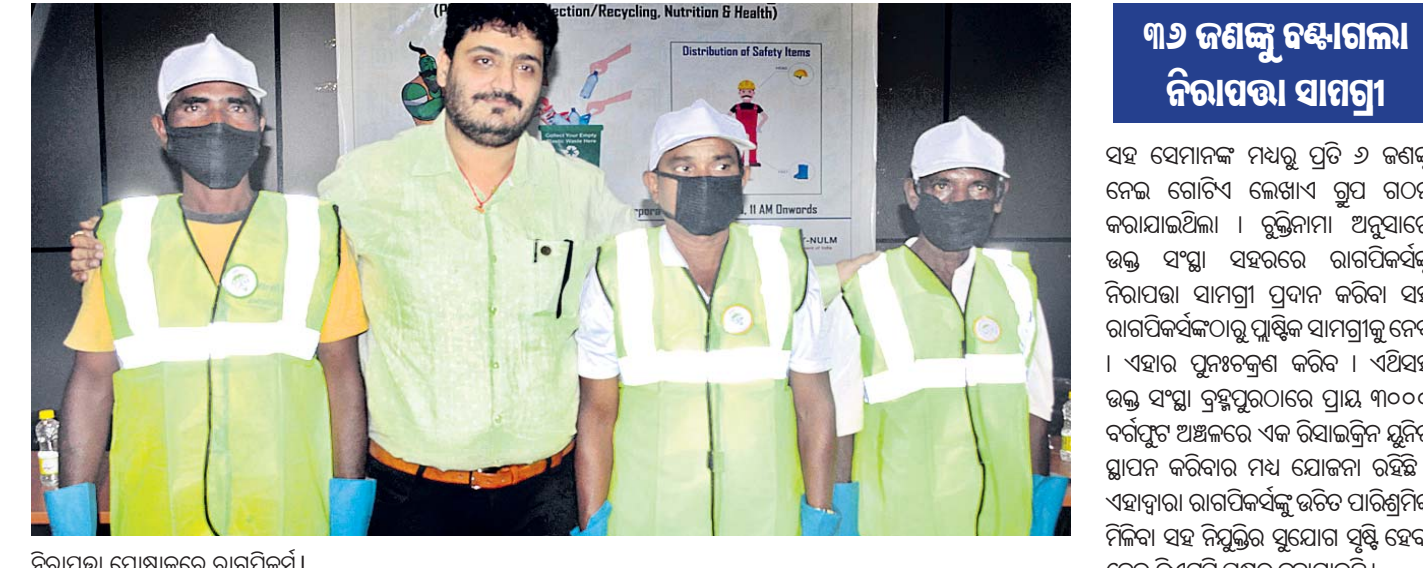
ନିରାପତ୍ତା ପୋଷାକରେ ରାଗପିକର୍ମୀ ।