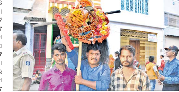
ବାପପୁଣ୍ୟ ମା'ଙ୍କ ନିକଟରେ ପୂଜା କରିବାକୁ ଅଣାଯାଇଛି ।