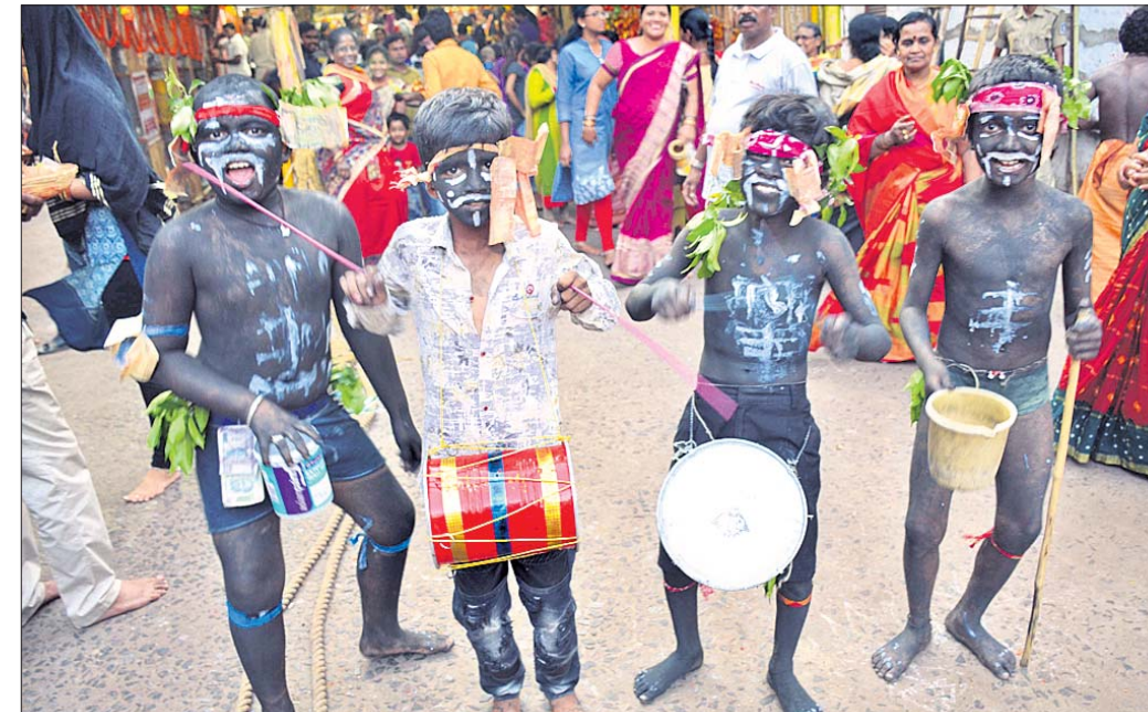
ଶିଶୁମାନଙ୍କ ଛୋଟଗାଳିଆ ବେଶ ।