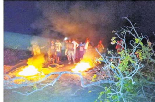
କ୍ଷତିପୂରଣ ଦାବିରେ ଗ୍ରାମବାସୀଙ୍କ ଚାନ୍ଦପୁର-ରଣପୁର ରାସ୍ତା ଅବରୋଧ।

ନୟାଗଡ଼ ଜିଲ୍ଲା ରାମପୁର-ରଣପୁର ରାସ୍ତାର ରାଇପଡ଼ା ଛକଠାରେ ବୁଧବାର ସନ୍ଧ୍ୟାରେ ଏକ ପୋଲିସ୍ ଗାଡ଼ି ଧକ୍କାରେ ଜଣେ ବାଇକ୍ ଆରୋହୀ ଯୁବକ ଗୁରୁତର ହୋଇଛନ୍ତି।