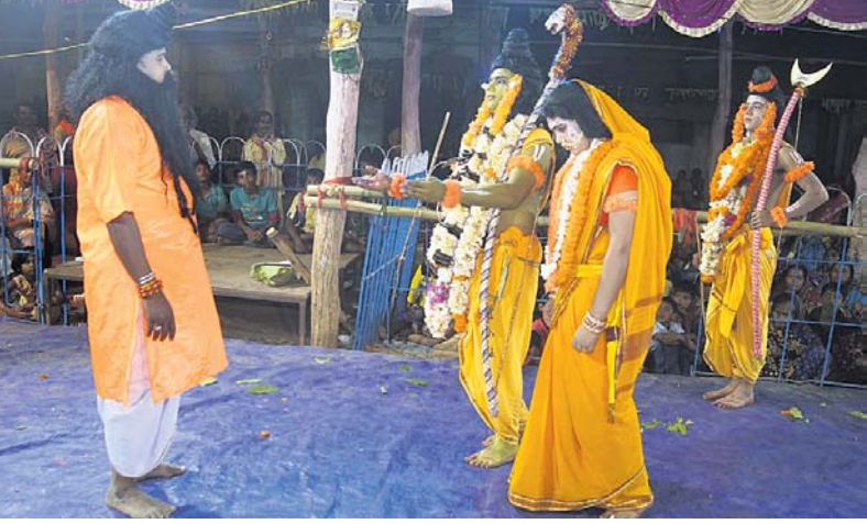
ରାମ ନାଟକରେ ରାମ, ଲକ୍ଷ୍ମଣ ଓ ସୀତାଙ୍କ ବନବାସ ଦୃଶ୍ୟ।