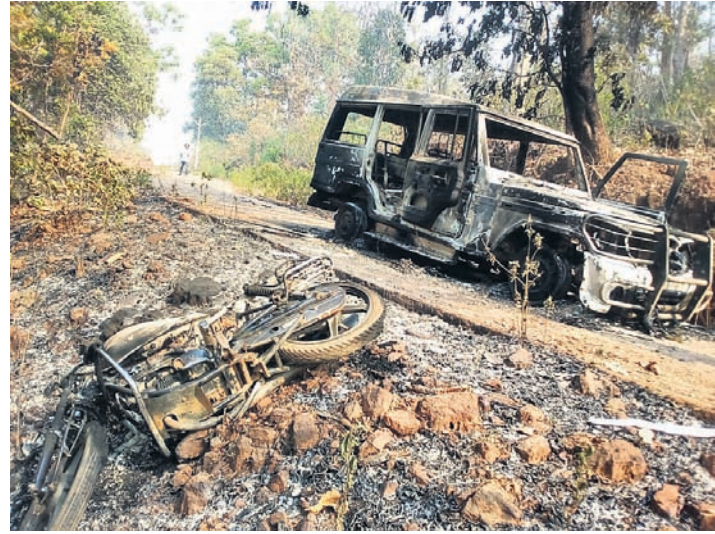
ମାଓବାଦୀମାନେ ପୋଡ଼ିଦେଇଥିବା ପୋଲିଂ ଗାଡ଼ି ।