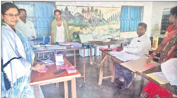
ନୂଆଗାଁ ପ୍ରାଥମିକ ବିଦ୍ୟାଳୟ ମତଦାନ କେନ୍ଦ୍ରରେ ଅଧିକାରୀମାନେ ପ୍ରସ୍ତୁତ ହେଉଛନ୍ତି।