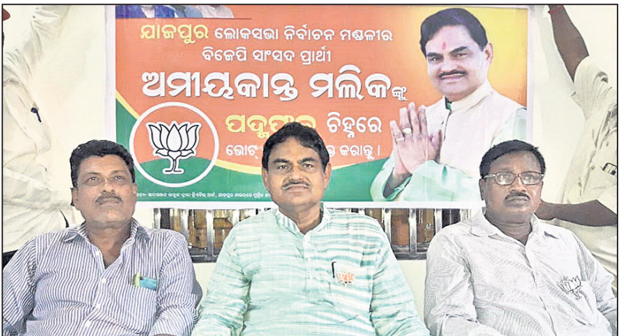
ଝାଜପୁର ଗଞ୍ଜନ, ୧୭/୪(ଡି.ଏନ୍.ଏ.)