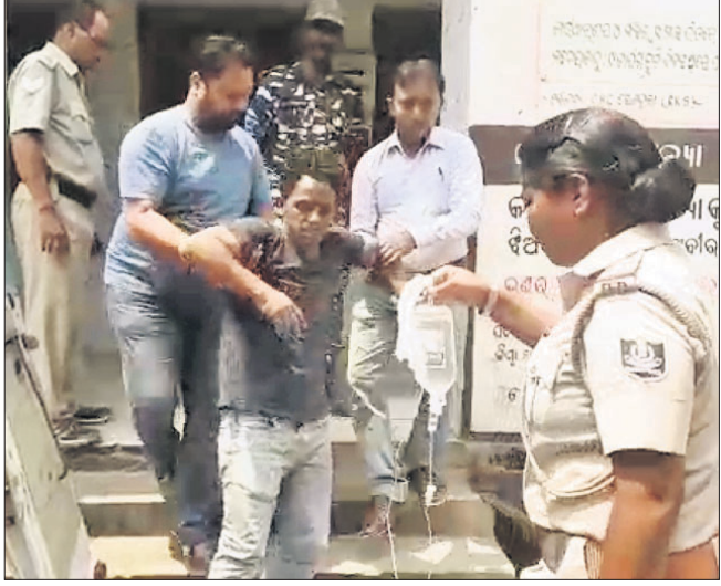
ଆହତଙ୍କୁ ଭରଗଡ଼ ଡାକ୍ତରଖାନାକୁ ବୁଲାଇ ଗୁଣାଗଡ଼ କରାଯାଇଛି ।

ଭରଗଡ଼ ଜିଲ୍ଲା ଭଟଲି ନିର୍ବାଚନମଣ୍ଡଳୀର ସୋହେଲା ଥାନା ବଣ୍ଡାରୀ ଗ୍ରାମରେ ଗୁରୁବାର ମତଦାନ ଚାଲିଥିବାବେଳେ ନିର୍ବାଚନୀ ହିଂସା ଘଟିଛି । ଉକ୍ତ ଗ୍ରାମର ଛୋଟେଲାଇ ପାତ୍ରଙ୍କୁ ଏକ ନିର୍ଦ୍ଦେଶ ରାଜନୈତିକ ଦଳର ସମର୍ଥକମାନେ ସଂଘବଦ୍ଧ ଭାବେ ଆକ୍ରମଣ କରିବା ଯୋଗୁ ସେ ଗୁରୁତର ଆହତ ହୋଇଛନ୍ତି । ପୋଲିସ୍ ତାଙ୍କୁ ଉଦ୍ଧାର କରି ଭରଗଡ଼ ଜିଲ୍ଲା ମୁଖ୍ୟ ଡାକ୍ତରଖାନାରେ ଭର୍ତ୍ତି କରିଥିଲା । ସେଠାରେ ପ୍ରାଥମିକ ଚିକିତ୍ସା ପରେ ଛୋଟେଲାଇକୁ ବୁଲାଇ ଗୁଣାଗଡ଼ କରାଯାଇଛି । ଏହାପୂର୍ବରୁ ବିଜେପୁର ଓ ଭଟଲି ନିର୍ବାଚନମଣ୍ଡଳୀରେ ରୁଧିରା ନିର୍ବାଚନୀ ହିଂସା ଘଟିଥିଲା ।