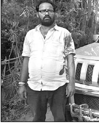
ଆହତ ବ୍ୟକ୍ତି ଓ ଶତ୍ରୁଗ୍ରହ ଗାଡ଼ି ।