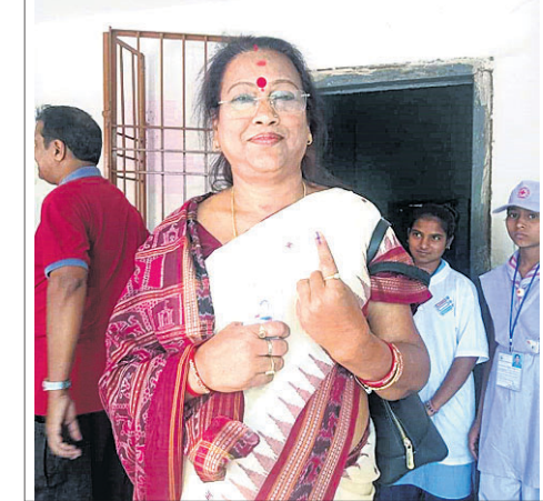
ବ୍ରଜରାଜନଗର ବିଧାୟିକା ତଥା ଭାଜପା ପ୍ରାର୍ଥୀ ରାଧାରାଣୀ ପଣ୍ଡା ମତଦାନ କରି ଫେରୁଛନ୍ତି ।