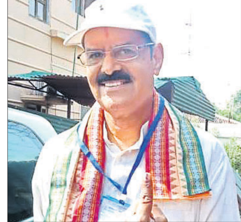
ପାଟଣାଗଡ଼ ରମାଲ ହାଲସୁଲ ମତଦାନ କେନ୍ଦ୍ରରେ ଭାଜପା ବିଧାୟକ କନକ ବର୍ଦ୍ଧନ ସିଂହେଓ ମତଦାନ ପରେ ଫେରୁଛନ୍ତି ।