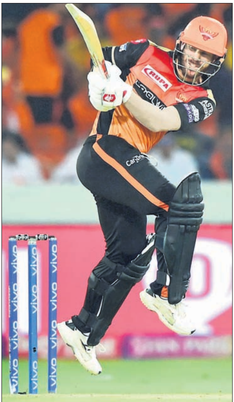
ପୁରୁଷ ଚମ୍ପର ଚେନ୍ନାଇ ଫାଇଦା ଉଠାଇ କେନ୍ଦ୍ର ଫିଲ୍ଡମସନଙ୍କ ନେତୃତ୍ୱାଧୀନ ସନ୍ଦ୍ରାଭଜର୍ ହାଇଦ୍ରାବାଦ ଚଳିତ ଇଣ୍ଡିଆନ୍ ପ୍ରିମିୟର ଲିଗ୍ (ଆଇପିଏଲ୍)ର ୩୩ତମ ମ୍ୟାଚ୍ରେ ଚେନ୍ନାଇ ଚମ୍ପର ଚେନ୍ନାଇ ସୁପର କିଙ୍ଗ୍ସ୍ ୧୯ଟି ବଲ୍ ବାକିଥାଇ ୬ ରନରେ ପରାସ୍ତ ହୋଇଥିଲେ ।

ହାଇଦ୍ରାବାଦ, ୧୮୪(ପି.ଟି.) ଘରୋଇ ପରିବେଶକୁ ଫାଇଦା ଉଠାଇ କେନ୍ଦ୍ର ଫିଲ୍ଡମସନଙ୍କ ନେତୃତ୍ୱାଧୀନ ସନ୍ଦ୍ରାଭଜର୍ ହାଇଦ୍ରାବାଦ ଚଳିତ ଇଣ୍ଡିଆନ୍ ପ୍ରିମିୟର ଲିଗ୍ (ଆଇପିଏଲ୍)ର ୩୩ତମ ମ୍ୟାଚ୍ରେ ଚେନ୍ନାଇ ଚମ୍ପର ଚେନ୍ନାଇ ସୁପର କିଙ୍ଗ୍ସ୍ ୧୯ଟି ବଲ୍ ବାକିଥାଇ ୬ ରନରେ ପରାସ୍ତ ହୋଇଥିଲେ ।