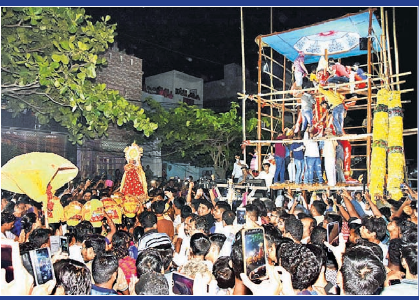
ମା' କୁଳାମୁଖୀ ରଥର ମସ୍ତକ ଘାପନ କରାଯାଇଛି ।

ପାରଳାଖେମୁଣ୍ଡି, ୧୮୪ (ସ୍ଵ.ପ୍ର.): ପାରଳାଖେମୁଣ୍ଡି ରାଣାପେଣ୍ଡି ଚୋରପୁତ୍ର ଗୁମ୍ଫା ନାଳ ପୂର୍ବରୁ ଥିବା ଏକ କଳଭୈରବ ନବାକରଣ କାର୍ଯ୍ୟ ଆରମ୍ଭ ହୋଇଥିଲେ ମଧ୍ୟ ଏହାର କାମ ସମ୍ପୂର୍ଣ୍ଣ ଫଳରେ ଦୀର୍ଘ ଦିନ ଧରି ଅଧାପତ୍ତରିଆ ଭାବେ କଳଭୈରବ କାମ ପଡ଼ିରହିଛି। ଏହି ରାସ୍ତା ପାରଳାଖେମୁଣ୍ଡି ସହ କାଶୀନଗର, ଗୁମ୍ଫା, ସେରଙ୍ଗ, ଗୁମ୍ଫାପୁର, ରାୟଗଡ଼ା ଆଦି ପ୍ରମୁଖ ସହରକୁ ସଂଯୋଗ କରିଛି। ଏହି ରାସ୍ତାରେ ଏଭଳି ଏକ କଳଭୈରବ କାମ ଅଧାପତ୍ତରିଆ ଭାବେ ରହିଥିବାରୁ ଏହା ଯାତାୟତରେ ବହୁ ସମସ୍ୟା ସୃଷ୍ଟି କରୁଛି। ସେହିପରି ଏହି ରାସ୍ତାରେ ପ୍ରତିଦିନ କାଶୀନଗରରୁ ଶ୍ରୀରାମ କଲେଜ, ପଦ୍ମପୁରରୁ ବିନୋଦିନୀ ବିଜ୍ଞାନ କଲେଜ, ଗଜପତି ଫାର୍ମାସା ବହୁ ଶିକ୍ଷାନୁଷ୍ଠାନ, ଏସ୍.ସି ଅଫିସ, ଗ୍ରାମ୍ୟ କଳ ଯୋଗାଣ ବିଭାଗ, କର୍ମନିୟୁକ୍ତି ପଞ୍ଚାକରଣ କାର୍ଯ୍ୟାଳୟ ଆଦି ପ୍ରମୁଖ ସ୍ଥାନକୁ ଦୈନନ୍ଦିନ ଶହ ଶହ ଲୋକ ଯାତାୟତ କରିଥାନ୍ତି। ତେବେ ଏହି ଅଧାପତ୍ତରିଆ କଳଭୈରବ ଯୋଗୁଁ ମାଟି ରାସ୍ତାଦେଇ ଗାଡ଼ିଗୁଡ଼ିକ ଗଲାବେଳେ ଦୁର୍ଘଟଣା ଘଟୁଛି। ବୁଧବାର ଏହି କଳଭୈରବ କାମ ଶେଷ କରିବାକୁ ଅଞ୍ଚଳବାସୀ ଦାବି କରିଛନ୍ତି।