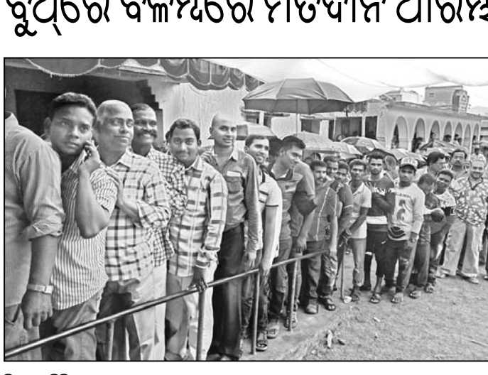
ଜି.ଉଦୟଗିରି ୭୦୯ ନଂ. ରୁଥରେ ମତଦାନ ଅପେକ୍ଷାରେ ଶରୀରୀକ ଭୋଟର