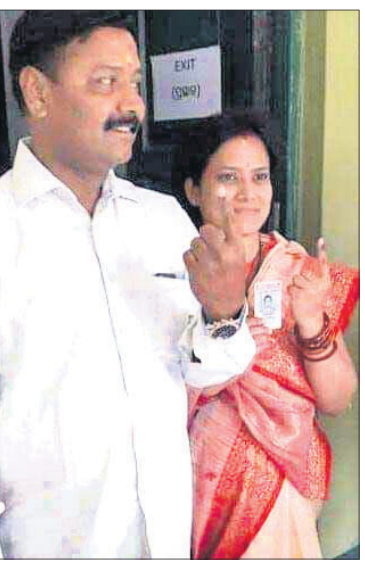
ମତଦାନ କରି ଫେରୁଛନ୍ତି ରଘୁନାଥପାଲି ବିଧାୟକ ସୁବ୍ରତ ଚରାଳ ଓ ତାଙ୍କ ସ୍ତ୍ରୀ ।