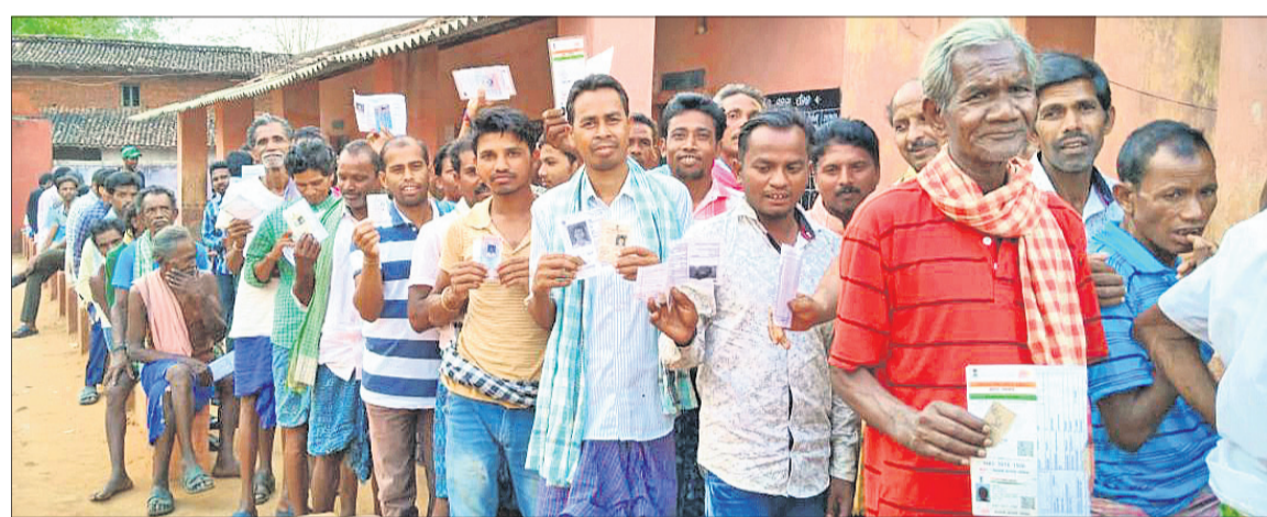
ବଲାଙ୍ଗୀର ଜିଲ୍ଲା ଖପ୍ପାଖୋଲ ବ୍ଲକ୍ ଅନ୍ତର୍ଗତ ଭୁଲ୍ଲା ମତଦାନ କେନ୍ଦ୍ରରେ ମତାଧିକାର ସାବ୍ୟସ୍ତ କରିବା ପାଇଁ ଭୋଟରମାନେ ଲମ୍ବାଧାଡ଼ିରେ ଠିଆ ହୋଇଛନ୍ତି।