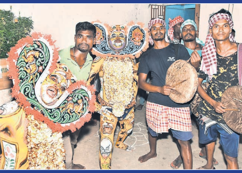
ଦୁଇ ବାଦ ଦେଖିଧାରାଙ୍କ ପଟୁଆର ।