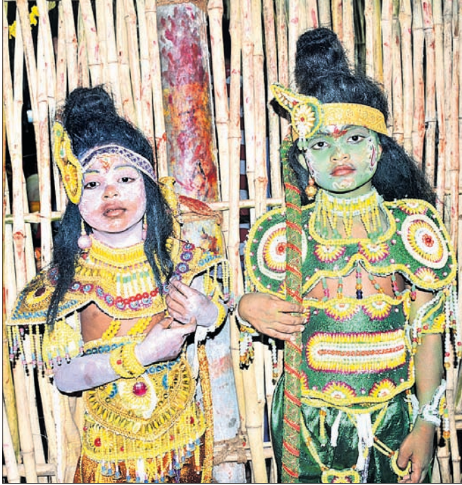
ମାନସିକଧାରୀଙ୍କ ରାମଲକ୍ଷ୍ମଣ ବେଶ ।

ପଶ୍ଚିତ ସାହି ପ୍ରକୃତି ପରିକ୍ରମା କରିଥିଲା । ଏହାପରେ ପୁଣି କରୀବିଆ ସାହି, ନଡ଼ିଆ ବଜାର ହୋଇ ଅଗ୍ରାୟା ପୀଠରେ ପହଞ୍ଚିଥିଲା । ମା'ଙ୍କ ଆଗମନରେ ଉପରୋକ୍ତ ସମସ୍ତ ସାହି ଉତ୍ସବମୁଖର ହୋଇଉଠିଥିଲା । ମା'ଙ୍କୁ ସ୍ଵାଗତ କରିବାକୁ ମହିଳାମାନେ ଘର ଦୁଆରେ କୁମ୍ଭ ଘାପନ କରିଥିଲେ । ମୁଖ୍ୟଦର୍ପଣାରୀ ପାଦରେ ହଳଦୀ, କର୍ପୂର ପାଣି ଢାଳିବା ସହ ମା'ଙ୍କ ପୂଜାର୍ଚ୍ଚନା କରିଥିଲେ । ତେବେ ଯାତ୍ରା ଶେଷ ପର୍ଯ୍ୟାୟରେ ଅବତୀର୍ଣ୍ଣ ହୋଇଥିବା ବେଳେ ଏବେ ପ୍ରତି ସାହିରେ ଯାତ୍ରାର ବାଟାବରଣ ଦେଖିବାକୁ ମିଳିଛି । ରଥ ଉଦ୍ଘୋଷିତ ହୋଇଥିବା ସାହିରେ ଶ୍ରଦ୍ଧାଳୁଙ୍କ ଭିଡ଼ ଜମୁଥିବା ବେଳେ ଅନ୍ୟ ସାହି ପକ୍ଷରୁ ରଥ ଓ କଳାକୃତ୍ତ ଉଦ୍ଘୋଷନ ପାଇଁ ପ୍ରସ୍ତୁତି ଶେଷ ପର୍ଯ୍ୟାୟରେ ପହଞ୍ଚିଛି । ଗୁରୁବାର ଷଷ୍ଠମ ସାହିର ଶିବାରୁଡ଼ା