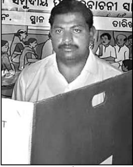
ସମ୍ବୁଦ୍ଧ ପୂର୍ବ ନିର୍ବାଚନ ସ୍ଥଳରେ