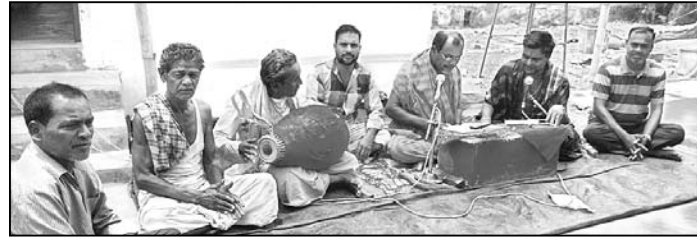
ବ୍ୟାସ ଓ ଧାରକଙ୍କ ଦ୍ୱାରା ପଠାଯାଉଛି ।

ଗଞ୍ଜାମ, ୧୮ ୪(ଡି.ଏନ.ଏ.) ଗଞ୍ଜାମ ବଜାରସ୍ଥିତ ଲକ୍ଷମାନ ବାଲାଜୀ ମନ୍ଦିର ପ୍ରାଙ୍ଗଣରେ ଶ୍ରୀରାମ ନବମୀ ଉପଲକ୍ଷେ ରାମାୟଣ ପ୍ରଚାର କମିଟି ପକ୍ଷରୁ ରାମ ଚରିତ ମାନସ ଏବଂ ନବାହ୍ନ ପାରାୟଣ କାର୍ଯ୍ୟକ୍ରମ ଅନୁଷ୍ଠିତ ହେଉଛି । ଏହା ୯ ଦିନ ବ୍ୟାପୀ ହେବ