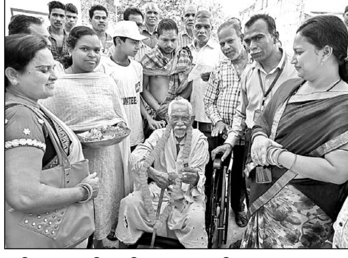
ସ୍ତ୍ରୀ ନିକଟରେ ଜଣେ ବରିଷ୍ଠ ନାଗରିକଙ୍କୁ ସାଗତ କରାଯାଇଛି ।