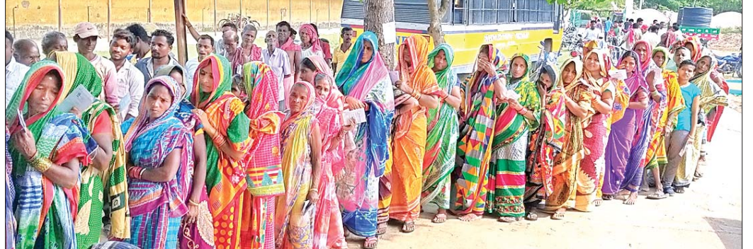
ମତଦାନ ପାଇଁ ଧାଡ଼ିରେ ଠିଆ ହୋଇଛନ୍ତି ମହିଳାମାନେ।

କରାଯାଇଥିବାବେଳେ ୮ଜଣ ସେକ୍ଟର ଅଧିକାରୀଙ୍କୁ ନିୟୋଜିତ କରାଯାଇଥିଲା। କବିସୂର୍ଯ୍ୟନଗର ନିର୍ବାଚନମଣ୍ଡଳରେ ଥିବା ୧୧ ପଞ୍ଚାୟତର ଭୋଟରଙ୍କ ଲାଗି ୫୯ ବୁଥର ବ୍ୟବସ୍ଥା କରାଯାଇଛି। ପରିଚାଳନା ପାଇଁ ୫ ଜଣ ସେକ୍ଟର ଅଧିକାରୀଙ୍କୁ ନିୟୋଜିତ କରାଯାଇଛି। ପୁରୁଷୋତ୍ତମପୁରରେ ୬୦ ପ୍ରତିଶତ ମତଦାନ ହୋଇଥିବା ଜଣାପଡ଼ିଛି।