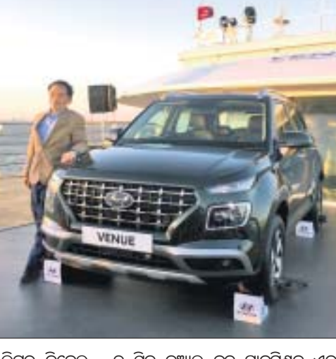
ଲିଟର ଡିଜେଲ, ୬ କ୍ସିଟ୍ ଡୁଆଲ କୁଟ୍ ଟ୍ରାନ୍ସମିଶନ ଏବଂ ବୋଲ୍ଡ ଡିଜାଇନକୁ କମ୍ପାନୀ ଏଥିରେ ଗୁରୁତ୍ୱ ଦେଇଛି।

ପ୍ରମୁଖ କାର ମାଡୁଫାକ୍‌ଟରର ହୁଏଟାଲ ପକ୍ଷରୁ ଦେଶର ପ୍ରଥମ କନେକ୍ଟେଡ୍ ଏସ୍‌ୟୁଭି 'ହୁଏଟାଲ ଭେନ୍ୟୁ'ର ବଜାର ପ୍ରବେଶ କରାଯାଇଛି। ଏହାକୁ ପୂର୍ବରୁ ୨୦୧୯ ମୁଖ୍ୟତଃ ଅଟୋ ଶୋ'ରେ ସାମିଲ କରାଯାଇଥିଲା। ଏହି ହୁଏଟାଲ ଏସ୍‌ୟୁଭି ଆରବ ସାଗରର ଏକ କ୍ରୁଜ ଲାଇନରେ ଉନ୍ନତ କରାଯାଇଛି। କମ୍ପାନୀର ଏମ୍‌ପ୍ଲି ତଥା ସିଲ୍‌ଓ ଏସ୍‌ଏସ୍‌ଏଲ୍ ଏସ୍‌ଏସ୍‌ଏଲ୍ ପ୍ରବେଶ କରାଇଛନ୍ତି। ଭାରତ ବଜାରରେ ବିଶ୍ୱ ସ୍ତରୀୟ ପ୍ରଡକ୍ଟ ଯୋଗାଣ ଲାଗି ସର୍ବନିମ୍ନ ପ୍ରତିବନ୍ଧିତା ଦେଖାଇ ଆସିଛି ବୋଲି ସିଲ୍‌ଓ କିମ୍ କହିଛନ୍ତି। ଦେଶର ପ୍ରଥମ କନେକ୍ଟେଡ୍ ଯାନ ହୋଇଥିବାରୁ ଏହା ଗ୍ରାହକଙ୍କ ଦ୍ୱାରା ଆଦୃତି ଲାଭ କରିବ। ଏକ ଉନ୍ନତ ଉନ୍ନତ ଉତ୍ପାଦନ ଏହି ପୁରୁଷା ଏବଂ ସଶକ୍ତ ଦିଗରେ ଏହା କାର୍ଯ୍ୟ କରିବ। ହୁଏଟାଲ କୁ ଲିଜ୍ ଟେକ୍ନୋଲୋଜିକୁ ଏଥିରେ ସାମିଲ କରାଯାଇଥିବା କିମ୍ କହିଛନ୍ତି। ୩୩ କନେକ୍ଟେଡ୍ ଫିଟର ମଧ୍ୟରୁ ୧୦ କେବଳ ଭାରତ ବଜାରକୁ ରଖି ପ୍ରସ୍ତୁତ କରାଯାଇଛି। କାର୍ଯ୍ୟ ୧.୦ ଟି-ଡିଆଇ ପେଟ୍ରୋଲ, ୧.୨ ଲିଟର ପେଟ୍ରୋଲ, ୧.୪