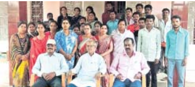
ବୈଠକରେ ବୁଲ୍ ଦର୍ଜି ସଂଘର କର୍ମକର୍ତ୍ତା।

ସୁନାବେଡ଼ାରେ ଏବେ ଅସମ୍ଭାଳ ଚାଟି। ଚାଟିରୁ ରକ୍ଷା ପାଇବା ପାଇଁ ଲୋକେ ଦିନସାରା ଘରୁ ବାହାରିବାକୁ ମନ କରୁନାହାନ୍ତି। ଆଖୁ, ପଣା, ଲାସି, ଦହିବରା ଦୋକାନରେ ବେ ପ୍ରବଳ ଭିଡ଼ ହେଉଛି। ଗରିବ ଖଟିଖୁଆମାନେ ଗରମରୁ ରକ୍ଷା ପାଇବା ପାଇଁ କେନାଲ ଓ ବନ୍ଧରେ ଗାଧୋଉଛନ୍ତି। ସୁନାବେଡ଼ାରେ ଦିନ ୧୨ଟାରୁ ୩ଟା ଯାଏଁ ୩୬ ଡିଗ୍ରୀ ରହୁଛି। ଆଗରୁ ତାତି ଆଖୁର ବଢ଼ିବ ବୋଲି ଆଶଙ୍କା କରାଯାଉଛି। ତେବେ ଏଭଳି ଖରାରେ ପାଣି ପାଇଁ ହଜିରାଣ ହେଉଥିବା ପଥଚାରୀଙ୍କ ପାଇଁ ପ୍ରଶ୍ନାସନ ଏଯାବତ୍ କୌଣସି ଜଳଛତ୍ର ଖୋଲିନାହିଁ। ତୁରନ୍ତ ବିଭିନ୍ନ ଗଞ୍ଜେଇ ସ୍ଥାନରେ ଜଳଛତ୍ର ଖୋଲିବା ପାଇଁ ସାଧାରଣରେ ଦାବି ହୋଇଛି।