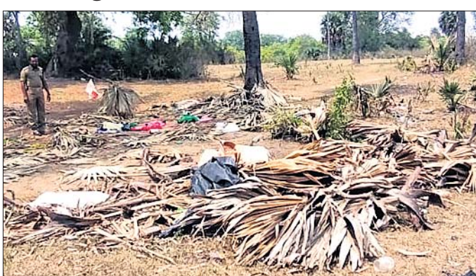
ଷଷ୍ଠ ଗାଁର ଘଟଣାସ୍ଥଳରେ ବନ ବିଭାଗର ଜଣେ କର୍ମଚାରୀ।

ତାଳଚେର, ୧୯୪୪ (ନି.ପ୍ର.) ଏକାଦେକ ୫ ଜୀବନ ନେଇଛି ହାତୀ। ଘର ଭାଙ୍ଗି ଦଳି ମାରିଛି ୪ଜଣଙ୍କୁ। ଖଣ୍ଡ ବିଖଣ୍ଡ କରି ଫୋପାଡ଼ି ଦେଇଛି ଜଣେ ବୃଦ୍ଧଙ୍କୁ। ଗୁରୁବାର ବିଳମ୍ବିତ ରାତିରେ ଅନୁଗୋଳ ଜିଲ୍ଲା ତାଳଚେର ପୌରାଞ୍ଚଳର ଷଷ୍ଠ ଗାଁ ଓ ନିକଟସ୍ଥ ସରପଡ଼ାରେ ଘଟିଥିବା ଏପରି ଏକ ଅଭାବନୀୟ ଘଟଣା ଘଟୁଛି କରିଦେଇଛି ସମସ୍ତଙ୍କୁ। ଖବରପାଇ ସକାଳୁ ବନ ବିଭାଗ କର୍ମଚାରୀ ଘଟଣାସ୍ଥଳରେ ପହଞ୍ଚି ଉତ୍ତମ ଲୋକଙ୍କୁ ବୁଝାଶୁଝା କରିବା ସହ ସମସ୍ତ ମୃତଦେହ ଉଦ୍ଧାର କରିଛନ୍ତି। ଡେକାନାଲ ଜିଲ୍ଲା ମହାବିରୋଡ଼ ରେଞ୍ଜରୁ ବ୍ରାହ୍ମଣୀ ନଦୀ ପାର ହୋଇ ଚାଲିଆସିଥିବା ଏକ ଦନ୍ତାହାତୀର ଏପରି ଉତ୍ତରକାଣ୍ଡ