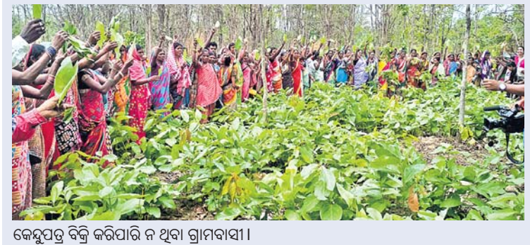
କେନ୍ଦୁପତ୍ର ବିକ୍ରି କରିପାରି ନ ଥିବା ଗ୍ରାମବାସୀ।

■ ଗତବର୍ଷ ଏମ୍.ଭି.-୧୮ ■ ପତ୍ର ନ କିଣିଲେ ■ ପ୍ରଶାସନକୁ ଜଣାଇଲେ ଫଡ଼ିରେ ବିକ୍ରି ହୋଇଥିଲା ରାସ୍ତାରୋକୋ ଗ୍ରାମବାସୀ