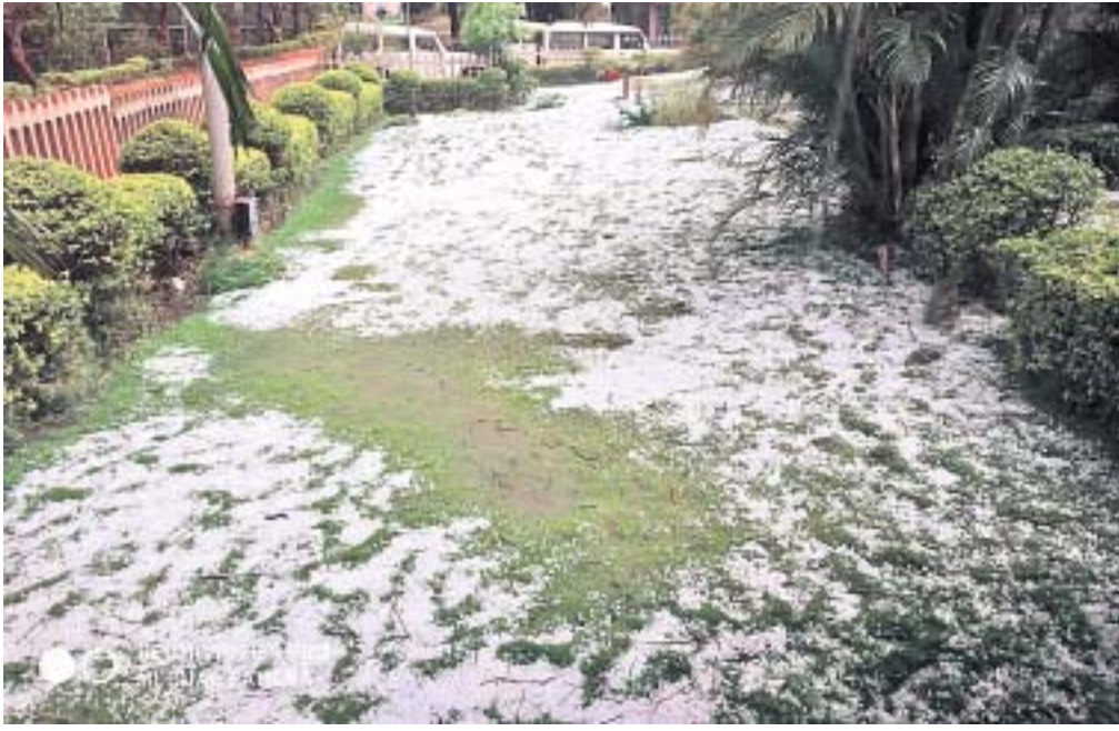
ଦାମନଯୋଡ଼ିସ୍ଥିତ ନାଲକୋ ହିଲ୍‌ଟପ୍‌ରେ ଶୁକ୍ରବାର ପ୍ରବଳ କୁଆପଥର ବର୍ଷା ପରର ଦୃଶ୍ୟ।