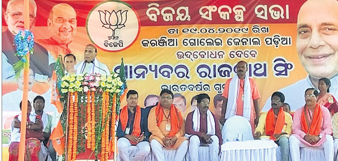
ବିଜୟ ସଂକଳ୍ପ ସଭାରେ କେନ୍ଦ୍ରମନ୍ତ୍ରୀ ରାଜନାଥ ସିଂ ଉଦ୍‌ବୋଧନ ଦେଉଛନ୍ତି।

ପ୍ରଧାନମନ୍ତ୍ରୀ ନରେନ୍ଦ୍ର ମୋଦିଙ୍କ ନେତୃତ୍ୱରେ ଭାରତ ଅଧିକ ଶକ୍ତିଶାଳୀ ହେଉଥିବାରୁ ପୂର୍ଣ୍ଣାଙ୍ଗୀଣ ୪୨ ଜଣ ସଦନକୁ ଆକ୍ରମଣ କରାଯିବାର ୧୩ ଦିନ ମଧ୍ୟରେ ଦେଶର ବାୟୁସେନା ସଦାନମାନେ ପାକିସ୍ତାନ ସୀମା ମଧ୍ୟରେ ପଶି ଆକ୍ରମଣକୁ ନିପାତ କରିପାରିବେ। ୨୦୧୯ ବେଳକୁ ଭାରତ ବିଶ୍ୱର ତୃତୀୟ ଶକ୍ତିଶାଳୀ ଦେଶରେ ପରିଣତ ହୋଇପାରିବ। ଭାଜପା ପୁନର୍ବାର କ୍ଷମତାକୁ ଆସିଲେ ଦେଶକୁ ଅଧିକ ଶକ୍ତିଶାଳୀ କରିବା ସହ ବିକାଶ ପଥରେ ଆଗେଇଯିବ। ରେଳ ମାନଚିତ୍ରକୁ ବାଦ୍ ପଡିଥିବା କରଞ୍ଜିଆ ଭଳି ଅଞ୍ଚଳରେ ରେଳ ବିକାଶକୁ ପ୍ରାଥମିକତା ଦିଆଯିବ। କରଞ୍ଜିଆକୁ ରେଳପଥରେ କଲିକତା ଓ ବନ୍ଦେ ସହିତ ସଂଯୋଗ କରାଯିବ ବୋଲି ଶୁକ୍ରବାର କରଞ୍ଜିଆ ଗୋଲେଇ କେନାଲ ପତିଆରୀରେ ଭାଜପା ପକ୍ଷରୁ ଆୟୋଜିତ ବିଜୟ ସଂକଳ୍ପ ସଭାରେ ଘୋଷଣା କରାଯାଇଥିଲା। କେନ୍ଦ୍ର ଗୃହ ମନ୍ତ୍ରୀ ରାଜନାଥ ସିଂ କହିଛନ୍ତି। କେନ୍ଦ୍ରର ଲୋକ ସଭା ନିର୍ବାଚନ ମଣ୍ଡଳୀ ଅନ୍ତର୍ଗତ ମୟୂରଭଞ୍ଜ ଜିଲାର କରଞ୍ଜିଆ ବିଧାନସଭା କ୍ଷେତ୍ର ପାଇଁ ଆସନ୍ତା ୨୩ ତାରିଖ ତୃତୀୟ ପର୍ଯ୍ୟାୟରେ ନିର୍ବାଚନ ହେଉଛି। ଏଥିଲାଗି ଭାଜପା ପ୍ରଚାର କାର୍ଯ୍ୟକୁ ଦୂରାନ୍ୱିତ କରିଛି। କେନ୍ଦ୍ର ଗୃହମନ୍ତ୍ରୀ