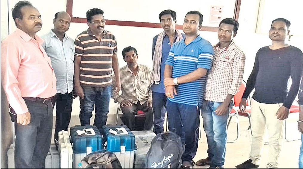
ଜଙ୍ଗଲ ରାସ୍ତାରେ ଚାଲି ଚାଲି ଆସିଥିବା ପୋଲିଂ ପାର୍ଟି ।

ଦ୍ୱିତୀୟ ପର୍ଯ୍ୟାୟ ମତଦାନ ଦିନକୁ ପୂର୍ବରୁ ବୁଧବାର କନ୍ଧମାଳ ଜିଲ୍ଲା ପିରିଲିଆ ବ୍ଲକ୍ ବାରାହାଲୀରେ ମାଓବାଦୀମାନେ ଲ୍ୟାଣ୍ଡମାଇନ ବିସ୍ଫୋରଣ କରିବା ସହ ପୋଲିଂ ଟେକିଂ ପାର୍ଟିର ମେସେଞ୍ଜର ସଂପୂର୍ଣ୍ଣ ଦିଗକୁ ବୁଲିକରି ହତ୍ୟା କରିଥିଲେ । ଏହି ଘଟଣା ସାରା ରାଜ୍ୟରେ ଚାଷୀଙ୍କୁ ଖେଳାଇଥିଲା । ମାଓବାଦୀ ଅଧିକାରୀ ଉଚ୍ଚ ଅଞ୍ଚଳରେ ଶାନ୍ତିଶୃଙ୍ଖଳାରେ ନିର୍ବାଚନ ପରିଚାଳନା ଜିଲ୍ଲା ପ୍ରଶାସନ ପାଇଁ ଚ୍ୟାଲେଞ୍ଜ ହୋଇଥିଲା । ତେବେ ଗୁରୁତ୍ୱପୂର୍ଣ୍ଣ ସେଠାରେ ପୁରୁଖୁରୁରେ ନିର୍ବାଚନ ସରିଥିଲା । ଜାବନକୁ ବାଜି ଲଗାଇ ପୋଲିଂ ପାର୍ଟି ନିଜ କର୍ତ୍ତବ୍ୟ କରିଥିଲେ । ହେଲେ ସେମାନେ ଅକଥନୀୟ ଯନ୍ତ୍ରଣା ସହିଛନ୍ତି । ମତଦାନ ସମ୍ପର୍କିତ ନିୟମ, ଲଜିଷ୍ଟ୍ରି ସହ ସୁରକ୍ଷିତ ଭାବେ ଫେରିବା ପାଇଁ ସେମାନଙ୍କୁ ରାତିରେ ଘାଟ ଜଙ୍ଗଲରେ ୧୨ ଘଣ୍ଟା ଚାଲିବାକୁ ପଡ଼ିଛି । ବର୍ଷାରେ ଭିଜି ଭିଜି ଶୁକ୍ରବାର