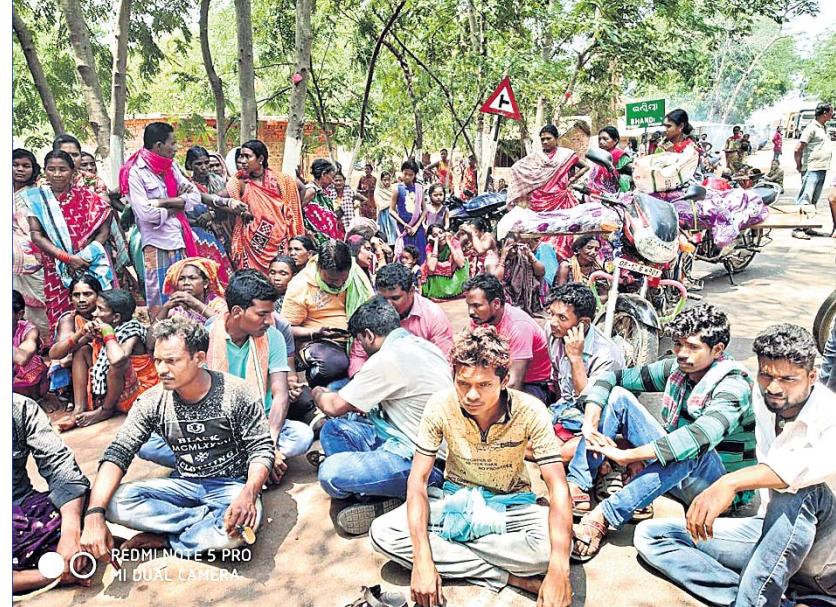
ମୃତଦେହ ରଖି ଲୋକେ ରାସ୍ତାରୋକୋ କରୁଛନ୍ତି।

ପହଞ୍ଚିଲେକେ ସହ ଆଲୋଚନା କରିଥିଲେ। ରେଡକ୍ରସ ଚଳାପ ୧୦ହଜାର ଟଙ୍କା, କୋଷାଗୁଡ଼ା ବିଦ୍ୟୁତ୍ ବିଭାଗ ପକ୍ଷରୁ ୨୦ହଜାର ଟଙ୍କା, ଆବାସ ଯୋଜନାରେ ଘର, ମନଙ୍କ ସ୍ତ୍ରୀଙ୍କୁ ଭଲ ସହ ବିଦ୍ୟୁତ୍ ବିଭାଗ ତରଫରୁ ଚାକିରି ଦିଆଯିବ ବୋଲି ନିଶ୍ଚିତ ପ୍ରତିଶ୍ରୁତି ଦେବା ପରେ ରାସ୍ତାରୋକୋ ହଟିଥିଲା।