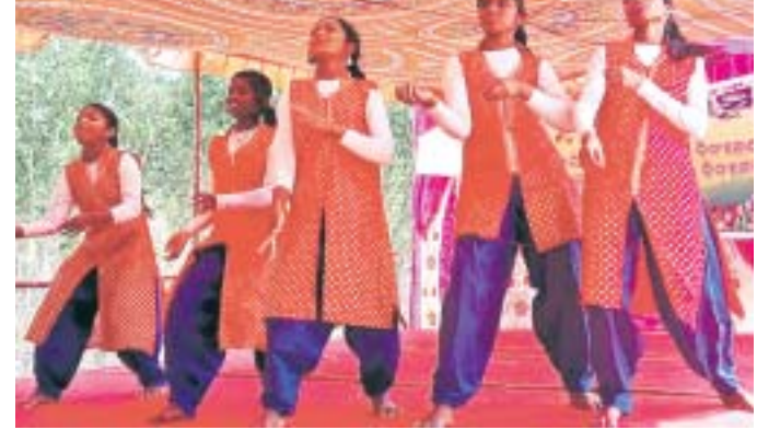
ବାର୍ଷିକ ଉତ୍ସବରେ ନୃତ୍ୟ ପ୍ରଦର୍ଶନ କରୁଛନ୍ତି ଛାତ୍ରୀ।