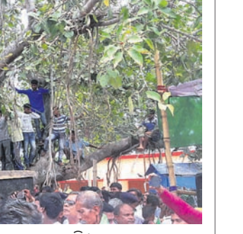
ଗଛରେ ଲୋକମାନେ ସଭା ଦେଖିଛନ୍ତି ।

ନିର୍ବାଚନୀ ସଭା ଚାଲିଥିଲା ବେଳେ ଦୁଃଖମନ୍ତ୍ରୀଙ୍କୁ ଦେଖିବା ପାଇଁ ପ୍ରବଳ ଜନ ସମାଗମ ହୋଇଥିଲା । ତେବେ କେତେକ ବିଜେଡି କର୍ମୀ ସଭା ମଞ୍ଚ ନିକଟରେ ଥିବା ଏକ ବରଗଛ ଉପରେ ବିପଦ ସଙ୍କୁଳ ଅବସ୍ଥାରେ ଚଢ଼ି ଦୁଃଖମନ୍ତ୍ରୀଙ୍କୁ ଦେଖିଥିଲେ । ତେବେ ପୋଲିସ ସେମାନଙ୍କୁ ବାରଣ କରି ନ ଥିଲା ।