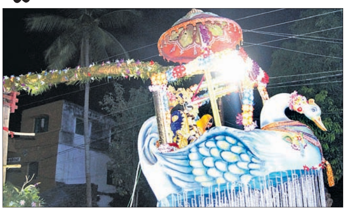
ପୁଷ୍ପକ ବିମାନରେ ସୀତାଙ୍କୁ ରାବଣ ହରଣ କରୁଛନ୍ତି ।

ଦଶପଲ୍ଲୀ, ୧୯୮୪(ଡି.ଏନ.ଏ.) ମହାବୀର କ୍ଷେତ୍ର ଦଶପଲ୍ଲୀରେ ଚାଲିଥିବା ପ୍ରସିଦ୍ଧ ଲଙ୍କାପୋଡ଼ି ଯାତ୍ରାର ଶୁକ୍ରବାର ୫ମ ଦିବସରେ ସୀତା ହରଣ ଉତ୍ସବ ଶାସ୍ତ୍ରମତେ ପାଳିତ ହୋଇଯାଇଛି । ପୁଷ୍ପକ ବିମାନରେ ସୀତା ହରଣ ଥିଲା ଯାତ୍ରାର ମୁଖ୍ୟ ଆକର୍ଷଣ । ରାମଲୀଳା ରଙ୍ଗମଞ୍ଚରେ ରାମ, ଲକ୍ଷ୍ମଣ, ସୀତା ପଞ୍ଚବଟୀରେ ରଖୁଥିବା ଦେଖିବାକୁ ମିଳିଥିଲା । ରାବଣ ଭଉଣୀ ପୂର୍ବଶାଖା ରାମଙ୍କ ସୌନ୍ଦର୍ଯ୍ୟରେ ବିମୋହିତ ହୋଇ ତାଙ୍କୁ ବିବାହ କରିବାକୁ ଇଚ୍ଛା କରିଥିଲେ । ପୂର୍ବଶାଖା ଏହି ପ୍ରସ୍ତାବ ଦେବା ପରେ ରାମ ସୀତାଙ୍କୁ ବିବାହ କରିଥିବା କହି ପେରାଇ ଦେଇଥିଲେ । ପୂର୍ବଶାଖା ସମାନ କଥା ବୋଧହୋଇବାରୁ ରାମ ତାଙ୍କୁ ଲକ୍ଷ୍ମଣଙ୍କ ନିକଟକୁ ପଠାଇ