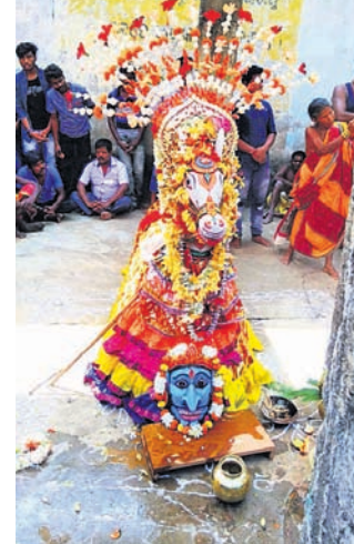
ବାଣ୍ଡୁଳାଙ୍କ ପୂଜା କରାଯାଉଛି ।

ଓ କଣ୍ଠିଲୋ କଂସାରାସାହି ପାଟଣା ଗ୍ରାମର କୈବର୍ତ୍ତମାନେ ବାଣ୍ଡୁଆରେ ଏକ ଘୋଡ଼ା ପୁଷ୍ପକୁ ସ୍ଥାପନ କରି ପୂଜାର୍ଚ୍ଚନା କରିଥିଲେ । ଶକ୍ତି ରୂପିଣୀ ବାଣ୍ଡୁଳାଙ୍କ ପୂଜା ସହ ଆଳିତ ହୋଇଥାଏ ଏହି ସମ୍ପ୍ରଦାୟର କୌଳିକ ପର୍ବ ଚଉତି । ସବୁ ଲୋକନାଟକ ପରି ଘୋଡ଼ାନାଟ ତିନୋଟି ଭାବଧାରା ସହ ସଂଯୁକ୍ତ । ବିଶ୍ୱାସ, ଆଧୁନିକ ପୂଜା ପାର୍ବଣ ଓ ମନୋରଞ୍ଜନ । ଘୋଡ଼ାନାଟ ଏକ ସାମ୍ପ୍ରଦାୟିକ ଲୋକନାଟ ଦୃଷ୍ଟିରୁ ମଧ୍ୟରେ ସାମିତ । କିନ୍ତୁ ମନୋରଞ୍ଜନ ଦିଗଟି ସର୍ବ ଲୋକାଦୃତ । କରୋଡ଼ାନାଟର ଅନ୍ତରାଳରେ ମୂର୍ତ୍ତିମତ ହୋଇ ଉଠେ କୈବର୍ତ୍ତ ସମ୍ପ୍ରଦାୟର ଗୌରବମୟ ଅତୀତ ଭୂତପୂର୍ବ । ଗୋଟିଏ ଗୀତକୁ ଏ ଭାବରେ ପୌରାଣିକ ଓ ସାହିତ୍ୟିକ ପ୍ରସିଦ୍ଧି ସମ୍ପର୍କରେ କାଣ୍ଡିତ । "ବଟ ବୃକ୍ଷ ମୂଳେ ଜନନ ହୋଇଲି ସିଂହଙ୍କ ଦ୍ୱୀପରେ ଘର, ସିଂହ ବାଣ୍ଡୁଳାକୁ କାନ୍ଧରେ ବୋହିଛି, ସିପାହିରେ କୈବର୍ତ୍ତ ନାମଟି ମୋର ।" କୈବର୍ତ୍ତମାନେ ଏକାଠି ହୋଇ ବାଣ୍ଡୁଳାଙ୍କ ପ୍ରତୀକ ଅର୍ଥ ମୁଖକୁ ସଜାଇ ଏକ ବେଦୀ ଉପରେ ରଖି ପୂଜା କରିବା ସମୟରେ ମା'ବାଣ୍ଡୁଳାକୁ ପାରମ୍ପରିକ ରୀତିରେ ପୂଜାର୍ଚ୍ଚନା କରିଥିଲେ । ସେହିପରି ସିଧାମୂଳା ଡକ ଦେଉଡ଼ସାହି