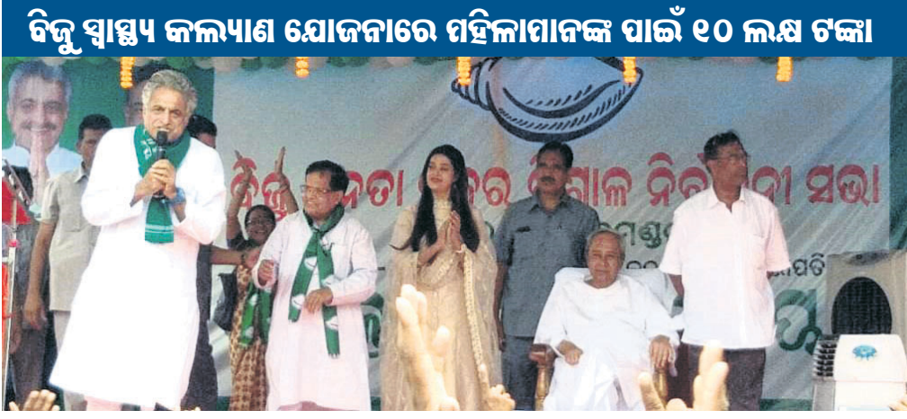
ଦିନୁ ସ୍ୱାସ୍ଥ୍ୟ କଲ୍ୟାଣ ଯୋଜନାରେ ମହିଳାମାନଙ୍କ ପାଇଁ ୧୦ ଲକ୍ଷ ଟଙ୍କା