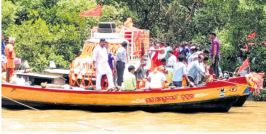
ରାଜନଗର ବ୍ଲକର ବଙ୍ଗୋପସାଗର କୁଳରେ ପୂର୍ବରୁ ପୂଜା ପାଉଥିବା ମା' ପଞ୍ଚୁବରାହାଙ୍କ ମନ୍ଦିର । ତଳା ଯୋଗେ ମା'ଙ୍କୁ ବଗପାଟିଆକୁ ସ୍ଥାନାନ୍ତର କରାଯାଇଛି । (ପାଇଲ ଫଟୋ)