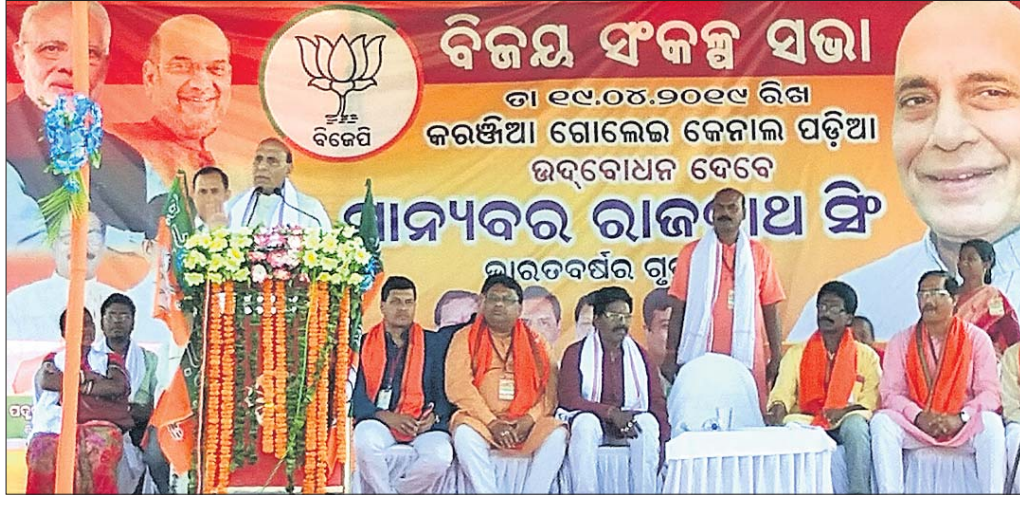
ବିଜୟ ସଂକଳ୍ପ ସଭାରେ କେନ୍ଦ୍ରମନ୍ତ୍ରୀ ରାଜନାଥ ସିଂ ଉଦ୍‌ବୋଧନ ଦେଉଛନ୍ତି।

ପ୍ରଧାନମନ୍ତ୍ରୀ ନରେନ୍ଦ୍ର ମୋଦିଙ୍କ ନେତୃତ୍ୱରେ ଭାରତ ଅଧିକ ଶକ୍ତିଶାଳୀ ହୋଇପାରିଛି। ପୁଲଫୁଲରେ ୪୨ ଜଣ ଯବାନଙ୍କୁ ଆକ୍ରମଣ କରାଯିବାର ୧୩ ଦିନ ମଧ୍ୟରେ ଦେଶର ବାୟୁସେନା ଯବାନମାନେ ପାକିସ୍ତାନ ସୀମା ମଧ୍ୟରେ ପଶି ଆତଙ୍କବାଦୀଙ୍କୁ ନିପାତ କରିପାରିଛନ୍ତି। ୨୦୩୦ ବେଳକୁ ଭାରତ ବିଶ୍ୱର ତୃତୀୟ ଶକ୍ତିଶାଳୀ ଦେଶରେ ପରିଣତ ହୋଇପାରିବ। ଭାଜପା ପୁନର୍ବାର କ୍ଷମତାକୁ ଆସିଲେ ଦେଶକୁ ଅଧିକ ଶକ୍ତିଶାଳୀ କରିବା ସହ ବିକାଶ ପଥରେ ଆଗେଇନେବ। ରେଳ ମାନଚିତ୍ରକୁ ବାଦ ପଡିଥିବା କରଞ୍ଜିଆ ଭଳି ଅଞ୍ଚଳରେ ରେଳ ବିକାଶକୁ ପ୍ରାଥମିକତା ଦିଆଯିବ। କରଞ୍ଜିଆକୁ ରେଳପଥରେ କଲିକତା ଓ ବନ୍ଦେ ସହିତ ସଂଯୋଗ କରାଯିବ ବୋଲି ଶୁକ୍ରବାର କରଞ୍ଜିଆ ରୋଲେଇ କେନାଲ ପଡିଆଠାରେ ଭାଜପା ପକ୍ଷରୁ ଆୟୋଜିତ ବିଜୟ ସଂକଳ୍ପ ସଭାରେ ଯୋଗଦେଇ କେନ୍ଦ୍ର ଗୃହ ମନ୍ତ୍ରୀ ରାଜନାଥ ସିଂ କହିଛନ୍ତି। କେନ୍ଦ୍ରରେ ଲୋକ ସଭା ନିର୍ବାଚନ ମଞ୍ଚଳୀ ଅନ୍ତର୍ଗତ ମୟୂରଭଞ୍ଜ ଜିଲାର କରଞ୍ଜିଆ ବିଧାନସଭା କ୍ଷେତ୍ରପାଇଁ ଆସନ୍ତା ୨୩ ତାରିଖ ତୃତୀୟ ପର୍ଯ୍ୟାୟରେ ନିର୍ବାଚନ ହେଉଛି। ଏଥିଲାଗି ଭାଜପା ପ୍ରଚାର