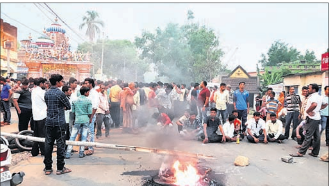
ଟାୟାର ଜାଳି ରାସ୍ତାରୋକ୍ତ କରାଯାଇଛି ।