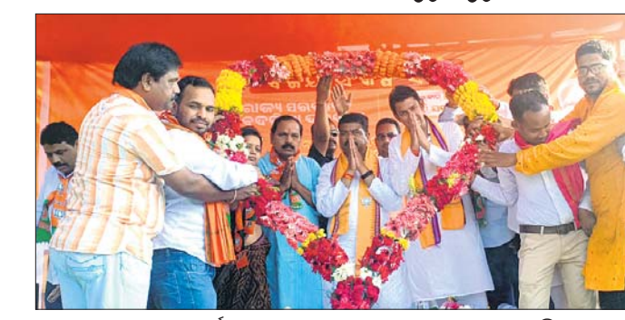
କେନ୍ଦ୍ରମନ୍ତ୍ରୀ ଧର୍ମେନ୍ଦ୍ର ପ୍ରଧାନଙ୍କୁ ଫୁଲହାର ଦେଇ ସାଗତ କରାଯାଇଛି।