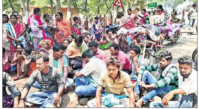
ମୃତଦେହ ଉଠାଇ କୋଳେ ରାସ୍ତାରେକୋ କରିଛନ୍ତି।

ନବରଞ୍ଜପୁର ଜିଲା ପାପଡ଼ାହାଣ୍ଡି ବ୍ଲକ ଖୁରୁବାଇ ପଞ୍ଚାୟତ ଛାଲିପେଟା ଗ୍ରାମରେ ଗୁରୁବାର ଅପରାହ୍ନରେ ବିଦ୍ୟୁତ୍ ଖୁଣ୍ଟରେ ଚଢି ଚାରି ମରାମତି ସମୟରେ ବିଦ୍ୟୁତ୍ ଆଘାତରେ ମନ କାଟିକି ମୃତ୍ୟୁ ହୋଇଥିଲା। କିନ୍ତୁ ତୁରନ୍ତ ବିଦ୍ୟୁତ୍ ବିଭାଗର କୌଣସି କର୍ମଚାରୀ ଘଟଣାସ୍ଥଳରେ ପହଞ୍ଚି ନ ଥିଲେ। ଏହାକୁ ନେଇ ଉଦ୍‌ବେଗୀ ଦେଖା ଦେଇଥିଲା। ଘଟଣାସ୍ଥଳରେ କୋଡିଜା ପୋଲିସ୍