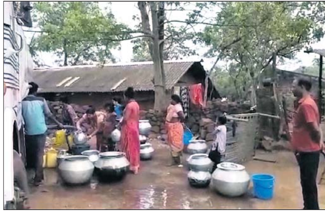
ଗ୍ରାମବାସୀ ଟ୍ୟାଙ୍କରକୁ ପାଣି ନେଉଛନ୍ତି ।

ଟାଟା କମ୍ପାନୀ ଖଣି ସଂଲଗ୍ନ ମାଲକେଡ଼ିଆ ବସ୍ତିରେ ଗଭୀର ନଳକୂପ ଶୁଖିବାରେ ଲାଗିଛି । ଏକଲକ୍ଷିତରେ ଖଣି କର୍ତ୍ତୃପକ୍ଷ ଗ୍ରାମରେ ଟ୍ୟାଙ୍କର ଯୋଗେ ପାଣି ଯୋଗାଣ କରୁଛନ୍ତି । କିନ୍ତୁ ଅଧିକାଂଶ ସମୟରେ ଟ୍ୟାଙ୍କରରେ ଲୋହଯୁକ୍ତ ବୋଲିଆ ପାଣି ବାହାରୁଛି । ଯାହାକି ପାନୀୟ ଉପଯୋଗୀ ହେଉ ନାହିଁ । ଫଳରେ ଗ୍ରାମବାସୀ ସ୍ୱଳ୍ପ ପାନୀୟ ଜଳ ପାଇଁ ନାହିଁ ନ ଥିବା ଅସୁବିଧାର ସମ୍ମୁଖୀନ ହେଉଛନ୍ତି । ଏହାକୁ ନେଇ ଶୁକ୍ରବାର ଗ୍ରାମର ମହିଳା ଓ ପୁରୁଷ ଟ୍ୟାଙ୍କର ଭ୍ରାଉଭରଙ୍କୁ କିଛି ସମୟ ଅଟକ ରଖି ଚାରିବୁ କରିଥିବା ଜଣାପଡ଼ିଛି ।