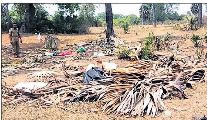
ଷଷ୍ଠ ଗାଁର ଘଟଣାସ୍ଥଳରେ ବନ ବିଭାଗର ଜଣେ କର୍ମଚାରୀ।

ବାଳଚେର, ୧୯୪ (ନି.ପ୍ର.) ଏକାବେକେ ୫ ଜୀବନ ନେଇଛି ହାତୀ। ଘର ଭାଙ୍ଗି ଦଳି ମାରିଛି ୪ଜଣଙ୍କୁ। ଖଣ୍ଡ ବିଖଣ୍ଡ କରି ଫୋପାଡ଼ି ଦେଇଛି ଜଣେ ବୁଢ଼ଙ୍କୁ। ଗୁରୁବାର ବିଳମ୍ବିତ ରାତିରେ ଅନୁବୋଧକ ଜିଲା ତାଳଚେର ପୌରାଞ୍ଚଳର ଷଷ୍ଠ ଗାଁ ଓ ନିକଟସ୍ଥ ସରପଡ଼ାରେ ଘଟିଥିବା ଏପରି ଏକ ଅଭାବନୀୟ ଘଟଣା ଘଟୁଛି କରିଦେଇଛି ସମସ୍ତଙ୍କୁ। ଖବରପାଇ ସକାଳୁ ବନ ବିଭାଗ କର୍ମଚାରୀ ଘଟଣାସ୍ଥଳରେ ପହଞ୍ଚି ଉତ୍ତମ ଲୋକଙ୍କୁ ବୁଝାଶୁଝା କରିବା ସହ ସମସ୍ତ ମୃତଦେହ ଉଦ୍ଧାର କରିଛନ୍ତି। ଡେକୋନାଳ ଜିଲା ମହାବିରୋଡ଼ ରେଞ୍ଜରୁ ବ୍ରାହ୍ମଣୀ ନଦୀ ପାର ହୋଇ ଚାଲିଆସିଥିବା ଏକ ଦନ୍ତାହାତୀର ଏପରି ଉଦ୍ଧରକାର୍ଯ୍ୟ