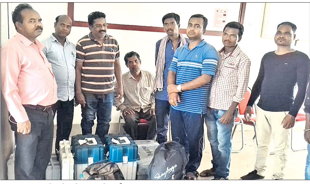
ଜଙ୍ଗଲ ରାସ୍ତାରେ ଚାଲି ଚାଲି ଆସିଥିବା ପୋଲିଂ ପାର୍ଟି।

ଦ୍ଵିତୀୟ ପର୍ଯ୍ୟାୟ ମତଦାନର ଦିନକ ପୂର୍ବରୁ ବୁଧବାର କନ୍ଧମାଳ ଜିଲ୍ଲା ପିରିଲିଆ ବ୍ଲକ୍ ବାରାହାଳାରେ ମାଓବାଦୀମାନେ ଲ୍ୟାଣ୍ଡମାର୍କ ବିଚ୍ଛେଦନ କରିବା ସହ ପୋଲିଂ ଟେକିଂ ପାର୍ଟିର ମେସେଜର ସଂଯୁକ୍ତା ଦିଗାଲକୁ ଗୁଲିକରି ହତ୍ୟା କରିଥିଲେ। ଏହି ଘଟଣା ସାରା ରାଜ୍ୟରେ ଚାଞ୍ଚଳ୍ୟ ଖେଳାଇଥିଲା। ମାଓବାଦୀ ଅଧିକୃତ ଉକ୍ତ ଅଞ୍ଚଳରେ ଶାନ୍ତିଶୃଙ୍ଖଳାରେ ନିର୍ବାଚନ ପରିଚାଳନା ଜିଲ୍ଲା ପ୍ରଶାସନ ପାଇଁ ଚ୍ୟାଲେଞ୍ଜ ହୋଇଥିଲା। ତେବେ ଗୁରୁତ୍ଵର ସେଠାରେ ସୁରୁକ୍ଷରେ ନିର୍ବାଚନ ସରିଥିଲା। ଜୀବନକୁ ବାଣି ଲଗାଇ ପୋଲିଂ ପାର୍ଟି ନିଜ କର୍ତ୍ତବ୍ୟ କରିଥିଲେ। ହେଲେ ସେମାନେ ଅଧିକମାତ୍ର ଯନ୍ତ୍ରଣା ସହିଛନ୍ତି। ମତଦାନ ସମ୍ପର୍କିତ ନଥିବାରୁ, ଭିତ୍ତିତମ୍ ସହ ସୁରକ୍ଷିତ ଭାବେ ଫେରିବା ପାଇଁ ସେମାନଙ୍କୁ ରାତିରେ ଘର ଜଙ୍ଗଲରେ ୧୬ ଘଣ୍ଟା ଚାଲିବାକୁ ପଡ଼ିଲା ବର୍ଷାରେ ଭିଜି ଭିଜି ଶୁକ୍ରବାର ସକାଳେ ପୁଲବାଣୀରେ ଆସି ପହଞ୍ଚିଛନ୍ତି। ପିରିଲିଆ ବ୍ଲକ୍ ଶେଷ ସାମାଜିକ ଥିବା କୋଏରମାଣ୍ଡୁ ପଞ୍ଚାୟତରେ ବାରାହାଳାକୁ ଭଲ ରାସ୍ତା ନାହିଁ। ମତଦାନ ପାଇଁ ସେଠାରେ ଗୋଟିଏ ବୁଥ୍ (ନଂ. ୧୨) ହୋଇଥିଲା। ଦୂରମ ଅଞ୍ଚଳ ହୋଇଥିବାରୁ ୧୬ ଚାରିଶ ସକାଳେ ପୋଲିଂ ଟିମ୍ ଯାଇ ସେଠାରେ ପହଞ୍ଚିଥିଲା। ସେଠାକୁ ପୋଲିଂ ପାର୍ଟି ଟେକିଂ ପାଇଁ ଏକ ଗାଡ଼ିରେ ଯାଉଥିଲେ। ଉକ୍ତ ଗାଡ଼ିରେ ଲୁଚାଏ