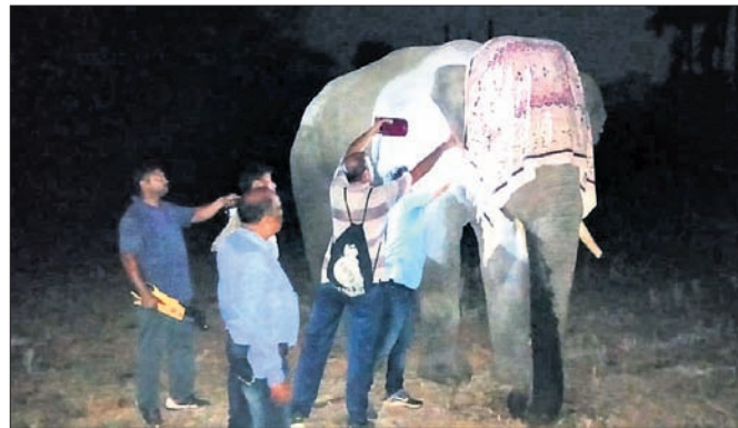
ଗ୍ରାହ୍ୟାଲକ ପରେ ଦନ୍ତାହାତୀର ଦାନ୍ତ କଟାଯାଇଛି।

ଏକାଦଶେକ ୫ ଜୀବନ ନେଇଛି ହାତୀ। ଘର ଭାଙ୍ଗି ଦଳି ମାରିଛି ୪ଜଣଙ୍କୁ। ଖଣ୍ଡ ଖଣ୍ଡ କରି ଫୋପାଡ଼ି ଦେଇଛି କଣେ ବୃକ୍ଷକୁ। ଗୁରୁବାର ବିଳମ୍ବିତ ରାତିରେ ଅନୁଗୋଳ ଜିଲା ତାଳଚେର ପୌରାଞ୍ଚଳର ଷଷ୍ଠ ଗାଁ ଓ ନିକଟସ୍ଥ ସହପଡ଼ାରେ ଘଟିଥିବା ଏପରି ଏକ ଅଭାବନୀୟ ଘଟଣା ଗ୍ରହ କରିଦେଇଛି ସମସ୍ତଙ୍କୁ। ଖବରପାଇ ସକାଳୁ ବନ ବିଭାଗ କର୍ମଚାରୀ ଘଟଣାସ୍ଥଳରେ ପହଞ୍ଚି ଉତ୍ତମ ଲୋକଙ୍କୁ ବୁଝାଶୁଝା କରିବା ସହ ସମସ୍ତ ମୃତଦେହ ଉଦ୍ଧାର କରିଛନ୍ତି। ଢେଙ୍କାନାଳ ଜିଲା ମହାବିରୋଡ଼ ରେଞ୍ଜରୁ