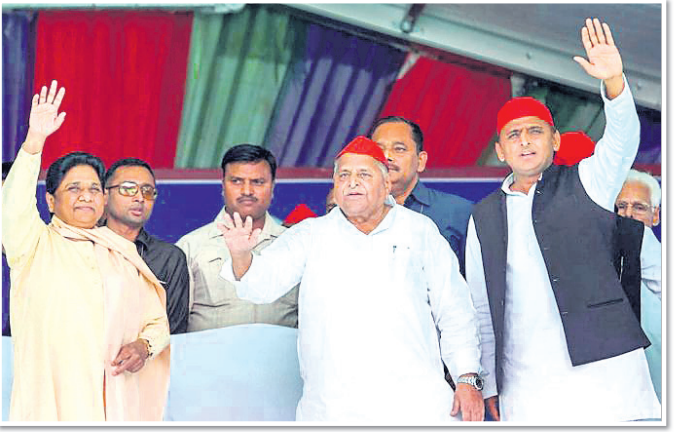
ମୈଦଫୁରା ସଭାରେ ବିଏସପି ସୁପ୍ରିମୋ ମାୟାବତୀଙ୍କ ସହ ଏସପି ପ୍ରତିଷ୍ଠାତା ମୁଲାୟମ ସିଂହ ଯାଦବ ଓ ତାଙ୍କ ମୂର୍ତ୍ତି ତଥା ଦଳର ଅଧ୍ୟକ୍ଷ ଅଶୁକେଶ ଯାଦବ ।

ମୈଦଫୁରା, ୧୯୪୪ (ପି.ଟି.) : ୨୪ ବର୍ଷର ଶତ୍ରୁତାକୁ ଭୁଲି ଗୋଟିଏ ମଞ୍ଚରେ ଏକାଠି ହୋଇଛନ୍ତି ଭଉଁରପ୍ରଦେଶର ବୁଲ ବରିଷ୍ଠ ନେତା ତଥା ପୂର୍ବତନ ମୁଖ୍ୟମନ୍ତ୍ରୀ ମାୟାବତୀ ଓ ମୁଲାୟମ ସିଂହ ଯାଦବ । ବହୁଜନ ସମାଜ ପାର୍ଟି (ବିଏସପି) ସୁପ୍ରିମୋ ମାୟାବତୀ ଓ ସମାଜବାଦୀ ପାର୍ଟି (ଏସପି) ପ୍ରତିଷ୍ଠାତା ମୁଲାୟମ ଶୁକ୍ରବାର ମୈଦଫୁରାର ଏକ ନିର୍ବାଚନ ସଭାରେ ଗୋଟିଏ ମଞ୍ଚରେ ଏକତ୍ରିତ ହେବା ଜାତୀୟ ରାଜନୀତିର ସବୁଠୁ ଚର୍ଚ୍ଚିତ ଘଟଣା ପାଲଟିଛି । ମାୟାବତୀ ପ୍ରଧାନମନ୍ତ୍ରୀ ନରେନ୍ଦ୍ର ମୋଦିଙ୍କୁ 'ନକଲି ନେତା' ବୋଲି ସମାଲୋଚନା କରିବା ସହ ମୁଲାୟମଙ୍କୁ ସଫୁଆ ବର୍ଗର ଜଣେ 'ପ୍ରକୃତ ନେତା' ଭାବେ ଅଭିହିତ କରିଛନ୍ତି । ଏହାସହ ସେ ମୁଲାୟମଙ୍କ ପାଇଁ ଭୋଟ ଭିକ୍ଷା କରିଛନ୍ତି । ଅନ୍ୟପକ୍ଷରେ ମାୟାବତୀଙ୍କ ରଶ କେବେ ଭୁଲି ପାରିବେନାହିଁ ବୋଲି କହି ପ୍ରଶଂସାରେ ତାଙ୍କୁ ପୋତି ଦେଇଛନ୍ତି ୭୯ ବର୍ଷୀୟ ମୁଲାୟମ । ୧୯୯୩ରେ ଏସପି-ବିଏସପି