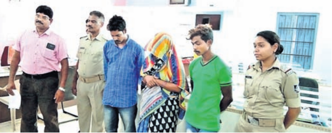
ପୋଲିସ ଅଧିକାରୀଙ୍କ ସହ ଗିରଫ ଅଭିଯୁକ୍ତମାନେ ।

ଯାଜପୁରରୋଡ, ୧୯୫୪(ନି.ପ୍ର.) ଦ୍ରାଘନସୁଗାର କାରବାର ଚଳାଇଥିବା ଜଣେ ମହିଳା ଓ ତାଙ୍କ ୨ ସହଯୋଗୀଙ୍କୁ ଯାଜପୁରରୋଡ ଥାନା ପୋଲିସ ଶୁକ୍ରବାର ପୂର୍ବାହ୍ନ ୯ଟାରେ ଗିରଫ କରିଛି ।