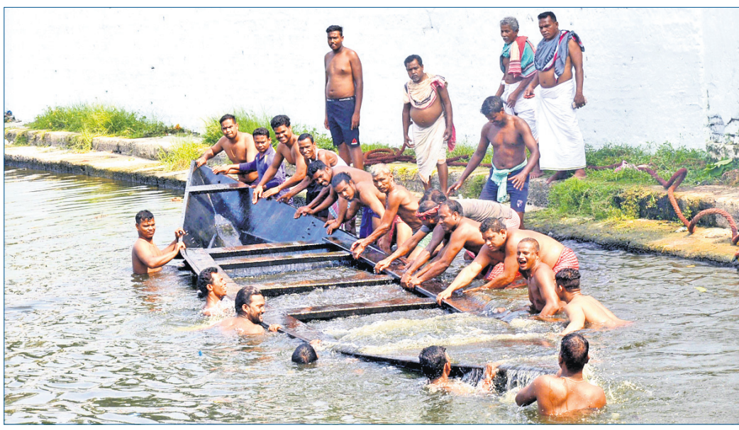
ଶ୍ରୀଜୀଉଙ୍କ ଚନ୍ଦନଯାତ୍ରା ଲାଗି ନରେନ୍ଦ୍ର ପୁଷ୍ପଗଣାରେ ବୁଡ଼ାଇ ରଖାଯାଇଥିବା ତଙ୍ଗାକୁ ଶୁକ୍ରବାର ବାହାର କରାଯାଇଛି ।

ଆଜି, ୧୯୮୪ (ଡି.ଏନ୍.ଏ.) ଅଧୀନରେ ଥିବା ଆଜି ଫରଷ୍ଟ ବିଦ୍ୱ ହାଉସକୁ ଖବର ଦେଇଥିଲେ । ଖବରପାଇ ଫରଷ୍ଟର ଅଭିମୁଖୀ ତରାଇ ଘଟଣାସ୍ଥଳରେ ପହଞ୍ଚି କୁହୀର ମୃତଦେହ ଉଦ୍ଧାର କରି ବିଟ ହାଉସକୁ ନେଇଥିଲେ । କୁହୀରର ମୃତ୍ୟୁର କାରଣ ଜଣାପଡି ନ ଥିବା ବେଳେ ବ୍ୟବହୃତ ପରେ ବିଟ କୁହୀର ମୃତଦେହ ନଦୀରେ ଭାସୁଥିବା ଦେଖି ରାଜନଗର ବନବିଭାଗ