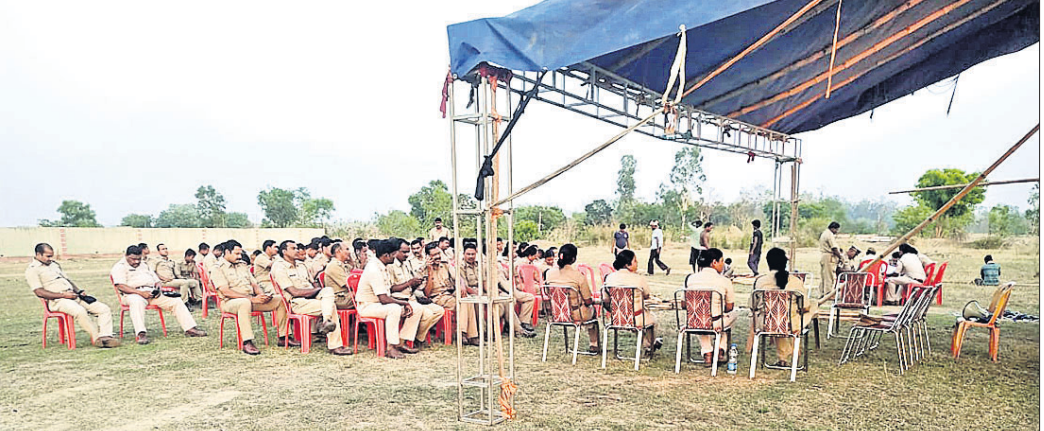
ଛେଡ଼ିପଦାରେ ନିର୍ବାଚନ ସଭା ଆୟୋଜିତ ହେବାକୁ ଥିବା ପଡ଼ିଆରେ ପୋଲିସ୍ ପକ୍ଷରୁ ସୁରକ୍ଷା ବ୍ୟବସ୍ଥା ପ୍ରସ୍ତୁତ କରାଯାଇଛି ।