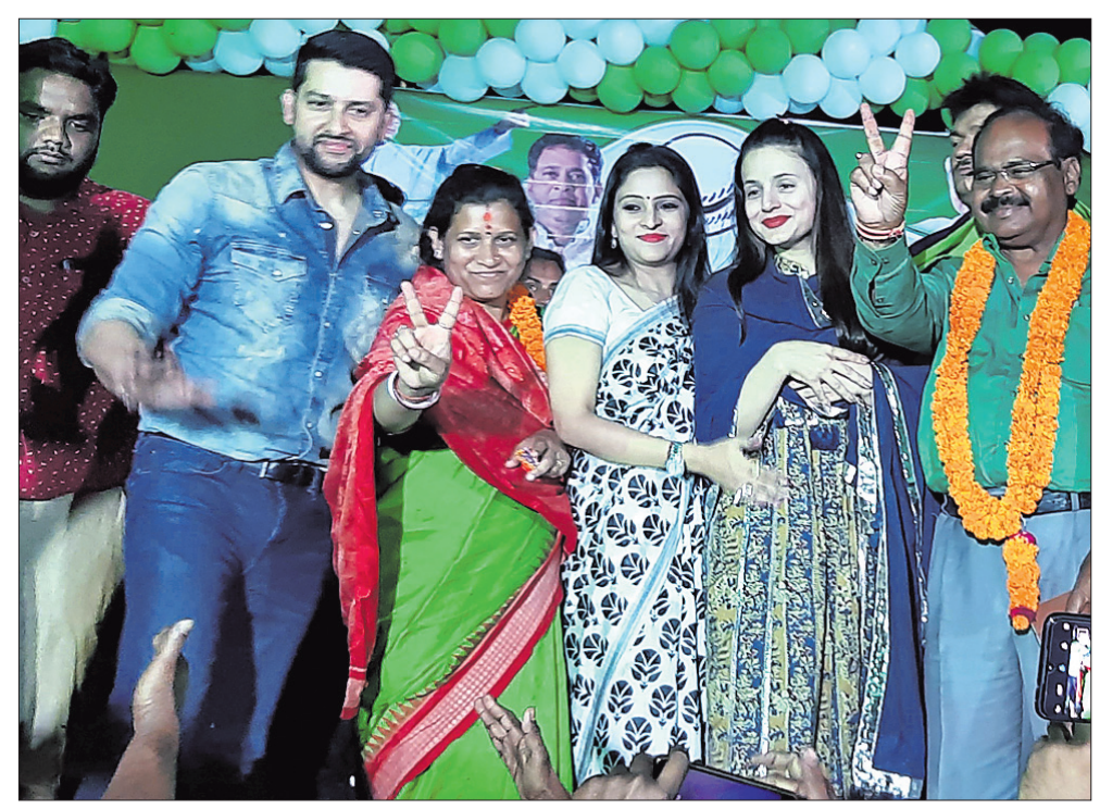
ମାନେଷ୍ୱରରେ ବଲିଉଡ ଷ୍ଟାରମାନେ ବିଜେଡି ପାଇଁ ପ୍ରଚାର କରୁଛନ୍ତି ।