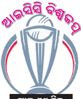
ଆଉ ୩୯ ଦିନ

କ୍ରିକେଟ ବିଶ୍ୱକପର ପ୍ରଥମ ସଂସ୍କରଣ ୧୯୭୪ରେ ଇଂଲଣ୍ଡରେ ଅନୁଷ୍ଠିତ ହୋଇଥିଲା । ଏହାକୁ ଆନୁଷ୍ଠାନିକ ଭାବେ ପ୍ରତ୍ୟେକ ଆଲ୍ କପ୍ କୁହାଯାଉଥିଲା । ଅନ୍ତର୍ଜାତୀୟ କ୍ରିକେଟ କାଉନ୍ସିଲ(ଆଇସିସି) ଆନୁକୂଲ୍ୟରେ ଏହାଥିଲା ପ୍ରଥମ ସର୍ବବୃହତ୍ ସାମିତ ଓଭର କ୍ରିକେଟ ଚୁନାମେଣ୍ଟ । କ୍ରମ ୬ରେ ଏହା ଆରମ୍ଭ ହୋଇ ୨୧ ତାରିଖରେ ଶେଷ ହୋଇଥିଲା ।