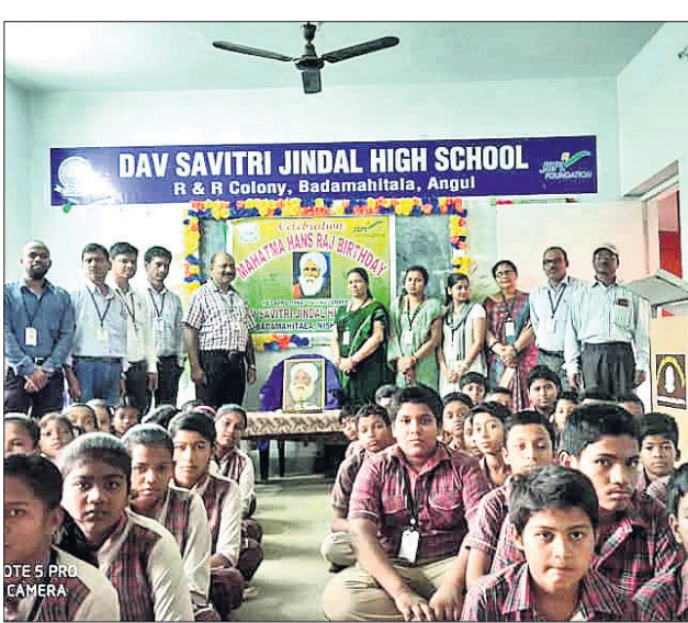
ମହାତ୍ମା ହଂସରାଜଙ୍କ ଜୟନ୍ତୀ ପାଳନ ଅବସରରେ ଶିକ୍ଷୟିତ୍ରୀଶିକ୍ଷକ ଓ ଛାତ୍ରଛାତ୍ରୀମାନେ ।