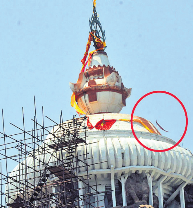
ଶ୍ରୀମନ୍ଦିର ଉପରେ ନାବାଳକ ବାନ୍ଧିଥିବା ଗାଠୁଛା।