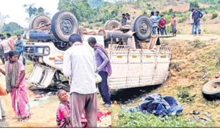
ଓଲଟ ପଡ଼ିଥିବା ୪୦୭ ଗାଡ଼ି।

ପଦ୍ମପୁର/ଗୁଡ଼ାଚା, ୨୧୪ (ଓ.ଏ.ଏ.ଏ) ରାୟଗଡ଼ା ଜିଲ୍ଲା ଗୁଡ଼ାଚା ବ୍ଲକ୍ କିରିଡ଼ି ଗ୍ରାମ ନିକଟ ମାଛବନ୍ଧଠାରେ ରବିବାର ଏକ ବରଯାତ୍ରୀ ଗାଡ଼ି ଦୁର୍ଘଟଣାଗ୍ରସ୍ତ ହୋଇଛି। ଫଳରେ ୨ ଜଣଙ୍କର ମୃତ୍ୟୁ ହୋଇଥିବା ବେଳେ ୩୦ରୁ ଊର୍ଦ୍ଧ୍ୱ ଆହତ ହୋଇଛନ୍ତି। ଆହତମାନଙ୍କୁ ପ୍ରଥମେ ଗୁଡ଼ାଚା ଓ ପଦ୍ମପୁର ହସ୍ପିଟାଲରେ ଭର୍ତ୍ତି କରାଯାଇଥିଲା। ପରେ ରୁଗ୍‌ପୁର ଓ ବ୍ରହ୍ମପୁର ମେଡିକାଲକୁ ସ୍ଥାନାନ୍ତର କରାଯାଇଛି। ମୃତକମାନେ ପୃଷ୍ଠା-୪