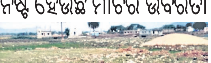
ଏଗେତେଗେ ପଡିଥିବା ଅଳ୍ପ ଆବକାଶ ।

ମାଲକାନଗିରି, ୨୧.୪ (ଡି.ଏନ୍.ଏ.) ଯୋଗ୍ୟ ବିଶ୍ୱ ଧରିତ୍ରୀ ଦିବସ । ଏହି ଦିବସରେ ସରକାରୀ ସଂସ୍ଥା ଓ ବେସରକାରୀ ସଂସ୍ଥା ସହାୟତା, ଶୋଭାଯାତ୍ରା, ପ୍ରତିଯୋଗିତା ହେବ । ବର୍ତ୍ତମାନ ଧରିତ୍ରୀ ଦିବସର ଗାୟିଥି ସମ୍ପର୍କରେ ସେମାନଙ୍କ ମତ ରଖିବେ । ମାତ୍ର ଚା'ପରିବନ ଏସକ୍ସୁ ଗୁଲିୟିବେ । ଏବେ ମାଟିର ଉର୍ବରତା ନଷ୍ଟ ହେବାରେ ଲାଗିଛି । ମଣିଷ ନିଜେ ବଞ୍ଚିବା ପାଇଁ ଖାଦ୍ୟ ଉତ୍ପାଦନକୁ ବୃଦ୍ଧି କରିବାଲାଗି ଫସଲରେ ବିଜିନି ରାସାୟନିକ ପଦାର୍ଥ, ରାସାୟନିକ ସାର, କୀଟନାଶକ ଔଷଧ ପ୍ରୟୋଗ କରୁଛି । ଏହାଦ୍ୱାରା ମାଟିର ଉର୍ବରତା ନଷ୍ଟ ହେଉଛି । ଅନ୍ୟପକ୍ଷରେ ବର୍ଷାବହୁ ଯଥା କରି, ଅବକାରୀ ପୃଷ୍ଠିକ ସାମଗ୍ରୀ, ମାଟିରେ ପକାଇବା ବାବା ମାଟିର ଉର୍ବରତା ମଧ୍ୟ ନଷ୍ଟ ହେଉଛି । ଏହି ସବୁ ପଦାର୍ଥ ମାଟିରେ ମିଶି ରାସାୟନିକ ପ୍ରକ୍ରିୟାରେ ଶହ ଶହ କୀଟନାଶକ କୀଟ ଜନ୍ମ ନେଇ ମାଟିକୁ ନଷ୍ଟ କରୁଛି । ସେଥିରୁ ଉତ୍ପାଦିତ ହେଉଥିବା ଖାଦ୍ୟାବଶ୍ୟକରେ ପୃଷ୍ଠିକର ହୋଇପାରୁନାହିଁ । ଏହି ଖାଦ୍ୟ ଶସ୍ୟ ଖାଇ ଏବେ ପ୍ରତ୍ୟେକ ବ୍ୟକ୍ତି ବିଜିନି ରୋଗରେ ଆକ୍ରାନ୍ତ ହେଉଛନ୍ତି । ସରକାର ସ୍ତୁଳ ପରିବେଶ, ସ୍ତୁଳ ମୂଳିକାର ସୁରକ୍ଷା ପାଇଁ ବିଜିନି ଯୋଜନା କରୁଥିଲେ ମଧ୍ୟ ମଣିଷ ସବୁ ଜାଣି ମଧ୍ୟ ମାଟିକୁ ବୁଲୁଛନ୍ତି ବେହେରା । ଦିନକୁ ଦିନ ମାଟିର ସୁଖାମୃତକାମ ସମ୍ପଦ ହୋଇ ଏହାର ପ୍ରଭାବ ପରିବେଶ ଉପରେ ଗଭୀର ଭାବେ ପଡୁଛି । ମାଟିର ସୁରକ୍ଷା ପ୍ରତି ମଣିଷ ସଚ୍ଚାଳ ନ ହୁଏ ଆଗାମୀ ଦିନରେ ପୃଥିବୀ ପୃଷ୍ଠରେ ବସବାସ କରୁଥିବା ଜୀବଜଗତ ଓ ପ୍ରାଣୀଜଗତ ବିପଦ ସୃଷ୍ଟି ହେବ । ବେଳ ହୁଏ ସମସ୍ତେ ସାଧାରଣ ହୋଇ ଧରିତ୍ରୀ ପ୍ରତି, ମାଟି ପ୍ରତି କରାଯାଉଥିବା ଅନ୍ୟାୟକୁ ନିବୃତ୍ତ ରହିବା ଆବଶ୍ୟକ ବୋଲି ମତ ପ୍ରକାଶ ପାରିଛି ।