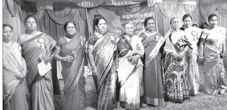
ଅଗ୍ରଗାମିନୀର ବାର୍ଷିକୋତ୍ସବରେ ମଞ୍ଚରେ ଉପସ୍ଥିତ କର୍ମକର୍ତ୍ତା।

ସାମାଜିକ ଓ ସଂସ୍କୃତିକ ମହିଳା ସଂଗଠନ ଅଗ୍ରଗାମିନୀର ବାର୍ଷିକୋତ୍ସବ ଓ ସ୍ମରଣିକା ଉଦ୍ଘୋଷନ ସମାରୋହ ଅନୁଷ୍ଠିତ ହୋଇଛି।