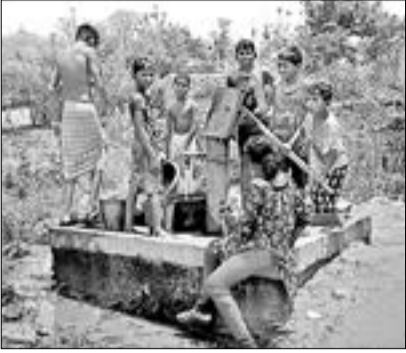
ପଢ଼ାବାସୀ ନିଜ ଗାଁରେ ଉପଖଣ୍ଡର ମଞ୍ଜୁଲିକ ପୁରିଆ ସୁଯୋଗରୁ ବର୍ଚ୍ଚତ୍ ୨ ପଢ଼ାବାସୀ ପଢ଼ିବାକୁ ସୁଯୋଗ ମିଳିଥିଲା।

କେନ୍ଦୁଝର ଉପଖଣ୍ଡର ମଞ୍ଜୁଲିକ ପୁରିଆ ସୁଯୋଗରୁ ବର୍ଚ୍ଚତ୍ ୨ ପଢ଼ାବାସୀ ପଢ଼ିବାକୁ ସୁଯୋଗ ମିଳିଥିଲା। ଉପଖଣ୍ଡର ମଞ୍ଜୁଲିକ ପୁରିଆ ସୁଯୋଗରୁ ବର୍ଚ୍ଚତ୍ ୨ ପଢ଼ାବାସୀ ପଢ଼ିବାକୁ ସୁଯୋଗ ମିଳିଥିଲା।