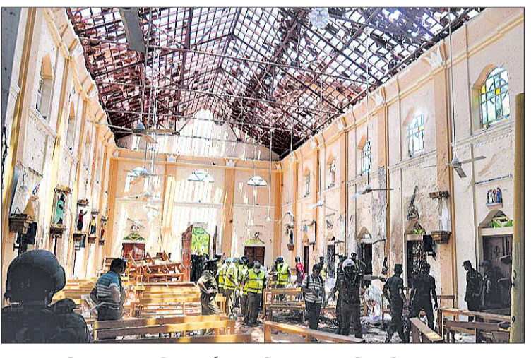
ନେଗୋସୋସ୍ଥିତ ସେକ୍ସ ସେବାସ୍ଥାନ ଚର୍ଚ୍ଚିଆତଙ୍କବାଦୀ ଦ୍ୱାରା ଆକ୍ରମଣ ହୋଇଥିଲା।