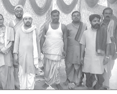
ହନୁମାନ ଶକ୍ତି ଜାଗରଣ ମହାଯଜ୍ଞ ଅବସରରେ ଉପସ୍ଥିତ ବ୍ୟକ୍ତି।