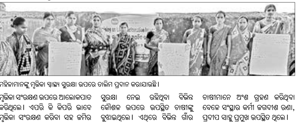
ମହିଳାମାନଙ୍କୁ ମୃତ୍ତିକା ସ୍ୱାସ୍ଥ୍ୟ ସୁରକ୍ଷା ଉପରେ ତାଲିମ ପ୍ରଦାନ କରାଯାଇଛି।

କଳାହାଣ୍ଡି ଜିଲ୍ଲା କର୍ମାଂଗୁଣୀ ବୁକ୍ ଯୋଗାଡ଼କ୍ଷେତ୍ର ପଞ୍ଚାୟତ ଚେରାପଲ୍ଲୀରେ ଉନ୍ମୋଚନ କରାଯାଇଛି। କଳାହାଣ୍ଡି ଜିଲ୍ଲା କର୍ମାଂଗୁଣୀ ବୁକ୍ ଯୋଗାଡ଼କ୍ଷେତ୍ର ପଞ୍ଚାୟତ ଚେରାପଲ୍ଲୀରେ ଉନ୍ମୋଚନ କରାଯାଇଛି।