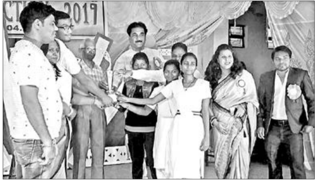
ଅତିଥିମାନେ କୃତୀ ଜାତୀୟ ସମ୍ମିଳନୀ ଉଦ୍‌ଯାପିତ କରୁଛନ୍ତି।

କଳାହାଣ୍ଡି ଉପଖଣ୍ଡର ମହିଳା ଉଦ୍ଧାର କର୍ମୀମାନେ ୨ ଶିଶୁ ସହ ମହିଳା ଉଦ୍ଧାର କରିଥିଲେ। ଉପଖଣ୍ଡର ମହିଳା ଉଦ୍ଧାର କର୍ମୀମାନେ ୨ ଶିଶୁ ସହ ମହିଳା ଉଦ୍ଧାର କରିଥିଲେ।