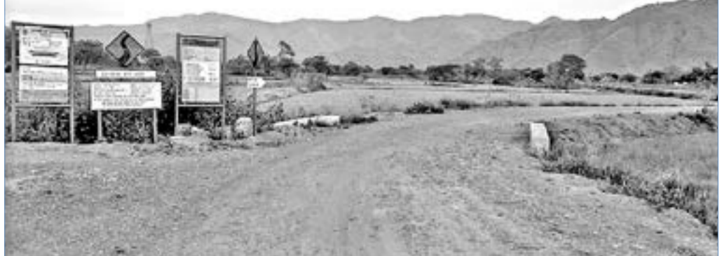
ବୀସିଗାଁ-ପଦମପୁର ପ୍ରଧାନମନ୍ତ୍ରୀ ଗ୍ରାମ ସଡ଼କ ରାସ୍ତା ।

ମଧ୍ୟରେ ଅସନ୍ତୋଷ ଦେଖାଦେଇଛି। ମଧ୍ୟରେ ଅସନ୍ତୋଷ ଦେଖାଦେଇଛି। ମଧ୍ୟରେ ଅସନ୍ତୋଷ ଦେଖାଦେଇଛି।