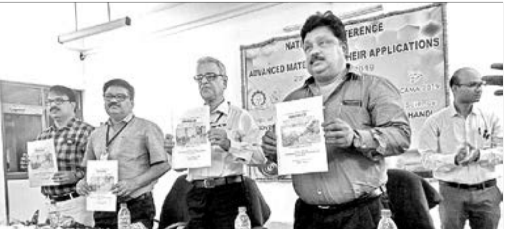
ଜାତୀୟ ସମ୍ମିଳନୀ ଅବସରରେ ଅତିଥିମାନେ ଏକ ସ୍ମରଣୀକା ଉନ୍ମୋଚନ କରୁଛନ୍ତି।

ଭବାନୀପାଟଣାରେ ୨ ଦିନିଆ ଜାତୀୟ ସମ୍ମିଳନୀ ଉଦ୍‌ଯାପିତ ହୋଇଛି। ଭବାନୀପାଟଣାରେ ୨ ଦିନିଆ ଜାତୀୟ ସମ୍ମିଳନୀ ଉଦ୍‌ଯାପିତ ହୋଇଛି।