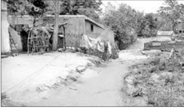
ପଢ଼ାବାସୀ ନିଜ ଗାଁରେ ଉପଖଣ୍ଡର ମଞ୍ଜୁଲିକ ପୁରିଆ ସୁଯୋଗରୁ ବର୍ଚ୍ଚତ୍ ୨ ପଢ଼ାବାସୀ ପଢ଼ିବାକୁ ସୁଯୋଗ ମିଳିଥିଲା।

କାହାକୁ ସୁଯୋଗ ପାଇଁ ସଂଯୋଗ ନାହିଁ ତାହା ପ୍ରକଟ ହୋଇଛି। ପଢ଼ାବାସୀ ନିଜ ଗାଁରେ ଉପଖଣ୍ଡର ମଞ୍ଜୁଲିକ ପୁରିଆ ସୁଯୋଗରୁ ବର୍ଚ୍ଚତ୍ ୨ ପଢ଼ାବାସୀ ପଢ଼ିବାକୁ ସୁଯୋଗ ମିଳିଥିଲା।