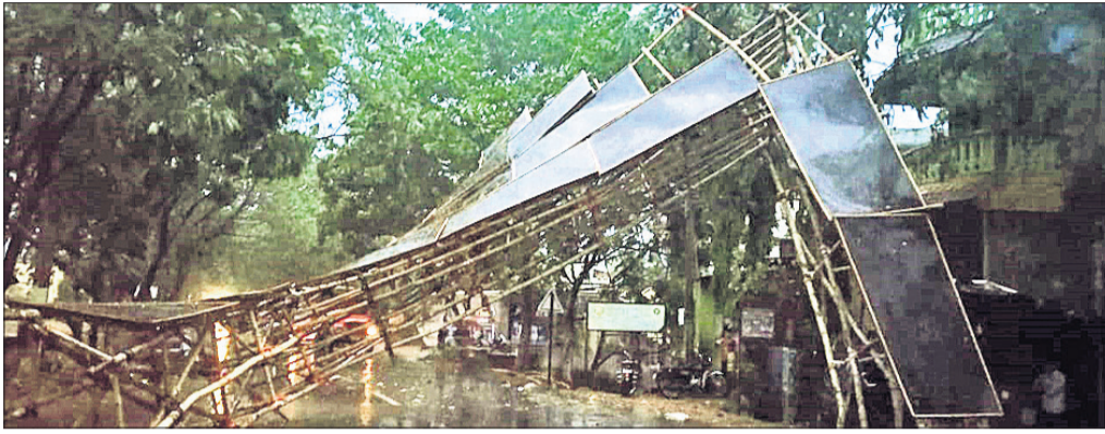
ଦଶପଲାଠାରେ ଲଙ୍କାପୋଡ଼ି ନିମନ୍ତେ ନିର୍ମାଣ ହୋଇଥିବା ଚୋରଣ ଭାଙ୍ଗିପଡ଼ିଛି ।

ରାଜ୍ୟରେ ହାସ ପାଇଛି ତାପମାତ୍ରା । ରବିବାର ସବୁ ଜିଲାରେ ପାରବ ୪୦ଡିଗ୍ରୀ ତଳକୁ ଖସି ଆସିଛି । ତାପମାତ୍ରା ହାସ ପାଇବାକୁ ଲୋକେ ଚାଟିରୁ ପୂଜି ପାଇଛନ୍ତି, କିନ୍ତୁ ସେପଟେ କାଳବୈଶାଖୀ ସମସ୍ତଙ୍କୁ ଡରାଇ ଦେଇଛି । ସନ୍ଧ୍ୟାରେ ରାଜ୍ୟର ଅନେକ ଜିଲାରେ କାଳବୈଶାଖୀ ଚାଣ୍ଡବ ରଚିଛି । ପ୍ରବଳ ବର୍ଷା ସହିତ ଝଡ଼ତୋଫାନ ଓ ବଜ୍ରପାତ ଲୋକଙ୍କୁ ଭୟଭୀତ କରିଦେଇଥିଲା ।