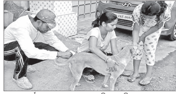
ପୁରୀ ଫୋର୍ସ ପକ୍ଷରୁ ଛୁଇଁ ଛୁଇଁର ମଦ୍ ନିଆଯାଇଛି।