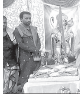
ହନୁମାନ ଶକ୍ତି ଜାଗରଣ ମହାଯଜ୍ଞ ଅବସରରେ ଉପସ୍ଥିତ ବ୍ୟକ୍ତି।

ପଢ଼ିଆବାହାଲ, ୨୧ (୪/୯/୧୯) ଏପ୍ରିଲ ୨୩ ତାରିଖ ତୁଟୀୟ ପର୍ଯ୍ୟାୟରେ ସମ୍ବଲପୁର ଲୋକ ସଭା ଓ ଏହା ଅଧୀନ ୧ ବିଧାନସଭା କ୍ଷେତ୍ର ପାଇଁ ନିର୍ବାଚନ ହେବ। ଏଥିପାଇଁ ଲିଲା ପ୍ରଶାସନ ପକ୍ଷରୁ ପ୍ରସ୍ତୁତ ଶେଷ ହୋଇଛି। ରବିବାର ପୋଲିଂ