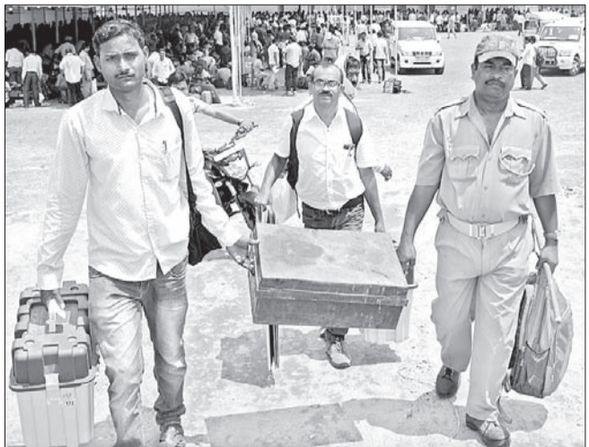
ସମ୍ବଲପୁର ମହିଳା କଲେକ ପଢ଼ିଆରୁ ପୋଲିଂ କର୍ମଚାରୀମାନେ ମତଦାନ କେନ୍ଦ୍ରକୁ ଯାଇଛନ୍ତି।