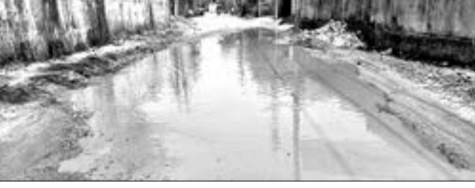
ସିଟି ସ୍କୁଲ ରାସ୍ତାରେ ପାଣି ଜମା ହୋଇ ରହିଛି।

ଧର୍ମଗଡ଼ ସହରର ଉଚ୍ଚ ମଧ୍ୟମ ଶିକ୍ଷା କେନ୍ଦ୍ରର ଆଗରୁ ଜମୁଥିବା ଆଣ୍ଡୁଏ ପାଣିର ମରାମତି କରାଯାଇଛି। ଧର୍ମଗଡ଼ ସହରର ଉଚ୍ଚ ମଧ୍ୟମ ଶିକ୍ଷା କେନ୍ଦ୍ରର ଆଗରୁ ଜମୁଥିବା ଆଣ୍ଡୁଏ ପାଣିର ମରାମତି କରାଯାଇଛି।