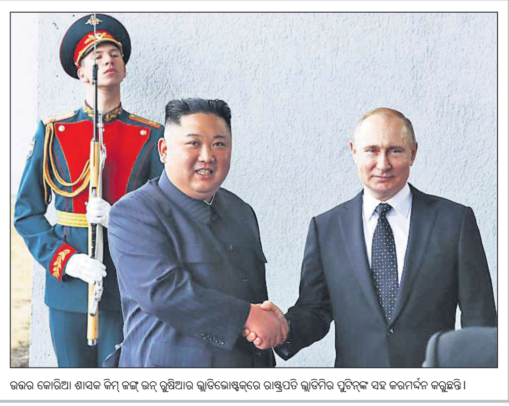
ଉତ୍ତର କୋରିଆ ଶାସକ କିମ୍ ଜଙ୍ଗ୍ ଉନ୍ ରୁଷିଆର ଭୂତଭୋଷ୍ଟକରେ ରାଷ୍ଟ୍ରପତି ଭୂତମିର ପୁଟିନ୍ଙ୍କ ସହ କରମର୍ଦ୍ଦନ କରୁଛନ୍ତି।

ମଧ୍ୟପ୍ରଦେଶ ମୁଖ୍ୟମନ୍ତ୍ରୀ କମଳନାଥଙ୍କ ନିଜ ଜିଲ୍ଲା ଛିଦ୍ଦଫାରେ ଭାଜପା ଉପସଭାପତି ଶିବରାଜ୍ୟ ସିଂ ଶୈହାନ୍ଙ୍କ ହେଲିକପ୍ଟର ଅବତରଣ କରିବାକୁ ଜିଲ୍ଲାପାଳ ଅନୁମତି ନ ଦେବାକୁ ସେ ଖୁବ୍ ରାଗିଯାଇଥିଲେ। ଜିଲ୍ଲାପାଳଙ୍କ ଦବଳ ଲାଗି ସେ ନିର୍ବାଚନ କମିଶନଙ୍କ ପାଖରେ ଦାବି କରିଛନ୍ତି। ଅନ୍ୟପକ୍ଷରେ ସେ ଜିଲ୍ଲାପାଳଙ୍କୁ ଧମକ ଦେଇଥିବା କଂଗ୍ରେସ ଅଭିଯୋଗ କରିଛି। ବୁଧବାର ରାତିରେ ଶିବରାଜ୍ୟର ଉପସଭାରେ ପ୍ରକାଶ କରିବା ଜରୁରୀ। ଅପରାହ୍ଣ ୫ଟା ପରେ ତାଙ୍କ ହେଲିକପ୍ଟର ଅବତରଣ ଚାହୁଁଥିବାବେଳେ ଏଥିପାଇଁ ଜିଲ୍ଲାପାଳ ଅନୁମତି ଦେଇ ନ ଥିଲେ।