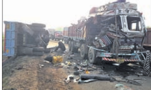
ଟ୍ରକ୍ - ଡମ୍ପର ମୁହାଁମୁହିଁ ଧକ୍କା ।

କେନ୍ଦୁଝର ଜିଲ୍ଲା ଯୋଡା ଥାନା ବିଲେଇପଦା ଫାଣ୍ଡି ଅନ୍ତର୍ଗତ ଲହଣ୍ଡା ଓଜନ କଣ୍ଠା ନିକଟ ରାସ୍ତାରେ ଗୁରୁବାର ଟ୍ରକ୍ ଓ ଡମ୍ପର ମୁହାଁମୁହିଁ ଧକ୍କା ହେବାରୁ ଡ୍ରାଇଭର ଓ ହେଲପର ଅକ୍ଷକେ ବଢ଼ି ଯାଇଥିବା ଖବର ହସ୍ତଗତ ହୋଇଛି । ଗୁରୁବାର ଭୋର ପ୍ରାୟ ସାଢ଼େ ୫ଟାରେ ଏକ ଡମ୍ପର ନଂ ୭୫୫୧୧୪ ଆର ୬୮୮୮୮ ଖଣ୍ଡବନ୍ଧୁ ଛତ୍ର ଏକ ଖଣିରୁ ଲୁହାପଥର ପଥରଟି ଓଲଟି ପଡ଼ିଥିଲା । ଏହି ବୋହେଇ କରି ବିଲେଇପଦାସ୍ଥିତ ଚାଟାସଞ୍ଜି କାରଖାନା ଅଭିମୁଖେ ଯାଉଥିବା ବେଳେ ବିପରୀତ ଦିଗରୁ ଆସୁଥିବା ୧୨ ଚକିଆ ଟ୍ରକ୍ ସହ