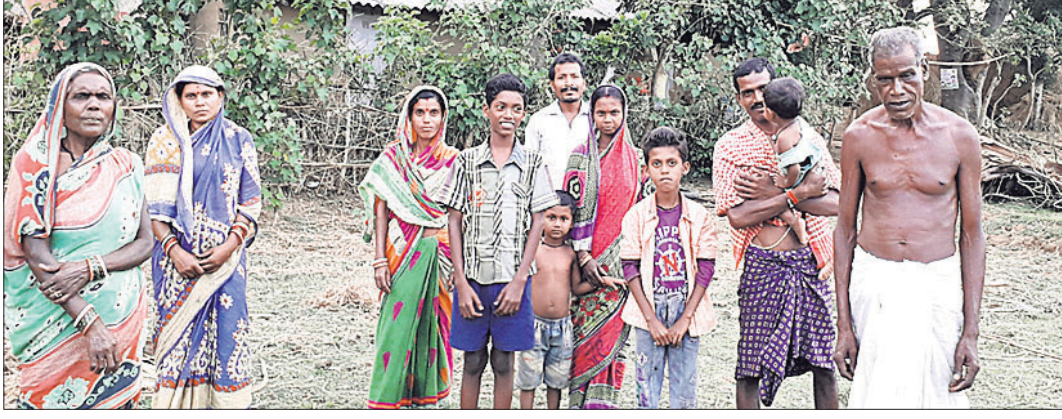
ଭୋଟ ବର୍ଜନ ନିଷ୍ପତ୍ତି ନେବା ଅବସରରେ ଗ୍ରାମବାସୀ ।

ଓପିପା, ୨୫।୪(ଡି.ଏନ.ଏ.)- ବାଲେଶ୍ୱର ଜିଲ୍ଲା ଓପିପା ବ୍ଲକ ସଦର ତଳକିଆ ପଞ୍ଚାୟତର ତଳକିଆ ରାଜସ୍ୱ ଗ୍ରାମର ଏକ ଅବହେଳିତ ଉପଗ୍ରାମ ମଙ୍ଗଳପଡ଼ା । ଗାଁକୁ ରାସ୍ତା ନ ଥିବାରୁ ଗ୍ରାମବାସୀଙ୍କୁ ବିଲ୍ ହିଡ଼ି ରାସ୍ତାରେ ପାଖାପାଖି ୩ କି.ମି. ଆସିବା ପରେ ପହଞ୍ଚି ଓପିପାରେ । ଗାଁକୁ ଆସୁଥିବା କିମ୍ବା ଦେବାକୁ ଯାଇପାରେନି । ପିଲାମାନେ ମଧ୍ୟ ଧାନବିଲ୍ ହିଡ଼ି ଦେଇ ନିକଟସ୍ଥ ସ୍କୁଲକୁ ପଢ଼ିବାକୁ ଯାଆନ୍ତି । ଅଧିକ ବର୍ଷା ବେଳେ ନିକଟସ୍ଥ ସାହାଡ଼ୁରୁ ପାଣି ଆସି ବନ୍ୟା ପରିସ୍ଥିତି ସୃଷ୍ଟି କଲେ ପିଲାଙ୍କ ସ୍କୁଲ ଯିବା ବନ୍ଦ ହୋଇଯାଏ । ସାରା ଗାଁ ଏକପ୍ରକାର ଜଳବନ୍ୟା ହୋଇ ରହିଥାଏ । ଏ ସମ୍ପର୍କରେ ଗ୍ରାମବାସୀ ପ୍ରଶ୍ନାବନର ବାରମ୍ବାର ଦୃଷ୍ଟି ଆକର୍ଷଣ କରି ନ୍ୟାୟ ପାଇ ନ ଥିବାରୁ ଏଥର ଭୋଟ ବର୍ଜନ କରିବାକୁ ନିଷ୍ପତ୍ତି ନେଇଥିବା ପ୍ରକାଶ କରିଛନ୍ତି । ମଙ୍ଗଳପଡ଼ା ଗ୍ରାମରେ ହରିଜନ ସମ୍ପ୍ରଦାୟର ଲୋକେ ବସବାସ କରୁଛନ୍ତି । ଲୋକସଂଖ୍ୟା ପ୍ରାୟ ୪୦ । ଗାଁକୁ ବାହାରିବାକୁ