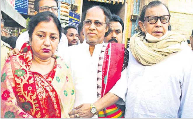
ଶ୍ରୀମନ୍ଦିରରେ ମହାପ୍ରଭୁଙ୍କୁ ଦର୍ଶନ କରି ମିଥୁନ ଚକ୍ରବର୍ତ୍ତୀ ଓ ତାଙ୍କ ସମ୍ପର୍କୀୟ ଫେରୁଛନ୍ତି ।