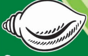
ବିଜୁ ଜନତା ଦଳ