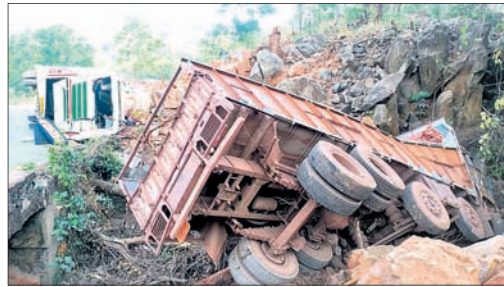
ଓଲଟିଥିବା ଯାତ୍ରାବାହୀ ବସ୍