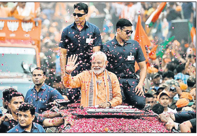
କରିଛି। ରୋଡ୍ ଶୋ'କୁ ଏକତ୍ର ଏକତ୍ର କରିବା ପାଇଁ କୁହାଯାଇଛି। ପ୍ରଧାନମନ୍ତ୍ରୀ ମୋଦି ବିହାରର ଦରଭଙ୍ଗା ଓ ଉତ୍ତରପ୍ରଦେଶର ବନ୍ଧାରେ ନିର୍ବାଚନୀ ସଭାକୁ ସମୋ୍ଥନ କରିବା ପରେ ଅପରାହ୍ଣ ୫ଟାରେ ମିହିରନଗରୀ

ଭାରତର ୫୪୩ ଲୋକ ସଭା ଆସନରେ ନିର୍ବାଚନ ହେଉଥିବାବେଳେ ଦେଶବାସୀଙ୍କ ସର୍ବାଧିକ ନକର କେନ୍ଦ୍ରୀୟ ହୋଇ ରହିଛି ପ୍ରଧାନମନ୍ତ୍ରୀ ନରେନ୍ଦ୍ର ମୋଦିଙ୍କ ସଂସଦୀୟ ଆସନ ବାରାଣସୀ ଉପରେ। ମେ ୧୯ରେ ସପ୍ତମ ତଥା ଅକ୍ଷୟ ପର୍ଯ୍ୟାୟ ନିର୍ବାଚନ ହେବାକୁ ଥିବା ଉତ୍ତରପ୍ରଦେଶର ୧୩ ଆସନ ମଧ୍ୟରୁ ବାରାଣସୀ ଅନ୍ୟତମ। ପ୍ରଧାନମନ୍ତ୍ରୀ ନାମାଙ୍କନପତ୍ର ଦାଖଲ ଦିନ ପୂର୍ବରୁ ଗୁରୁବାର ବାରାଣସୀ ସହରରେ ମୋଦି ରୋଡ୍ ଶୋ କରିଛନ୍ତି। ଭାଜପା ରାଷ୍ଟ୍ରୀୟ ଅଧକ୍ଷ ଅମିତ୍ ଶାହଙ୍କ ସମେତ କେତେକ କେନ୍ଦ୍ରୀୟ ଓ ଭାଜପା ଶାସିତ ରାଜ୍ୟର ମୁଖ୍ୟମନ୍ତ୍ରୀ ଉପସ୍ଥିତ ଏହାକୁ ଅଧିକ ଆକର୍ଷଣୀୟ କରିଛନ୍ତି।