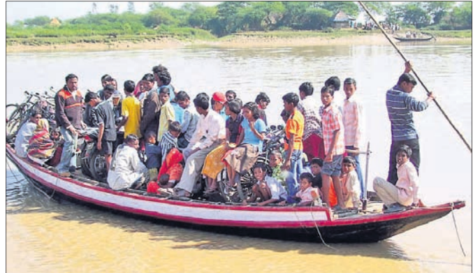
ମତେଇ ନଦୀ ଚୌଧୁରୀ ଘାଟରେ ପୋଲ ନ ଥିବାରୁ ଲୋକେ ବିପଦପୂର୍ଣ୍ଣ ଭାବେ ଚଳାନ୍ତେ ନଦୀ ପାର ହେଉଛି।

ଭଦ୍ରକ ଜିଲ୍ଲା ଚାନ୍ଦବାଲି ନିର୍ବାଚନ ମଣ୍ଡଳୀର ଧାମରା ଏକ ଗୁରୁତ୍ୱପୂର୍ଣ୍ଣ ଅଞ୍ଚଳ। ଏଠାରେ ସାମୁଦ୍ରିକ ବନ୍ଦର ସାଙ୍ଗକୁ ରେଳ ଲାଇନ ସଂଯୋଗ ରାଜ୍ୟ ଓ ଦେଶର ଅର୍ଥନୀତିରେ ଏକ ପ୍ରମୁଖ ଭୂମିକା ନେଇଛି। ଏଠାରେ ପ୍ରସ୍ତୁତ ଗ୍ୟାସ୍ ଚର୍ଚ୍ଚନାଳ ପ୍ରତିଷ୍ଠା ହେଲେ ଧାମରାର ଗୁରୁତ୍ୱ ଯଥେଷ୍ଟ ବଢ଼ିବ ବୋଲି ଆଶା କରାଯାଇଛି।