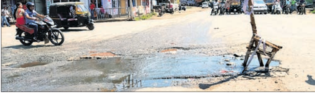
ଗାନ୍ଧୀ ଛକରେ ଭାସୁଥିବା ଡ୍ରେନ୍ ପାଣି ।

କେନ୍ଦୁଝର ସହର ମଧ୍ୟରେ ଥିବା ଜନାକାର୍ଣ୍ଣ ଅଞ୍ଚଳ ଭାବେ ପରିଗଣିତ ଗାନ୍ଧୀଛକ ଉପରେ ପୌରପାଳିକାର ଦୂଷିତ ଡ୍ରେନ୍ ପାଣି ଉଛୁଳି ରାସ୍ତା ଉପରେ ବୋହି ଯାଉଥିବାରୁ ସାଧାରଣରେ ତୀବ୍ର ଅସନ୍ତୋଷ ପ୍ରକାଶ ପାଉଛନ୍ତି । ଏହି ଗାନ୍ଧୀଛକ ଅଞ୍ଚଳ କେନ୍ଦୁଝର ସହର ମହକୁମାର ସବୁଠାରୁ ଗୁରୁତ୍ୱପୂର୍ଣ୍ଣ ଅଞ୍ଚଳ