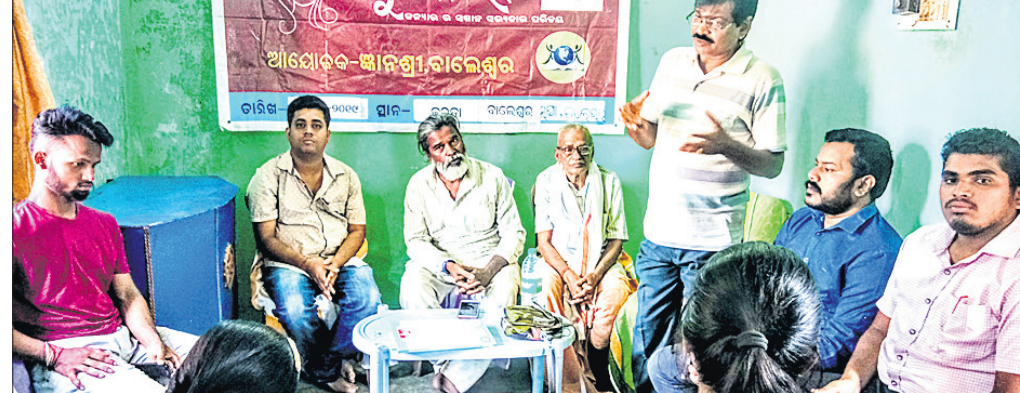
'ମୋ ଭୋଟ୍ ମୋ ଅଧିକାର' ଆଲୋଚନାଚକ୍ରରେ ଉପସ୍ଥିତ କର୍ମକର୍ତ୍ତା।

ସମଗ୍ର ଦେଶରେ ଗଣତନ୍ତ୍ର ମହାପର୍ବ ନିର୍ବାଚନ-୨୦୧୯ ଚାଲୁଅଛି। ଓଡ଼ିଶାରେ ୩ଟି ପର୍ଯ୍ୟାୟରେ ମତଦାନ ଅନୁଷ୍ଠିତ ହୋଇଯାଇଥିବା ବେଳେ ଆସନ୍ତା ୨୯ତାରିଖରେ ବାଲେଶ୍ୱର ସମେତ କେତେକ ଜିଲ୍ଲାରେ ଚତୁର୍ଥ ପର୍ଯ୍ୟାୟ ନିର୍ବାଚନ ଅନୁଷ୍ଠିତ ହେବାକୁ ଯାଉଛି। ଏକ ସୁନ୍ଦର ତଥା ସ୍ୱଚ୍ଛ ଭାବର ନିର୍ବାଚନ ପାଇଁ ନିଜେ ମତଦାନ କରିବା ସହିତ ଅନ୍ୟମାନଙ୍କୁ ମତଦାନ ପୂର୍ବକ ସଠିକ୍ ପ୍ରାର୍ଥୀ ଚୟନ କରିବା ଉଦ୍ଦେଶ୍ୟରେ ଜ୍ଞାନଶ୍ରୀ ସ୍ୱେଚ୍ଛାସେବୀ ସଙ୍ଗଠନ ପକ୍ଷରୁ କୁମାରୀ କାର୍ଯ୍ୟକ୍ରମ ଆୟୋଜିତ ହୋଇଥିଲା।