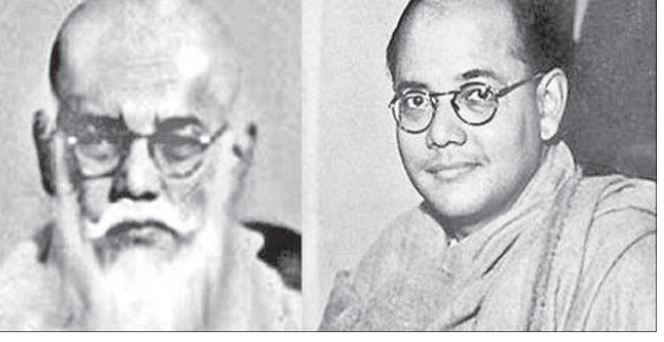
ରୋଲେଟ୍ ଘଡ଼ି ରଖୁଥିଲେ। ୧୯୮୫ ହୋଇଥିଲା। ଏହାପରେ ତାଙ୍କର ସମସ୍ତ ସେପ୍ଟେମ୍ବର ୧୨ରେ ତାଙ୍କର ମୃତ୍ୟୁ ଆସବାବପତ୍ର ଯାଞ୍ଚ କରାଯାଇଥିଲା।