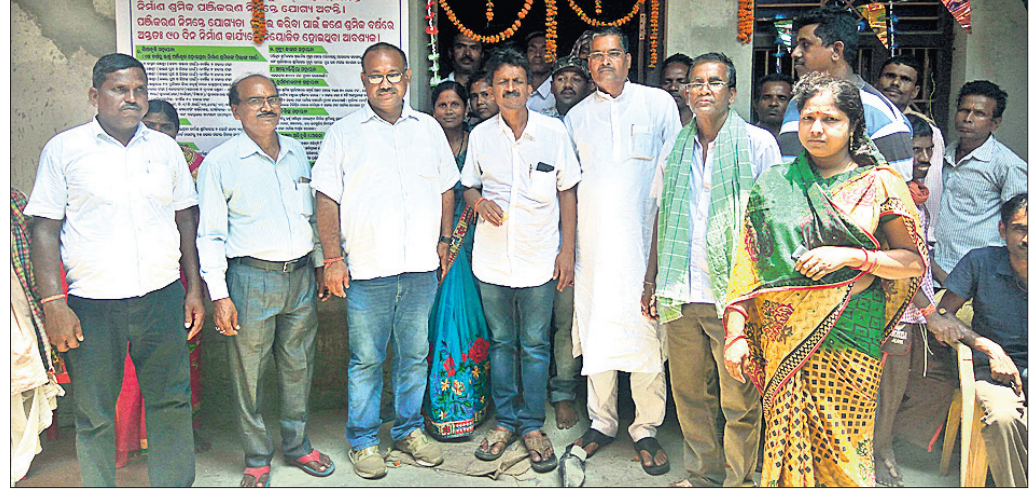
ଶ୍ରମିକ ସଂଘର ନୂତନ କାର୍ଯ୍ୟାଳୟ ଉଦ୍ଘାଟନ ଅବସରରେ ମନ୍ତ୍ରୀଙ୍କ ସହ ସଂଘର ସଭ୍ୟମାନେ।

ଚତୁର୍ଥ ପର୍ଯ୍ୟାୟ ନିର୍ବାଚନକୁ ଆଉ କିଛି ଦିନ ସେତେବେଳେ କ'ଣ ହୋଇଥିଲା ଓ ଗତ ୫ବର୍ଷ ମଧ୍ୟରେ ବିଜେଡି ସରକାର କ'ଣ କରିଛି ସେ ବିଷୟରେ ଭୋଟରଙ୍କଠାରେ ଏକ ପକ୍ଷରୁ ପ୍ରଚାରକୁ ଜୋରଦାର କରିବା ପାଇଁ ବାଇକ୍ ଶୋଭାଯାତ୍ରା କରାଯାଇଛି।