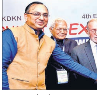
ଧାମରା ପୋର୍ଟ କର୍ତ୍ତୃପକ୍ଷ (ବାମରୁ ପ୍ରଥମ)ଙ୍କୁ ପୁରସ୍କୃତ କରାଯାଇଛି।

ଅଧୀନା ପୋର୍ଟସ ଏବଂ ସ୍ୱତନ୍ତ୍ର ଅର୍ଥନୈତିକ ଜୋନ୍ସର ସହାୟକ କମ୍ପାନୀ ଧାମରା ପୋର୍ଟ କମ୍ପାନୀ ଲିମିଟେଡ୍ (ଡିପିଏସ୍) ଜେବ ବିଧିଧରା ସଂରକ୍ଷଣ, ପରିବେଶ ଏବଂ ବର୍ଣ୍ଣ ପରିଚାଳନା କ୍ଷେତ୍ରରେ ଭଲକର୍ମନାୟକ ସମ୍ପର୍କ ପାଇଁ ଏକ କାମ୍ପ ବେଶ୍ କେ ନାମ୍ ଏକ୍ସିଟ୍ ଗୋଲ୍ଡ ପୁରସ୍କାର ଲାଭ କରିଛି।