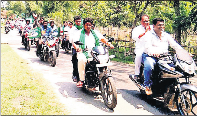
ବିଜେଡିର ବାଇକ୍ ଶୋଭାଯାତ୍ରା।

ଉପସ୍ଥିତରେ ଅଫିସ୍ ତଦାରଖ କରାଯାଇଛି। ଏଠାରେ ଫାୟାର ସେଫ୍ଟି ପାଇଁ କୌଣସି ବ୍ୟବସ୍ଥା ନ ଥିବାରୁ ପ୍ରଦୁଷଣ ବୋର୍ଡର ସାର୍ଟିଫିକେଟ୍ ଏବଂ ଫ୍ୟାକ୍ଟି ଆଣ୍ଡ ସଏଲର ବିଭାଗର ସାର୍ଟିଫିକେଟ୍ ୨୦୦୪ ମସିହାରୁ ରିନ୍ୟୁ କରାଯାଇ ନ ଥିବା ଜାଣିବାକୁ ପାଇଥିଲେ।