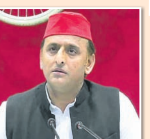
ଉତ୍ତରପ୍ରଦେଶର ଏସ୍ପି-ବିଏସ୍ପି-ଆର୍ଏସ୍ପି ବିରୋଧୀ ମେଳା ଦେଖିବା ପାଇଁ ପ୍ରଧାନମନ୍ତ୍ରୀ ମୋଦି

ପ୍ରଧାନମନ୍ତ୍ରୀ ନରେନ୍ଦ୍ର ମୋଦିଙ୍କୁ ନିର୍ବାଚନ କମିଶନ ଆଦର୍ଶ ଆଚରଣ ବିଧି ଉଲ୍ଲଙ୍ଘନ ପାଇଁ ସୁଯୋଗ ଦେଇଛି। ଏହି ନିର୍ବାଚନରେ ନମୋ ନମୋ ଉତ୍ତରୀୟ କରୁଥିବା ଲୋକ ସଭା ପରାଜୟ ସୁନିଶ୍ଚିତ। -ମାୟାବତୀ, ବିଏସ୍ପି ସୁପ୍ରିମୋ