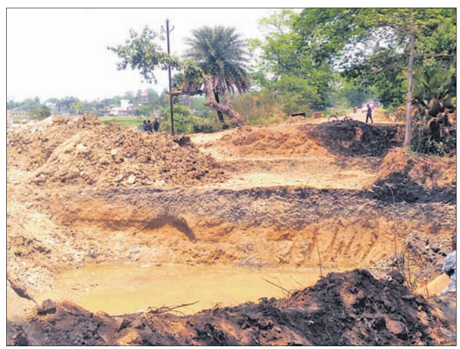
ନିର୍ମାଣାଧୀନ କାନପୁର ଜଳ ଭଣ୍ଡାରର କେନାଲ ।

କେନ୍ଦୁଝର ଜିଲାର ଯୋଡା ବ୍ଲକ୍ ଅନ୍ତର୍ଗତ ବାସୁଦେବପୁର ଠାରେ ବୈତରଣୀ ନଦୀରେ ନିର୍ମାଣାଧୀନ କାନପୁର ଜଳ ଭଣ୍ଡାରର କେନାଲ ନିର୍ମାଣରେ ବିଳମ୍ବ ହେଉଥିବାରୁ ଅସନ୍ତୋଷ ପ୍ରକାଶ ପାଉଛନ୍ତି । ଏହି କେନାଲ ଦ୍ୱାରା ଜିଲାର ବିଭିନ୍ନ ବ୍ଲକ୍ ଗ୍ରାମାଞ୍ଚଳ ଚାଷ ଜମିରେ ପାଣି ମାଟିବ ବୋଲି ନିର୍ମାଣ କାମ ଚାଲିଛି । କେନାଲ ନିର୍ମାଣ ପାଇଁ ଅନେକ ଗ୍ଲାନରେ ରାସ୍ତାକୁ କାଟି କାମ ଚାଲୁଛି । ମାତ୍ର କେନାଲ ନିର୍ମାଣ କାର୍ଯ୍ୟରେ ମନ୍ଦରତା ଗତି ଯୋଗୁଁ କେନାଲ ନିର୍ମାଣ ଶେଷ ହୋଇପାରୁନାହିଁ । ଫଳରେ ସାଧାରଣ ଲୋକ ଯାତାୟତ କରିବାରେ ସମସ୍ୟା ଭୋଗୁଛନ୍ତି ।