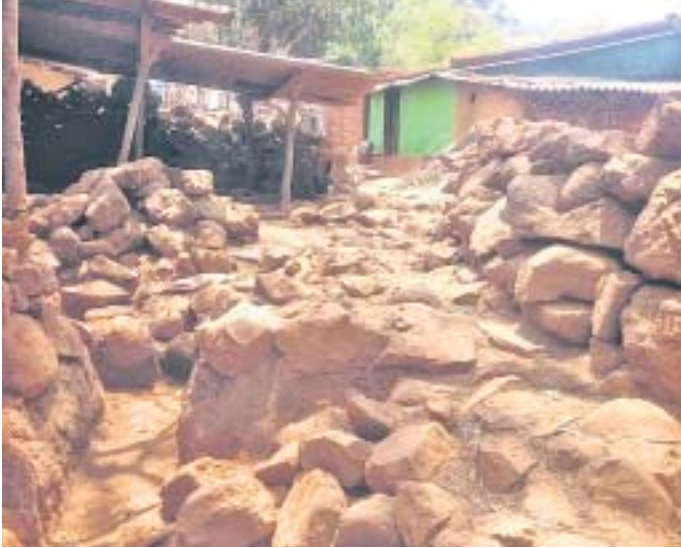
ଅବହେଳିତ ଖାଲପଡ଼ା ଗାଁର ଚିତ୍ର।