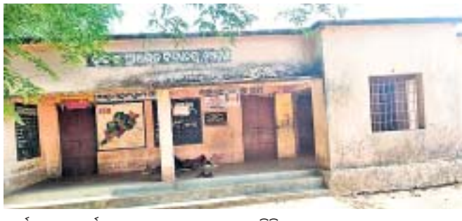
ଧାର୍ଯ୍ୟ ସମୟ ପୂର୍ବରୁ ନୂଆଗୁଡ଼ା ସ୍କୁଲରେ ତାଲା ପଡ଼ିଛି ।