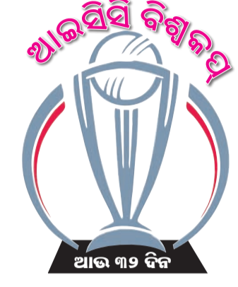
ଆଇସିସି ବିଶ୍ୱକପ୍ ଆରମ୍ଭ ୩୨ ଦିନ