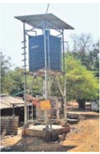
ତୋଳିଆସରଗୁଡ଼ାରେ ଅକାମୀ ପ୍ରକଳ୍ପ ।

କୋରାପୁଟ ଜିଲ୍ଲାରେ ଓଡ଼ିଶା ଅକ୍ଷୟ ଶକ୍ତି ବିକାଶ ସଂସ୍ଥା (ଓଡିପିଆ) ଦ୍ୱାରା ନିର୍ମିତ ହୋଇଥିବା ଲକ୍ଷାଧିକ ଟଙ୍କାର ସୌରଚାଳିତ ପାନୀୟ ଜଳ ପ୍ରକଳ୍ପ କାର୍ଯ୍ୟ କରୁନାହିଁ । ଗ୍ରାମାଞ୍ଚଳରେ ପାନୀୟ ଜଳ ଯୋଗାଣ କ୍ଷେତ୍ରରେ ଏହା ବାଧକ ସାଜିଛି । ପ୍ରତ୍ୟେକ ପଞ୍ଚାୟତରେ ୧୦ ହଜାରରୁ ଊର୍ଦ୍ଧ୍ୱ କ୍ଷମତା ବିଶିଷ୍ଟ ପାଣିଟାଙ୍କି ନିର୍ମାଣ କରାଯାଇଛି । କିନ୍ତୁ ପାଇପ ମାଧ୍ୟମରେ ସବୁ ଗାଁକୁ ଜଳ ଯୋଗାଣ ସମ୍ଭବ ହୋଇପାଉ ନାହିଁ । ତେଣୁ ସୌରଶକ୍ତି ପରିଚାଳିତ ମୋଟର ଦ୍ୱାରା ଭୃତକ ଜଳ ଉତ୍ତୋଳନ କରାଯାଇ