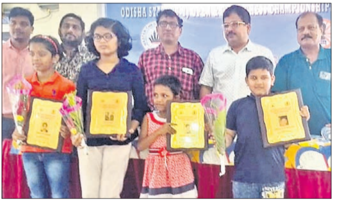
ଉଦ୍‌ଯାତନା ଉପରେ ସମର୍ଥନ ଖେଳାଳିମାନେ କର୍ମକର୍ମାଣ୍ଡ ସହ।

କଟକ ଅଫିସ, ୨୬/୪: ମାଷ୍ଟର ଚେସ୍ ଫାଉଣ୍ଡେଶନ ଆନୁକୂଲ୍ୟରେ ଶୁକ୍ରବାର ଚାଳିକା ଜାତୀୟ ଫୁଟବଲ ଚାମ୍ପିୟନଶିପ ଅନୁଷ୍ଠିତ ହେବ। ଏ ନେଇ ଫୁଟବଲ ଆୟୋଜିଂ ଫର୍ମ ଓଡ଼ିଶା(ଫାଓ) ପକ୍ଷରୁ ଆସନ୍ତା ମେ ପହିଲାକୁ ସ୍ଥାନୀୟ ବାରିବାଟା ଷ୍ଟାଡିୟମରେ ରାଜ୍ୟ ସରକ୍ଷିତ ଚାଳିକା ଦଳର ପ୍ରସ୍ତୁତି ଓ ଚୟନ ଶିବିର ଅନୁଷ୍ଠିତ ହେବ। ଶିବିରରେ ଯୋଗ ଦେବାକୁ ଉଚ୍ଚ ଶେଖାଳିକ କର୍ତ୍ତୃପକ୍ଷଙ୍କୁ କାର୍ଯ୍ୟକ୍ରମ ୧ ଚାଳିକା ୨୦୦୦ ଟିକେଟରେ ୩୧ ଚାଳିକା ମଧ୍ୟରେ ହୋଇଥିବା ଆବେଦନ। ଏହାଛଡ଼ା ଅନିଚ୍ଚିନାଳ କର୍ତ୍ତୃପକ୍ଷଙ୍କ ପ୍ରତି ସହ ଶିବିରରେ ଯୋଗ ଦେବାକୁ ଫାଓ ପକ୍ଷରୁ ନିବେଦନ କରାଯାଇଛି।