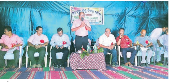
ବାର୍ଷିକ ଉତ୍ସବରେ ମହାସାଧନ ଅତିଥି ।