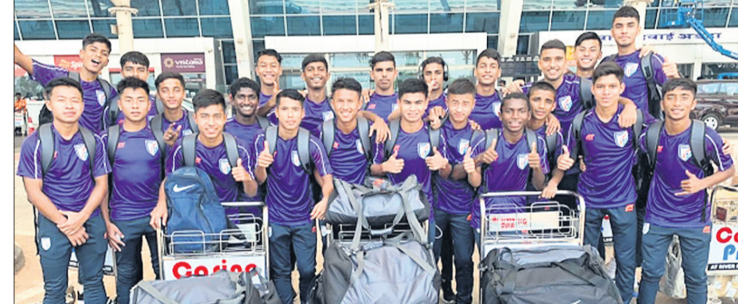
ଭାରତୀୟ ଜୁନିୟର ଫୁଟବଲ ଦଳ।

ନୂଆଦିଲ୍ଲୀ, ୨୬/୪ (ପି.ଟି.) ଏଏସପିଏ ୧୬ବର୍ଷରୁ କମ୍ କଳିଫୋର୍ଣ୍ଣିଆରୁ ପୁଣିରେ ରଖି ଭାରତୀୟ ଜାତୀୟ ଜୁନିୟର ଦଳ ଦକ୍ଷିଣ ଦୃଷ୍ଟି ପାଇଁ କୋଚ୍ ସାକ୍ଷୀଙ୍କୁ ନେତୃତ୍ୱରେ ୨୦୧୮ରେ ମାଲେସିଆରେ ଇଟାଲୀ ରୁରେ ଯିବ। ସେଠାରେ ଦଳ ୟୁଏସ୍ଏ, ମେକ୍ସିକୋ ଏବଂ ସ୍ଲୋଭେନିଆ ବିପକ୍ଷରେ ଖେଳିବ। ଜାତୀୟ ଦଳରେ