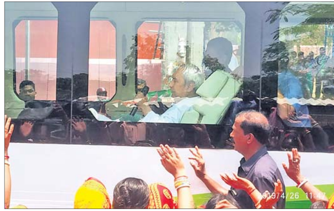
ମହାକାଳପଡ଼ା ବୁକ ଅଞ୍ଚଳରେ ପୁଖ୍ୟମନ୍ତ୍ରୀ ନବୀନ ପଟ୍ଟନାୟକଙ୍କ ମାରାଥନ ପ୍ରଚାର।