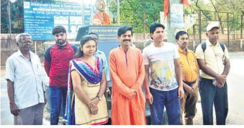
କୃଷ୍ଣଚନ୍ଦ୍ର ଗଜପତିଙ୍କ ପ୍ରତିମୂର୍ତ୍ତିରେ ମାଲ୍ୟାପର୍ଣ୍ଣ ପାଇଁ ଉପସ୍ଥିତ ଅତିଥି ଓ ଅନ୍ୟମାନେ ।

୫ଟି ସ୍ଥାନରେ ୨୪ ଘଣ୍ଟା କଣ୍ଠୋଲ ରୁମ୍ ଖୋଲାଯାଇଛି । ସେହିପରି ସମସ୍ତ ୧୪ଟି ବ୍ଲକର ବିଭିନ୍ନ ଅଂଶୁଯାତର ମୁକାବିଲା କରିବା ପାଇଁ ପ୍ରଶାସନ ପକ୍ଷରୁ ନିର୍ଦ୍ଦେଶ ଦିଆଯାଇଛି । କୋରାପୁଟ ମେଡିକାଲ କଲେଜ ଓ ହସ୍ପିଟାଲରେ ଅଂଶୁଯାତ ରୋଗୀଙ୍କ ଚିକିତ୍ସା ପାଇଁ ଏକ ସ୍ୱତନ୍ତ୍ର ଓଡ଼ିଓ ଖୋଲାଯାଇଛି ।