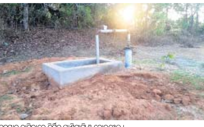
ହନୁମାନ ବାଟିକାରେ ନିର୍ମିତ ପାଣିଟାଙ୍କି ଓ ବୋରଖେଲ୍ ।

ପାଇପ୍ ପାଣି ବିକଳ ମାତ୍ର ୨୦ରୁ ୩୦ ମିନିଟ୍, ତାହା ମଧ୍ୟ ଅନିୟମିତ ଭାବେ ଆସୁଛି । ପାଣିର ଅଭାବ ଏତେ ଉଚ୍ଚତ ଯେ, ପୂର୍ବବର୍ଷ ପରି ଚଳିତ ବର୍ଷ ମଧ୍ୟ ସାଧାରଣ ଲୋକ ଓ ହୋଟେଲ୍ କଳଖିଆ ବୋକାଳାଙ୍କୁ ଘରୋଇ ସଂସ୍ଥାଠାରୁ ପାଣି କିଣିବାକୁ ପଡ଼ୁଛି ।