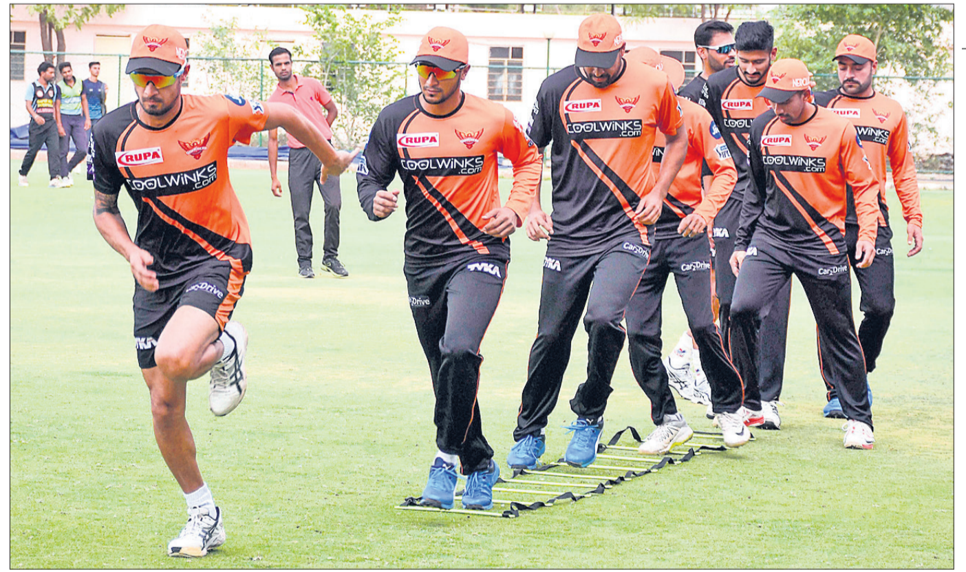
ଜୟପୁରରେ ଶୁକ୍ରବାର ସନ୍‌ରାଇଜର୍ସ ହାଇଦ୍ରାବାଦ ଦଳର ଅଭ୍ୟାସ ।