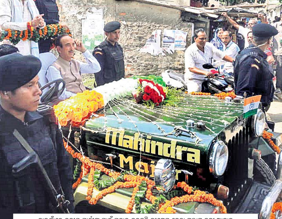
ନାଉଗାଁରେ ଦକ୍ଷିଣ ପ୍ରାର୍ଥୀଙ୍କ ପାଇଁ ପ୍ରଚାର କରୁଛନ୍ତି କଂଗ୍ରେସ ନେତା ଗୁଲ୍ଲାମ ନବା ଆଜାଦ