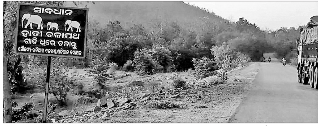
ନୂଆପତ୍ରା-ଖଡ଼ିଆଳ ରାସ୍ତାର ଦେଖିବାହାଲ ନିକଟରେ ହାତୀ ଚଳାଚଳ କରୁଥିବା ରାସ୍ତାକୁ ବନ୍ଦ ବିଭାଗ ପକ୍ଷରୁ ସଚେତ କରାଯାଇଛି ।