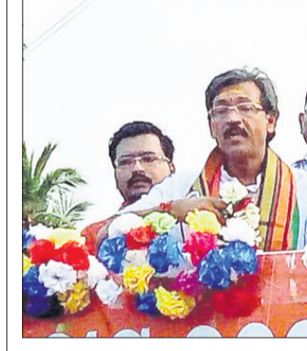
ଭଦ୍ରକରେ ରୋଡ୍ ଶୋ'ରେ କେନ୍ଦ୍ରମନ୍ତ୍ରୀ ଧର୍ମେନ୍ଦ୍ର ପ୍ରଧାନଙ୍କ ସହ ୨ ପ୍ରାର୍ଥୀ।