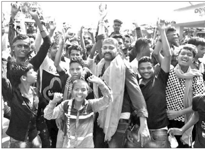
ରାମ, ଲଙ୍କାଶଙ୍କୁ ନେଇ ଗ୍ରାମ ପରିକ୍ରମା କରାଯାଇଛି।

୧୪ ଦିନ ଧରି ଚାଲିଥିବା ବଡ଼ଗାଁର ପୁରୁଣାରେ ଅଭିନୀତ ରାମଲୀଳା ଯାତ୍ରା ଶୁକ୍ରବାର ପୂର୍ଣ୍ଣିମାରେ ଉଦ୍‌ଯାପିତ ହୋଇଛି। ବିଗତ ରାତିରେ ମୁଖ୍ୟ ବିଷୟବସ୍ତୁ ଲଙ୍କାକାଣ୍ଡରେ ରାମ, ରାବଣଙ୍କ ମଧ୍ୟରେ ଯୁଦ୍ଧ, ଲଙ୍କାରେ ଦାନବ ନିପାତ ଦୃଶ୍ୟ ପ୍ରଦର୍ଶିତ ହୋଇଯାଇଛି। ତନ୍ମଧ୍ୟରେ ଲଙ୍କାଶଙ୍କୁ ଶକ୍ତିଭେଦ, ହନୁମାନଙ୍କ ଦ୍ୱାରା ହିମାଳୟରୁ ବିଶଲ୍ୟକରଣ ଆଣିବା, ଇନ୍ଦ୍ରଜିତ ବଧ, କୁମ୍ଭକର୍ଣ୍ଣ, ତରଣୀସୋଦ ବଧ, ରାମ, ଲଙ୍କାଶଙ୍କ ନାଗଫାଶରୁ ମକ୍ତି, ବିଭିନ୍ନ ଚିତାକର୍ଷକ ନୃତ୍ୟ, ହାସ୍ୟରସାତ୍ମକ ଅଭିନୟ ପରେ ପ୍ରବଳ ପ୍ରତାପୀ ରାବଣଙ୍କୁ ରାମଚନ୍ଦ୍ର ବଧ କରିଥିଲେ। ଲଙ୍କାରେ ରାବଣର ଭାଇ ବିଭୀଷଣଙ୍କୁ ଅଭିଷିକ୍ତ କରାଇ ସୀତାଙ୍କୁ ଉଦ୍ଧାର ପରେ ହନୁମାନ, କାମଦାନ, ନଳ,