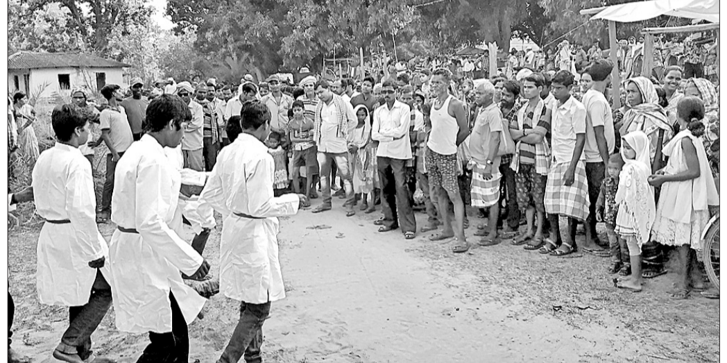
ଚୁଣିଗାରେଡି ସହ ଅନ୍ଧବିଶ୍ୱାସ ଦୂରକରିବା ନେଇ ପଥପ୍ରାନ୍ତ ନାଟକ ମାଧ୍ୟମରେ ଲୋକଙ୍କୁ ସଚେତନ କରାଯାଇଛି।