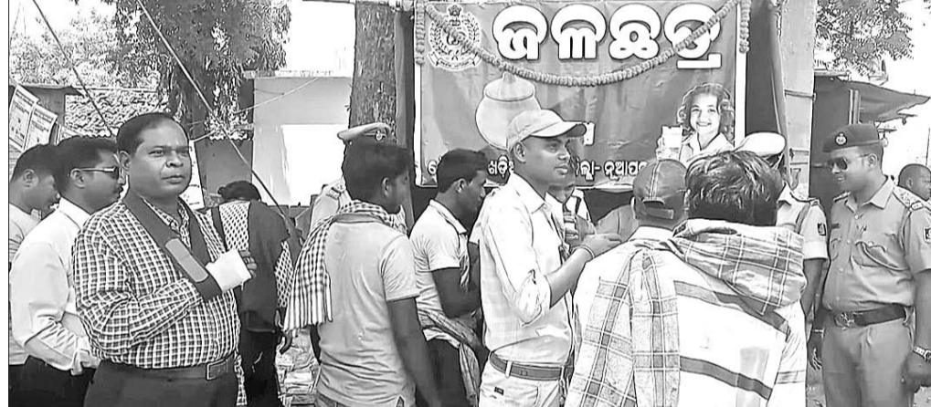
ନୂଆପତ୍ରା ଜିଲା ଖଡ଼ିଆଳ ଥାନା ସମ୍ମୁଖରେ ଆମ ପୋଲିସ୍ କାର୍ଯ୍ୟକ୍ରମ ପକ୍ଷରୁ ଜଳଛତ୍ର ଖୋଲାଯାଇଛି ।