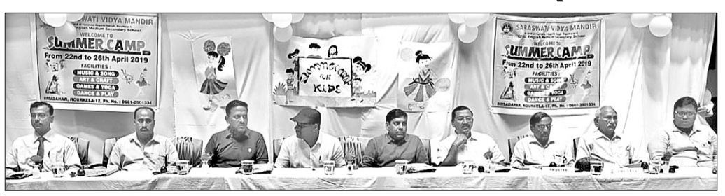
ଗ୍ରୀଷ୍ମକାଳୀନ ଶିବିର ଉଦ୍‌ଯାପନା ଉତ୍ସବରେ ମଞ୍ଚାସୀନ ଅତିଥି