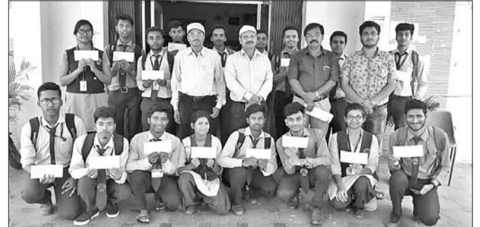
ଅତିଥିଙ୍କ ସହ ଛାତ୍ରାଛାତ୍ରୀ

ବଡ଼ଗାଁରାସୀ ଘରେ ଘରେ ପୂର୍ଣ୍ଣିମା ସ୍ଥାପନ କରି ରାମ, ଲଙ୍କାଶ, ସୀତାଙ୍କୁ ଶୋଭାଯାତ୍ରା ବେଳେ ଭକ୍ତି ସୁମନ ଓ ସ୍ୱାଗତ ଜଣାଇଥିଲେ। ଗ୍ରାମବାସୀ ଓ ଛାତ୍ରଛାତ୍ରୀ