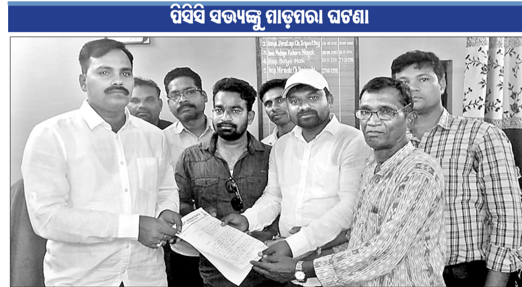
ଦଳିତ ଏକତା ମଞ୍ଚ ଚଳାଯିବ ଆନାଧିକାରୀଙ୍କୁ ଦାବିପତ୍ର ପ୍ରଦାନ କରାଯାଇଛି ।