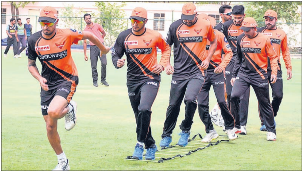
କ୍ରମପୁରରେ ଶୁକ୍ରବାର ସନ୍ତୋଷକର୍ତ୍ତା ହାଲଡ୍ରାବାଦ ଦଳର ଅଭ୍ୟାସ ।

ଏହି ଆକାଉଣ୍ଟ ବାଣ୍ଟୋଲୋର ବୋଲି ଜଣାପଡ଼ିଛି । ଏ ନେଇ ନିଷ୍ପତ୍ତି କୋର୍ଟ ଇନ୍‌ଷ୍ଟିଚ୍ୟୁଟର ନିର୍ଦ୍ଦେଶକ ବିକାଶ ସତ୍ତ୍ୱେ ଗଢନ ଆନାରେ ଅଭିଯୋଗ କରିଛନ୍ତି । ତାଙ୍କ ଶିକ୍ଷାନୁଷ୍ଠାନରେ କୋର୍ଟ ନେଇଥିବା ୩୦ ଛାତ୍ରଛାତ୍ରୀଙ୍କ ମଧ୍ୟରୁ ୨୬ ଜଣଙ୍କ ପାଖକୁ ଏକ କଲ୍ ଆସିଥିବା ସେ ଅଭିଯୋଗରେ ଦର୍ଶାଇଛନ୍ତି । ବିଶେଷ ସୂତ୍ରରୁ ମିଳିଥିବା ଖବର ଅନୁସାରେ ଡିଏସ୍‌ଏ (ଟାଟା କର୍ପୋରେସନ୍) ସହିତ କିଛି ବର୍ଷ ହେଲା ମୁକ୍ତ ୨ ଛାତ୍ରଛାତ୍ରୀଙ୍କ ଅନୁଭାଗରେ ଖାତା ଦେଖିବା ପାଇଁ ଚେଷ୍ଟା କରାଯାଇଛି । ହେଲେ ଚଳିତବର୍ଷ ଏହା ଅଧ୍ୟ ଏକ ସଂଗ୍ରାହୀ ଦିଆଯାଇଛି । ସେହିଠାରୁ କିମ୍ପା ବୋର୍ଡ କାର୍ଯ୍ୟାଳୟର ପିଲାମାନଙ୍କ ଏହି ତଥ୍ୟ ପ୍ରସ୍ତୁତ କରାଯାଇଥିବା ଆଲୋଚନା ହେଉଛି । ବର୍ତ୍ତମାନ ମୁକ୍ତ ୨ରୁ ଖାତାଦେଖା ଚାଲୁଥିବାରୁ ଏହି କଥା ସତ ହୋଇଯିବ ଭାବି ଅଭିଭାବକମାନଙ୍କୁ ଆଶ୍ଚର୍ଯ୍ୟ କରି ଛାତ୍ରଛାତ୍ରୀମାନେ ଚିନ୍ତାରେ ଅଛନ୍ତି । ଏ ଦିନରେ ଉକ୍ତ ଛାତ୍ର ବିଭାଗ ଦୃଷ୍ଟି ଦେବାକୁ ଦାବି ହେଉଛି । ନୟାଗଡ଼ ଗଢନ ଆନା ଅଧିକାରୀ ଉପସ୍ଥାପନ ମହାନ୍ତି କହିଛି, ଆନାରେ ଅଭିଯୋଗ ହେବା ପରେ ଏହାର ଚକ୍ର କରାଯାଇଛି ।