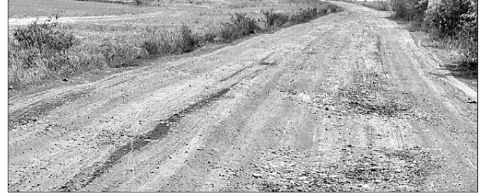
କନ୍ଦେଲପୁଣ୍ଡା ଗ୍ରାମ ପଞ୍ଚାୟତ ରାସ୍ତା ଶୋଚନୀୟ ହୋଇପଡିଛି।

ସୁନ୍ଦରଗଡ଼ ଜିଲ୍ଲା କୁନ୍ତା ବ୍ଲକ କନ୍ଦେଲପୁଣ୍ଡା ଗ୍ରାମ ପଞ୍ଚାୟତରେ ଏକ ସିମେଣ୍ଟ କାରଖାନା ବ୍ୟବହାର କରୁଥିବା ପଞ୍ଚାୟତ ରାସ୍ତାର ଅବସ୍ଥା ଅତି ଶୋଚନୀୟ ହୋଇପଡିଛି। ଏହି ରାସ୍ତାର ମରାମତି ପାଇଁ କନ୍ଦେଲପୁଣ୍ଡା ଗ୍ରାମବାସୀ ଦାବି କରିଛନ୍ତି। ଦରକାର ପଡିଲେ ରାସ୍ତାରୋକୋ ଭଳି ପଦକ୍ଷେପ ନିଆଯିବ ବୋଲି ଗ୍ରାମବାସୀ ପ୍ରକାଶ କରିଛନ୍ତି। କନ୍ଦେଲପୁଣ୍ଡା ଗ୍ରାମରେ ଶିବା ସିମେଣ୍ଟ ଲିମିଟେଡ ନାମକ ଏକ କାରଖାନା ଦୀର୍ଘ ଦିନରୁ ଥିବାବେଳେ କନ୍ଦେଲପୁଣ୍ଡା ଗ୍ରାମରୁ କୁନ୍ତା ଆନା ପର୍ଯ୍ୟନ୍ତ ଛାତ୍ରାଛାତ୍ରୀଙ୍କୁ ସମ୍ପନ୍ନ କରାଇବା ସହ ସେମାନଙ୍କୁ ଲୁଚାଯିତ ପ୍ରତିଭାକୁ ଲୋକଲୋଚନକୁ ଆରାଯାଇ ପାରିବ ବୋଲି କହିଥିଲେ। ଆଗାମୀ ଦିନରେ ଏକଲି କାର୍ଯ୍ୟକ୍ରମ ଆୟୋଜନ କରି ବିଦ୍ୟାଳୟର ଗରିବା ବୃଦ୍ଧି ଦିଗରେ ପଦକ୍ଷେପ ନେବାକୁ ଉପସ୍ଥିତ ଅତିଥି ମତ ପ୍ରକାଶ କରିଥିଲେ।