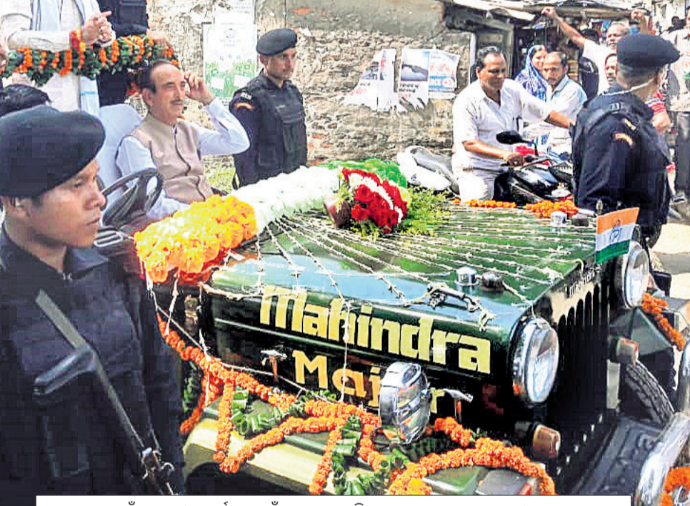
ନାଉଗାଁରେ ଦକ୍ଷିଣ ପ୍ରାର୍ଥୀଙ୍କ ପାଇଁ ପ୍ରଚାର କରୁଛି କଂଗ୍ରେସ ନେତା ଗୁଲାମ ନବା ଆଜାଦ