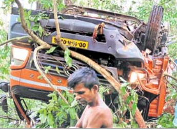
ଗୋନାସିକା ଘାଟି ତଳକୁ ଖସି ପଡିଥିବା ଟ୍ରକ୍। ହରାଇ ରାସ୍ତାକଡକୁ ଓଲଟି ପଡିଥିଲା। ପ୍ରାୟ ଶହେଫୁଟ ତଳକୁ ଖସିବା ପରେ ଏକ ଗଛରେ ଲାଗି ମିନିଟ୍ରକ୍ ଅଟକି ଯାଇଥିଲା।

କେନ୍ଦୁଝର/ତେଲକୋଇ, ୨୬/୪ (ସ.ପ୍ର./ଡି.ଏନ.ଏ.) କେନ୍ଦୁଝରଠାରୁ ୫୦ କି.ମି. ଦୂର କାଞ୍ଜିପାଣି ଆନା ଅନ୍ତର୍ଗତ ଗୋନାସିକା ଘାଟି ରାସ୍ତାକୁ ଏକ ମିନିଟ୍ରକ୍ ପ୍ରାୟ ୧୦୦ ଫୁଟ ତଳକୁ ଖସି ପଡିବାରୁ ଦୁର୍ଘଟଣା ଘଟିଥିଲା।