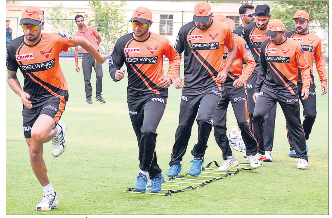
ଜୟପୁରରେ ଶୁକ୍ରବାର ସନରାଇଜର୍ସ ହାଇଡ୍ରାବାଦ ଦଳର ଅଭ୍ୟାସ।