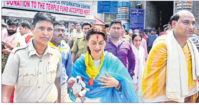
ଶ୍ରୀମନ୍ଦିରରୁ ଶ୍ରୀ ଭିକ୍ଷୁ ଦର୍ଶନ ସାରି ଫେରୁଛନ୍ତି ଭୂଞ୍ଜି ଚାଖିଲା।

ଦଳିଭଞ୍ଜିଆଦିନେତ୍ରୀ ଭୂଞ୍ଜିଚାଖିଲା ଶ୍ରୀମନ୍ଦିରକୁ ଆସି ମହାପ୍ରଭୁଙ୍କୁ ଦର୍ଶନ କରିଛନ୍ତି। ଶୁକ୍ରବାର ଅପରାହ୍ଣରେ ସ୍ୱାମୀଙ୍କ ସହ ଭୂଞ୍ଜି ବିହାରରେ ପହଞ୍ଚିଥିଲେ।