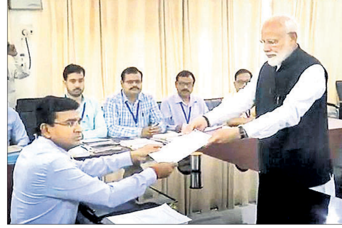
ବାରାଣସୀ, ୨୬.୪.୧୯ (ପି.ଟି.)