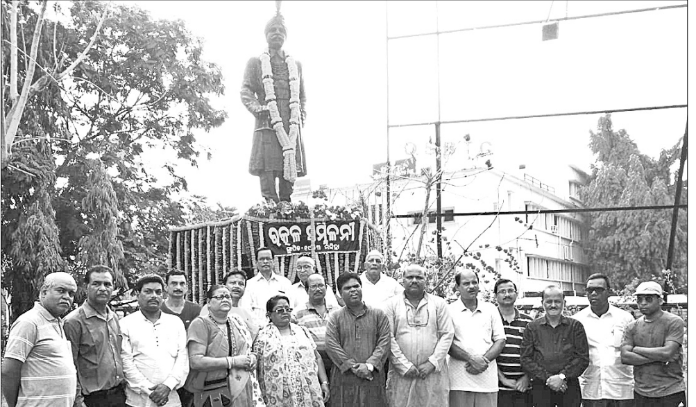
କୃଷ୍ଣଚନ୍ଦ୍ର ଗଜପତିଙ୍କ ଜୟନ୍ତୀ ଅବସରରେ ଏକ ଛକସ୍ଥିତ ତାଙ୍କ ପ୍ରତିମୂର୍ତ୍ତିରେ ଉତ୍କଳ ସମ୍ମିଳନୀ କର୍ମକର୍ମାଣୀରେ ପୁଷ୍ପ ମାଲ୍ୟାର୍ପଣ କରୁଛନ୍ତି।