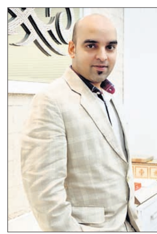
ସ୍ୱଳ୍ପ ଭାଗ ପୂଲ୍ୟରେ ଗ୍ରାହକଙ୍କୁ ଷ୍ଟାଇଲ୍ ଉତ୍ପାଦ ଯୋଗାଣ ନେଇ ପଦକ୍ଷେପ ଜାରି ରହିଥିବା ସେ ପୂର୍ତ୍ତା ଦେଇଛନ୍ତି।