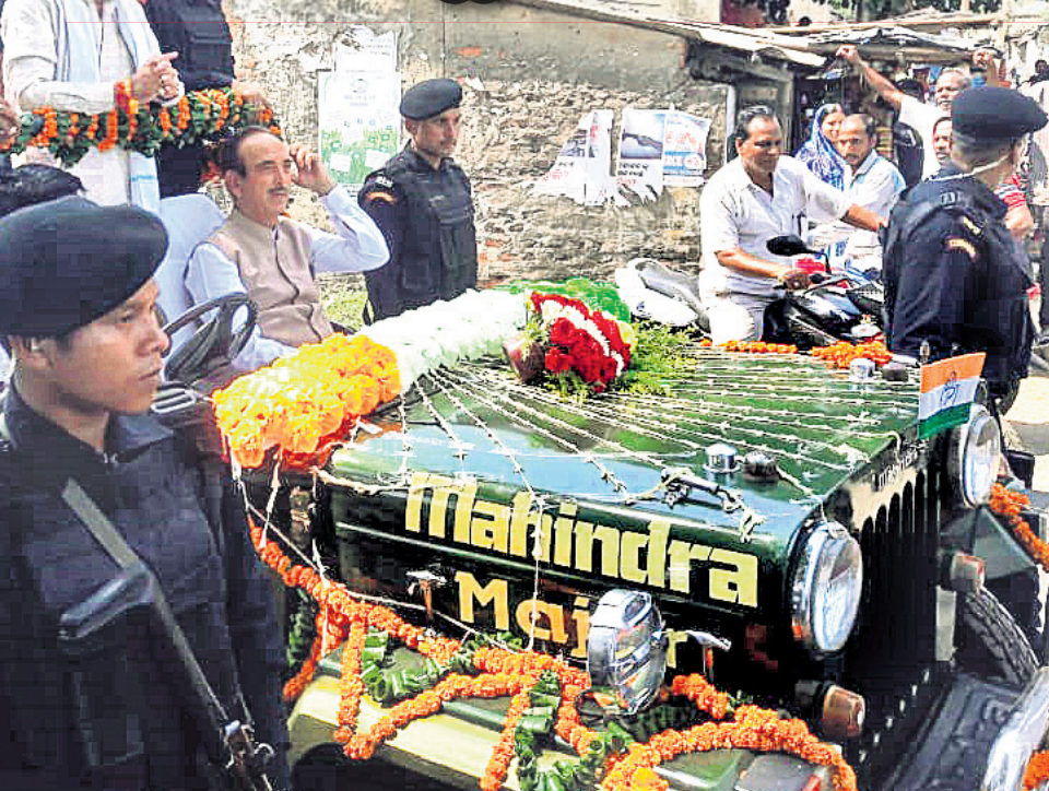
ନାଉଗାଁରେ ଦକ୍ଷୀଣ ପ୍ରାର୍ଥୀଙ୍କ ପାଇଁ ପ୍ରଚାର କରୁଛନ୍ତି କଂଗ୍ରେସ ନେତା ଗୁଲ୍ଲୀମନ୍ଦା ଆଜାବ