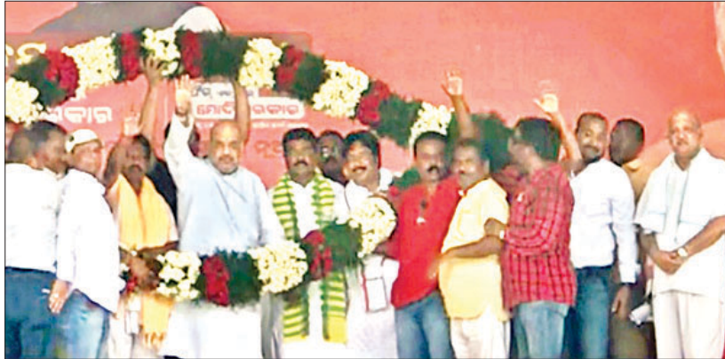
ସଭାରେ ଭାଜପା ରାଷ୍ଟ୍ରୀୟ ଅଧ୍ୟକ୍ଷ ଅମିତ ଶାହଙ୍କୁ ସ୍ୱାଗତ କରାଯାଇଛି।

ଚତୁର୍ଥ ପର୍ଯ୍ୟାୟ ନିର୍ବାଚନ: ୬ ଲୋକ ସଭା, ୪୧ ବିଧାନସଭା ପାଇଁ ମତଦାନ ପ୍ରଚାରରେ ପୂର୍ଣ୍ଣଚ୍ଛେଦ