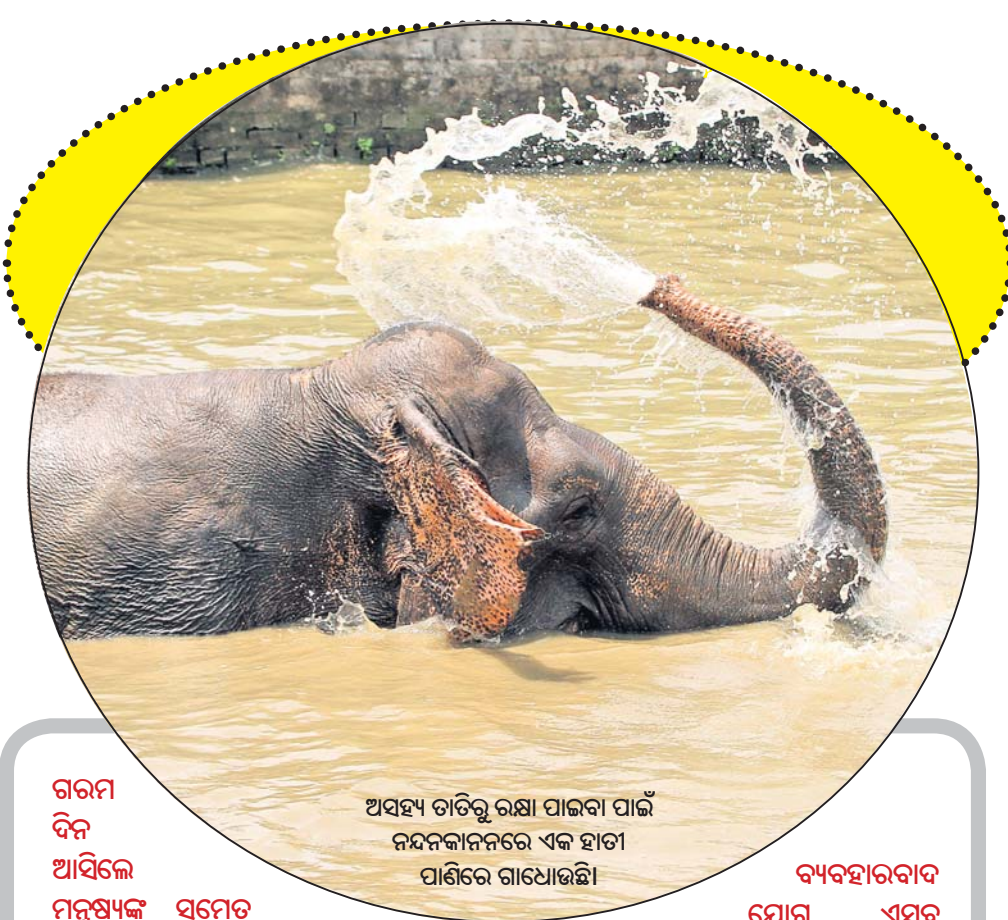
ଗରମ ଦିନ ଆସିଲେ ମନୁଷ୍ୟଙ୍କ ସମେତ ପଶୁପକ୍ଷୀ ଅସ୍ତବ୍ୟସ୍ତ ହୋଇ ପଡ଼ନ୍ତି। ଏଥିରୁ ଆଶ୍ଚର୍ଯ୍ୟ ପାଇବା ପାଇଁ ଥଣ୍ଡା ପରିବେଶ ଆବଶ୍ୟକତା ପଡ଼ିଥାଏ। ଏଥି ପାଇଁ ପଶୁପକ୍ଷୀ ଥଣ୍ଡା ପରିବେଶ ଉପରେ ନିର୍ଭର କରିଥାନ୍ତି। ଗୋଟିଏ ସମୟରେ ଲୋକମାନେ ପ୍ରାକୃତିକ ପବନ ଏବଂ ହାତପଞ୍ଜା ପରେ ନିର୍ଭର କରୁଥିଲେ। ଏବେ ସେ ସବୁର ସ୍ଥାନ ବୈଦ୍ୟୁତିକ ସରଞ୍ଜାମ ନେଇଥିବା ଦେଖିବାକୁ ମିଳୁଛି। ନୂଆ ନୂଆ ଚେକ୍‌କୋଲୋଜି ସଂକ୍ରାନ୍ତ ସାମଗ୍ରୀ ପ୍ରଥମେ କେବଳ ବିକଶିତ ଦେଶର ଧନୀମାନଙ୍କ ନିକଟରେ ରହୁଥିଲା। ଲୋକଙ୍କ ଆୟରେ ବୃଦ୍ଧି ଘଟିବା ତଥା ଏବଂ