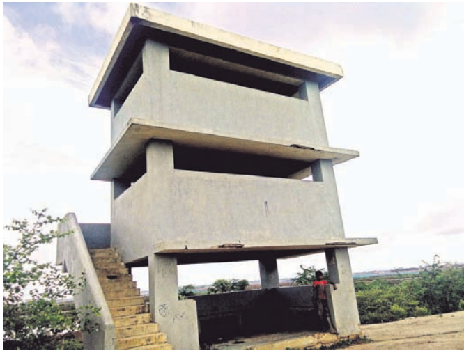
ଚୁଡ଼ାମଣି ଘାଟପୁଡ଼ି ଝାର ଚାଞ୍ଚାର ।

ଭଦ୍ରକ ଜିଲା ବାସୁଦେବପୁର ବ୍ଲକ୍ ବଙ୍ଗୋପସାଗର ସଂଲଗ୍ନ ଥିବା ଏକ ସମୁଦ୍ର ତଟବର୍ତ୍ତୀ ଅଞ୍ଚଳ । ଏହି ବ୍ଲକ୍‌ର ୩୬ ପଞ୍ଚାୟତ ଓ ପୌରପାଳିକାର ୨୩ ଖାର୍ଡି । ସେଥିମଧ୍ୟରୁ ୧୫ରୁ ଉର୍ଦ୍ଧ୍ୱ ପଞ୍ଚାୟତ ଓ ପୌରପାଳିକାର ୨ ଖାର୍ଡି ସିଧାସଳଖ ବଙ୍ଗୋପସାଗରକୁ ଛୁଇଁଛି । ଧାମରା ଶେଡ଼ିଂ ଓ ନିର୍ମାଣ ମୁହାଣ ଠାରୁ ଚୁଡ଼ାମଣି ବନ୍ଦର ମୁହାଣ ଓ କାଂଶବାଂଶ ନଦୀର ପଶ୍ଚିମ କୂଳରେ ପଞ୍ଚାୟତଗୁଡ଼ିକର ସୁରକ୍ଷା ଆବଶ୍ୟକ । ଜଳପଥରେ ଆଡ଼କବାଦୀଙ୍କ ପ୍ରବେଶ ଓ ଆକ୍ରମଣର ଭୟ ତଟବର୍ତ୍ତୀ ଲୋକଙ୍କ ମନକୁ ସବୁବେଳେ ଆନ୍ଦୋଳିତ କରୁଛି । ତଟବର୍ତ୍ତୀ ଅଞ୍ଚଳର ସୁରକ୍ଷା ଓ ଜଳପଥରେ ଆପରାଧିକାରୀଙ୍କ କାର୍ଯ୍ୟକଳାପକୁ ହ୍ରାସ କରିବା ଉଦ୍ଦେଶ୍ୟରେ ସମୁଦ୍ର ତଟରେ ଚୁଡ଼ାମଣି ଓ କଷିଆଠାରେ ନିର୍ମାଣ କରାଯାଇଥିବା ଝାର ଚାଞ୍ଚାର ଦୀର୍ଘଦର୍ଶି ଧରି ମୁକୁଳା ପଡ଼ିଛି । ଏହି ଝାର ଚାଞ୍ଚାରରେ ଜରିବା ପାଇଁ କୌଣସି ଯନ୍ତ୍ର କିମ୍ବା କର୍ମଚାରୀ ନାହାନ୍ତି । ଝାର ଚାଞ୍ଚାରରେ ଏବେ ଅସାଧାରଣ କାର୍ଯ୍ୟକଳାପ ବୃଦ୍ଧି ପାଇଛି । ଅସାଧାରଣ ଯୁବକମାନେ ନିରୋଳା ଘ୍ନାନ ପାଇ