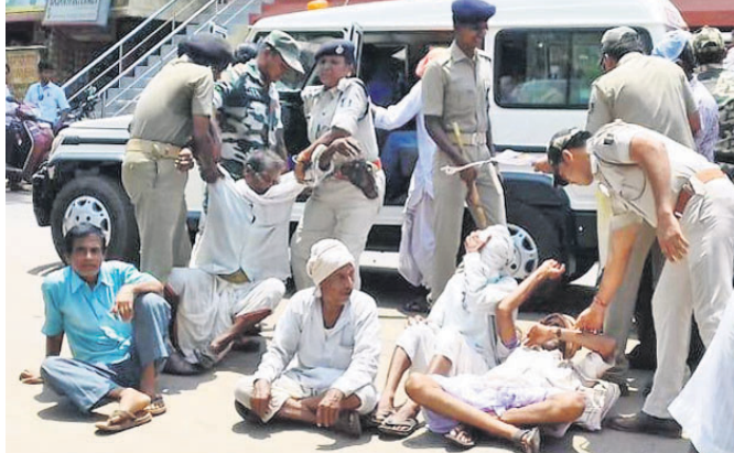
ରାସ୍ଥାରେ ଶୋଇ ପ୍ରତିବାଦ କରୁଥିବା କୃଷକ ସଂଘ କର୍ମଚାରୀଙ୍କୁ ପୋଲିସ ଉଠାଇ ନେଇଛି ।

ଭଦ୍ରକ କଲେଜ ପୁଖ୍ୟ ଫାଟକ ସମ୍ମୁଖ ରାଜରାସ୍ଥାରେ ଶନିବାର ପୂର୍ବାହ୍ନରେ ନବନିର୍ମାଣ କୃଷକ ସଙ୍ଗଠନର କର୍ମଚାରୀ ସମୂହ ଓ ଶୋଇ ନିର୍ବାଚନର ପ୍ରତିବାଦ କରିଥିଲେ । କଲେଜରୁ ଇଭିଏମ୍ ଓ ଭିଜିଏସିଟି ମେଣିନ ନେଇ ନିର୍ବାଚନ ପାଇଁ ବାହାରୁଥିବା ପୋଲିଂ କର୍ମଚାରୀଙ୍କୁ ରାସ୍ଥାରେ ଅଟକାଇବା ଲାଗି ସେମାନଙ୍କ ଉଦ୍ୟମ ବିଫଳ ହୋଇଛି । ଭଦ୍ରକ ଚାନ୍ଦନ ଧାନ ପୋଲିସ ପହଞ୍ଚି ସଙ୍ଗଠନର ପ୍ରାୟ ୧୫ ଜଣଙ୍କୁ ଗିରଫ କରି ପରେ ଛାଡ଼ି ଦେଇଥିବା ଜଣାଯାଇଛି ।