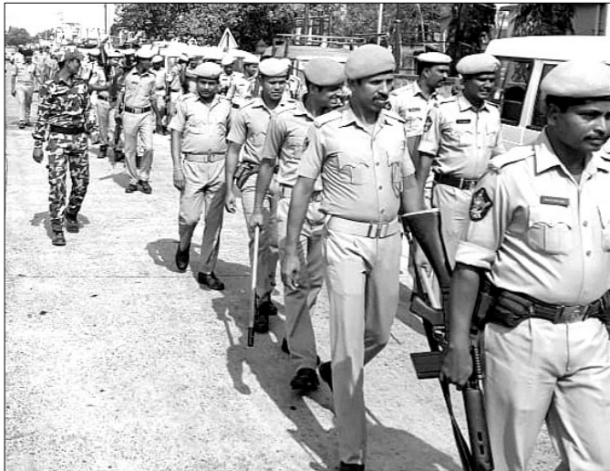
ନିଶ୍ଚିତକୋଇଲି ଅଞ୍ଚଳରେ ଫ୍ଲାଗମାର୍ଚ୍ଚ କରାଯାଇଛି।

ଚତୁର୍ଥ ତଥା ଶେଷ ପର୍ଯ୍ୟାୟ ନିର୍ବାଚନ ପାଇଁ ଯୋମବାର ଭୋଟ ଗ୍ରହଣ ହେବ। କେନ୍ଦ୍ରାପଡ଼ା ଲୋକସଭା କ୍ଷେତ୍ର ଅଧୀନସ୍ଥ ମାହାଙ୍ଗା ବିଧାନସଭା ନିର୍ବାଚନମଣ୍ଡଳୀରେ ଏଥୁପାଇଁ ପ୍ରଶାସନ ପକ୍ଷରୁ କଟା ସୁରକ୍ଷା ବ୍ୟବସ୍ଥା କରାଯାଇଛି। ନିର୍ବାଚନମଣ୍ଡଳୀର ୩୦୩ ବୁଥ୍‌ରେ ପୋଲିଙ୍ଗ୍ ଟିମ୍ ପହଞ୍ଚି ସୁରକ୍ଷା ଦେଇଛି। ରବିବାର ପୂର୍ବଦିନେ ନିଶ୍ଚିତକୋଇଲି, ମାହାଙ୍ଗା, ସାଲେପୁର ଓ ନେମାଳ ଥାନା ପକ୍ଷରୁ ବିଭିନ୍ନ ସ୍ଥାନରେ ଫ୍ଲାଗମାର୍ଚ୍ଚ କରାଯାଇଛି। ଏହି ନିର୍ବାଚନମଣ୍ଡଳୀରେ ନିଶ୍ଚିତକୋଇଲି ଓ ମାହାଙ୍ଗା ବୁଥ୍ କୁଳ ରହିଛି। ଏହି ବୁଥ୍ କୁଳରେ ସୁରକ୍ଷିତ ମତଦାନ ପାଇଁ ୫୨ ବୁଥ୍‌ରେ ସିଆଇଏସ୍‌ଏଫ୍ ଫୋର୍ସ୍ ମୁତୟନ କରାଯାଇଥିବା ବେଳେ ୨୭ଟି ବୁଥ୍‌ରେ ଖେପ କାଷ୍ଟି ବ୍ୟବସ୍ଥା କରାଯାଇଛି। ସେହିପରି ୯୯ ବୁଥ୍‌ରେ ସିସିଟିଭି ଲଗାଯାଇଛି। ୫୨ ବୁଥ୍‌ରେ ମାଲକୋଟ୍ଟା ଅବକରକଲକ୍ତ ନିୟୋଜିତ କରାଯାଇଛି। ୧୬ଟି ବୁଥ୍‌ରେ ଭିଡ଼ିଓ ରେକର୍ଡିଂ ବ୍ୟବସ୍ଥା କରାଯାଇଥିବା ବେଳେ ୮୭ଟି ବୁଥ୍‌ରେ ଫଟୋ ଉଠା ବ୍ୟବସ୍ଥା ହୋଇଛି। ମାହାଙ୍ଗା କୁଳର ପ୍ରଭୃତି ଉପରେ ସମସ୍ତା କ୍ଷାତ୍ରିକ୍ଷିପ୍ତ। ମାହାଙ୍ଗା ଥାନା ପକ୍ଷରୁ ୧୭ ମୋବାଇଲ୍ ଟିମ୍, ନେମାଳ ଥାନା ପକ୍ଷରୁ ୪ଟି ଟିମ୍, ନିଶ୍ଚିତକୋଇଲି ଥାନା ପକ୍ଷରୁ ୪ଟି ଟିମ୍ ଓ ସାଲେପୁର ଥାନା ପକ୍ଷରୁ ୨ଟି ମୋବାଇଲ୍ ଟିମ୍ ଗଠନ କରାଯାଇଛି। ମାହାଙ୍ଗାରେ ଏକ ସେକ୍ସନ୍ ଅଫିସର ପରିବର୍ତ୍ତନ କରି ବୁଥର