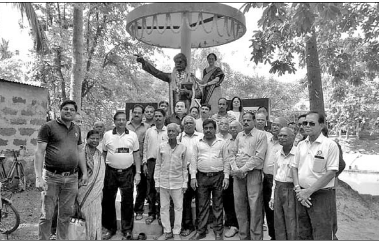
ସାଲେପୁର: ମଧୁବାବୁଙ୍କ ଜନ୍ମପୀଠରେ ବହୁ ବିଶିଷ୍ଟ ବ୍ୟକ୍ତି ଯୋଗ ଦେଇ ମାଲ୍ୟାର୍ପଣ କରୁଛନ୍ତି।