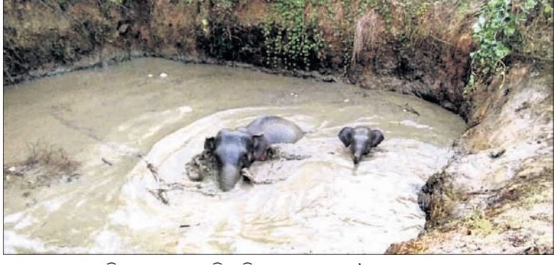
ସମ୍ବଲପୁର ହାତୀବାରି ଗ୍ରାମରେ ଏକ ଗାଡ଼ିଆ ଭିତରେ ଛୁଆ ସହ ମା' ହାତୀ।