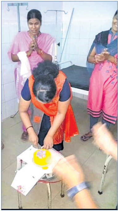
ଅଂଶୁଘାତ ଓଡ଼ିଶାରେ କେଜ୍ କଟାଯାଇଛି।