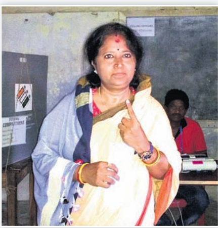
ଜଗତସିଂହପୁର ବିଜେଡି ଏମ୍ପି ପ୍ରାର୍ଥନା ରାଜଶ୍ରୀ ମଲିକ।