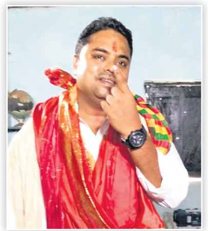
ରାଜନଗର କଂଗ୍ରେସ ବିଧାୟକ ଅଂଶୁମାନ ମହାପାତ୍ର।