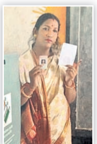
କୋରେଇ ବିଧାନସଭା ବିଏସ୍ପି ପ୍ରାର୍ଥା କାଜଲ କରର।