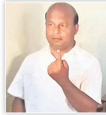
ଧର୍ମଶାଳା ବିଜେଡି ବିଧାୟକ ପ୍ରାର୍ଥା ପ୍ରଶବ ବଳବନ୍ତରାୟ।