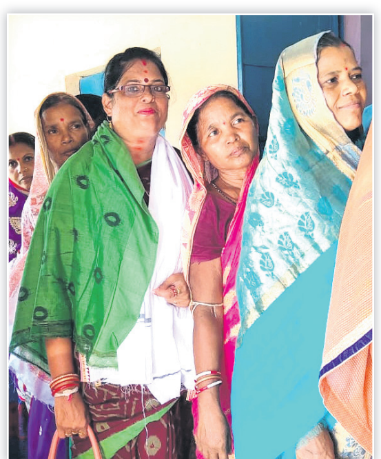
ଜଗତସିଂହପୁର କଂଗ୍ରେସ ଏମ୍ପି ପ୍ରାର୍ଥନା ପ୍ରତିମା ମଲିକ ଧାଡ଼ିରେ ଛିଡ଼ା ହୋଇଛନ୍ତି।