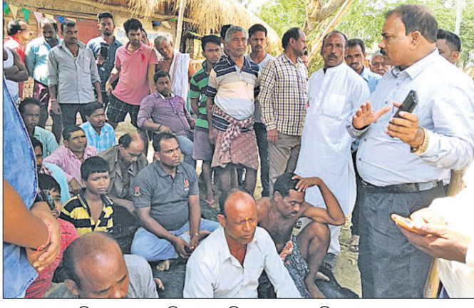
ଘୋଳିସ ଆକ୍ରମଣକୁ ବିରୋଧ କରି ଧାରଣାରେ ବସିଥିବା ଗ୍ରାମବାସୀ।

ଏରସମା ଥାନା ଅନ୍ତର୍ଗତ ଭିତର ଅନ୍ଧାରୀ ପଞ୍ଚାୟତ କାମୁକଣ ଗ୍ରାମର କେତେକ ଯୁବକଙ୍କୁ ଘୋଳିସ ମାଡ଼ ମାନିବା ପ୍ରତିବାଦରେ ଗ୍ରାମବାସୀ ଘୋଳିସର ଗୁହରେ ୮୭ ନଂ ଭୋଟ ଗ୍ରହଣ କେନ୍ଦ୍ର କରାଯାଇଛି। ନିୟମ ଅନୁସାରେ ନିର୍ବାଚନ ପୂର୍ବ ରାତିଠାରୁ ଭୋଟ ଗ୍ରହଣ କେନ୍ଦ୍ର ୧୦୦ ମିଟର ମଧ୍ୟରେ କୌଣସି ଲୋକ ଏକାଠି ହୋଇ ପାରିବେ ନାହିଁ କି କୌଣସି ପ୍ରକାର ଦଳଗତ ଆଲୋଚନା କରାଯାଇ ପାରିବ ନାହିଁ। ମାତ୍ର ୮୭ ନଂ କେନ୍ଦ୍ର ପାଖରେ ୨୫ ମିଟର ମଧ୍ୟରେ ଘର ରହିଛି। ରବିବାର ବିଳମ୍ବରେ ରାତିରେ ସେହି