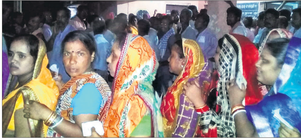
ନାରାଣୀ ବ୍ଲକ ବାଣ ପଞ୍ଚାୟତ ଗୋପପା ବ୍ଲକରେ ରାତିରେ ଘୋଳିସ ଦେବାକୁ ଧାଡ଼ି ବାନ୍ଧି ଠିଆ ହୋଇଛନ୍ତି।

ବାଲିଆ, ୨୯/୪: ତିର୍ତ୍ତୋଲ ନିର୍ବାଚନମଣ୍ଡଳୀ ଅନ୍ତର୍ଗତ ବିରିଡ଼ି ବ୍ଲକରେ ଥିବା ସମସ୍ତ ୨୧ ପଞ୍ଚାୟତର ୭୭ ବ୍ଲକରେ ମତଦାନ ହୋଇଛି। ତେବେ ଆରମ୍ଭରୁ ବିଳମ୍ବରେ ଘୋଳିସର ତ୍ରୁଟି ପରିଲକ୍ଷିତ ହୋଇଥିଲା। ତରତୁଲିଆ ପ୍ରାଥମିକ ବିଦ୍ୟାଳୟ, ରାଣିପଡ଼ା ପ୍ରାଥମିକ ବିଦ୍ୟାଳୟ ୨୨୩, ଇନ୍ଦ୍ରମଣି ହାଇସ୍କୁଲ, ପଟୁଆରି ପ୍ରାଥମିକ ସ୍କୁଲରେ ଘୋଳିସ ତ୍ରୁଟି ଯୋଗୁ ଭୋଟରମାନେ ବହୁ ସମୟ ଧରି ଧାଡ଼ିରେ ଛିଡ଼ା ହୋଇଥିଲେ। ବୁଢ଼ାପଡ଼ା ପଞ୍ଚାୟତ ଗୌଶନଗର ପ୍ରାଥମିକ ବିଦ୍ୟାଳୟରେ କରାଯାଇଥିବା ଆବର୍ଣ୍ଣ ମତଦାନ କେନ୍ଦ୍ରରେ ହଠାତ୍ ଦିନ ୧୨ଟା ବେଳେ ଘୋଳିସ ଖରାପ ହୋଇଥିଲା। ଫଳରେ ଏଠାରେ ସମ୍ପନ୍ନ ୭ଟା ବ୍ଲକ ପର୍ଯ୍ୟନ୍ତ ମତଦାନ ହୋଇଥିଲା। ଅରଣା ପଞ୍ଚାୟତର ପଟୁଆରି ଓ ଇନ୍ଦ୍ରମଣି ବିଦ୍ୟାଳୟରେ ହୋଇଥିବା ବ୍ଲକରେ ଘୋଳିସ ଖରାପ ହେବାରୁ ବିଳମ୍ବରେ ରାତ୍ରି ପର୍ଯ୍ୟନ୍ତ ମତଦାନ ହୋଇଥିଲା। ବଡ଼ଖଣ୍ଡାପଡ଼ା ପଞ୍ଚାୟତ ଗୋପପା ପ୍ରାଥମିକ ବିଦ୍ୟାଳୟରେ ଘୋଳିସର ଅପରାଧ ୪ଟା ପରେ ହଠାତ୍ ଘୋଳିସ