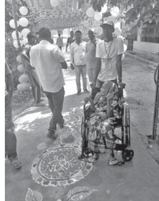
ନାଉଗାଁର ଏକ ଆଦର୍ଶ ମତଦାନ କେନ୍ଦ୍ର।

ନାଉଗାଁ ବ୍ଲକ୍ ମୋଟ ୭୭ ବୁଥ୍ରେ ଭୋଟର ନିଜ ମତ ସାଧାରଣ କରିଛନ୍ତି। ଅନେକାଂଶ ବୁଥ୍ରେ ଲଭିଏମ୍ ଖରାପ ଯୋଗୁ ୧ ଘଣ୍ଟା ବିଳମ୍ବ ହୋଇଥିଲା। ପ୍ରବଳ ଖରାପ ଦୃଷ୍ଟିରେ ରଖି ପୂର୍ବାହ୍ଣେ ଅପରାହ୍ଣରେ ମତଦାନ କେନ୍ଦ୍ର ନିକଟରେ ମତଦାତାଙ୍କ ଭିଡ଼ ଦେଖିବାକୁ ମିଳିଥିଲା। କିଛି ଲଭିଏମ୍ ଖରାପ ଯୋଗୁ ଭୋଟର ମାନେ ଦୀର୍ଘ ସମୟ ଧାଡ଼ିରେ ଠିଆ ହେବା ଯୋଗୁ ଅସନ୍ତୋଷ ବ୍ୟକ୍ତି କରିଥିଲେ। ଓଷକଣା ପଞ୍ଚାୟତର ଓଷକଣା ଉ.ପ୍ରା ବିଦ୍ୟାଳୟ ବୁଥ୍ ନମ୍ବର ୨୩୫, ଭଟଗା ଉ.ପ୍ରା ବିଦ୍ୟାଳୟ ବୁଥ୍ ନମ୍- ୨୩୬, ଅଲଗା ପଞ୍ଚାୟତ ମଧୁପୁର ବୁଥ୍ ନମ୍- ୧୨୬, ଶିଖର ପଞ୍ଚାୟତ ଶିଖର ବୁଥ୍ ନମ୍- ୨୧୦, ଶାଳିକା ବୁଥ୍ ନମ୍- ୨୧୩ ଓ ଲଭିଏମ୍ ଖରାପ ଯୋଗୁ ୧ ଘଣ୍ଟା ବିଳମ୍ବ ହୋଇଥିଲା। ସେହିପରି