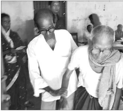
ତେରାବିଶ ବ୍ଲକରେ କଣ୍ଠେ ଭିକ୍ଷମ ମହିଳା ଓ କଣ୍ଠେ ବୁଢ଼ ଭୋଟ ଦେବାକୁ ବୁଝାଯାଇଛନ୍ତି ।

ଲକ୍ଷ୍ମୀନାରାୟଣପୁର ପ୍ରାଥମିକ ବିଧାନସଭା ୪୪ ନଂ ବ୍ଲକରେ କେତେକ କାରଣ ଯୋଗୁ ଭୁଲଗୋଷ୍ଠୀଙ୍କ ମଧ୍ୟରେ ବିବାଦ ଦେଖାଦେଇଥିଲା । ସେଥିପାଇଁ ଅଳ୍ପ ସମୟ ପାଇଁ ମତଦାନ ବାଧାପ୍ରାପ୍ତ ହୋଇଥିଲା । ଘଟଣାସ୍ଥଳରେ ପୋଲିସ୍ ପହଞ୍ଚିବା ପରେ ପୁନର୍ବାର ମତଦାନ ଚାଲିଥିଲା । ସୂଚନାଯୋଗ୍ୟ, ପାଟକୁରା ନିର୍ବାଚନ ମଣ୍ଡଳ ତେରାବିଶର ୨୭ ପଞ୍ଚାୟତ, ଗରବପୁରର ୧୮ ଓ ମାଣିଆପାଲ ବ୍ଲକର ୭ଟି ପଞ୍ଚାୟତକୁ ନେଇ ଗଠିତ । ଏହି ନିର୍ବାଚନ ମଣ୍ଡଳରେ ୩୦୯୯ଟି ବ୍ଲକ୍ ରହିଛି ଏବଂ ଭୋଟରଙ୍କ ସଂଖ୍ୟା ୨ଲକ୍ଷ ୩୭ହଜାର ୩୯୯ । ସେଥିମଧ୍ୟରୁ ତେରାବିଶ ବ୍ଲକରେ ୧ଲକ୍ଷ ୧୮ ହଜାର ୩୭୫ ଭୋଟର ରହିଛନ୍ତି । ସେମାନଙ୍କ ମଧ୍ୟରେ ମହିଳା ଭୋଟର ସଂଖ୍ୟା ୫୬୮୧୨ ଓ ପୁରୁଷ ଭୋଟରଙ୍କ ସଂଖ୍ୟା ୬୧୫୨୩ ରହିଛି । ତେରାବିଶ ବ୍ଲକରେ ୨୪ଟି ସରକାରୀ ଶାଳା ବେଳେ ଦୁଇଟି ବ୍ଲକ୍ରେ କେବଳ ଗୋଟି ପାଇଁ ମତଦାନ ବିଳମ୍ବ ହୋଇଥିଲା । ଲକ୍ଷ୍ମୀନାରାୟଣପୁର ପଞ୍ଚାୟତ