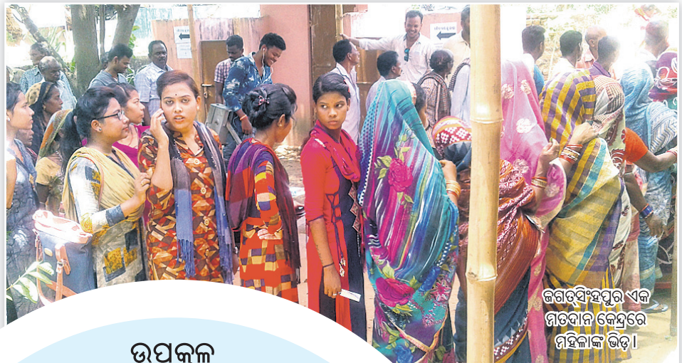
ଜଗତସିଂହପୁର ଏକ ମତଦାନ କେନ୍ଦ୍ରରେ ମହିଳାଙ୍କ ଭିଡ଼।