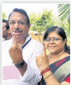
କେନ୍ଦ୍ରାପଡ଼ା କଂଗ୍ରେସ ଏମ୍ପି ପ୍ରାର୍ଥା ଧରଣିଧର ନାୟକ।