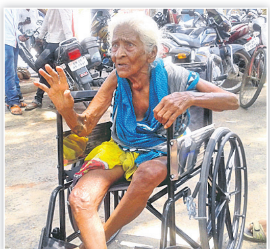
ଜଗତସିଂହପୁରର ଜଣେ ବୃଦ୍ଧା ସ୍ତ୍ରୀ ଚେୟାରରେ ଭୋଟ ଦେବାକୁ ଯାଇଛନ୍ତି।