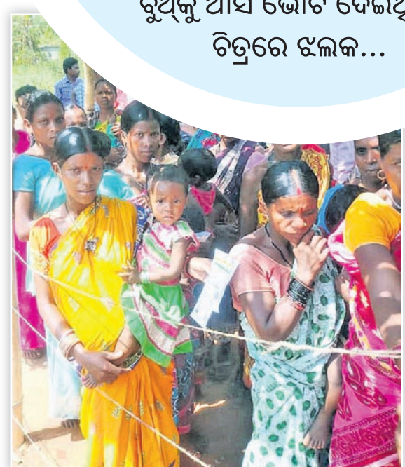
ନଗଡ଼ାର ଏକ ରୁଥ ଆଗରେ ମହିଳା ଭୋଟରଙ୍କ ଲମ୍ବା ଧାଡ଼ି।