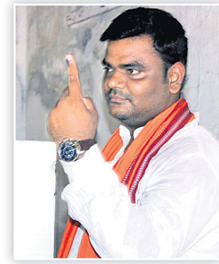
ପାରାଦୀପ ଭାଜପା ବିଧାୟକ ପ୍ରାର୍ଥା ସମ୍ପଦ ସ୍ୱାଇଁ।