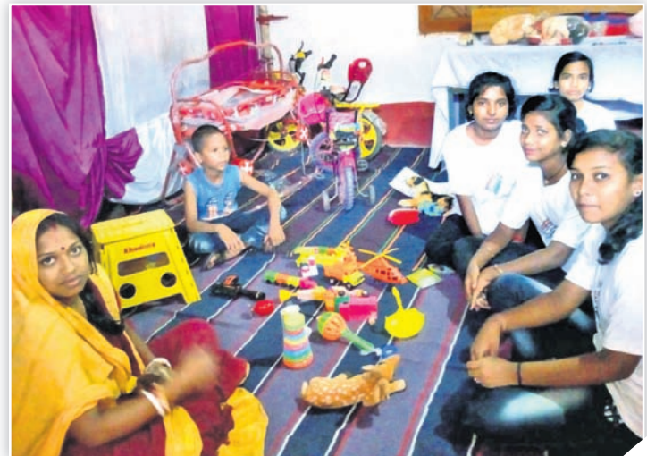
ପାରାଦୀପର ଏକ ଆଦର୍ଶ ମତଦାନ କେନ୍ଦ୍ରରେ ଅଙ୍ଗନୱାଡ଼ି କର୍ମୀ ଓ ସ୍ୱେଚ୍ଛାସେବୀମାନେ ଭୋଟ ପିଲାଙ୍କୁ ଖେଳାଇଛନ୍ତି।