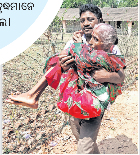
ମହାକାଳପଡ଼ାର ଏକ ରୁଥକୁ ଜଣେ ବୃଦ୍ଧାଙ୍କୁ ନିଆଯାଇଛି।