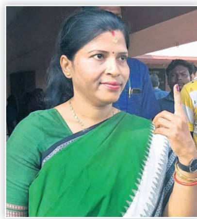
ଯାଜପୁର ବିଜେଡି ଏମ୍ପି ପ୍ରାର୍ଥନା ଶର୍ମିଷ୍ଠା ସେଠାଠି।