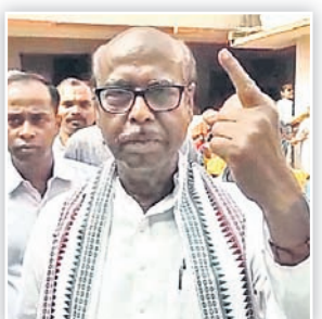
ପୂର୍ବତନ ମନ୍ତ୍ରୀ ପ୍ରଫୁଲ୍ଲ ଘଡ଼େଇ।