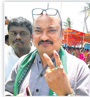
ପାରାଦୀପ ବିଜେଡି ବିଧାୟକ ପ୍ରାର୍ଥା ସମିତ ରାଜତରାୟ।