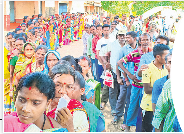
ଯାଜପୁରର ଏକ ରୁଥ ଆଗରେ ଭୋଟରଙ୍କ ଲମ୍ବା ଧାଡ଼ି।