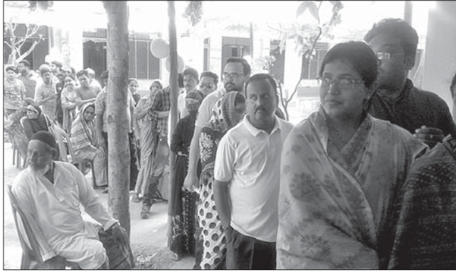
ଜଗତ୍ସିଂହପୁରରେ ଏକ ମତଦାନ କେନ୍ଦ୍ର ଆଗରେ ଭୋଟରଙ୍କ ଧାଡ଼ି।

ସୋମବାର ସାଧାରଣ ନିର୍ବାଚନର ୪ର୍ଥ ପର୍ଯ୍ୟାୟରେ ଜଗତ୍ସିଂହପୁର ଜିଲ୍ଲାରେ ମତଦାନ ହୋଇଛି। ଜିଲ୍ଲାରେ ନିର୍ବାଚନ ଆପାତତଃ ଶାନ୍ତିପୂର୍ଣ୍ଣ ଭାବେ ଶେଷ ହୋଇଥିବାବେଳେ କାଁ ଭାଁ କେତେକ ସ୍ଥାନରେ ଉତ୍ତେଜନା ଦେଖିବାକୁ ମିଳିଥିଲା। ଗୁରୁତ୍ୱପୂର୍ଣ୍ଣ କଥା ହେଲା ଜିଲ୍ଲାର ୪ ବିଧାନସଭା ନିର୍ବାଚନମଣ୍ଡଳୀର ଶତାଧିକ କ୍ଷେତ୍ରରେ ଲଭିଏମ୍, ଭିଜିପିଏଚ୍ ସମର୍ଥନ ଦେଖାଦେଇଥିଲା। ଏଥିରେ ମତଦାନରେ ବାଧା ସୃଷ୍ଟି ହୋଇଥିଲା। ଅନୁରୂପ ଭାବେ ମତଦାନ କ୍ଷେତ୍ରରେ କେତେକ କାନ୍ଦୁକ୍ରମ ଥିବା ଦିବ୍ୟ, ସର୍ବତ, କୋଲୁକ୍ରମ ଆଦି ବ୍ୟବସ୍ଥା କରାଯାଇଥିବା କୁହାଯାଇଥିଲା। ଏହା ସହ ବିଭିନ୍ନ ପ୍ରକାରର ଅସୁବିଧା ଥିଲା। ଏପରିକି ଅନେକ ସ୍ଥାନରେ ବୃକ୍ଷ ଓ ଭିକ୍ଷକମାନଙ୍କୁ ସେମାନଙ୍କ ଘରୁ ନେବାଆଣିବା କରାଯାଇ ନ ଥିଲା। କୁପ୍ରଭୃତିକରେ ବରିଷ୍ଠ ନାଗରିକ ଓ ଭିକ୍ଷକମାନଙ୍କୁ ବସିବା ପାଇଁ ସ୍ୱତନ୍ତ୍ର ବ୍ୟବସ୍ଥା କରାଯାଇ ନ ଥିବାରୁ କେତେକ ସ୍ଥାନରେ ଅଭାବନୀୟ ପରିସ୍ଥିତି ସୃଷ୍ଟି ହୋଇଥିଲା। ଏସବୁ ସତ୍ତ୍ୱେ ଅପରାହ୍ଣ ୫ଟା ପୂର୍ବା ଜିଲ୍ଲାରେ ୫୮.୪% ମତଦାନ ହୋଇଥିବା ସୂଚନା ମିଳିଛି।