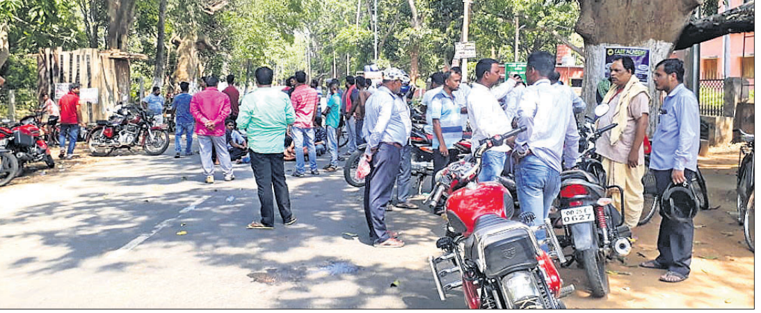
ସେସୁ କାର୍ଯ୍ୟକାରୀ ସମ୍ମୁଖରେ ଉପଭୋକ୍ତାଙ୍କ ରାସ୍ତାରେକୋ।

ଗଣିଆ, ୨୯/୪(ଡି.ଏନ.ଏ.): ପ୍ରକଳ ଗ୍ରାଣ୍ଟ ପ୍ରବାହ ଓ ଅସହ୍ୟ ଚାଡ଼ି, ଚୁଲୁଚୁଳି ସାଙ୍ଗକୁ ବିଦ୍ୟୁତ୍ କାଟ ଯୋଗୁ ଜନସାଧାରଣ ନାହିଁ ନ ଥିବା ଅଭିଯୋଗ ସମ୍ମୁଖରେ ହେଉଛନ୍ତି। ଗତ ରବିବାର କୌଣସି ଓଡ଼ିଆମାନ