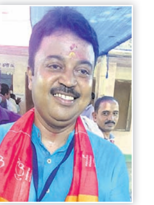
ଭୋଟଦାନ ପରେ ଭଦ୍ରକ ଭାଜପା ଏମ୍ପି ପ୍ରାର୍ଥୀ ଅଭିମନ୍ୟୁ ସେଠା