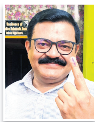
ହାଇକୋର୍ଟ ବିଚାରପତି ଦେବକୃଷ୍ଣ ଦାଶ ଗରିପଦା ସହରର ଏକ ବୁଥରେ ଭୋଟ ଦେଇଛନ୍ତି