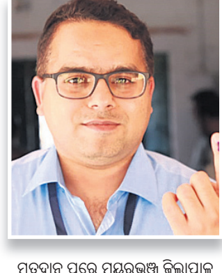
ମତଦାନ ପରେ ମୟୂରଭଞ୍ଜ ଜିଲାପାଳ ବିନିତ ଭରଦ୍ୱାଜ