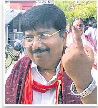
ମତଦାନ କେନ୍ଦ୍ର ସମ୍ମୁଖରେ ମହାକାଳପଡ଼ା ବିଧାୟକ ଅତନୁ ସତ୍ୟସାଗର ନାୟକ