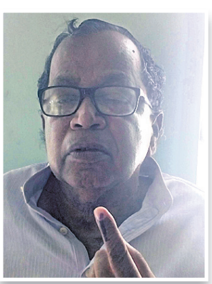
ଭଦ୍ରକ ଏମ୍ପି ଅର୍ଜୁନ ଚରଣ ସେଠା ମତଦାନ କରି ଫେରୁଛନ୍ତି