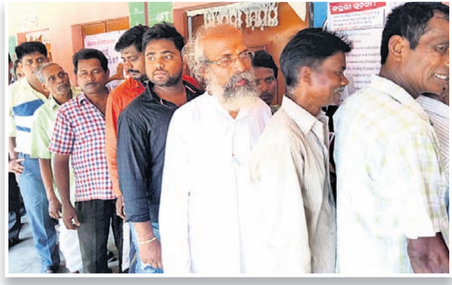
ମତଦାନ ପାଇଁ ବାଲେଶ୍ୱର ଭାଜପା ଏମ୍ପି ପ୍ରାର୍ଥୀ ପ୍ରତାପ ଚନ୍ଦ୍ର ଷଡ଼ଙ୍ଗା ଧାଡ଼ିରେ ଛିଡ଼ା ହୋଇଛନ୍ତି