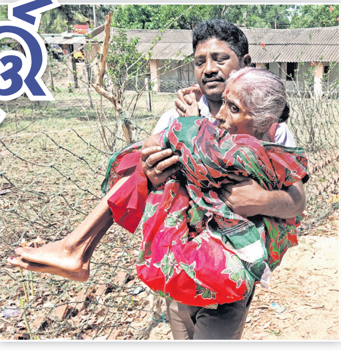
କେନ୍ଦ୍ରାପଡ଼ା ଜିଲା ମହାକାଳପଡ଼ାର ଏକ ବୁଥକୁ ଜଣେ ବୃଦ୍ଧାଙ୍କୁ ନିଆଯାଉଛି