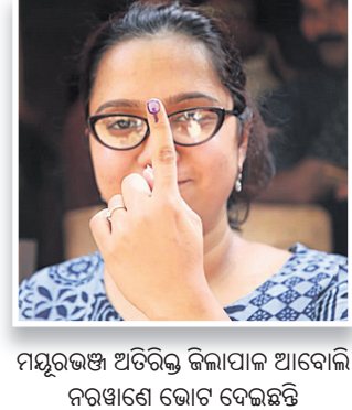
ମୟୂରଭଞ୍ଜ ଅତିରିକ୍ତ ଜିଲାପାଳ ଆବୋଲି ନରଞ୍ଜଣେ ଭୋଟ ଦେଇଛନ୍ତି