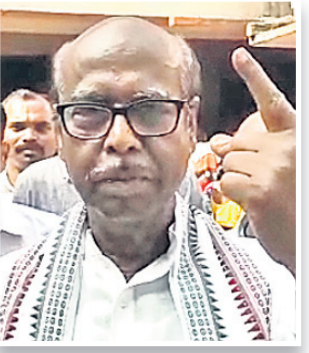
ପୂର୍ବତନ ମନ୍ତ୍ରୀ ପ୍ରଫୁଲ୍ଲ ଘଡ଼େଇ