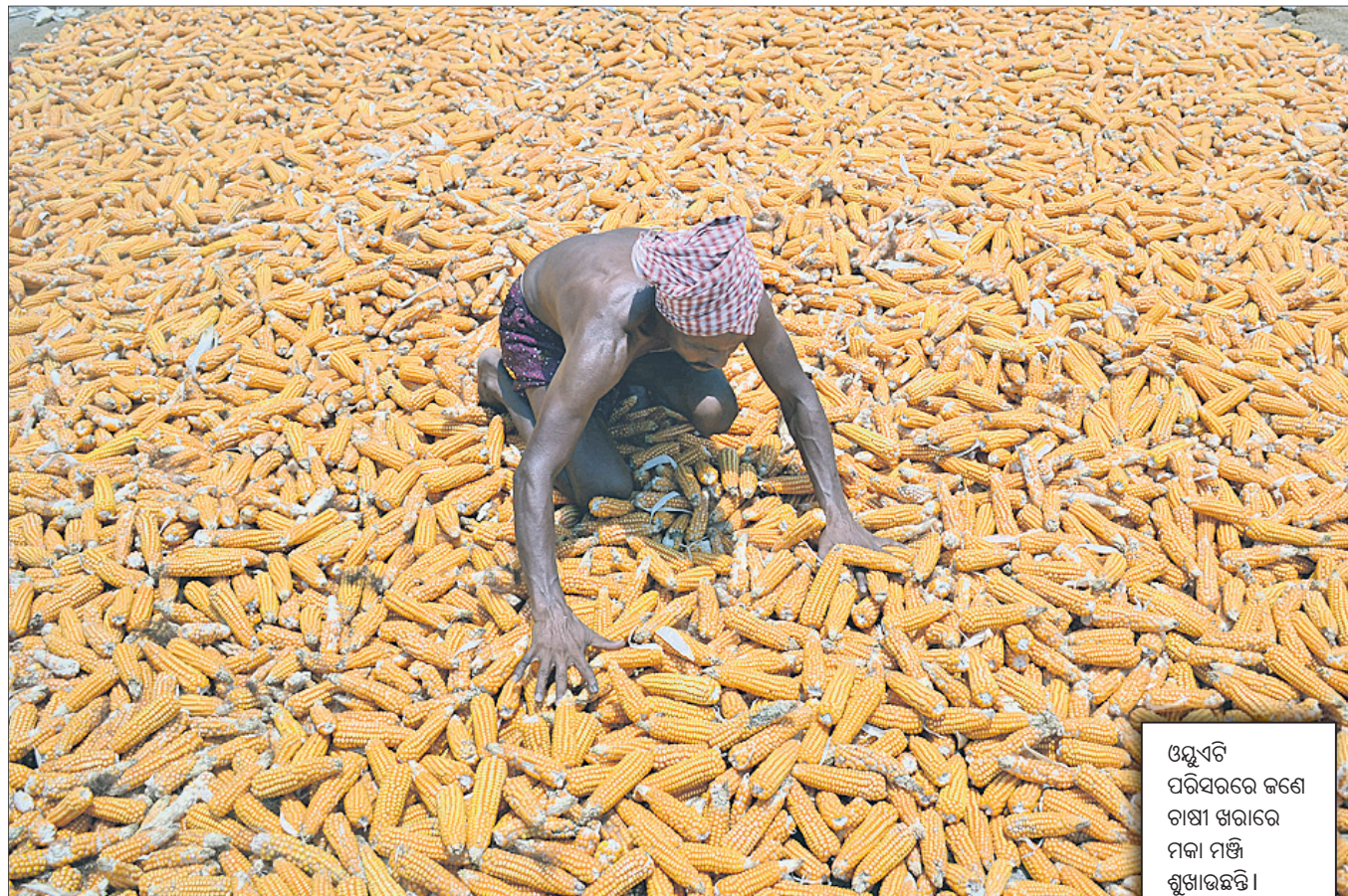
ଓଡ଼ିଶା ପରିସରରେ ଜଣେ ଗଣ୍ଡା ଖରାରେ ମକା ମଞ୍ଜି ଶୁଖାଉଛନ୍ତି।