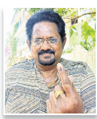
ଭୋଟ ଦେଇସାରିବା ପରେ ଓଡ଼ିଆ ସିନେ ତାରକା ତଥା ନିର୍ଦ୍ଦେଶକ ଅସିତ ପତି