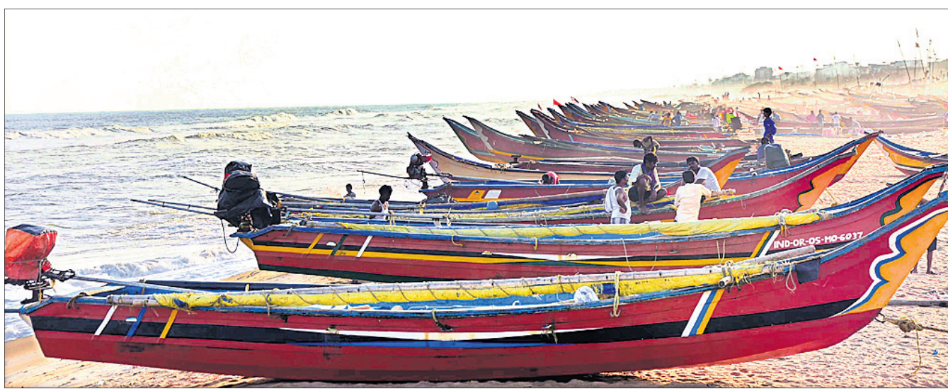
ବାତ୍ୟା 'ଫନୀ' କୁ ନେଇ ସତର୍କତା କାରି ପରେ ପୁରୀ ସମୁଦ୍ରକୁ ଫେରିଆସିଥିବା ମାଛଧରା ଡଙ୍ଗାଗୁଡ଼ିକୁ ମଧ୍ୟକାବାମାନେ ବୋକାକୁମିରେ ରଖିଛନ୍ତି।

କଟକ ଅଫିସ୍, ୩୦୧୪: ଉତ୍ପତ୍ତି ବିଷୟ ମତ ମୁତୁସ୍ତ ଯତ୍ନେ ମାନବାଧୁକାର କମିଶନଙ୍କ ନିକଟରେ ମାମଲା ରୁଚୁ ହୋଇଛି। ଭୁବନେଶ୍ୱରର ସିଦ୍ଧିକା ଯୋଜନାଟି ପୋଲିସ୍ ଅନ୍ତର୍ଭୁକ୍ତ କରାଯାଇ ନାହିଁ ବୋଲି କମିଶନଙ୍କ ନିକଟରେ ପିଟିସନ୍ ଦାଖଲ କରିଛନ୍ତି।