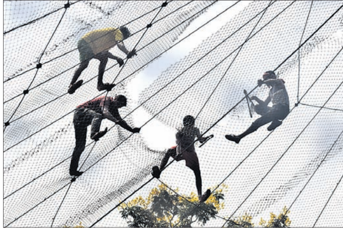
ନନ୍ଦନକାନନ ପ୍ରାଣୀ ଉଦ୍ୟାନ ପକ୍ଷୀ ଏନ୍ଡୋକ୍ସରେ ମଙ୍ଗଳବାର ମଧ୍ୟାହ୍ନରେ ମରାମତି କାର୍ଯ୍ୟ କରାଯାଉଛି।