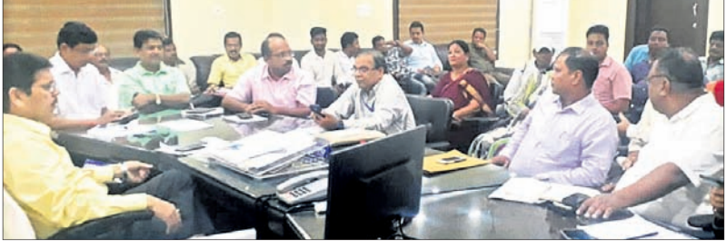
ପ୍ରସ୍ତୁତି ବୈଠକରେ ଜିଲ୍ଲାପାଳ ଓ ଅନ୍ୟ ଅଧିକାରୀମାନେ।

ପୁରୀ ଅଫିସ୍, ୩୦୧୪ ପ୍ରସ୍ତୁତି ବୈଠକରେ ଜିଲ୍ଲାପାଳ ଓ ଅନ୍ୟ ଅଧିକାରୀମାନେ।