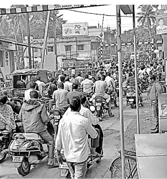
ପୁରୀ ସିଦ୍ଧମହାବୀର ନିକଟରେ ଥିବା ରେଳଫାଟକ।

ରେଳଫାଟକ ଉପରେ ଓଭରବ୍ରିଜ ନିର୍ମାଣ କାର୍ଯ୍ୟ ଦ୍ୱାରା ଉପରେ ହେବ ବୋଲି ଜିଲ୍ଲା ପ୍ରଶାସନ ପ୍ରତିଶ୍ରୁତି ଦେଇଥିଲା।