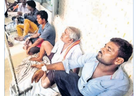
ତିକିସାଧାନ ଅସୁସ୍ଥମାନେ ।