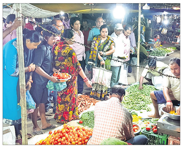
ବାତ୍ୟା ସୂଚନା ପରେ ପୁରୀ ବଡ଼ଖଣ୍ଡ ପରିବା ମାର୍କେଟ୍‌ରେ ଗ୍ରାହକଙ୍କ ଭିଡ଼।