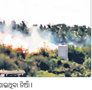
ଟ୍ରେନ୍ ଲାଇନ୍ ପାର୍ଶ୍ୱରେ ଲାଗିଯାଇଥିବା ନିର୍ଥା।

ସାକ୍ଷୀଗୋପାଳ, ୩୦୧୪ (ଡି.ଏ.ଏ.ଏ.): ଖୋର୍ଦ୍ଧା ରୋଡ଼-ପୁରୀ ରେଳପଥର ତେଲାଙ୍ଗ ରେଳ ଷ୍ଟେସନରେ ବିଦ୍ୟୁତ୍ ଫିଟର ପଡ଼ିଲା କିଛି ଦୂର ହରିପୁର ରେଳବାଇ ମାଟିକ ନିକଟରେ ମଙ୍ଗଳାବାର ଏକ ହାଇଭୋଲ୍ଟରେ ବିଦ୍ୟୁତ୍ ଫିଟର ଛିଣ୍ଡି ପଡ଼ିଲା। ରେଳ ଧାରଣା ପାର୍ଶ୍ୱରେ ଯାଇଥିବା ଏହି ବିଦ୍ୟୁତ୍ ଫିଟରଟି ହଠାତ ଶବ୍ଦ କରି ତଳେ ପଡ଼ିଯାଇଥିଲା। ଫଳରେ ସେହି ରେଳ ଧାରଣା ପାର୍ଶ୍ୱରେ ରହିଥିବା ଅନାବନା ଗଛକଟା ଜଳି ଯାଇଥିଲା ବୋଲି ବିଲରେ କାମ କରୁଥିବା ଲୋକେ ପ୍ରଥମେ ଦେଖିଥିଲେ। ସେହି ସମୟରେ ଏକ ଟ୍ରେନ୍ ଆସୁଥିବା ବେଳୁ ଗ୍ଲାନାୟ ଲୋକେ ଗାମୁଛା ହଲାଇ ଟ୍ରେନ୍‌ଟିକୁ ଅଟକାଇବାକୁ ଚେଷ୍ଟା କରିଥିଲେ। ମାତ୍ର ଟ୍ରେନ୍‌ଟି ନିରାପଦରେ ଚାଲିଯାଇଥିଲା। ପରେ ଖବରପାଳ ତେଲାଙ୍ଗ ଅଗ୍ନିଶମ କେନ୍ଦ୍ରରୁ ଦୁଇଟି ଦମକ ଘଟଣାସ୍ଥଳରେ ପହଞ୍ଚିଥିଲା। ରେଳ ବିଭାଗର ବିଦ୍ୟୁତ୍ ବିଭାଗର ଚେକିଙ୍ଗ କାମ କରୁଥିବା ଲୋକେ ପ୍ରଥମେ ଦେଖିଥିଲେ। ସେହି ସମୟରେ ଏକ ଟ୍ରେନ୍ ଆସୁଥିବା ବେଳୁ ଗ୍ଲାନାୟ ଲୋକେ ଗାମୁଛା ହଲାଇ ଟ୍ରେନ୍‌ଟିକୁ ଅଟକାଇବାକୁ ଚେଷ୍ଟା କରିଥିଲେ। ମାତ୍ର ଟ୍ରେନ୍‌ଟି ନିରାପଦରେ ଚାଲିଯାଇଥିଲା। ପରେ ଖବରପାଳ ତେଲାଙ୍ଗ ଅଗ୍ନିଶମ କେନ୍ଦ୍ରରୁ ଦୁଇଟି ଦମକ ଘଟଣାସ୍ଥଳରେ ପହଞ୍ଚିଥିଲା।