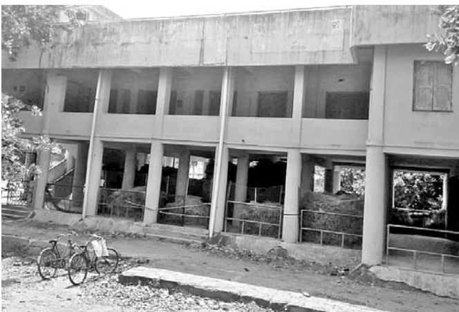
ବ୍ରହ୍ମଗିରିରେ ଥିବା ଏକ ବାତ୍ୟା ଆଶ୍ରୟସ୍ଥଳୀରେ ଛଣ ରଖିଛନ୍ତି।

ସାମୁଦ୍ରିକ ଝଡ଼ ଫନା ପୁରୀ ଜିଲ୍ଲା ଗ୍ରାମଭିତ୍ତିକ ସମୁଦ୍ରର ଅତି ନିକଟବର୍ତ୍ତୀ ସାତପଡ଼ା ଠାରୁ ଚନ୍ଦ୍ରଭାଗା ମଧ୍ୟରେ ସ୍ଥଳଭାଗ ଛୁଇଁବାନେଇ ପାଣିପାଗ ବିଭାଗ ସମାବ୍ୟ ସୂଚନା ଦେବା ପରେ ଉପକୂଳ ଅଞ୍ଚଳରେ ଆତଙ୍କ ଖେଳିଯାଇଛି।