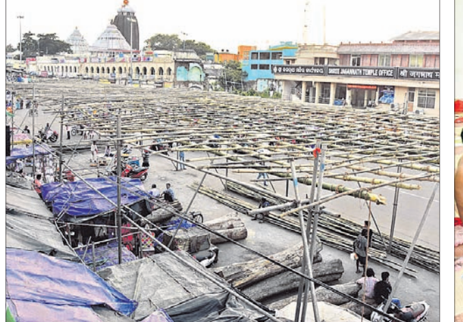
ରଥ ନିର୍ମାଣ ପାଇଁ ପୁରୀ ବଡ଼ବାଣରେ ରଥଖଳା ପ୍ରସ୍ତୁତ କରାଯାଇଛି।