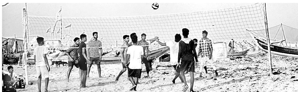
ପୁରୀ ବେଳାଭୂମିରେ ମଙ୍ଗଳବାର ମଧ୍ୟାହ୍ନାବାମାନେ ଭଲବଲ ଖେଳୁଛନ୍ତି।

ସାମୁଦ୍ରିକ ଝଡ଼ ଫନା ପୁରୀ ଜିଲ୍ଲା ଗ୍ରାମଭିତ୍ତିକ ସମୁଦ୍ରର ଅତି ନିକଟବର୍ତ୍ତୀ ସାତପଡ଼ା ଠାରୁ ଚନ୍ଦ୍ରଭାଗା ମଧ୍ୟରେ ସ୍ଥଳଭାଗ ଛୁଇଁବାନେଇ ପାଣିପାଗ ବିଭାଗ ସମାବ୍ୟ ସୂଚନା ଦେବା ପରେ ଉପକୂଳ ଅଞ୍ଚଳରେ ଆତଙ୍କ ଖେଳିଯାଇଛି।