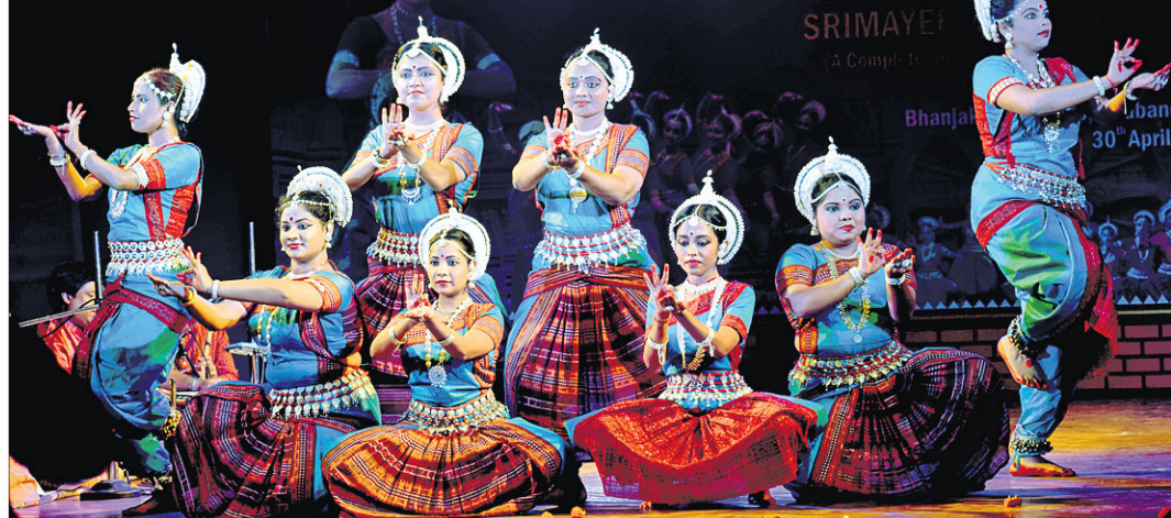
ଭୁବନେଶ୍ୱର ଭଜନମାଳା ମଣ୍ଡପରେ ମଙ୍ଗଳାବାର ଅନୁଷ୍ଠିତ ଶ୍ରୀମତୀ ନୃତ୍ୟ ଅନୁଷ୍ଠାନର ବାର୍ଷିକ ଉତ୍ସବରେ ନୃତ୍ୟଶିଳ୍ପୀମାନେ ଓଡ଼ିଶା ପରିବେଷଣ କରୁଛନ୍ତି।