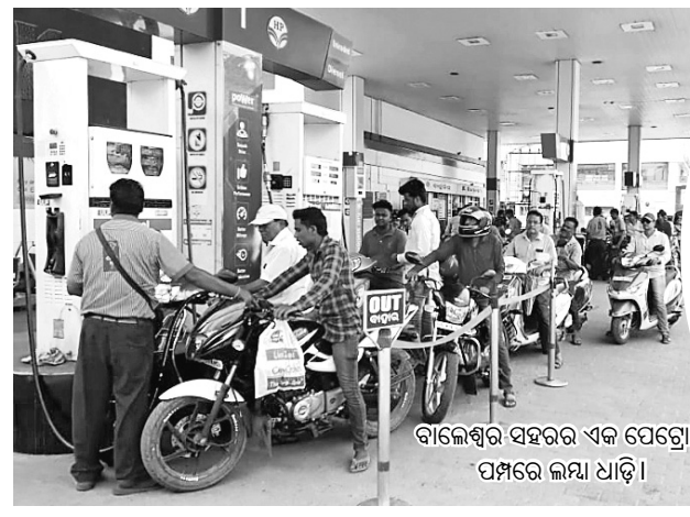
ବାଲେଶ୍ୱର ସହରର ଏକ ପେଟ୍ରୋଲ ପମ୍ପରେ ଲକ୍ଷ୍ୟ ଧାଡ଼ି ।