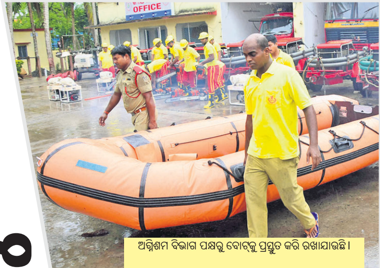
ଅଗ୍ନିଶମ ବିଭାଗ ପକ୍ଷରୁ ବୋର୍ଡ଼ ପ୍ରସ୍ତୁତ କରି ରଖାଯାଇଛି ।

୩୦ ବର୍ଷ ପରେ ଅସମୟରେ ପୁଣି ଥରେ ବାତ୍ୟାର କରାଳ ରୂପ ଦେଖିବାକୁ ଯାଉଛନ୍ତି ରାଜ୍ୟବାସୀ। ବାତ୍ୟା ‘ଫନା’ ଉପକୂଳ ଓଡ଼ିଶାର ପୁରୀ ନିକଟରେ ଶୁକ୍ରବାର ପୂର୍ବାହ୍ନରେ ସ୍ଥଳଭାଗ ଛୁଇଁବ ବୋଲି ପାଣିପାଗ ବିଭାଗ ପକ୍ଷରୁ ଅନୁମାନ କରାଯାଇଛି। ଏଥିପାଇଁ ଲୋକଙ୍କ ମନରେ ଭୟ ସୃଷ୍ଟି ହୋଇଛି। ଅପରପକ୍ଷରେ ବାତ୍ୟାକୁ ମୁକାବିଲା କରିବା ସହ ଜିରୋ କାନ୍ଥୁଆଲ୍ଡି ଉପରେ ସରକାର ଗୁରୁତ୍ୱ ଦେଇଛନ୍ତି। ତଳିଆ ଅଞ୍ଚଳରେ ରହୁଥିବା ଲକ୍ଷାଧିକ ଲୋକଙ୍କୁ ଉଦ୍ଧାର କରିବା ସହ ସେମାନଙ୍କୁ ସୁରକ୍ଷିତ ସ୍ଥାନକୁ ସ୍ଥାନାନ୍ତର କରାଯାଇଛି । ଏପରିକି ବାତ୍ୟା ପ୍ରଭାବିତ ଲୋକଙ୍କ ନିକଟରେ ରିଲିୟଫ୍ ଯେପରି ଠିକ୍ରେ ପହଞ୍ଚିପାରିବ ସେଥିପାଇଁ ସବୁ ପ୍ରକାର ବ୍ୟବସ୍ଥା କରାଯାଇଛି। ବାତ୍ୟାକୁ ନେଇ ଲୋକମାନେ ଭୟ ନ କରିବାକୁ ସରକାର ନିବେଦନ କରିଛନ୍ତି ।