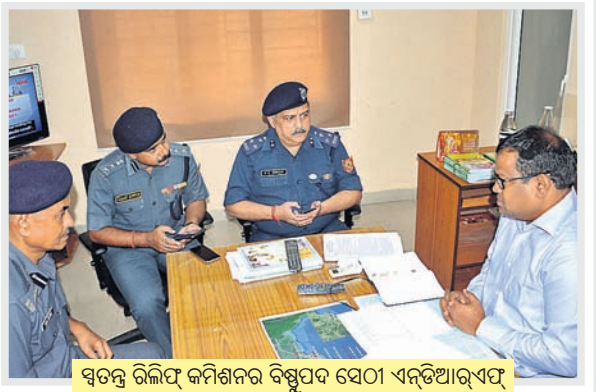
ସ୍ୱତନ୍ତ୍ର ରିଲିୟଫ୍ କମିଶନର ବିଷୁପଦ ସେଠା ଏନ୍ଡିଆରୁଏଟ୍ ଅଧିକାରୀଙ୍କ ସହ ଆଲୋଚନା କରୁଛନ୍ତି ।