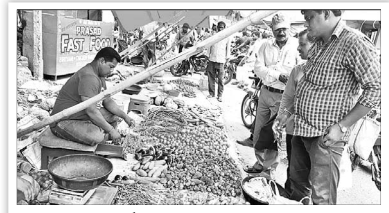
'ଫନା' ଭୟରେ ଲୋକେ ମାଟିରୁ ପନିପରିବା କିଣୁଛନ୍ତି ।

ଓପିଏ, ୨୫(ଡି.ଏନ୍.ଏ.) ଓପିଏ ବ୍ଲକ ପ୍ରଶାସନ ତରଫରୁ ମହାବାତ୍ୟା 'ଫନା' ମୁକାବିଲା ପାଇଁ ସମସ୍ୟ ପଦକ୍ଷେପ ଗ୍ରହଣ କରାଯାଇଛି । ଗୁରୁତ୍ୱପୂର୍ଣ୍ଣ ପ୍ରଶାସନ ତରଫରୁ ଡାକବାଜି ଯନ୍ତ୍ରରେ ପ୍ରତି ପଞ୍ଚାୟତର ସବୁ ଗାଁରେ ମାଟି ଓ ନଡ଼ାଛପର ଘରେ ଲୋକେ ନ ରହି ବାତ୍ୟା ଆଶ୍ରୟସ୍ଥଳ ତଥା ନିକଟସ୍ଥ ସ୍କୁଲ ପକାଇବାକୁ ଚାଲି ଆସିବାକୁ ଲୋକଙ୍କୁ ପରାମର୍ଶ ଦିଆଯାଇଛି । ସେଠାରେ ପ୍ରଶାସନ ତରଫରୁ ଖାଦ୍ୟ ପାନୀୟର ବ୍ୟବସ୍ଥା କରାଯାଇଥିବା ସୂଚନା ମିଳିଛି । ଓପିଏ ତହସିଲ କାର୍ଯ୍ୟାଳୟରେ ତହସିଲଦାର ତଥା ବିତ୍ତ ଓ ପାଟାୟର ଭୋଇ ବିଭାଗୀୟ କର୍ମକର୍ତ୍ତା ଓ କର୍ମଚାରୀମାନଙ୍କର ଜରୁରିକାଳୀନ ବୈଠକ ଡାକି ପରିସ୍ଥିତି ମୁକାବିଲା ପାଇଁ ବିଭିନ୍ନ ପଦକ୍ଷେପ ନେଇଛନ୍ତି । ଆଦିବାସୀ ଅଧିକାରୀ ଗଡ଼ସାହି ପଞ୍ଚାୟତର ପଶୁଆ ପଥରପଦାର ମାଲିକିଆ ସମ୍ପ୍ରଦାୟ ତରଫରୁ ପ୍ରତ୍ୟାପତ୍ତ ହରିଜନସାହି ସମେତ ବିଭିନ୍ନ ପଞ୍ଚାୟତର ମାଟି ଛଗଛପର ଘର ଲୋକମାନଙ୍କୁ ସ୍ଥାନାନ୍ତରିତ କରିବା ସହ ନିରାପଦ ବାତ୍ୟା ଆଶ୍ରୟସ୍ଥଳକୁ ଅଣାଯିବାକୁ ପ୍ରଶାସନ ତରଫରୁ ପଦକ୍ଷେପ ନିଆଯାଇଛି ବୋଲି ସୂଚନା ମିଳିଛି ।