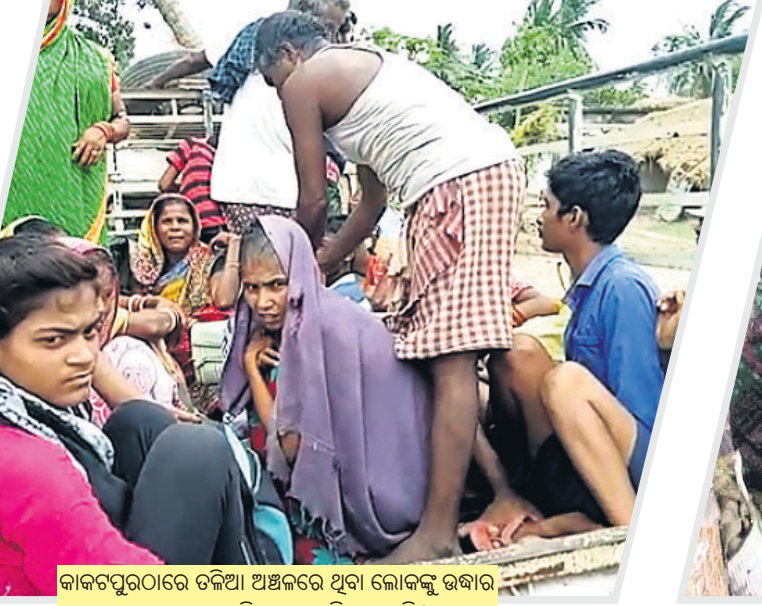
କାକଟପୁରଠାରେ ତଳିଆ ଅଞ୍ଚଳରେ ଥିବା ଲୋକଙ୍କୁ ଉଦ୍ଧାର କରାଯାଇ ସୁରକ୍ଷିତ ସ୍ଥାନକୁ ନିଆଯାଇଛି ।