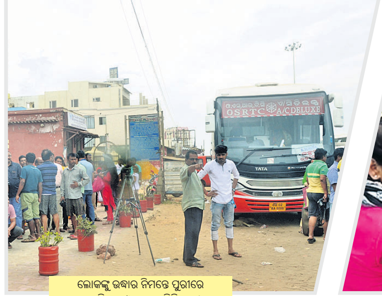
ଲୋକଙ୍କୁ ଉଦ୍ଧାର ନିମନ୍ତେ ପୁରୀରେ ପହଞ୍ଚିଥିବା ଓଏସ୍ଆର୍ଟିସି ବସ ।