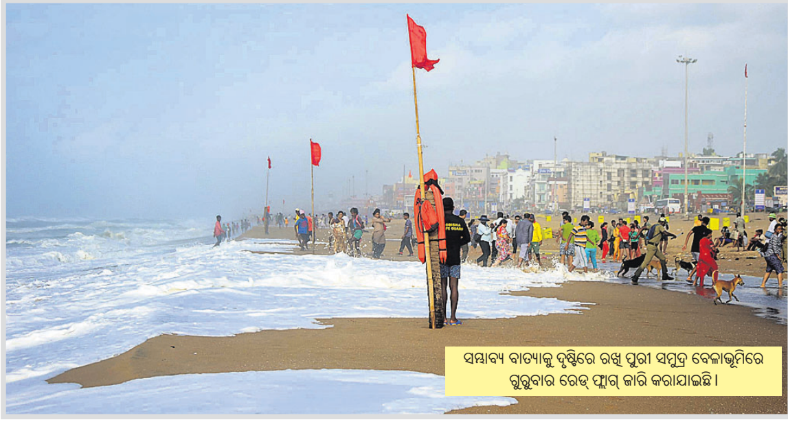
ସମ୍ଭାବ୍ୟ ବାତ୍ୟାକୁ ଦୃଷ୍ଟିରେ ରଖି ପୁରୀ ସମୁଦ୍ର ବେଳାଭୂମିରେ ଗୁରୁବାର ରେଡ୍ ଫ୍ଲାଗ୍ କାନ୍ଦି କରାଯାଇଛି ।