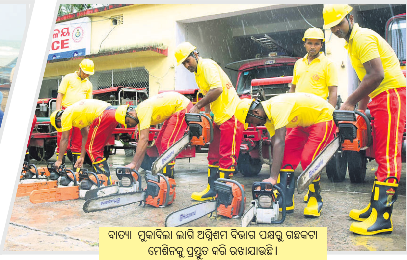
ବାତ୍ୟା ମୁକାବିଲା ଲାଗି ଅଗ୍ନିଶମ ବିଭାଗ ପକ୍ଷରୁ ଗଛକଟା ମେଶିନକୁ ପ୍ରସ୍ତୁତ କରି ରଖାଯାଇଛି ।