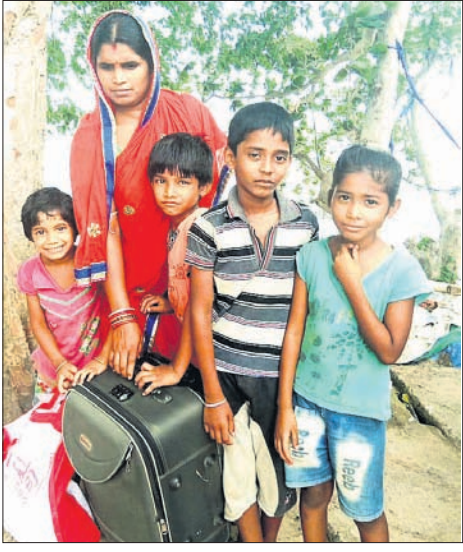
ଏକ ପରିବାରକୁ ସୁରକ୍ଷିତ ସ୍ଥାନକୁ ଅଣାଯାଇଛି।