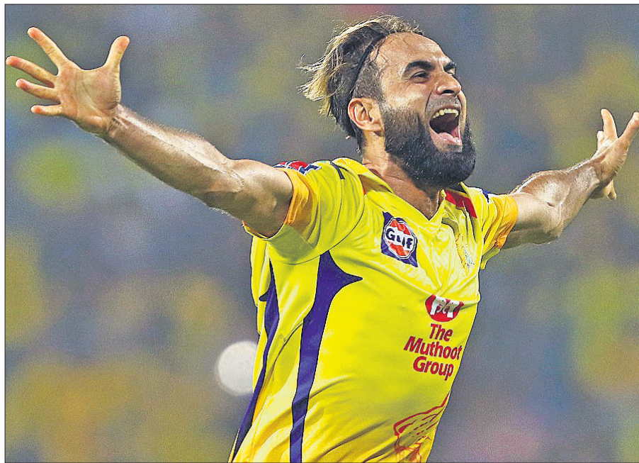
ଉଇକେଟ ହାସଲ ପରେ ଇମ୍ରାନ ତାହିରଙ୍କ ସେଲିବ୍ରେଶନ ।

ସ୍ଥାନୀୟ ଚେପକ୍ ଷ୍ଟାଡ଼ିୟମରେ ବୁଧବାର ଖେଳାଯାଇଥିବା ଇଣ୍ଡିଆନ ପ୍ରିମିୟର ଲିଗ୍ (ଆଇପିଏଲ)ର ୫୦ତମ ମ୍ୟାଚରେ ମହେନ୍ଦ୍ର ସିଂ ଧୋନୀଙ୍କ ନେତୃତ୍ଵାଧୀନ ଚେନ୍ନାଇ ପୁଅର କିଙ୍ଗ୍ ୮୦ ରନରେ ଦିଲ୍ଲୀ କ୍ୟାପିଟାଲ୍‌ସ୍କୁ ହରାଇଛି । ଚମ୍ପ ହାରି ବ୍ୟାଟିଂ ପାଇଁ ଆମନ୍ତ୍ରଣ ପାଇଥିବା ଚେନ୍ନାଇ ୪ ଉଇକେଟ ହରାଇ ୧୭୯ ରନ କରିଥିଲା । ଜବାବରେ ଦିଲ୍ଲୀ ୧୭.୨ ଓଭରରେ ୯୯ ରନ କରି ଅଲଆଉଟ ହେବା ସହ ଆତ୍ମସମର୍ପଣ କରିଥିଲା । ମାତ୍ର ୨୨ ବଲ୍‌ରୁ ୪ ଚୋକା ଓ ୩ ଛକା ସହ ଅପରାଜିତ ୪୪ ରନ କରିଥିବା ଧୋନୀ ମ୍ୟାଚ୍ ଅଫ୍ ଦି ମ୍ୟାଚ୍ ବିବେଚିତ ହୋଇଥିଲେ । ଏହି ବିଜୟ ସହ ଚେନ୍ନାଇ ଏପର୍ଯ୍ୟନ୍ତ ୧୩ଟି ମ୍ୟାଚ୍ ଖେଳି ୯ଟି ବିଜୟ ଓ ୪ଟି ପରାଜୟ ସହ ମୋଟ ୧୮ ପଏଣ୍ଟ ପାଇ ତାଲିକାର ଶୀର୍ଷରେ ରହିଛି । ଅନ୍ୟପଟେ ଦିଲ୍ଲୀ କ୍ୟାପିଟାଲ୍ ୧୩ ମ୍ୟାଚ୍‌ରୁ ୮ ବିଜୟ ଓ ୫ ପରାଜୟ ସହ ୧୬ ପଏଣ୍ଟ ପାଇ ଦ୍ଵିତୀୟ ସ୍ଥାନରେ ରହିଛି ।