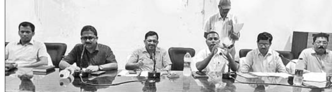
ପ୍ରଶାସନ ପ୍ରସ୍ତୁତି ବୈଠକରେ ଉପସ୍ଥିତ ଅଧିକାରୀ । ବାଲେଶ୍ୱର ଅଫିସ୍, ୨୫