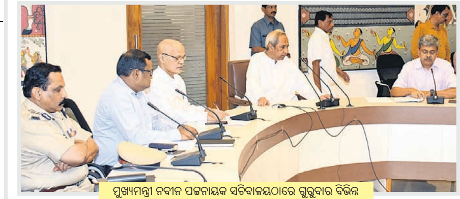
ପୂର୍ଣ୍ଣାମନ୍ତ୍ରୀ ନବୀନ ପଟ୍ଟନାୟକ ସଚିବାଳୟରେ ଗୁରୁବାର ବିଭିନ୍ନ ବିଭାଗୀୟ ସଚିବଙ୍କ ସହ ବାତ୍ୟା ସମ୍ପର୍କରେ ଆଲୋଚନା କରୁଛନ୍ତି ।