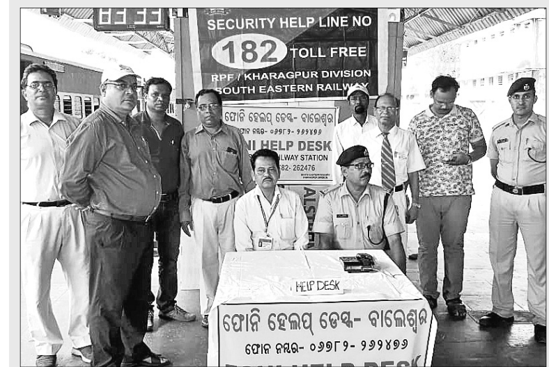
ବାଲେଶ୍ୱର ରେଳଷ୍ଟେଶନ ପରିସରରେ ଖୋଲାଯାଇଥିବା ହେଲ୍ପ ଡେସ୍ ।