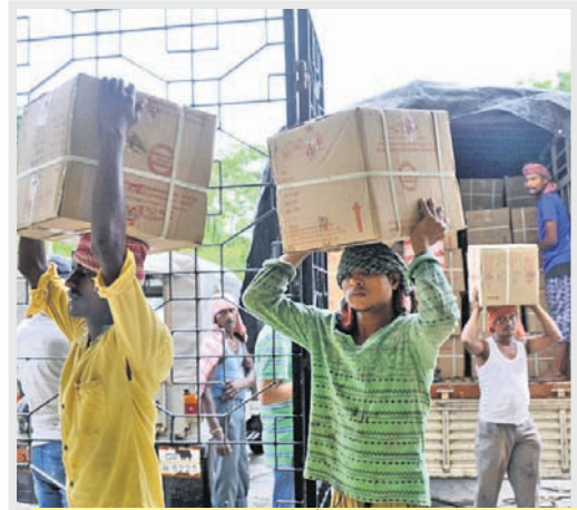
ବାତ୍ୟା ପ୍ରଭାବିତ ଲୋକଙ୍କ ପାଇଁ ଆସିଥିବା ରିଲିୟଫ୍ ସାମଗ୍ରୀକୁ ଭୁବନେଶ୍ୱର କଳିଙ୍ଗ ଷ୍ଟାଡ଼ିୟମ ପରିସରରେ ରଖାଯାଇଛି ।