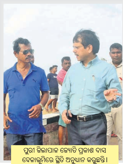
ପୁରୀ ଜିଲ୍ଲାପାଳ ଜ୍ୟୋତି ପ୍ରକାଶ ଦାସ ବେଳାଭୂମିରେ ସ୍ଥିତି ଅନୁଧ୍ୟାନ କରୁଛନ୍ତି ।