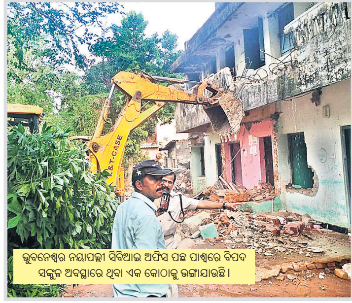
ଭୁବନେଶ୍ୱର ନୟାପଲ୍ଲୀ ସିବିଆଇ ଅଫିସ ପଛ ପାଖରେ ବିପଦ ସଙ୍କଳ୍ପ ଅବସ୍ଥାରେ ଥିବା ଏକ କୋଠାକୁ ଭଙ୍ଗାଯାଇଛି ।