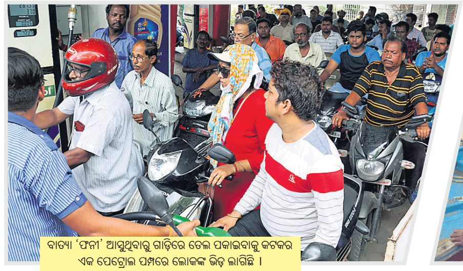
ବାତ୍ୟା ‘ଫନା’ ଆସୁଥିବାରୁ ଗାଡ଼ିରେ ତେଲ ପକାଇବାକୁ କଟକର ଏକ ପେଟ୍ରୋଲ ପମ୍ପରେ ଲୋକଙ୍କ ଭିଡ଼ ଲାଗିଛି ।