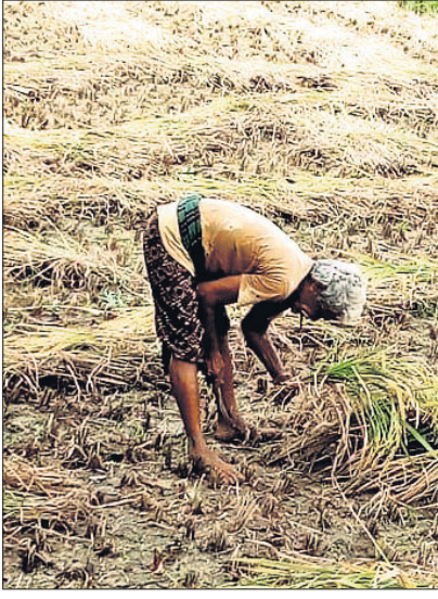
ତରବରିଆ ଭାବେ ଜଣେ ଗାଈ ଧାନ କାଟୁଛନ୍ତି।

ଭଦ୍ରକ ଅଫିସ, ୨୧୫ : ଭଦ୍ରକ ଜିଲ୍ଲା ପ୍ରଶାସନ ପକ୍ଷରୁ ୨୪ ଘଣ୍ଟିଆ କଣ୍ଠୋଳରୁମ୍ ଖୋଲାଯାଇଛି। ଜିଲ୍ଲା ଜରୁରିକାଳୀନ ବିଭାଗ ପକ୍ଷରୁ ୦୬୭୮୪ ୨୫୧ ୮୮୧ ନମ୍ବର ସହ ୧୦୭୭ ଟୋଲ୍‌ଫ୍ରି ନମ୍ବର କାରି କରାଯାଇଛି। ଫନୀ ସମ୍ପର୍କିତ ସୂଚନା ଓ ଅତ୍ୟାବଶ୍ୟକ ସହାୟତା ପାଇଁ ଏହି ନମ୍ବର କାରି କରାଯାଇଥିବା ଜିଲ୍ଲା ଜରୁରିକାଳୀନ ଅଧିକାରୀ ଜୟଶ୍ରୀ ସେନାପତି ସୂଚନା ଦେଇଛନ୍ତି।