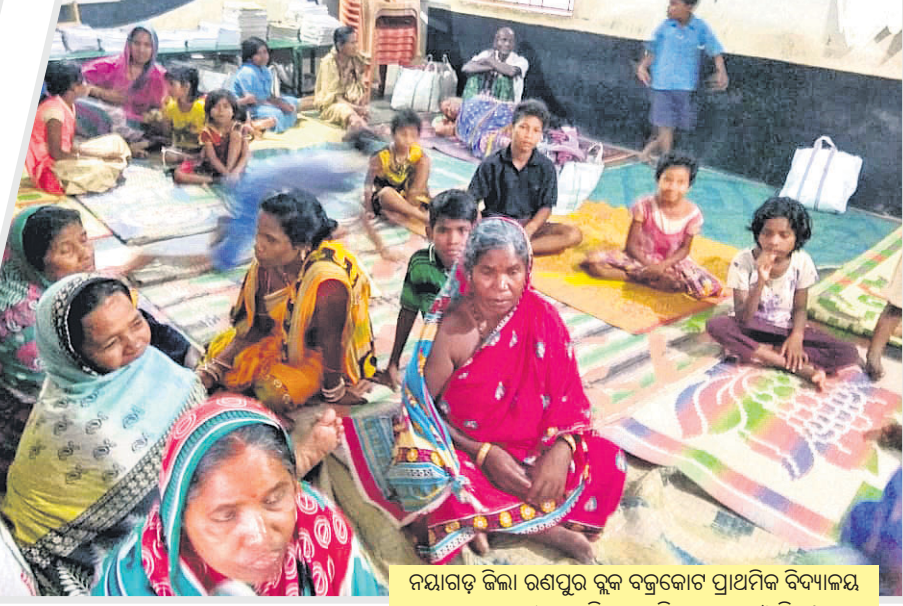
ନୟାଗଡ଼ ଜିଲ୍ଲା ରଣପୁର ବ୍ଲକ୍ ବଜ୍ରକୋଟ ପ୍ରାଥମିକ ବିଦ୍ୟାଳୟ ଆଶ୍ରୟସ୍ଥଳୀରେ ରହିଥିବା ମହିଳା, ପୁରୁଷ ଓ ଶିଶୁ ।