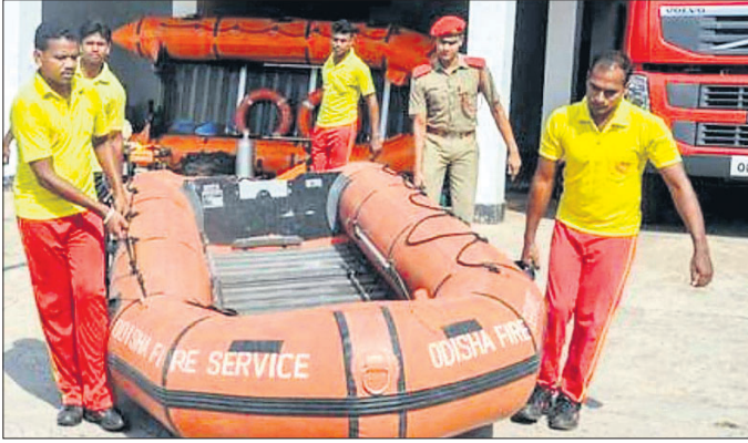
ମୋଟର ବୋଟ ସହ ଅଭିଗମ କର୍ମଚାରୀ।