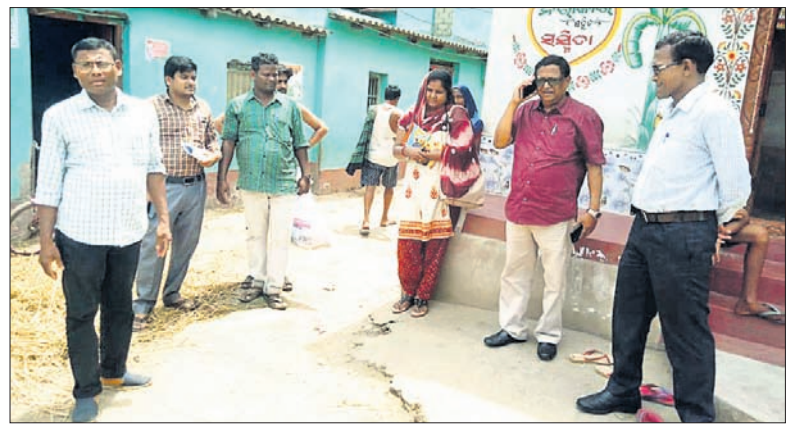
ବୌଲତପୁର ଗାଁରେ ସିଟିଏମ୍‌ଓଙ୍କ ସମେତ ଡାକ୍ତରୀ ଟିମ୍।