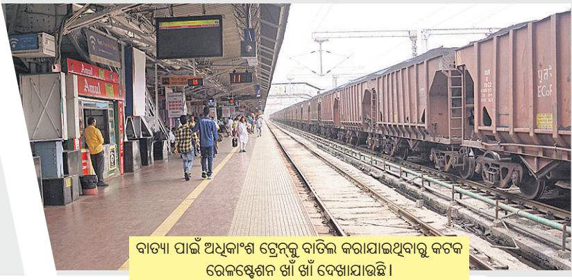
ବାତ୍ୟା ପାଇଁ ଅଧିକାଂଶ ଟ୍ରେନ୍କୁ ବାତିଲ କରାଯାଇଥିବାରୁ କଟକ ରେଳଷ୍ଟେଶନ ଖାଁ ଖାଁ ଦେଖାଯାଇଛି ।