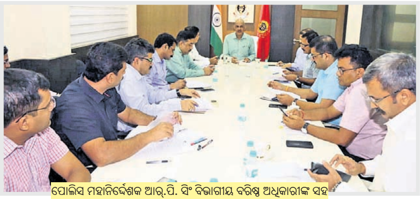
ପୋଲିସ ମହାନିର୍ଦ୍ଦେଶକ ଆର୍.ପି. ସିଂ ବିଭାଗୀୟ ବରିଷ୍ଠ ଅଧିକାରୀଙ୍କ ସହ ବାତ୍ୟା ମୁକାବିଲା ନେଇ ଆଲୋଚନା କରୁଛନ୍ତି ।