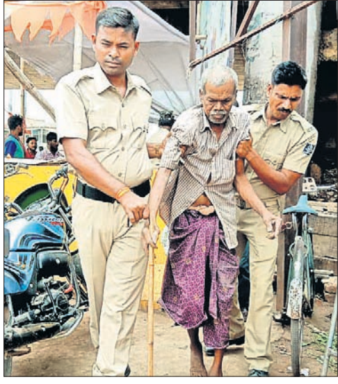
ଜଣେ ଅସହାୟ ବୃଦ୍ଧଙ୍କୁ ବନ୍ଦ ଛକକୁ ନିଆଯାଇଛି।