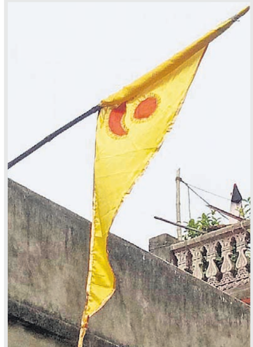
ଗୁରୁବାର ସକାଳେ ନୀଳଗିରିରେ ଲାଗିଥିବା ବାମା ଉଡ଼ିଯାଇ ସ୍ଥାନୀୟ ବାସକାରଙ୍କର ଏକ କୋଠାରେ ଲାଗିଛି ।