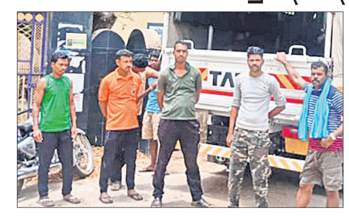
ଭଞ୍ଜପୋଖରୀରେ ଓଡ୍ରାଫ୍ ଟିମ୍ ପହଞ୍ଚିଛି।