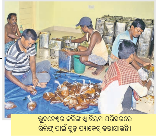
ଭୁବନେଶ୍ୱର କଳିଙ୍ଗ ଷ୍ଟାଡ଼ିୟମ ପରିସରରେ ରିଲିୟଫ୍ ପାଇଁ ଗୁଡ଼ ପ୍ୟାକେଟ୍ କରାଯାଇଛି ।