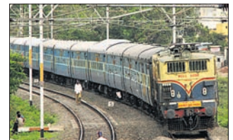
ସିକନ୍ଦରାବାଦ-କାମାକ୍ଷା, ସାନ୍ତାଗାଢ଼ି- ଚେନାଇ ରହିଛି। ସେହିଭଳି ଦିଗ ପରିବର୍ତ୍ତନ ହୋଇଥିବା ଟ୍ରେନଗୁଡ଼ିକ ମଧ୍ୟରେ ଅନୁପୁର-ବିଶାଖାପାଟଣା ହାରାକୁଦ ଏକ୍ସପ୍ରେସ୍, ବିଶାଖାପାଟଣା- ଅନୁପୁର ହାରାକୁଦ ଏକ୍ସପ୍ରେସ୍ ଏବଂ ରୁଆହାଡି-କୁରୁଭେଲି ସ୍ୱତନ୍ତ୍ର ଭଳି ଟ୍ରେନ ରହିଛି। ଟ୍ରେନଟାଉନ ଭ୍ୟାନ ଏବଂ ସ୍ୱତନ୍ତ୍ର ରିଲିଫ ଟ୍ରେନକୁ ମଧ୍ୟ ପ୍ରସ୍ତୁତ ରଖାଯାଇଥିବା ପୂର୍ବତନ ରେକର୍ଡ଼ ପକ୍ଷରୁ ପ୍ରକାଶ। ପୁରୀଠାରୁ ସ୍ୱତନ୍ତ୍ର ଟ୍ରେନ ଯାତ୍ରୀଙ୍କୁ ହୁରିଆ ଲାଗି ପୁରୀଠାରୁ ୩ ସ୍ୱତନ୍ତ୍ର ଟ୍ରେନ ଚଳାଚଳ ଲାଗି ନିଷ୍ପତ୍ତି ହୋଇଛି। ବିଶେଷ କରି ପର୍ଯ୍ୟଟକ ଏବଂ ଛାତ୍ରୀଛାତ୍ରଙ୍କ ଲାଗି ହାଓଡ଼ା ଅଭିଯୁକ୍ତ ପ୍ରଥମ ସ୍ୱତନ୍ତ୍ର ଟ୍ରେନ ପୁରୀରୁ ଗୁରୁବାର ଅପରାହ୍ନ ୧.୩୦ ଏବଂ ବିତୀୟ ସ୍ୱତନ୍ତ୍ର ଟ୍ରେନ ୩ଟା ଏବଂ ଅନ୍ୟତ ୪ଟାରେ ଚଳାଚଳ ନିଷ୍ପତ୍ତି ହୋଇଛି।

ବାତ୍ୟା ‘ଫନୀ’ର ପ୍ରଭାବରେ ରାଜ୍ୟରେ ଟ୍ରେନ ଚଳାଚଳ ପ୍ରଭାବିତ ହୋଇଛି। ଏହାର ପ୍ରଭାବକୁ ନଜରରେ ରଖି ୧୪୦ ଟ୍ରେନ ବାତିଲ କରାଯାଇଥିବା ସୂଚନା ରେକର୍ଡ଼ ପକ୍ଷରୁ ସୂଚନା ରହିଛି। ମେ ୨ ସନ୍ଧ୍ୟାଠାରୁ ହାଓଡ଼ା-ଚେନାଇ ମେନ୍ ଲାଇନ୍‌ର ଭଦ୍ରକ- ବିଜୟନଗର ମଧ୍ୟରେ ଟ୍ରେନ ସେବା ବନ୍ଦ ରହିବ ବୋଲି ପୂର୍ବତନ ରେକର୍ଡ଼ ପକ୍ଷରୁ କୁହାଯାଇଛି। ସେହିଭଳି ଭୁବନେଶ୍ୱର ଏବଂ ପୁରୀଠାରୁ ଟ୍ରେନ ସେବାକୁ ନିୟନ୍ତ୍ରିତ କରାଯାଇଛି। ଏହି ସମୟରେ ହାଓଡ଼ା- ବାଙ୍ଗାଲୋର, ବିଜୟନଗର ଏବଂ ଚେନାଇ ଅଭିଯୁକ୍ତ ଯାତ୍ରୀଙ୍କୁ ଟ୍ରେନଗୁଡ଼ିକୁ ବାତିଲ କରାଯାଇଛି। ପୂର୍ବତନ ରେକର୍ଡ଼ ପକ୍ଷରୁ ମେ ୧୪୦ ଟ୍ରେନ ମେ ୨ ଏବଂ ୩ ଏବଂ ୪ ତାରିଖରେ ବାତିଲ ରହିଥିବା ଜଣାପଡ଼ିଛି। ପରିସ୍ଥିତିରେ ସମାପ୍ତ ପରେ ପୂର୍ବତନ ରେକର୍ଡ଼ ପକ୍ଷରୁ ଆଉ କିଛି ଟ୍ରେନକୁ ବାତିଲ କରାଯାଇଥିବା ବେଳେ ୯ଟି ଗଡ଼ିପଥ ପରିବର୍ତ୍ତନ ଏବଂ ୪ଟିକୁ ସାମୟିକ ବାତିଲ କରାଯାଇଛି। ଏହି ଟ୍ରେନଗୁଡ଼ିକ ମଧ୍ୟରେ ବାଲିଶିପୋଷି- ଭୁବନେଶ୍ୱର, ରାଉରକେଲା-ରୁଣ୍ଡାପୁର, ସିକନ୍ଦରାବାଦ-କାମାକ୍ଷା, ସାନ୍ତାଗାଢ଼ି- ଚେନାଇ ରହିଛି। ସେହିଭଳି ଦିଗ ପରିବର୍ତ୍ତନ ହୋଇଥିବା ଟ୍ରେନଗୁଡ଼ିକ ମଧ୍ୟରେ ଅନୁପୁର-ବିଶାଖାପାଟଣା ହାରାକୁଦ ଏକ୍ସପ୍ରେସ୍, ବିଶାଖାପାଟଣା- ଅନୁପୁର ହାରାକୁଦ ଏକ୍ସପ୍ରେସ୍ ଏବଂ ରୁଆହାଡି-କୁରୁଭେଲି ସ୍ୱତନ୍ତ୍ର ଭଳି ଟ୍ରେନ ରହିଛି। ଟ୍ରେନଟାଉନ ଭ୍ୟାନ ଏବଂ ସ୍ୱତନ୍ତ୍ର ରିଲିଫ ଟ୍ରେନକୁ ମଧ୍ୟ ପ୍ରସ୍ତୁତ ରଖାଯାଇଥିବା ପୂର୍ବତନ ରେକର୍ଡ଼ ପକ୍ଷରୁ ପ୍ରକାଶ। ପୁରୀଠାରୁ ସ୍ୱତନ୍ତ୍ର ଟ୍ରେନ ଯାତ୍ରୀଙ୍କୁ ହୁରିଆ ଲାଗି ପୁରୀଠାରୁ ୩ ସ୍ୱତନ୍ତ୍ର ଟ୍ରେନ ଚଳାଚଳ ଲାଗି ନିଷ୍ପତ୍ତି ହୋଇଛି। ବିଶେଷ କରି ପର୍ଯ୍ୟଟକ ଏବଂ ଛାତ୍ରୀଛାତ୍ରଙ୍କ ଲାଗି ହାଓଡ଼ା ଅଭିଯୁକ୍ତ ପ୍ରଥମ ସ୍ୱତନ୍ତ୍ର ଟ୍ରେନ ପୁରୀରୁ ଗୁରୁବାର ଅପରାହ୍ନ ୧.୩୦ ଏବଂ ବିତୀୟ ସ୍ୱତନ୍ତ୍ର ଟ୍ରେନ ୩ଟା ଏବଂ ଅନ୍ୟତ ୪ଟାରେ ଚଳାଚଳ ନିଷ୍ପତ୍ତି ହୋଇଛି।