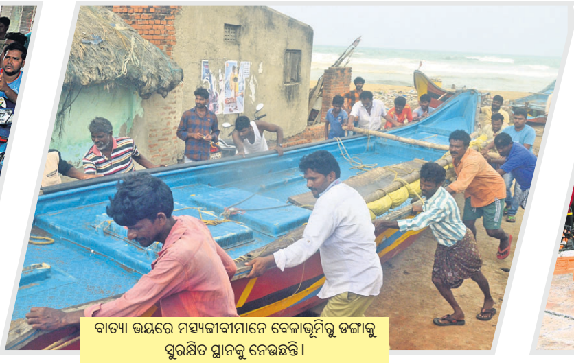
ବାତ୍ୟା ଭୟରେ ମାସ୍ୟକାବାସୀମାନେ ବେଳାଭୂମିରୁ ତଙ୍ଗାକୁ ସୁରକ୍ଷିତ ସ୍ଥାନକୁ ନେଇଛନ୍ତି ।