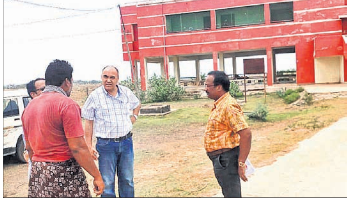
ପ୍ରଶାସନିକ ଅଧିକାରୀ ବାତ୍ୟା ଆଶ୍ରୟସ୍ଥଳୀ ବୁଲି ଦେଖୁଛନ୍ତି।